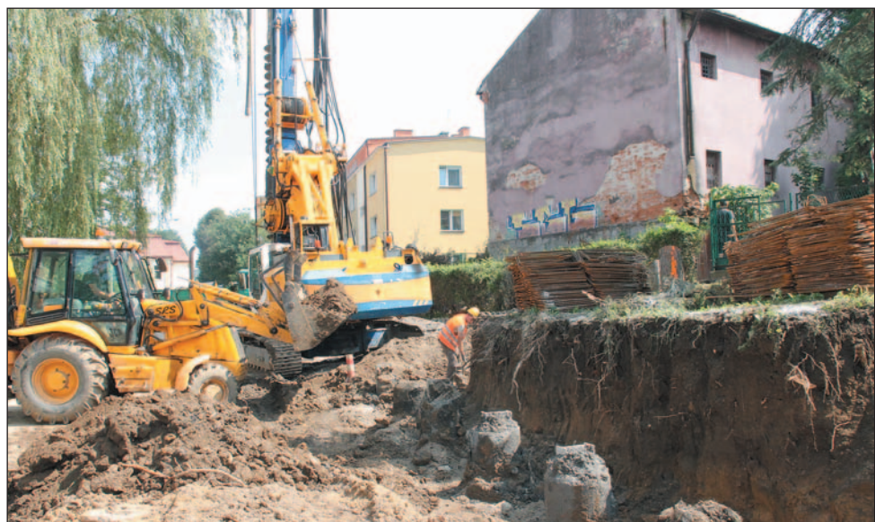
Zabezpieczenie osuwiska na Górze Parkowej od strony ulicy Szopena w sierpniu 2014 roku. Przemieszczające się masy ziemi wychyliły z pionu mury, ogrodzenia i drzewa, zagrażając Bursie Szkolnej i domom przy ulicy Emilii Plater.

Parkowej powstaną dwa rzędy konstrukcji oporowych; mur przy budynku handlowym zostanie dodatkowo zakotwiony w zboczu, a wody opadowe z powierzchni skarpy odprowadzone do istniejącej kanalizacji deszczowej. Wartość zadania opiewa na 1,2 mln zł, z czego 80 proc. pokryje dotacja z ministerstwa.