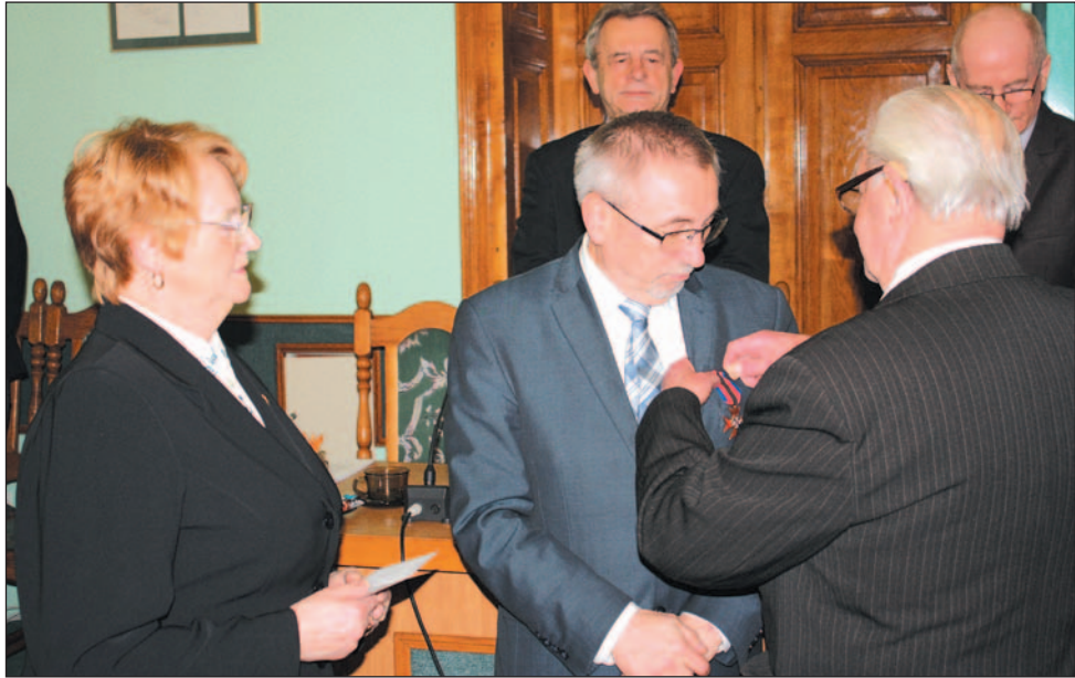
Jednym z pierwszych punktów sesji było wręczenie władzom „Krzyża 95-lecia” Związku Inwalidów Wojennych RP.

Mimo blisko 20 punktów programu, bardzo dynamiczny przebieg miała V Sesja Rady Miasta Sanoka – obrady zakończone zostały w dwie i pół godziny. Większość spraw przegłosowywano jednogłośnie, choć kilka razy zaiskrzyło, zwłaszcza przy powrotach do gorących tematów, o których pisaliśmy ostatnio.