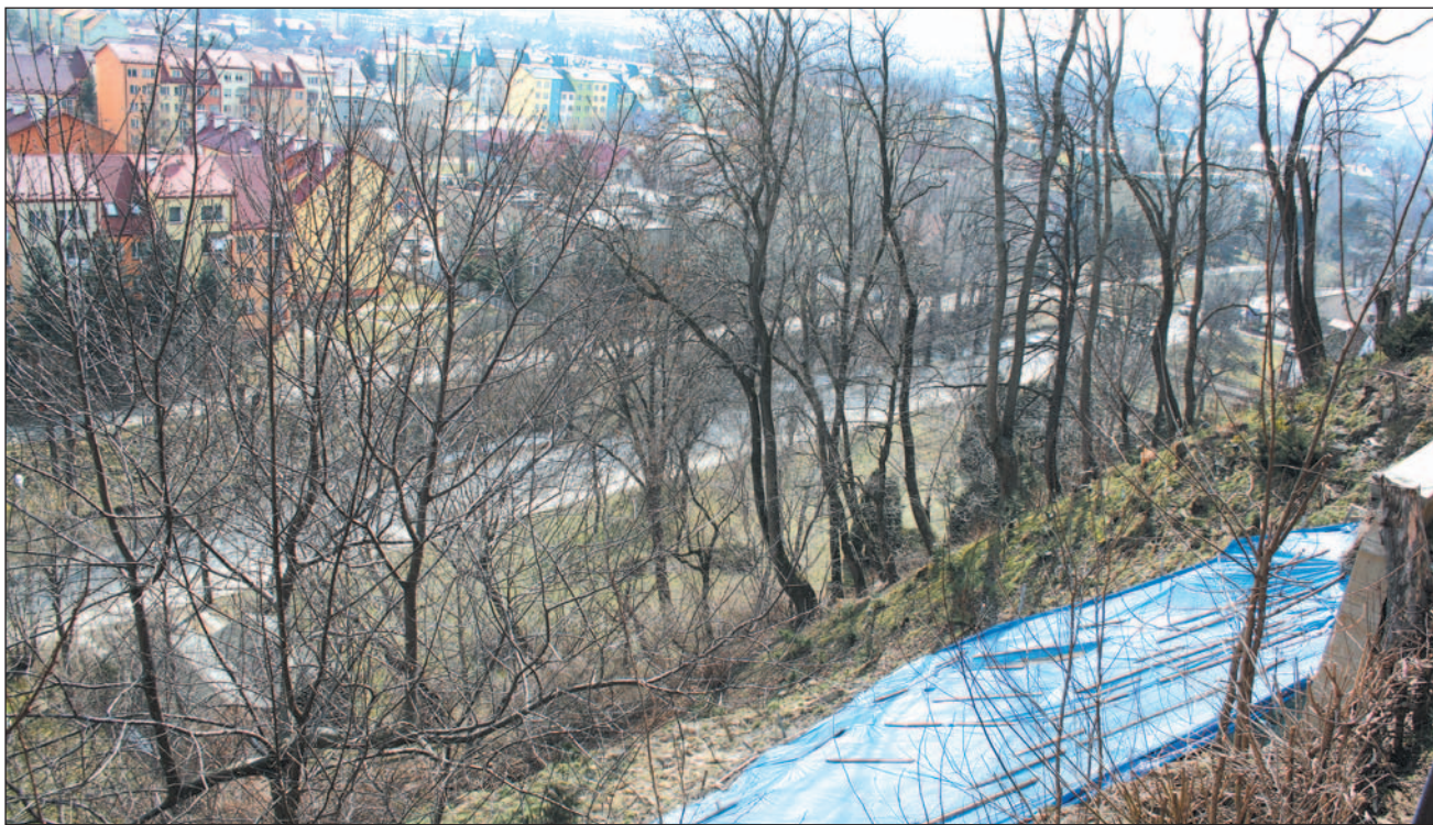
Osuwisko na skarpie wygląda „niewinnie”, ale specjaliści twierdzą, że jest nawet bardziej niebezpieczne niż to na Górze Parkowej. Jego zabezpieczenie będzie wyzwaniem od strony technicznej, nie mówiąc o kosztach.