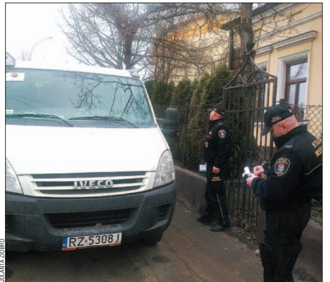
Na ulicy Daszyńskiego kierowcy w biały dzień łamią przepisy. Na zdjęciu – środowa interwencja Straży Miejskiej.

Komendant Straży Miejskiej Marek Przystasz zapewniał, że straż interweniowała. Budowlancy jednak, co wiedziało choćby w środę, niespecjalnie się tym przejęli – na chodniku stał cały sznur aut. Co prawda, dziennikarka „TS” była świadkiem energicznej interwencji: strażnicy odszukali kierowców i nakazali im zabranie samochodów, wręczając pouczenia, pytanie jednak, na ile działania te będą skuteczne? – Postój na chodniku jest wykroczeniem i nie będziemy tego tolerowali – deklarował z rozmową z „Tygodnikiem” komendant.