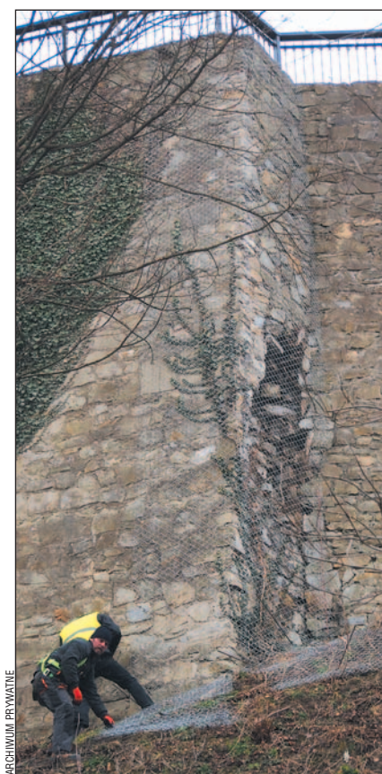
Zabezpieczanie kruszącego się muru zamkowego przy pomocy siatki.

W ubiegły piątek jeden z mieszkańców, widząc lecące z góry kamienie, zatrzymał jadący ulicą Podgórze radiowóz. Policjanci powiadomili Straż Miejską, a straż Sta-