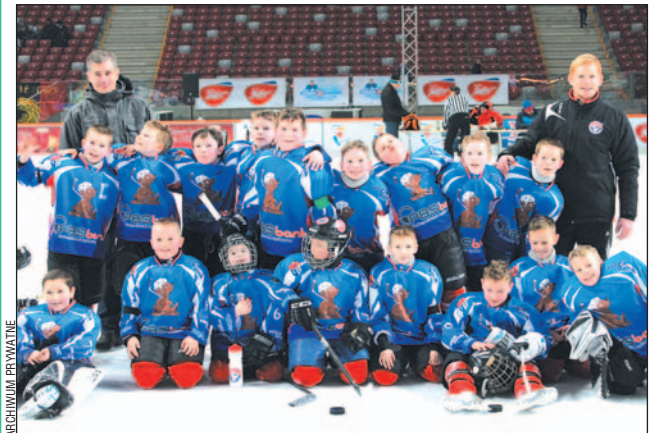
Wizyta w stolicy okazała się wielką przygodą.

Drużyna Niedźwiadków pięknie zaprezentowała się podczas I Ogólnopolskiego Turnieju Mini Hokeja – Czerkawski Cup na Stadionie Narodowym w Warszawie, zajmując 3. miejsce.