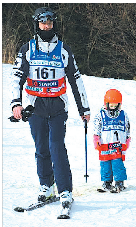
To były zawody dla dużych i małych.