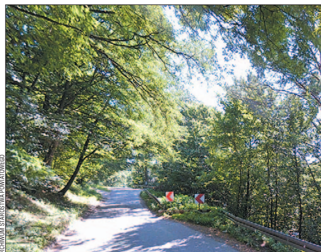
Osuwisko w Dębnej. Jego zabezpieczenie będzie kosztowało kilka milionów.

Odcinek nie będzie remontowany w tym miejscu, gdzie znajduje się osuwisko, gdyż powiat najpierw musi je zabezpieczyć, a dopiero potem naprawić zniszczoną jezdnię. – Droga na tym odcinku jest wygradzona i zwężona od kilku lat, jednak kładzenie nowej nakładki asfaltowej nie ma sensu, dopóki nie rozwiąże się zasadniczego problemu – tłumaczy przedstawiciel powiatu. Zabezpieczenie osuwiska to, bagatela, koszt przynajmniej kilku milionów złotych. – Na razie musimy opracować dokumentację budowlaną, co umożliwi nam pozyskanie wspomnianych 135,7 tys zł z budżetu ministra cyfryzacji i administracji – dopowiada Michał Cyran. Mając gotową dokumentację, będzie można rozpocząć starania o pieniądze ze źródeł zewnętrznych,