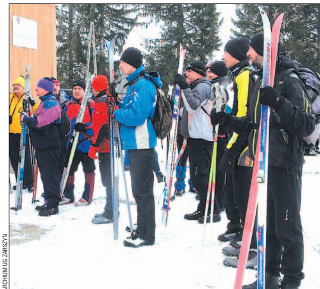
Ostatnie słowa podczas odprawy. Chwilę później narciarze ruszyli w trasę.

Około trzydziestu osób wzięło udział w V Beskidzkim Rajdzie Narciarskim „Śladami Dwóch Kardynałów” z Pastwisk do Komańczy. Tym razem jego uczestnicy podążyli nieco zmienioną trasą.