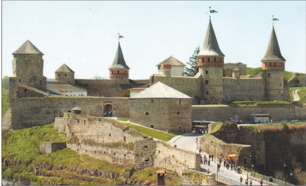
Urok Kresów. Kamieniec Podolski (na zdj.) nie przypadkowo jest partnerskim miastem Sanoka.

W polskiej mentalności słowo Kresy zajmuje niezwykle ważne miejsce. To z jednej strony zmitologizowany, utracony obszar, z milionami ludzi, którzy przez wieki współtworzyli niepowtarzalny klimat wielokulturowości, z drugiej heroiczna walka z nieustanną presją ze wschodu w postaci zagrożenia moskiewskiego, tureckiego, tatarskiego czy też kozackiego.