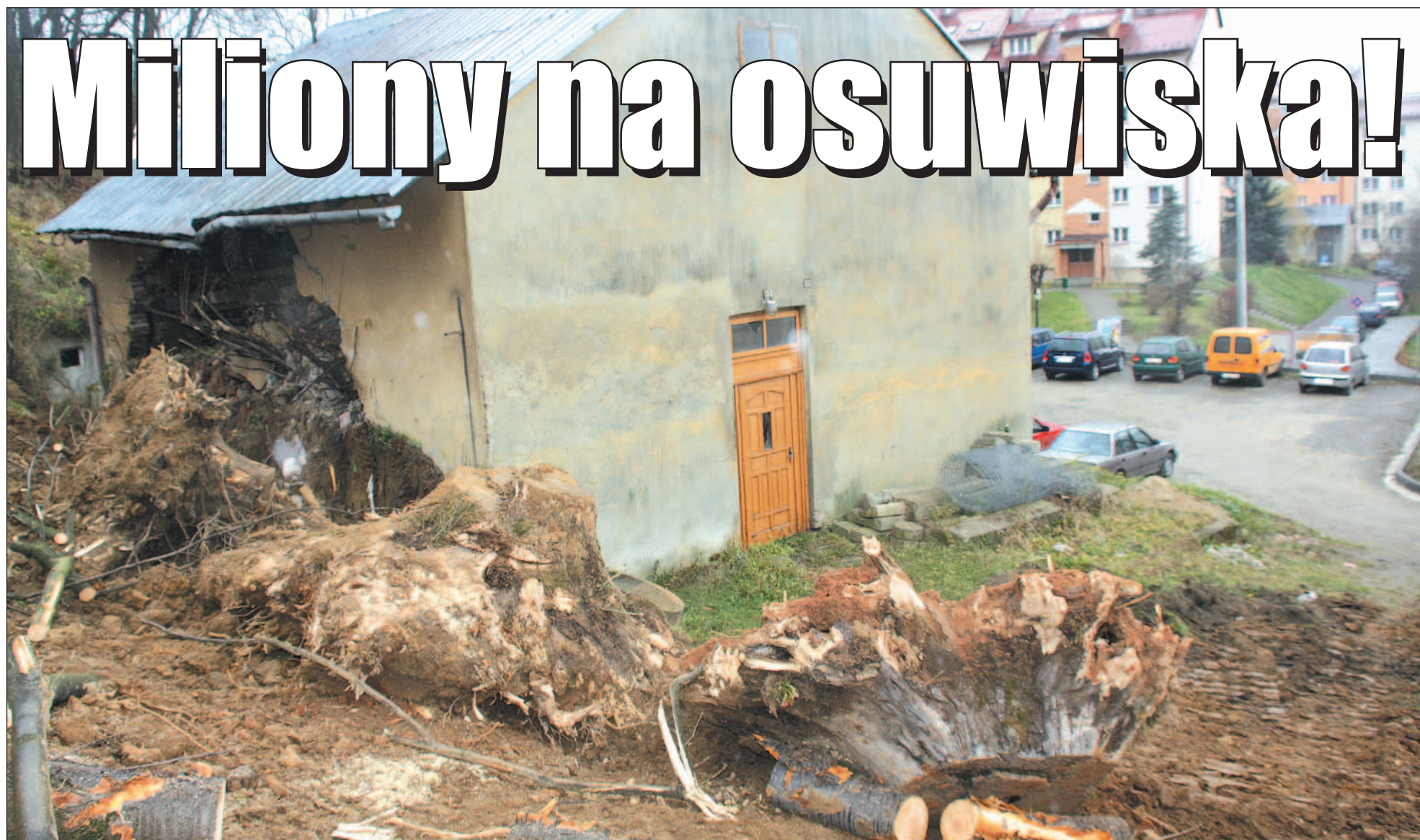
Niszczycielska siła żywiołu. Tak wyglądało osuwisko na Górze Parkowej podczas prac zabezpieczających w 2012 roku. Kiedy dwa lata wcześniej „ruszyły” masy ziemi, na szczęście doszło tylko do uszkodzenia niezamieszkałego budynku, na które zważyło się drzewo.

Mamy bardzo dobrą wiadomość: miasto uzyskało 3,6 mln zł na zabezpieczenie dwóch osuwisk: na skarpie przy Rynku oraz na Górze Parkowej. Gdyby – nie daj Boże – doszło do dalszego przemieszczenia mas ziemi, zagrożone byłyby znajdujące się w sąsiedztwie budynki.