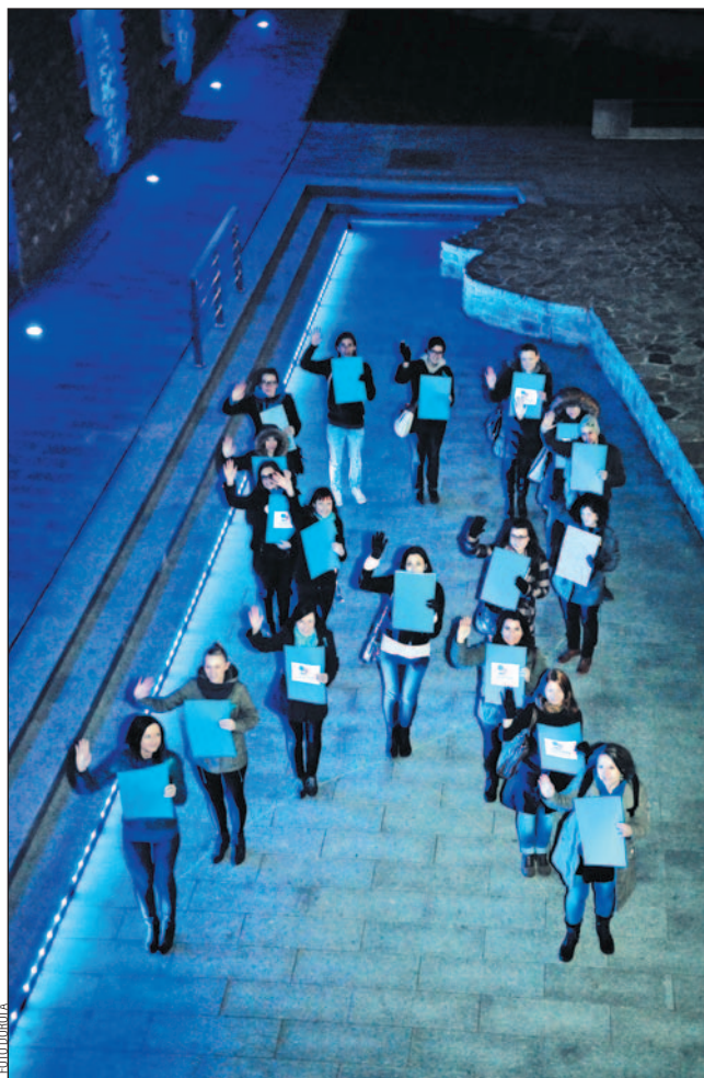
Żywa wstążka na Placu św. Michała