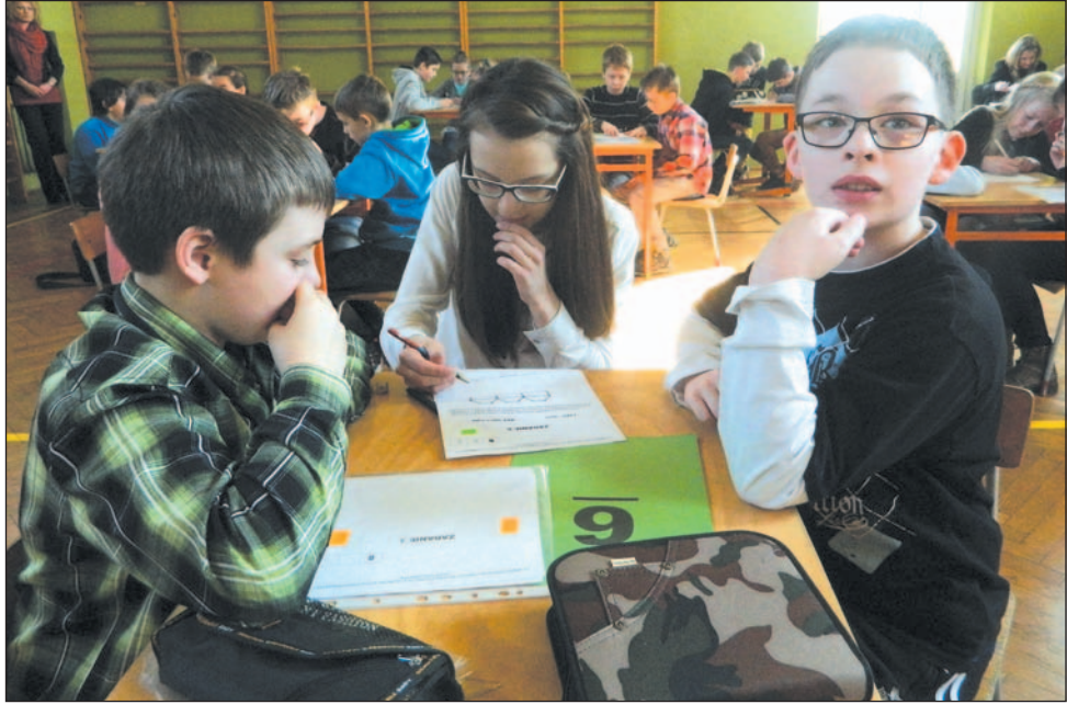
Młodzi „Supermatematycy” w akcji.

Rekordową frekwencję miał XII Konkurs „Supermatematyk”, jak co roku organizowany w Szkole Podstawowej nr 2. Startowali reprezentanci 17 placówek z Sanoka i okolic, w sumie do rywalizacji stanęło 64 uczniów. Drużynowo najlepsza okazała się Bórbka.