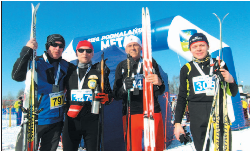
Narciarze Sanok Ski Team na starcie Biegu Podhalańskiego.

Biegacze narciarscy z naszego powiatu postanowili połączyć siły, zakładając nieformalny klub Sanok Ski Team. Za nimi pierwszy sezon wspólnych startów, okraszony kilkoma sukcesami podczas ogólnopolskich zawodów.