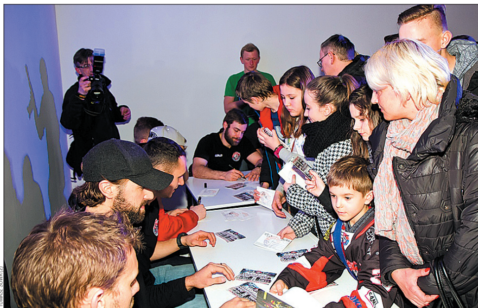
Na autografy polowały głównie dziewczyny.

Nie wszyscy chętni mogli te atrakcje obejrzeć, bo powierzchnia 7800 metrów kwadratowych