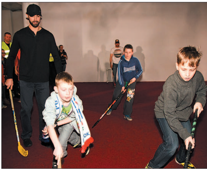
Chłopaki woleli zająć się czymś konkretnym...

Są jeszcze, tu i ówdzie, w sanockiej galerii elementy do poprawy – na przykład drzwi obrotowe od ulicy Jagiellońskiej, ale całość prezentuje się naprawdę nieźle. Wkrótce zazieleni się „orne” pole, sąsiadujące z budynkiem Galerii od strony miasta, oczy ostatecznie oswoją się z nową bryłą, wrośnie w przestrzeń, wtopi w otoczenie. I przestanie się kojarzyć z czymś odświętnym. Genius loci nie powinien z tego tytułu ucierpieć. FZ