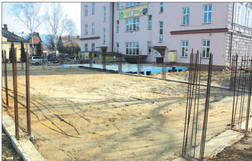
Fundamenty są już wylane, więc trudno sobie wyobrazić, by budowa sali przy G2 miała zostać przerwana. Wierzymy, że prace wkrótce zostaną wznowione.

Gimnazjum nr 2 wiele lat czekało na salę gimnastyczną z prawdziwego zdarzenia, tymczasem budowa została wstrzymana wkrótce po jej rozpoczęciu. Powodem jest upadłość Przedsiębiorstwa Budownictwa Komunalnego w Jasle, które prowadziło prace. Nie wiadomo, czy i kiedy inwestycja będzie kontynuowana. Decyzję podejmie syndyk.