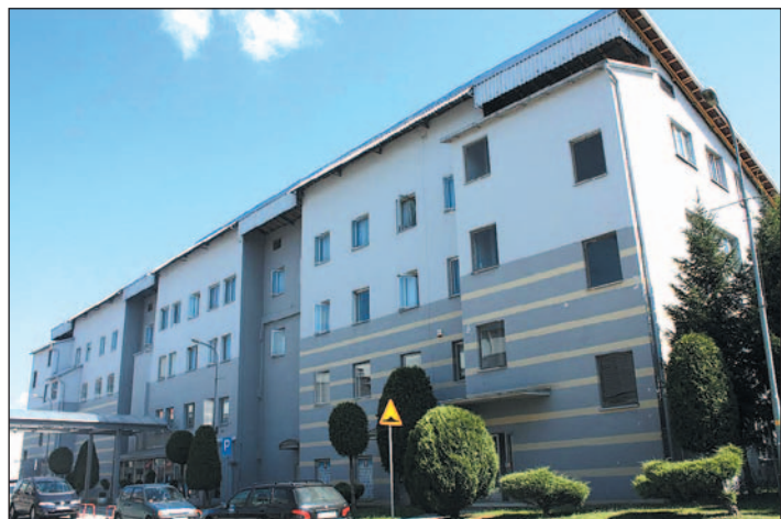
Termomodernizację przejdzie też Dom Sportowca

Dom sportowca, SP1 oraz Przedszkole Samorządowe nr 3 poddane zostaną termomodernizacji. Zgłoszony przez Miasto w ubiegłym roku projekt o wartości 5 136 522 zł zyskał akceptację i dofinansowanie z funduszy pochodzących z Islandii, Lichtensteinu i Norwegii w ramach Mechanizmu Finansowego Europejskiego Obszaru Gospodarczego 2009-2014. Kwota dofinansowania przekracza 3 mln złotych, co stanowi 68 procent kosztów.