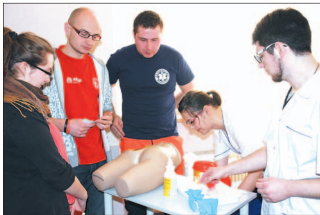
Fantom, igła ze strzykawką – i zastrzyk zrobiony!

Swoje wrażenia młodzież mogła zweryfikować i pogłębić w rozmowach ze studentami polskimi i zagranicznymi. – Dlaczego wybrałam tę uczelnię? Bo słyszałam, że ma dobrą opi-