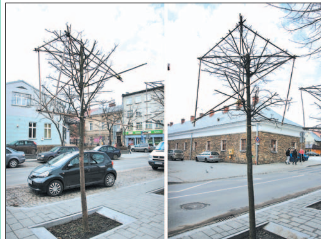
Wegetacja z samoistną transformacją?

Czasem myślę, że lepiej byłoby ściąć je zupełnie i posadzić w tym miejscu jakieś nowe drzewo, które będzie co roku doglądane przez odpowiedzialnego ogrodnika. Mamy też w mieście ciekawostkę! W przebudowanym