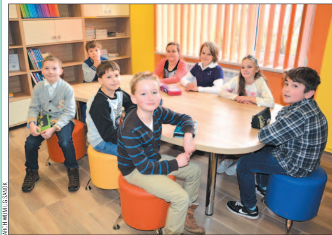
Nową bibliotekę chętnie odwiedzają dzieci.

Gminna Biblioteka w Pisarowcach jest już po remoncie, który trwał od listopada ubiegłego roku.