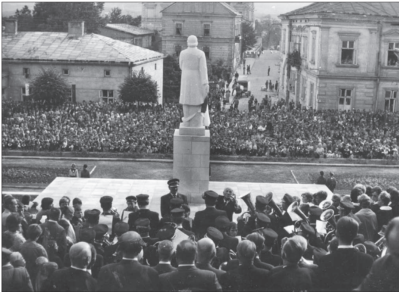
Odsłonięcie pomnika Tadeusza Kościuszki. 15.09.1962 r.

Szczególnie hucznie i radośnie obchodzono je w okresie międzywojennym, kiedy Polacy żywiłowo okazywali swoją radość z odzyskanej niepodległości. Sanok i jego mieszkańcy również włączali się w te obchody. W trzech pierwszych powojennych latach nowe władze, chcąc zachować pozory demokracji, organizowały jeszcze uroczystości trzeciomajowe. Świętowano wtedy zarówno 1, jak i 3 maja. Jednak powoli to drugie święto zastępowano tym