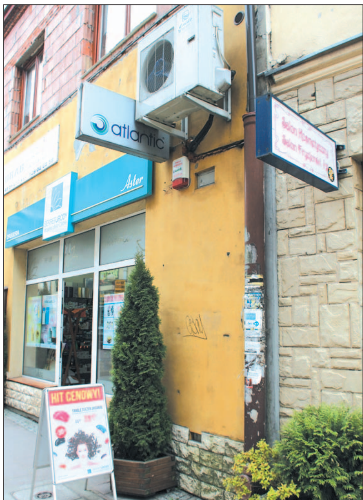
Po prostu horror. Reklama stojąca, wisząca, oblepiona ogłoszeniami rywna i wywalony na zewnątrz klimatyzator. Ludzie, zlitujcie się!