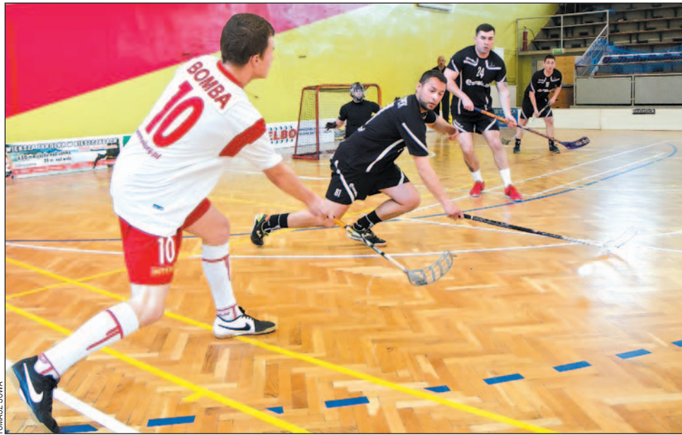
Mecz esanok.pl (ciemne stroje) z InterQ zakończył się remisem. W rewanżu będzie walka!

Zdecydowanie mniej emocji przyniósł pierwszy