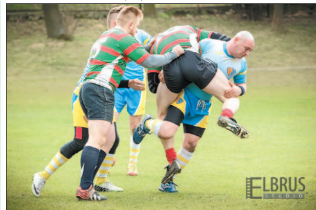
Podczas turnieju w Lublinie nasza drużyna (jasne stroje) dostała srogą lekcję rugby...