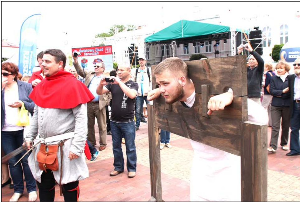
Zakuwanie w dyby przerabialiśmy już podczas Światowego Zjazdu Sanoczan. Zabawy było co niemiara.

Spotkanie z opowiadaniem Beksińskiego w interpretacji wybitnego aktora – w czwartek 7 maja o godzinie 17.