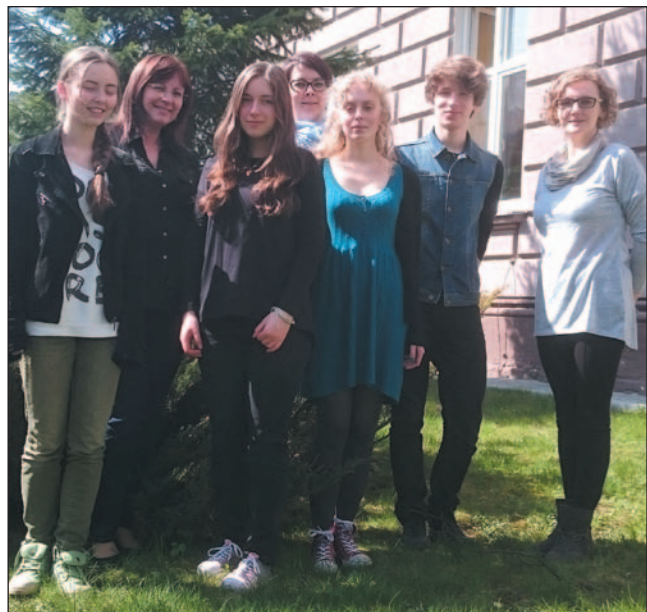
W starszej grupie najlepiej wypadło Gimnazjum nr 2, mając aż czterech laureatów (na zdjęciu wraz z opiekunkami).