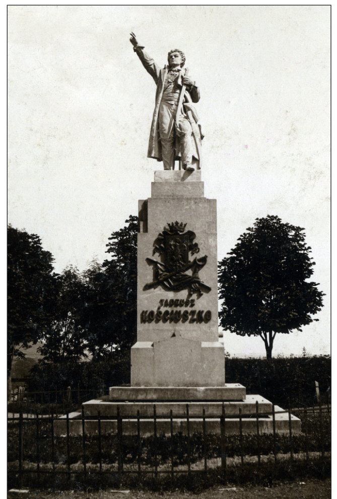
Pomnik Tadeusza Kościuszki na placu św. Jana (zniszczony przez Niemców w 1941 r.)