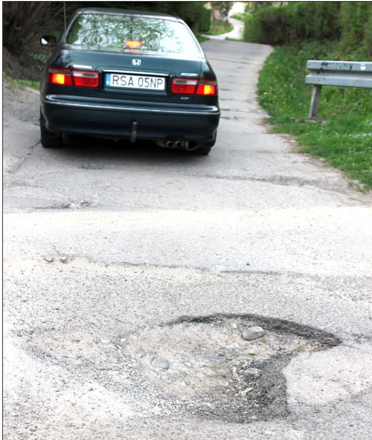
Drogi z płyt, dziury takie, że koło można urwać. Kiedy robiliśmy zdjęcie, mieszkający w pobliżu mężczyzna zaproponował, aby miasto dało materiały, a ludzie sami połatają największe wyrwy.

– Na inwestycje przewidziano w sumie 17,5 mln zł, co stanowi 15 procent budżetu. W 2014 roku wydatkowano 11,2 mln zł, czyli 12,5 procent budżetu. Na tak duży