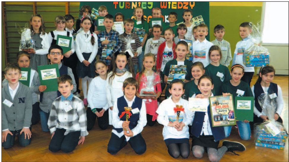
Uczestnicy turnieju w komplecie.

Szkoła Podstawowa nr 2 już po raz dwunasty zorganizowała Międzyszkolny Turniej Wiedzy o Sanoku dla uczniów klas drugich i trzecich. Tym razem w obydwu grupach wiekowych najlepsze okazały się drużyny „Jedynki”.