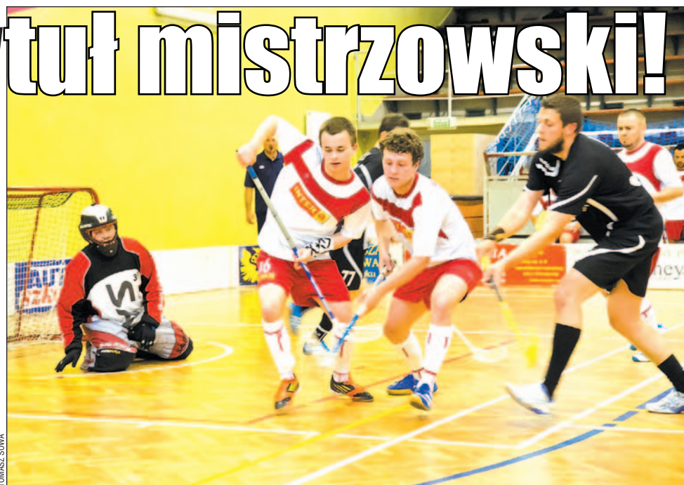
W drugim meczu finałowym unihokeiści InterQ wręcz zamurowali swoją bramkę, broniąc tytułu mistrzowskiego.

Prawdziwe emocje rozpoczęły się w meczach, których stawką były medale. Pierwszy pojedynek o brąz Sokół wygrał 5-1 z Drodzem, więc wydawało się, że rywalizacja jest już rozstrzygnięta.