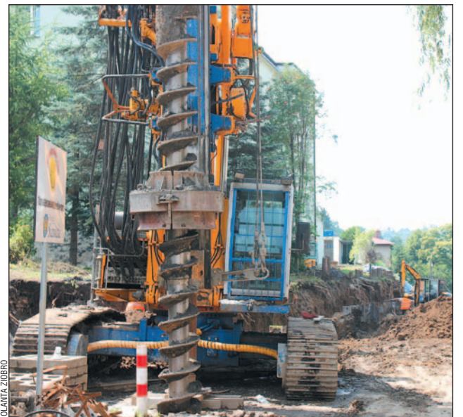
Specjalistyczny sprzęt, za pomocą którego „Remost” wykonywał w ubiegłym roku wzmocnienia przy ulicy Szopena, wierząc otwory o głębokości nawet kilkunastu metrów.