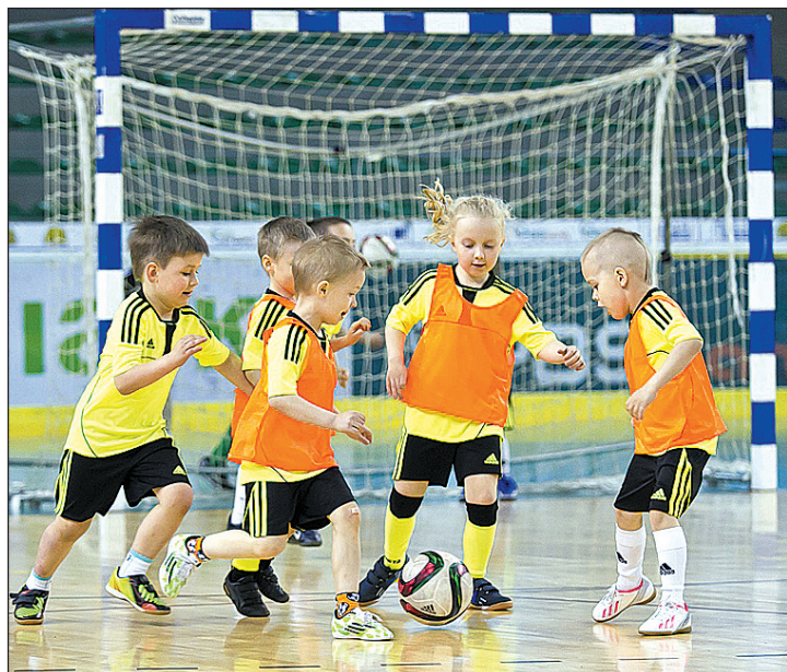
To była świetna zabawa, nie tylko dla chłopców.

W Hali „Arena” rozegrano Turniej Święta Uchwalenia Konstytucji 3 Maja dla dzieci z rocznika 2008, organizowany przez Akademię Piłkarską. Jej pierwsza drużyna okazała się mało gościnna, zajmując 1. miejsce.