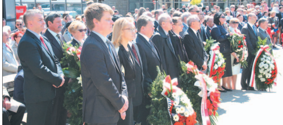
Władza stawia się w komplecie.

Mimo że piękna pogoda sprzyjała obchodom 224. rocznicy uchwalenia Konstytucji 3 Maja, w powiatowo-miejsko-gminnych uroczystościach uczestniczyło niewiele sanoczan. Znacznie liczniej przybyli na dziedziniec zamkowy, gdzie po południu zorganizowano wspólne śpiewanie pieśni patriotycznych.