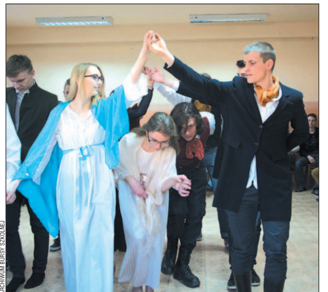
Polonez w wykonaniu mieszkańców bursy.