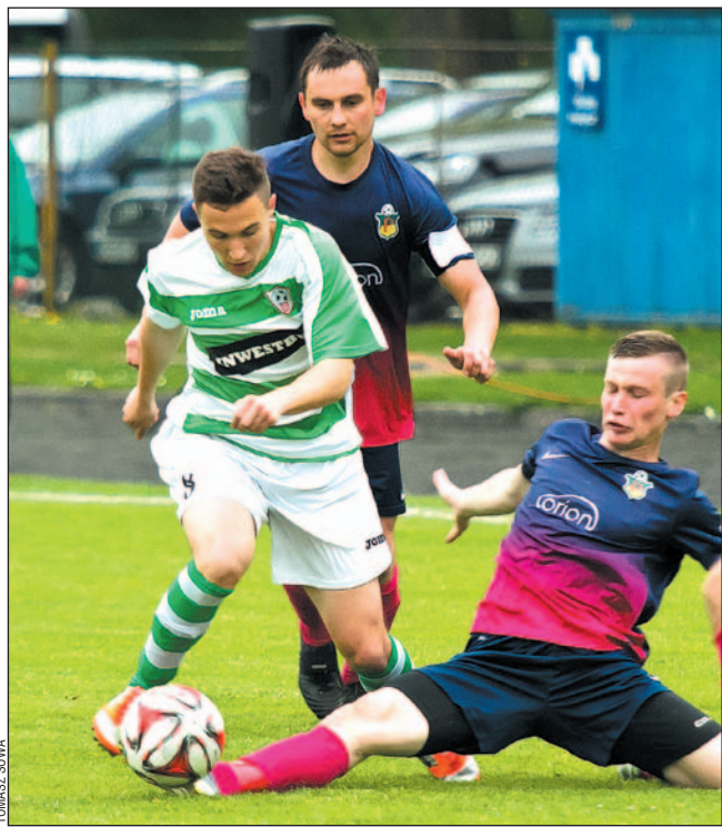
Zawodnicy LKS-u (ciemne stroje) nie zdołali powstrzymać „kosmicznego” rywala.

Cosmos Nowotaniec awansował do półfinału wojewódzkiego Pucharu Polski i już w środę zagra na wyjeździe z Wisanem Skopanie.