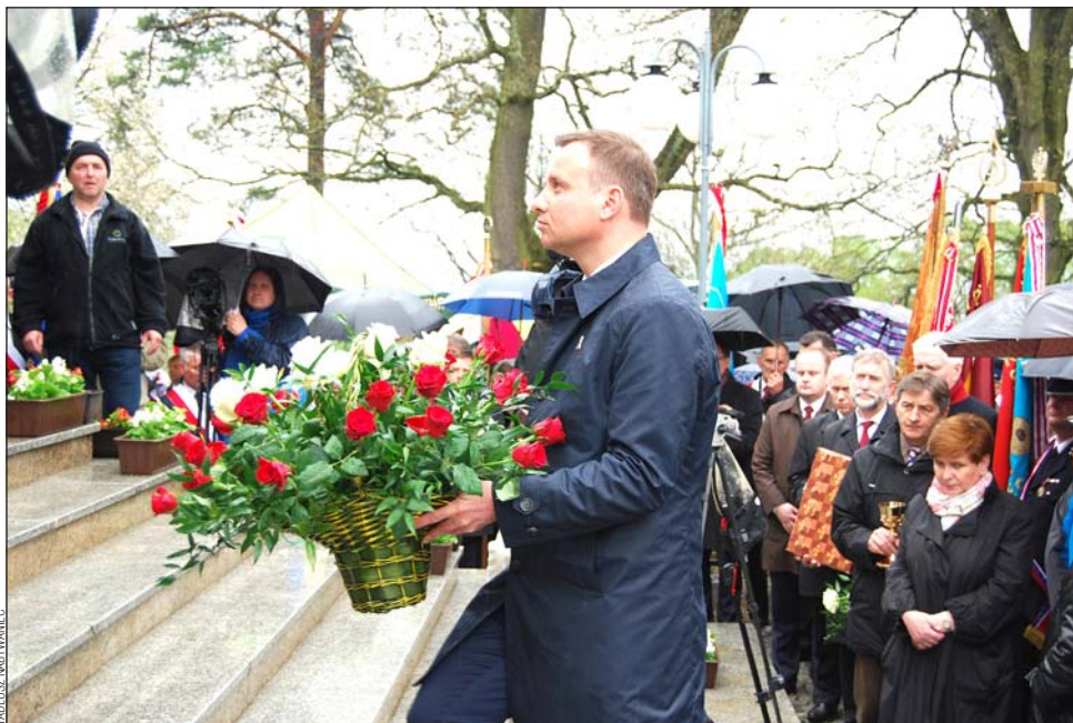
Andrzej Duda na schodach Bobolówki.