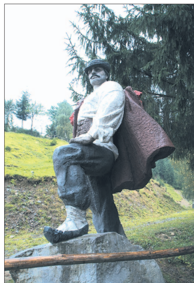
Pomnik ostatniego karpackiego zbójnika Nikoły Szuhaja w Kołoczawie.

Łoziński tak o nich pisze: „... pamiętać trzeba, że w odлюдnych i bezludnych ustrojach górskich, wśród przełęczów i bezludnych, wśród borów i wertepów, siedział niejedyn mały szlachcic, pan na spłachciu owsa, na chudej poloninie, ale i na garstce dzi-