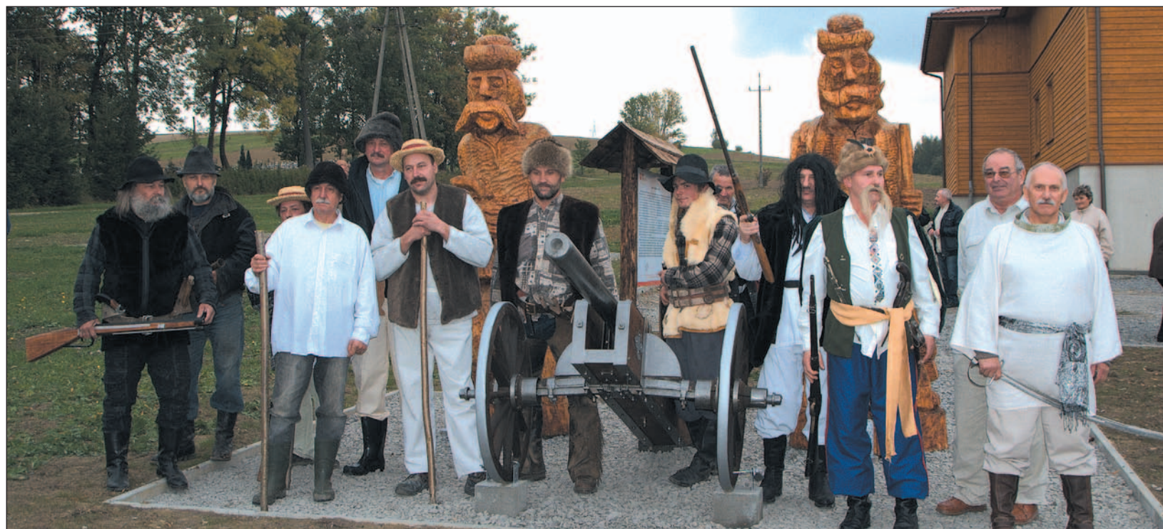
Odrzechowa – pomnik legendarnej „Zbójnickiej Armaty” i aktorzy z wioski, którzy odegrali scenę napadu na dwór starosty w Olchowcach.

nych, tak w Polsce, jak i na Węgrzech. Nic zatem dziwnego, że wielu chłopów, nie chcąc lub nie mogąc pogodzić się ze swoją sytuacją, uciekało w góry.