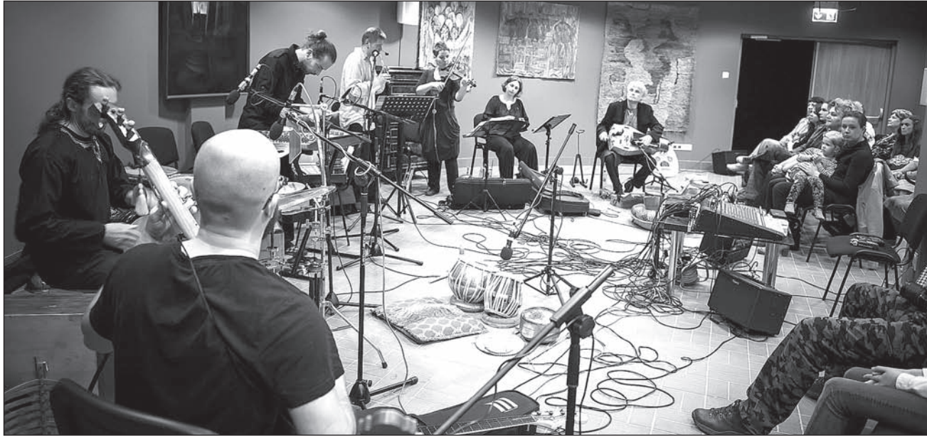
Matragona – mimo zmienionego składu, wciąż w znakomitej formie.

go projektu, wciąż nad nim pracujemy. Jesienią planujemy finał, na który z przyjemnością zapraszamy wszystkich słuchaczy i zainteresowanych