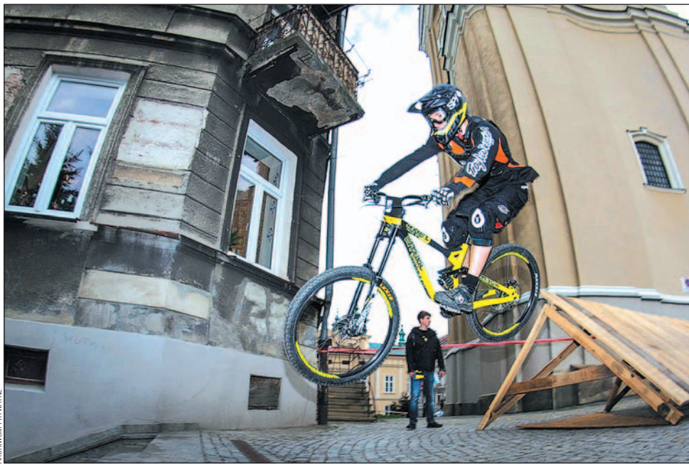
Przemyski Down Town okazał się niezwykle ciekawą konkurencją.

Impreza Przemysł Bike Town rozłożona została na dwa dni. Pierwszego rozgrywano Down Town, czyli wyścig w mieście. W elicie 4. był