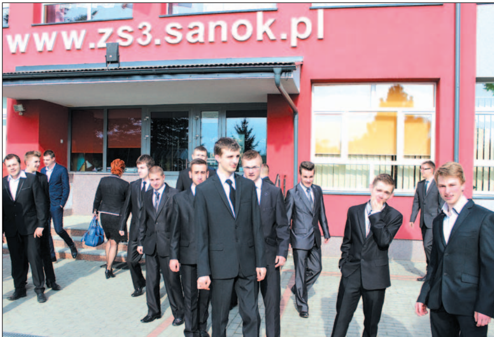
Tuż przed egzaminem z języka angielskiego. Nie widać żadnych oznak zdenerwowania – chłopaki trzymają fason!

Egzaminy maturalne potrwają do 29 maja. Ich wyniki poznamy 30 czerwca. Połamania piór! /joko/