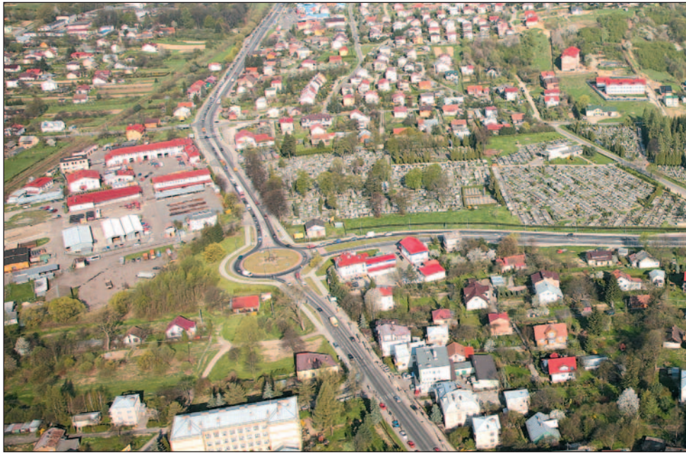
Łącznik skomunikuje obwodnicę z miastem.

Wstępna lista projektów drogowych jest jednym z załączników do RPO, który został przyjęty przez Zarząd Województwa Podkarpackiego w marcu tego