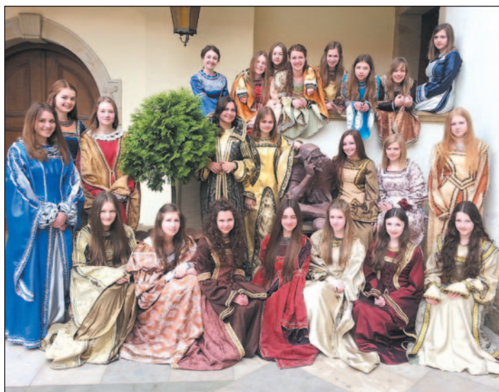
Pierwsze wrażenie jest ważne, ale drugie jeszcze ważniejsze.