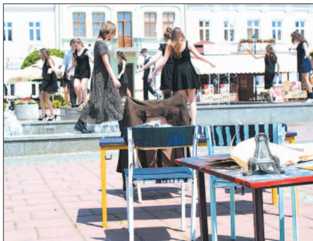
Warsztaty można poprowadzić wszędzie...

Istotną część festiwalowych działań stanowiły warsztaty teatralne dla młodzieży, które poprowadzili