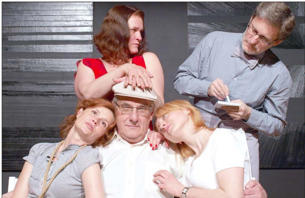
Chętnych do obejrzenia „Letniego dnia” było znacznie więcej niż miejsc.

Przez cały ubiegły tydzień w Sanoku obecny był duch Tadeusza Kantora, zaliczanego do najwybitniejszych twórców teatralnych XX wieku. Zorganizowany dla uczczenia 100-lecia urodzin genialnego reżysera Festiwal Inspiracji Kantorowskich „Miasto Ożywionych Sprzętów” ubarwił miasto i zaangażował całkiem sporą grupę jego mieszkańców. Idea festiwalu było przede wszystkim pokazanie dorobku Tadeusza Kantora jako źródła inspiracji dla współczesnych twórców teatru.