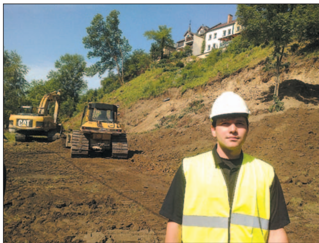
Ciężki sprzęt poradził sobie ze stromą skarpe. Półka pod mur oporowy jest już prawie gotowa.

– Po wykonaniu muru zajmujemy się terenem powyżej. Zbudujemy odcinek kanalizacji sanitarnej i deszczowej