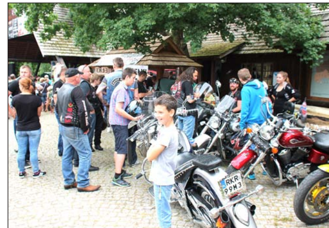
„Piraci” w skansenie.