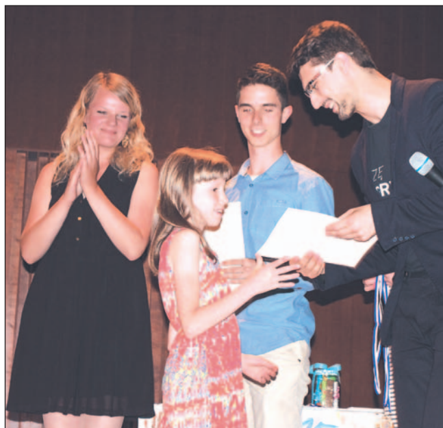
Mali studenci odbierali dyplomy z rąk przedstawicieli Akademii Przyszłości.

Dobiegł końca szósty już rok szkolny z sanocką Akademią Przyszłości, która tym razem miała pod opieką 30 małych studentów. Dyplomy i medale odebrali podczas Gali Sukcesów, zorganizowanej w Państwowej Szkole Muzycznej.