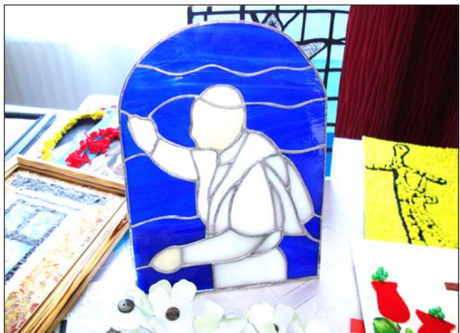
Zwieńczeniem konkursu była wystawa, podczas której pokazano najciekawsze prace.

Dokładnie 401 uczniów (!) z Sanoka i okolic wzięło udział w jubileuszowej 10. edycji Konkursu Papieskiego „Promieniowanie Świętości Jana Pawła II”, którego organizatorem były filie MBP na Dąbrówce i w Olchowcach.