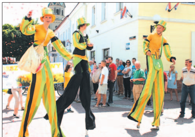
Szcudlarze na czele Marszu żonkilowego.