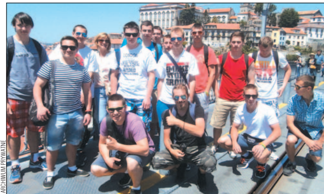
Uczniowie „Mechanika” w Portugalii.