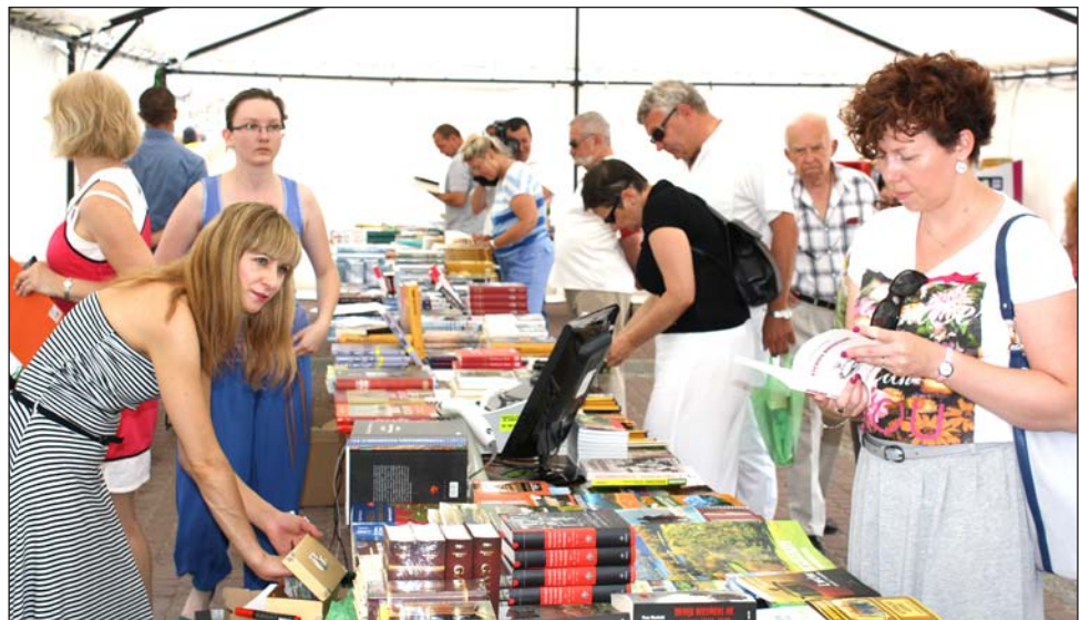
Na kiermaszu można było kupić również książki przecenione, m.in. piękne albumy po...10 zł.

Za nami 9. Bieszczadzkie Lato z Książką – doroczne spotkanie czytelników, wydawców i autorów – organizowane przez Oficynę BOSZ, przy wsparciu lokalnych samorządów i instytucji. Po Rzeszowie, Przemyślu, Lesku i – po raz pierwszy – Lwowie, w niedzielę „Lato...” dotarło do Sanoka, gdzie odbył się finał tegorocznej edycji. Nader udanej, co podkreślają wszyscy zainteresowani.