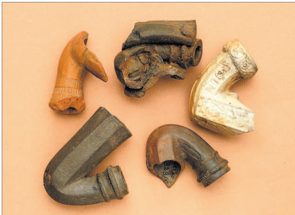
Mniej spektakularne, ale przybliżające życie naszych nie tak już odległych przodków, są gliniane fajeczki z XVIII i XIX wieku.