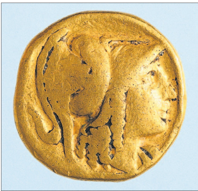
Złota celtycka moneta z przełomu III i II n.e.