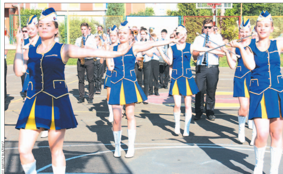
Mażoretki towarzyszące Młodzieżowej Orkiestrze Dętej „Avanti” dały świetny pokaz musztry paradnej.