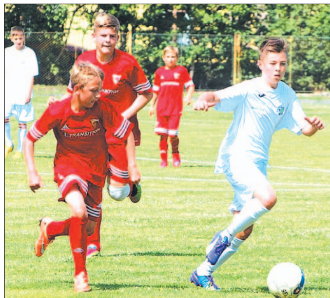
Trampkarze starsi Ekoballu (jasne stroje) nie dali szans rówieśnikom z Kozienic.

Mimo wakacyjnej przerwy, niektóre drużyny Ekoballu Geo-Eko grają sparingi. Starsze zespoły trampkarzy i młodzików zmierzyły się odpowiednio z AP Kozienice i Victorią Pakoszówka, odnosząc wysokie zwycięstwa.