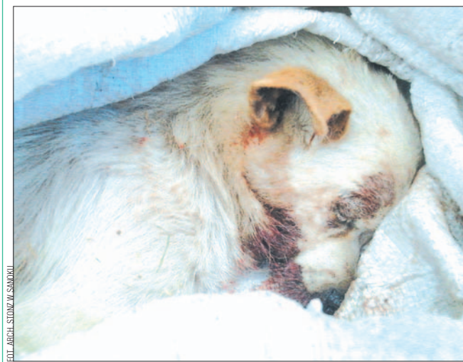
Pijany mężczyzna siekierą zabił suczkę i szczeniaka. Zwłoki zwierząt zakopał za domem.