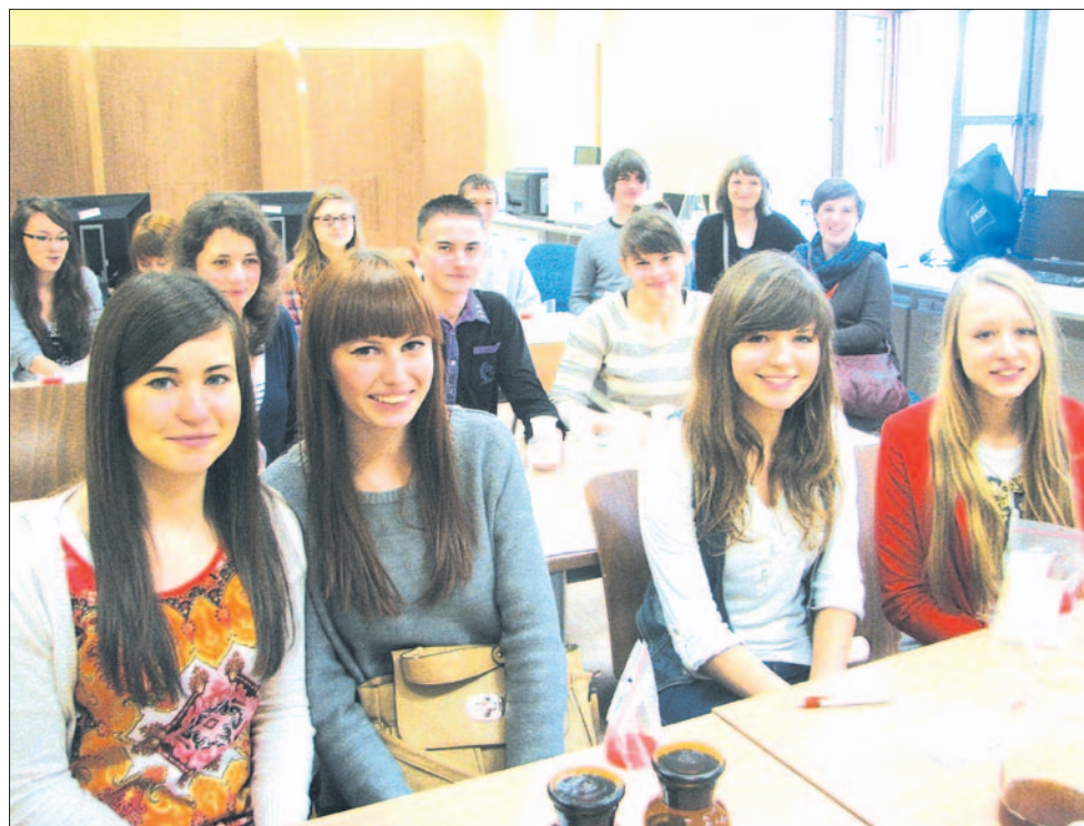
Każda szkoła miała ustalony limit punktów poniżej którego nie przyjmowała chętnych.