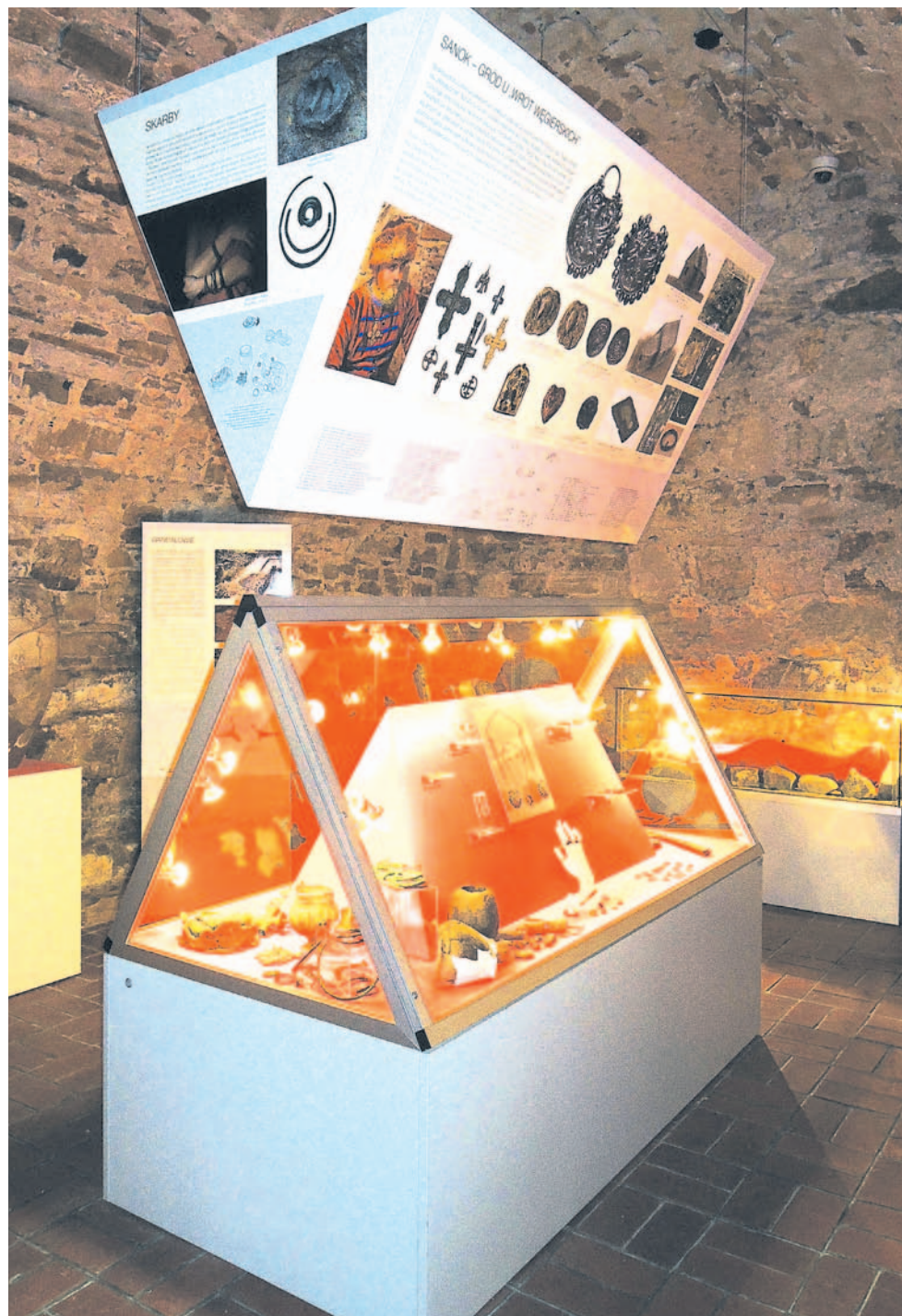
Wystawa została tak pomyślana, by pokazać historię badań archeologicznych, osób je prowadzących i najciekawsze zabytki ułożone w porządku chronologicznym.

renie imperium rzymskiego. Jeden z nich jest szczególnie ciekawy, gdyż widnieje na nim wyobrażenie boga wojny Marsa i bogini zwycięstwa Wiktorii. Na drugim kowal uwiecznił z kolei stempel ze swoim imieniem. Niestety czas je zatarł i prawdopodobnie nie uda się go odczytać.