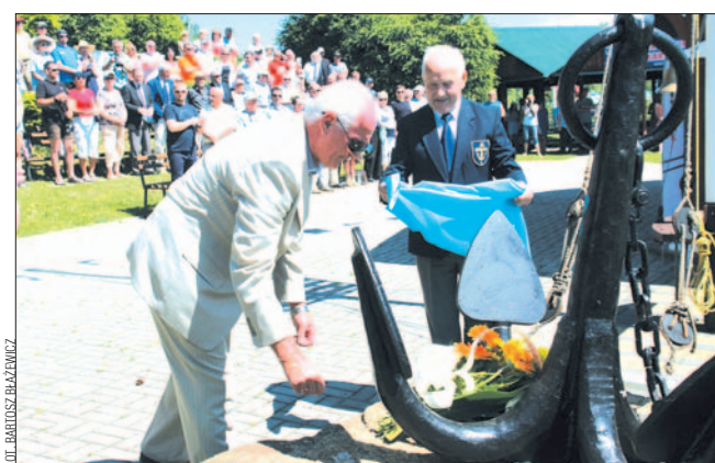
Uroczystość rozpoczęto odsłonięciem postumentu ku czci żeglarzy, którzy odeszli już na wieczną wachtę.