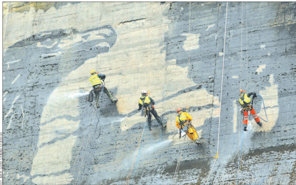
Eko-writerzy z Good Looking Studio pracowali, zwisając na linach, czasami nawet po 12 godzin dziennie...