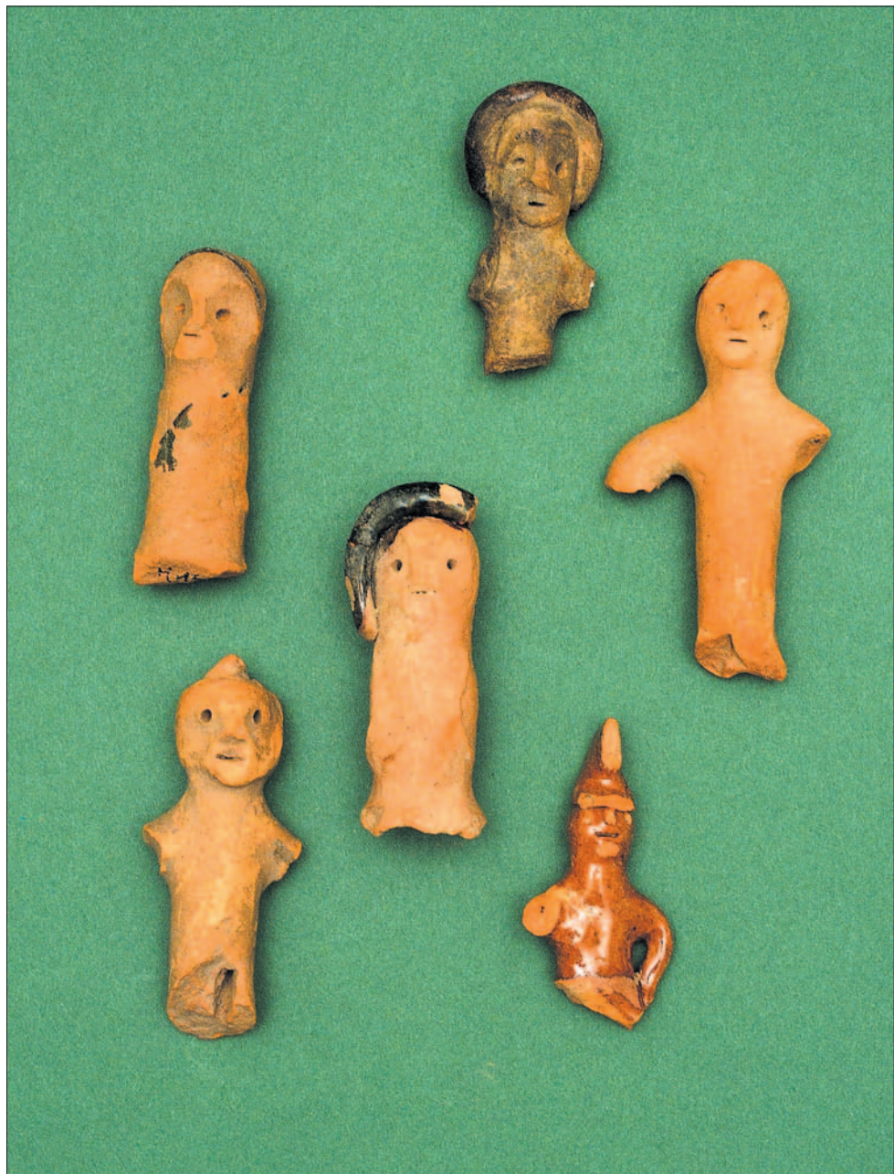
Gliniane figurki, pochodzące z czasów nowożytnych, służyły dzieciom do zabawy.

twierdzą wysoką rangę grodu, którym rządził posiadnik.