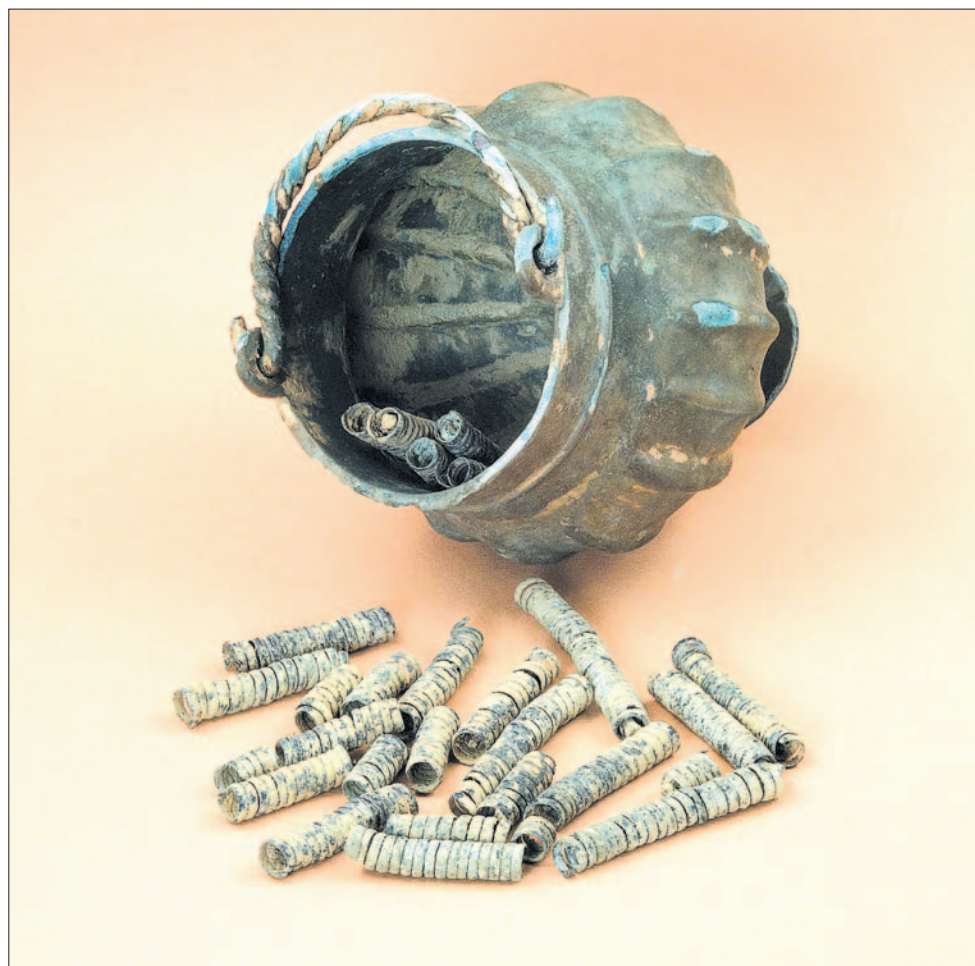
Skarb z Woli Sękowej zawierał brązowe naczynie wykonane aż na Bałkanach. Wzbudza ono niezwykle zainteresowanie w świecie archeologicznym.