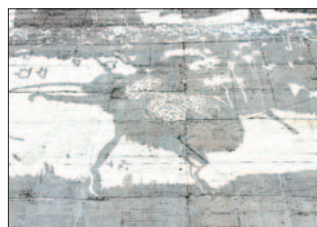
Znalazło się miejsce nawet dla małego żuczka.