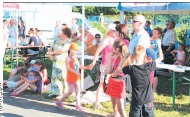
Mieszkańcy Posady chętnie uczestniczą w piknikach.

Brawa nie tylko dla wykonawców, ale i dla spółdzielni za organizację. Piknik Rodzinny już trwale wpisal się w kalendarz atrakcji na Posadzie i wciąż cieszy się dużym zainteresowaniem mieszkańców, których tym razem nie odstraszyła nawet upalna pogoda. (b)