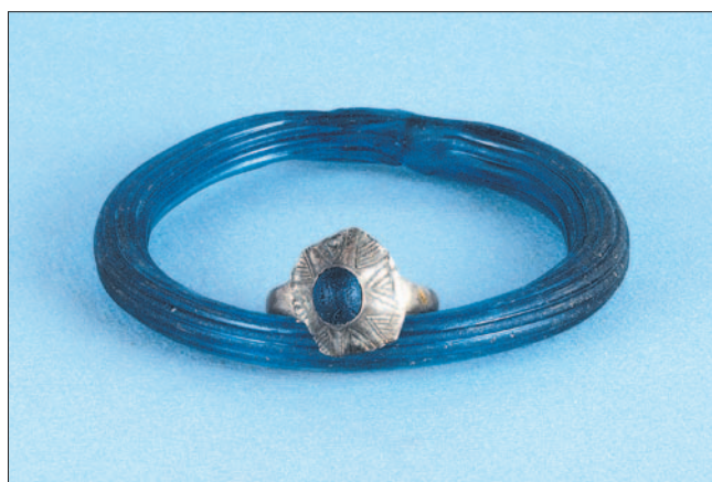
Piękny komplet biżuterii, składający się ze szklanej bransolety i srebrnego pierścionka ze szklanym oczkiem mogłaby i dzisiaj nosić niejedna kobieta.