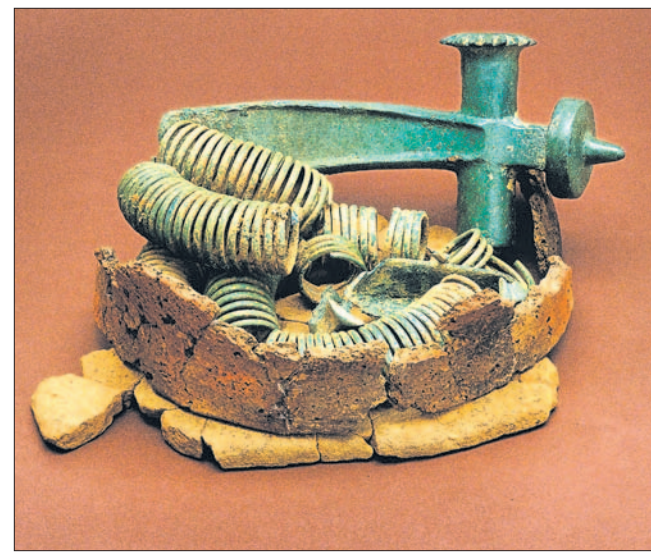
O skarbie z Rzepedzi było głośno w ostatnim czasie. To narzędzia i ozdoby ukryte w glinianym garnku.

Idąc dalej, natykamy się na rekonstrukcję grobu ciałopalnego odkrytego w Prusieku. Jest on jednym z 35 pochówków eksplorowanych w latach 2004–2007 przez archeologów z Instytutu Archeologii Uniwersytetu Jagiellońskiego, którzy natrafili na jedyne w tej części Karpat ciałopalne cmentarzysko pochodzące z II wieku n.e., związane z kulturą przeworską. Choć jest niewielkie, to jednak bogactwo wyposażenia zrekomponowało archeologom skromną liczbę pochówków. Groby kobiece wyposażone były głównie w biżuterię, jak i przedmioty codziennego użytku, w tym drewniane skrzyneczki z okuciami. Natomiast groby męczyzn to groby wojowników. Na cmentarzysku archeolodzy odkryli 6 mieczy, z których 4 wyprodukowano na te-