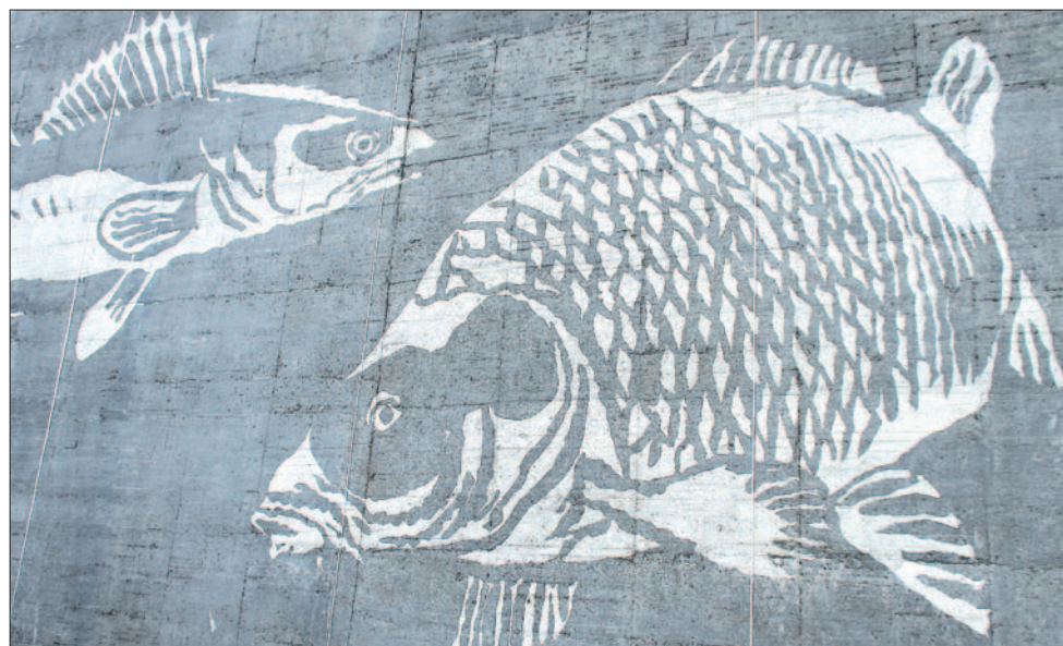
Dopiero na zbliżeniach rysunków widać, jak precyzyjną robotę wykonali twórcy muralu.