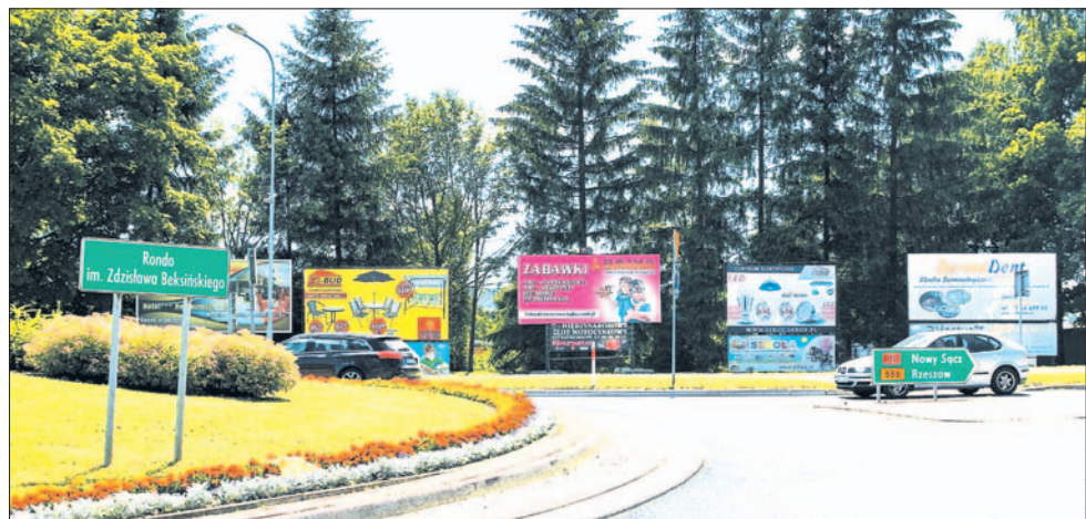
Albo – albo, bo jak widać razem nie powinno to funkcjonować.

zrobić! Można modlić się o wicher, która zmiecie ten bałagan – ale to trochę niebezpieczne dla otoczenia. Można poprosić właścicieli reklam, by je usunęli, ale to nierealne, bo od razu podnie się wrzask o tłumieniu wolności gospodarczej. Można wreszcie przemianować to miejsce na „Rondo reklamiarzy” i – jak w tytule felietonu – wybrać: albo uszanowanie wielkiego sanoczanina, albo reklamiarstwa. Albo poczekajmy aż zaczną być wcielane w życie zapisy ustawy krajo- brazowej, która konsekwentnie stosowana na pewno doprowadzi rozsądek reklamodawcom i reklamodawcom. Albo wykrzeszmy z siebie jeszcze trochę cierpliwości i poczekajmy na budowę południowej obwodnicy Sanoka – jeden z jej łączników ma wejść właśnie w tym miejscu w rondo. Trochę dużo tych „albo”, a mogłoby być zupełnie inaczej, gdyby ktoś (ktoś z imienia i nazwiska a nie jakiś anonimowy urząd czy urzędnik), zezwalający na postawienie plansz, zastanowił się przez chwilę przed podjęciem decyzji. Bo chyba nie są to samowolki budowlane? Mam nadzieję, że tak się stanie, gdy powstanie już wspomniany łącznik z obwodnicą i będzie on obiektem pożądania inwestorów i reklamiarzy wszelkiego autoramentu. Kończąc... rozsądku, odpowiedzialności i konsekwencji przy podejmowaniu decyzji życzę urzędnikom, sobie i sanoczanom.