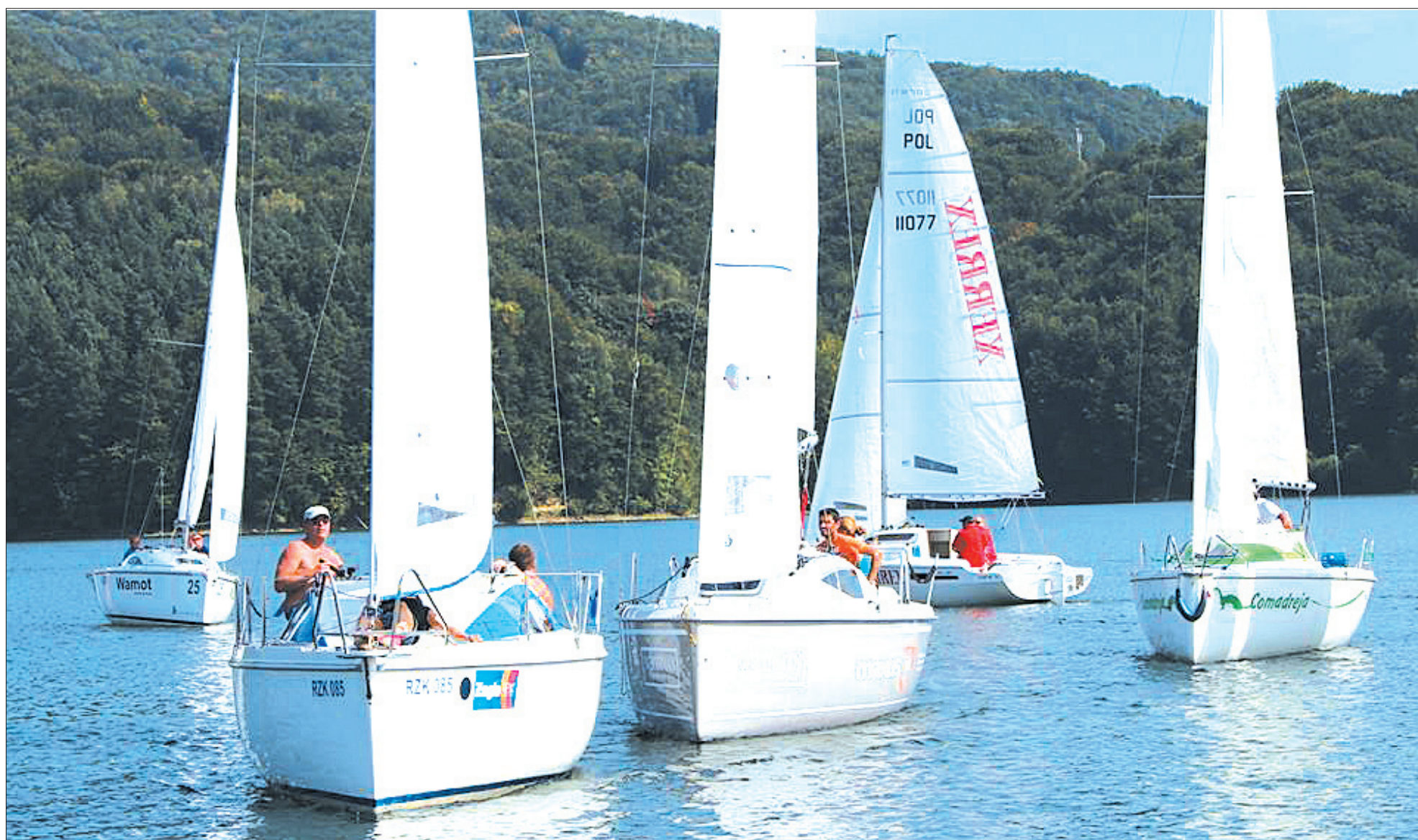
Regaty na Zalewie Solińskim to od lat nieodzowny element bieszczadzkiego krajobrazu. Bo właśnie na wodzie żeglarze „czują, że żyją”.