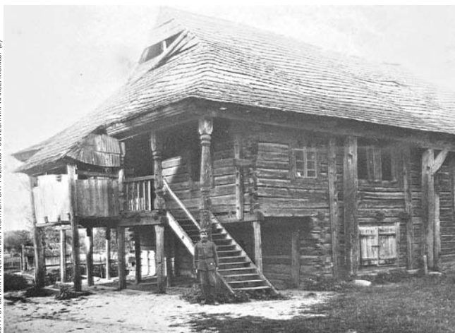
Świątynia przestała istnieć w 1943 roku. Zachowała się jednak pełna dokumentacja budynku.

Świątynia przestała istnieć w 1943 roku. Zachowała się jednak pełna dokumentacja budynku, którą muzeum udostępnił Instytut Sztuki Polskiej Akademii Nauki i Zakład Architektury Polskiej Politechniki Warszawskiej. Bożnica będzie kropką nad „i”. Dzięki niej sanocki skansen będzie oddawał zróżnicowanie etniczne regionu.