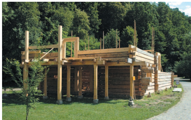
Rekonstrukcja bożnicy jest atrakcją dla turystów, którzy z zainteresowaniem śledzą pracę ekipy budowlanej.

Jednym z ciekawszych przedsięwzięć jest „Galicyjski Rynek”, który powstał trzy lata temu. Decyzję o stworzeniu tego typu projektu podjęto w 1958 roku. Pomysłodawcą była Rada Naukowa, która zdecydowała, że w skansenie mają się znaleźć wszystkie elementy, które tworzą kulturę Podkarpacia. Założenie rady udało się wcielić w życie 50 lat później. „Galicyjski Rynek”, który stanowi replikę miasteczka galicyjskiego z przełomu XIX i XX wieku z zachowaniem wszystkich jego funkcji – społecznych, gospodarczych i kulturowych – powstał w latach 2009–2011. W jego skład wchodzi 29 obiektów (w tym 26 budynków o charakterze mieszkalnym, mieszkalno-produkcyjnym, mieszkalno-handlowym i mieszkalno-usługowym) pochodzących z różnych kultur i miejscowości. Można tu znaleźć między innymi remizę strażacką, karczmę, pocztę, urząd gminy, aptekę oraz warsztaty: fryzjerski, stolarski, zegarmistrzowski, piekarski i fotograficzny. Budynki są w pełni wyposażone w meble i przedmioty z tamtej epoki. Dzięki temu zwiedzający bez trudu mogą sobie wyobrazić, jak wyglądało codzienne życie mieszkańców miasteczka. W sumie na wyposażenie rynku składa się ok. 3,5 tys. eksponatów muzeal-