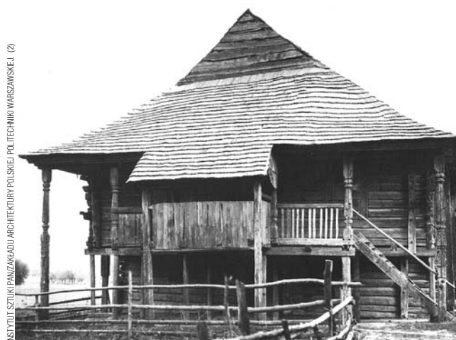
Dzięki synagodze z Połańca skansen będzie oddawał zróżnicowanie etniczne regionu.

dzie wiernie odtworzone. Ściany i czworoboczne zwierciadlane sklepienie świątyni z Połańca pokrywała wielobarwna polichromia przedstawiająca znaki zodiaku, rozety, symboliczne zwierzęta,