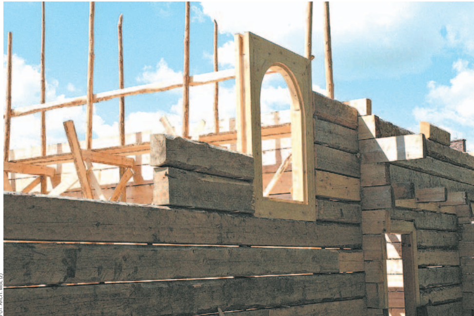
Obecnie trwają prace przy budowie jodłowego zrębu.

nych. Dodatkowo umieszczono tam trzy budynki przeznaczone na cele wystawiennicze, edukacyjno-konferencyjne i recepcyjne oraz trzy obiekty, w których znajdują się pokoje gościnne. Kolejną atrakcją przyciągającą turystów są organizowane w skansenie imprezy, między innymi Jarmark Bożonarodzeniowy, Niedziela Palmowa czy Piknik Rodzinny. Popularnością cieszy się też tak zwana „Galicyjska Gracjarnia” – giełda funkcjonująca od kwietnia do paź-