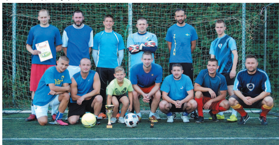
Drużyna Posady z kompletem zwycięstw wygrała II edycję Sanockiej Ligi Orlika.

Faza grupowa: Płowce – Siara Team 3-0, Siara Team – Srogów Górny 1-5, Płowce – Srogów Górny 0-1. Półfinały: Posada – Płowce 6-2, Kingsi – Srogów Górny 2-0. Mecz o 3. miejsce: Srogów Górny – Płowce 6-1. Finał: Posada – Kingsi 7-2.