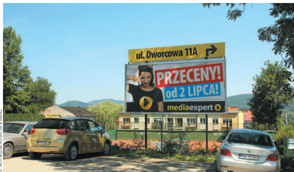
„Wirus zakopiański” w rodzimym wydaniu.

niewłaściwe zagospodarowanie przestrzeni miejskiej. W centrum Sanoka nie ma miejsca na reklamę, a zwłaszcza wielkoformatową, powinny funkcjonować wyłącznie szyldy. I choćby nie wiem jaki góral był właścicielem terenu, to nie można pozwolić na ekspansję reklamiarstwa. Nawet gdyby opisywana plansza mówiła coś o Sanockim Klubie Tenisowym czy o tenisie w ogóle, to dyskwalifikuje ją niedostosowanie do otoczenia. Piszę o tym teraz, gdy stoi jedna, bo kto wie, czy już komuś nie zaświtało w głowie, by dostawić do niej następną, argumentując: Jak to? Im wolno, a mnie nie!?