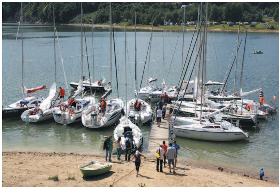
Przy kei „Albatrosa” zaroilo się od łodzi przeżywających drugą młodość.