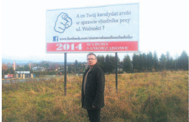
Mieszkańcy ul. Wolności są zmęczeni czekaniem i zapowiadają, że w sierpniu zorganizują protest.

Mieszkańcy zagórskiej ul. Wolności od lat walczą o utworzenie chodnika na odcinku łączącym Sanok z Zagórzem. Ich batalia wydaje się nie mieć końca. Zmęczeni niezmienną od lat sytuacją deklarują, że w sierpniu zablokują drogę.