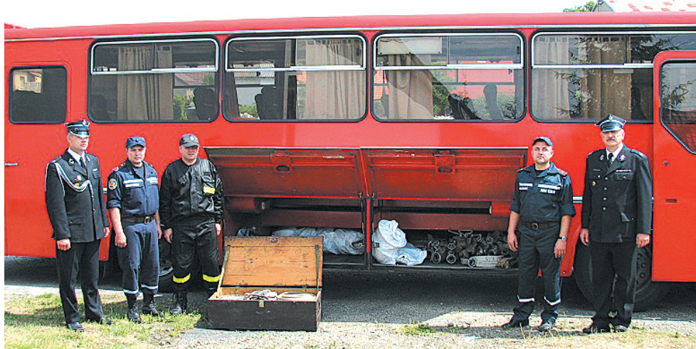
Bagażnik autobusu wypełniony sprzętem podarowanym przez strażaków z gminy Zagórz.

Wiele wskazuje na to, że zbiórka będzie miała ciąg dalszy. Kolejna partia sprzętu przekazanego między innymi przez KP PSP w Sanoku w najbliższym czasie trafi do strażaków z Kijowa. aes