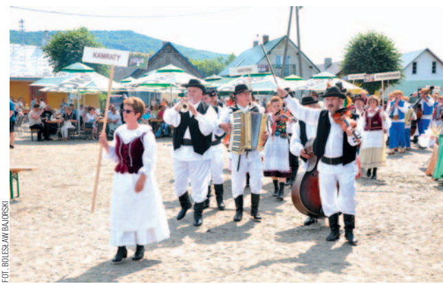
Najpierw kapele zaprezentowały się w barwnym korowodzie.

Akcję protestacyjną zaplanowano na 14 sierpnia. Mieszkańcy chcą tego dnia spotkać się na przejściu dla pieszych i około godziny 16 zablokować drogę. aes