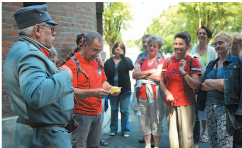
W Twierdzy Przemyśl turystów przywitał sam Szwejk.