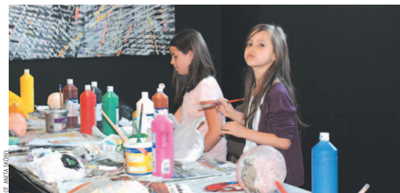
Dzieci w trakcie warsztatów zgłębiały tajniki sztuki aktorskiej.