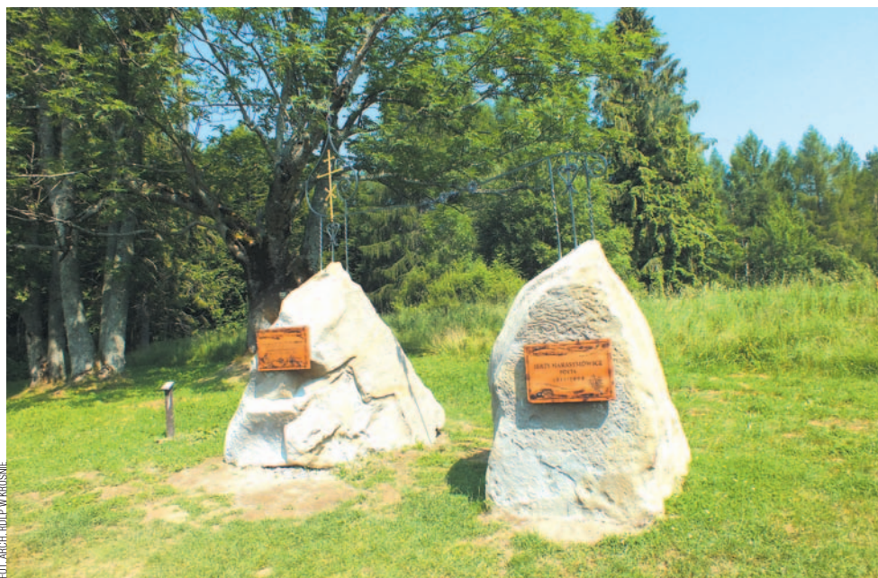
Pomysł odnowienia pomnika wyszedł od goprowców i leśników, którzy zgromadzili środki na ten cel.

Warto przypomnieć, że na cześć Jerzego Harasymowicza w Komańczy od kilku lat organizowana jest „Harasymjada” cykl spotkań poetyckich poświęconych twórczości piewcy gór. aes