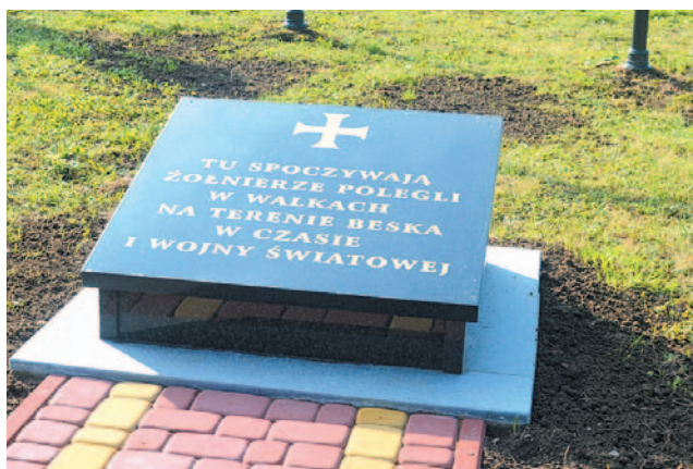
Na parafialnym cmentarzu w Besku spoczywa od 320 do 350 poległych, którzy swoje życie stracili w czasie walk na terenie Beska i Mymonia w maju 1915 roku

tarzach wojennych na terenie dawnej Galicji – wyjaśnia wójt gminy Besko. – Wtedy to narodziła się koncepcja, żeby miejsce spoczynku nieznanym żołnierzom na terenie naszej gminy, w jakiś sposób upamiętnić. W 2014 roku odtworzono pierwotny układ mogił i odnowiono ogrodzenie cmentarza wojennego w Mymoniu. W bieżącym roku w porozumieniu z proboszczem naszej parafii, w miejscu pochówku żołnierzy wykonano kwaterę wraz z tablicą upamiętniającą wszystkich poległych w czasie I wojny światowej. Na ten cel otrzymaliśmy dofinansowanie w kwocie 15 tys. zł z Urzędu Województwa Podkarpac-