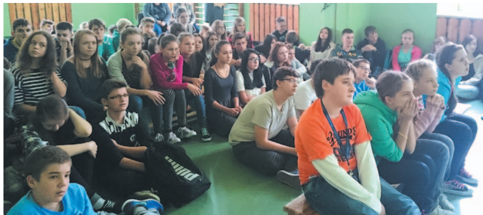
Dzięki tego typu imprezom młodzież zaczyna rozumieć wagę problemu

Aby uświadomić młodzieży, jak szkodliwy i niszczący wpływ na życie mogą mieć dopalacze, w Gimnazjum nr 2 zorganizowano spotkanie z przedstawicielami Fundacji „Latarnia”. Zaproszeni goście opowiedzieli uczniom o swoich doświadczeniach i przestrzegli przed używaniem środków odurzających.