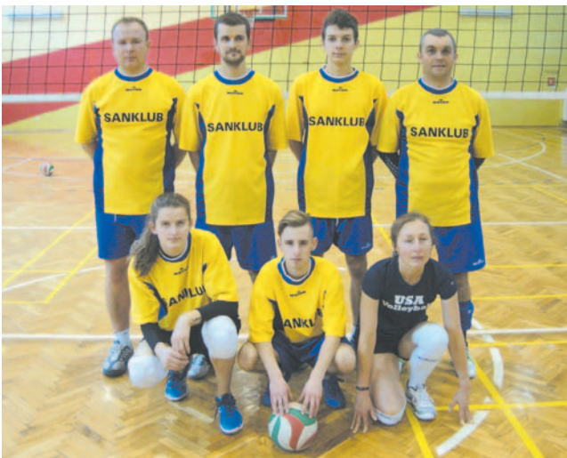
Sanocka drużyna znów zajęła 2. miejsce