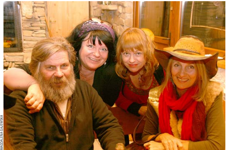
Atmosfera przyjazni, dobrego słowa, muzyki i ludzi pragnących się spotkać i ze sobą przebywać – to atuty Spotkań Beskidzkich