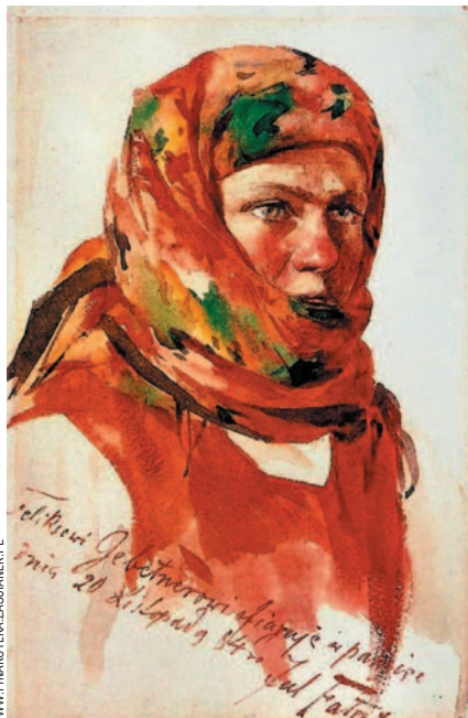
„Dziewczyna w chustce” Juliana Fałata

Monumentalizm twórczości i ogromna wszechstronność Kraszewskiego stanowi jednak problem. Bo z jakim dziełem, jakim prądem myślowym skójżarzyć artystę? Do dziś wiele listów nie jest odczytana, a znaczną część powieści po prostu zapomniana. Owszem istnieje w Poznaniu interesująca pracownia-muzeum Józefa Ignacego