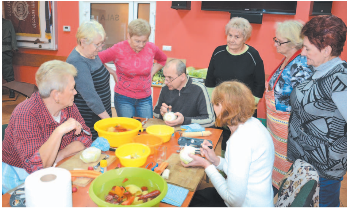
W naszym kraju carving jest mało znany, ale to sztuka bardzo pasjonująca. Przekonały się o tym mieszkanki Bukowska

Wiek nie definiuje człowieka. Można mieć dwadzieścia lat i mieć wrażenie, że skończyło się czterdzieści. Można mieć jednak sześćdziesiąt i żyć pełnią życia. Dowody na to, że bez względu na liczbę przeżytych zim można spełniać swoje marzenia, zdobywać nową wiedzę i cieszyć się każdym kolejnym dniem, mogą dostarczyć kobiety z gminy Bukowsko, które realizują projekt „Aktywny senior”.