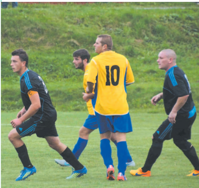
Zawodnicy Gimballu Tarnawa Dolna (ciemne stroje) tracą tylko punkt do Jawornika Czarna, prowadzącego w tabeli klasy B

Cosmos Nowotaniec ograł Wiązownicę i wciąż traci tylko punkt do prowadzącego w IV lidze Sokoła Nisko. Podobnie sytuacja wygląda w klasie B, gdzie Juventus Poraz i Gimball Tarnawa Dolna ścigają Jawornika Czarna. Zmiana na czele grupy I klasy C – nowym liderem jest LKS II Pisarowce, który pokonał LKS Czaszyn, wykorzystując też potknięcie Pogorza Srogów Górny. W grupie II sensację sprawiła Jutrzenka Jaćmierz, aż 3-0 wygrywając na wyjeździe z prowadzącym w tabeli Beskidem Posada Górna. Tym sposobem lider stracił pierwsze punkty w sezonie.