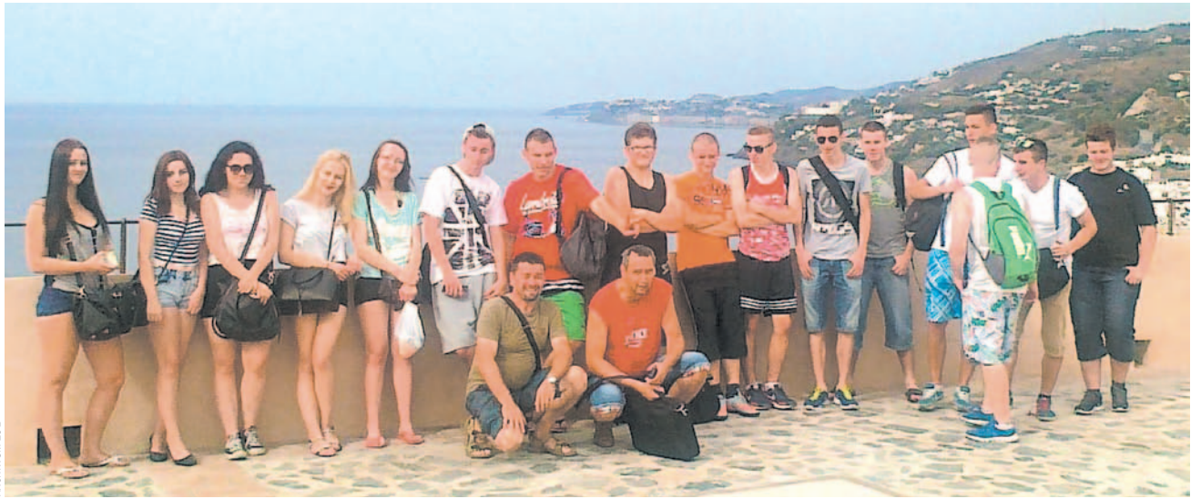
W ramach zagranicznych praktyk uczniowie 3 klasy technikum teleinformatycznego spędzili 5 tygodni w Grenadzie

– Mieliśmy to szczęście, że mieszkaliśmy w samym