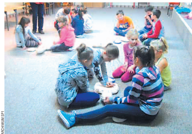
Dzieci z SP1 zaangażowały się w projekt i prowadziły resuscytację na sześciu fantomach

– Dziękujemy każdej osobie i instytucji, która podjęła organizacyjny trud i włączyła się w nasze przedsięwzięcie – mówił Jurek Owsiak, prezes zarządu Fundacji WOŚP. – Szczególne podziękowania należą się każdej szkole, która posiadając przekazany przez orkiestrę sprzęt oraz przeszkolo-