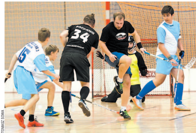
Rozgrywki SLU rozkręcają się, ale prawdziwe emocje dopiero przed nami