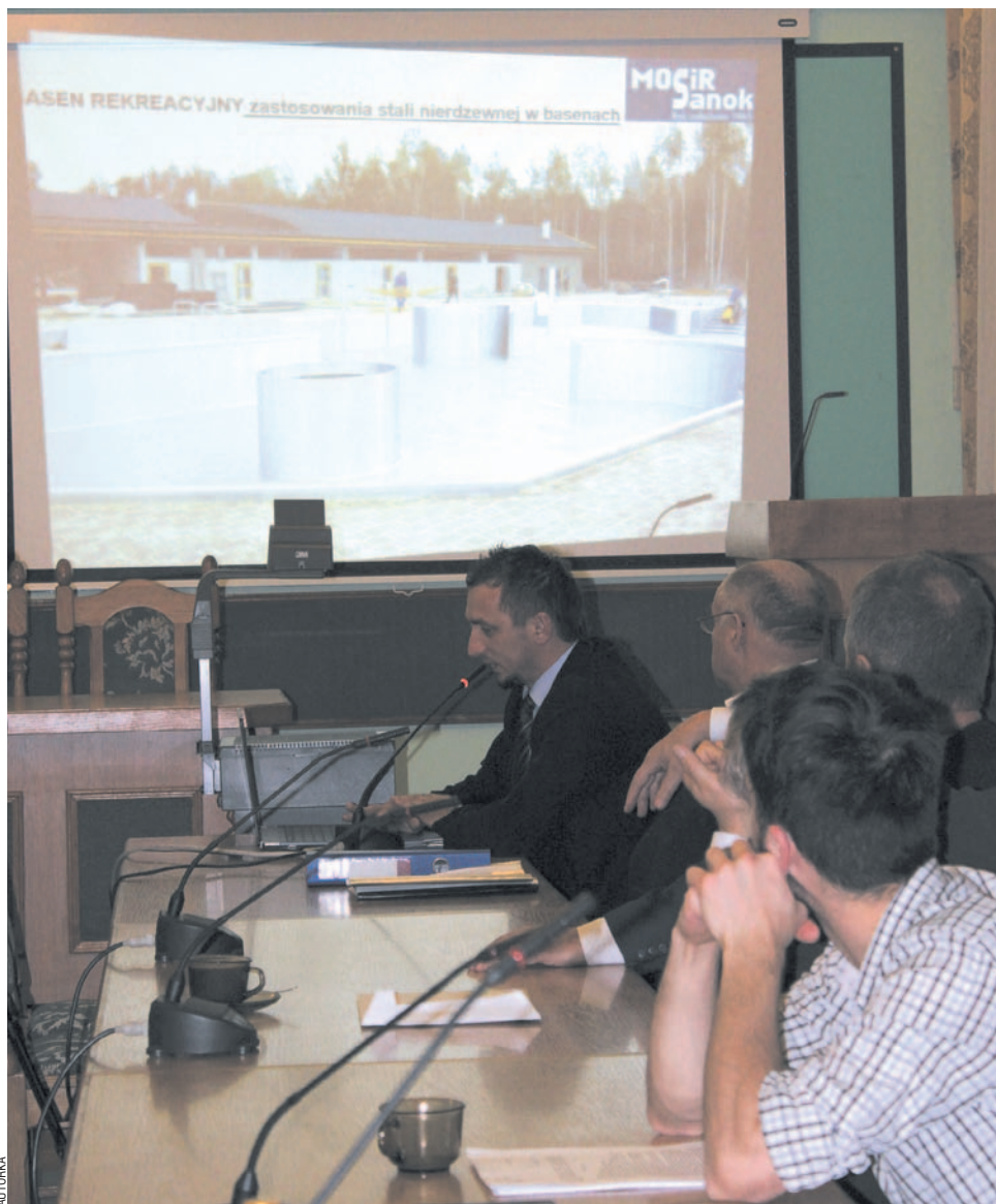
Radni zapoznali się z koncepcją na wspólnym posiedzeniu komisji. Prawdopodobnie wybiorą się do Sokołowa Młp

W Sokołowie Małopolskim proporcje między kosztami a dochodami wyglądają znacznie lepiej. Jest to obiekt liczący 3 tys. m 2 . Składa się z basenu rekreacyjnego, sportowego (z 6 torami 25 metrowymi), o głębokości 1,2-1,8 m, z widownią na 140 miejsc. Basen rekreacyjny o głębokości 0,6-1,2 m ma atrakcje: masaż karku, dysze, sztuczna fala, gejzer, jacuzzi, brodzik dla dzieci o głębokości 0,3-0,6 m, z jeżem wodnym i parasolem. Ponadto w obiekcie znajduje się: bar, sklepik spożywczy wraz z artykułami pływackimi, gabinet masażu. Lustro wody ma powierzchnię 540 m 2 . Brodzik ma zaledwie 25 m 2 . I w przy-