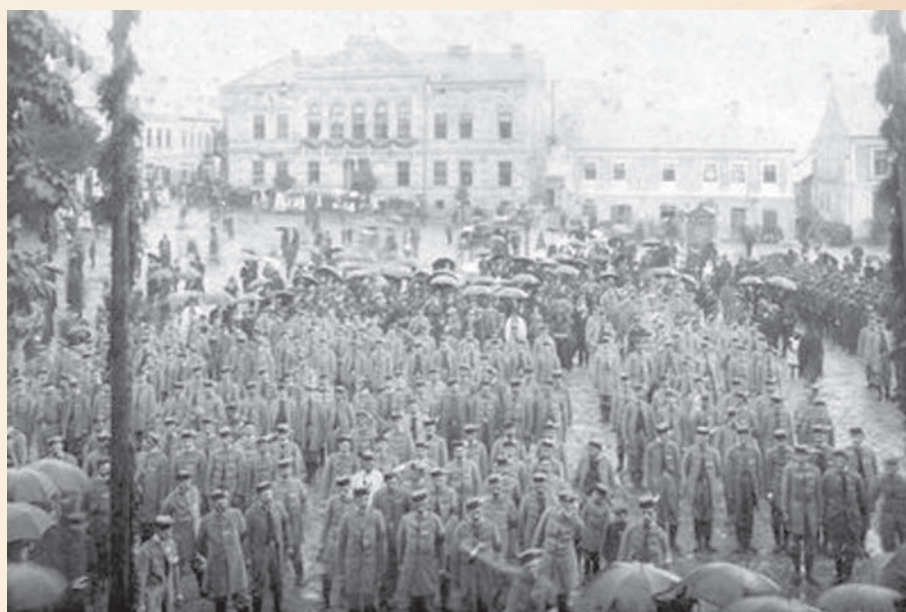
Zlot Sokoła w 1914 roku

Sam Sanok z okolicami stał się ważnym ośrodkiem powstawania kolejnych organizacji, które za swój cel stawiały narodowe uświadomienie, a w przyszłości – w obliczu spodziewanej powszechnej wojny – także walkę zbrojną o niepodległość. Ową walkę różnie w różnych okresach sobie wyobrażano. Oczywiście, u progu I wojny światowej powszechne nastroje wśród polskiej ludności Galicji związane były z Austro-Węgrami i planami odtworzenia Polski jako równoprawnego członka monarchii habsburskiej powiększonego o tereny odebrane zniemawionej Rosji. Krzewieniu idei narodowej służyło m.in. tworzenie lokalnych struktur Towarzystwa Gimnastycznego „Sokół”, drużyn strzeleckich,