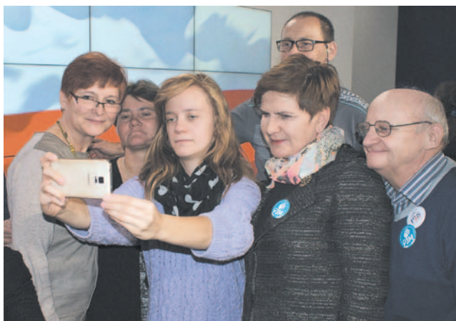
W czasie spotkania z Beatą Szydło przedstawiciele 16 stowarzyszeń zwrócili się z prośbą o pomoc w utworzeniu stanowiska pełnomocnika ds. głuchych

– W Polsce osoby niesłyszące mają znacznie ciężiej niż poza granicami kraju. Sam od