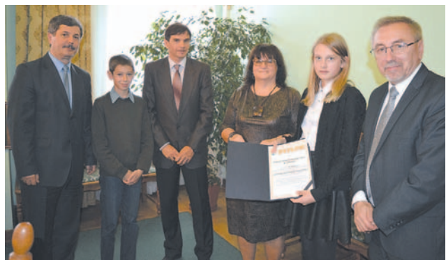
Reprezentanci władz miasta wraz z przedstawicielami SP1, która zajęła najwyższe miejsce z naszych szkół

Znamy już wyniki współzawodnictwa sportowego za poprzedni rok szkolny. Jeszcze przed podsumowaniem wojewódzkim, które w poniedziałek odbyło się w Rzeszowie, władze Sanoka zaprosiły przedstawicieli swoich placówek oświatowych do magistratu, dziękując im za reprezentowanie miasta.