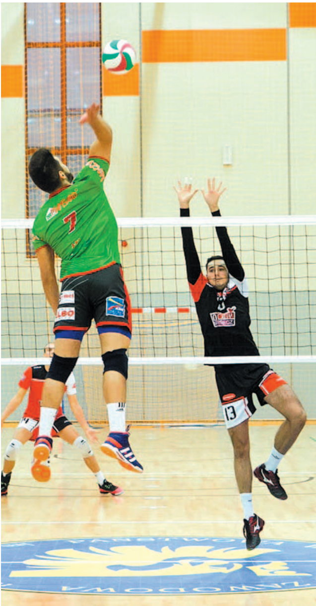
Na razie siatkarze TSV wyraźnie górują nad wszystkimi rywalami

BŁĘKITNI ROPCZYCE – TSV MANSARD TRANS GAZ-TRAVEL SANOK 0:3 (-20, -16, -16)