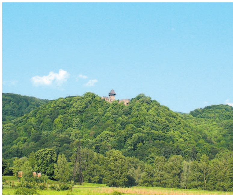
Zamek Niewicki, Ukraina

Legenda autorska inspirowana: Oskar Kolberg „Sanockie-krośnieńskie”, t. 51., Legenda zbójce, Solina.