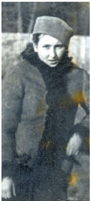
Danuta Siedzikówna „Inka”

Nie miała jeszcze osiemnastu lat. Była młodą, pełną życia kobietą. Typ chłopczyca, która bardzo szybko musiała nauczyć się wojny. Najgorsze miało ją spotkać w „nowej” Polsce. Jeżeli ktoś dzisiaj powątpiewa, że ustrój, który panował w latach 1945-1989 nie był zbrodniczym systemem, to tragiczna historia Danuty Siedzikówny „Inki” i tysięcy zamęczonych w katowniach UB nie pozostawia co do tego złudzeń. Nie ma bowiem półprawd ani półklamstw. Nie rozmienia się na drobne elementarne wartości, a zła nie ukrywa się pod płaszczykiem „epoki błędów i wypaczeń”. I żadne współczesne działania przywracające pamięć pomordowanym nie spowodują, że nagle otworzymy oczy i powiemy: Myśmy w tym jako naród nie uczestniczyli. Byliśmy jedynie lennikami. Po prostu zmuszono nas do kainowej zbrodni. Pamięć pamięcią, ale krwi bezsensownie przelanej nikt i nic nie zmaże!