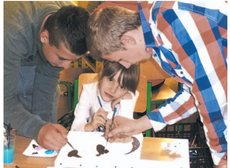
Dzieci w różnym wieku wspólnie uczą się i bawią

Po tylu latach mówię „u nas” w Nowotańcu. Ludzie mnie tam chyba zaakceptowali... Czy ty wiesz, że kiedyś wybrano mnie w Nowotańcu osobowością roku?