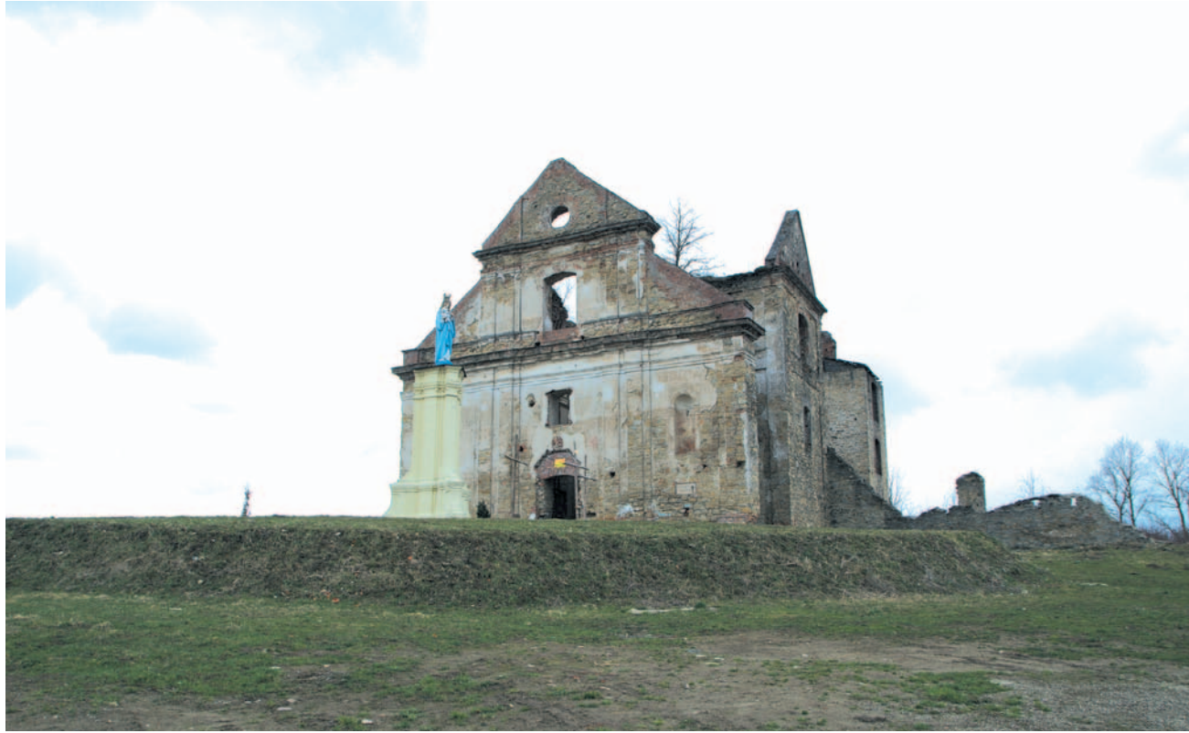
Karmel zagórski przed pracami konserwatorskimi i remontem

Ruiny klasztoru Karmelitów Bosych są jedną z największych atrakcji gminy Zagórz. Systematycznie wzgórze Marymont odwiedza tłumy turystów. Władze samorządowe dokładają starań, by zagórska perelka stawała się coraz piękniejsza. Kolejne prace najprawdopodobniej zostaną przeprowadzone w tym roku. Wyremontowane ma zostać wnętrze budowli.