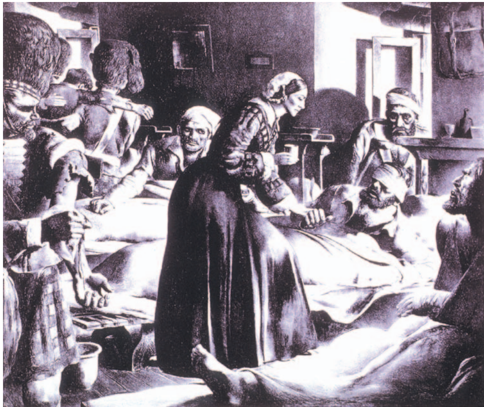
Prekursorka pielęgniarstwa Florence Nightingale

Pielęgnacja i opieka to podstawowe zadania pielęgniarki. Przy każdym spotkaniu z młodszą lub starszą pielęgniarką można usłyszeć te słowa. Credo zawodu. Trzeba pamiętać, że idea ta została wypracowana już przeszło sto lat temu przez prekursorkę pielęgniarstwa Florence Nightingale. Tyle pokrótce mówią teoria i historia, a jak to się przekłada na praktykę?