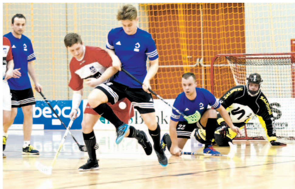
Do końca rozgrywek pozostały już tylko dwie kolejki. Walka trwa na całego

Sanocka Liga Unihokeja Esanok.pl, XX kolejka. Niespodzianki w meczach kończonych rzutami karnymi: prowadzący w tabeli zespół patrona rozgrywek stracił punkt w starciu z Drozdem Wodnikiem, Gimnazjum nr 3 lepsze od Besco. Zwycięstwa po walce odniosły też Sokół i Komputronik, łatwiej poszło ekipom InterQ i PWSZ.