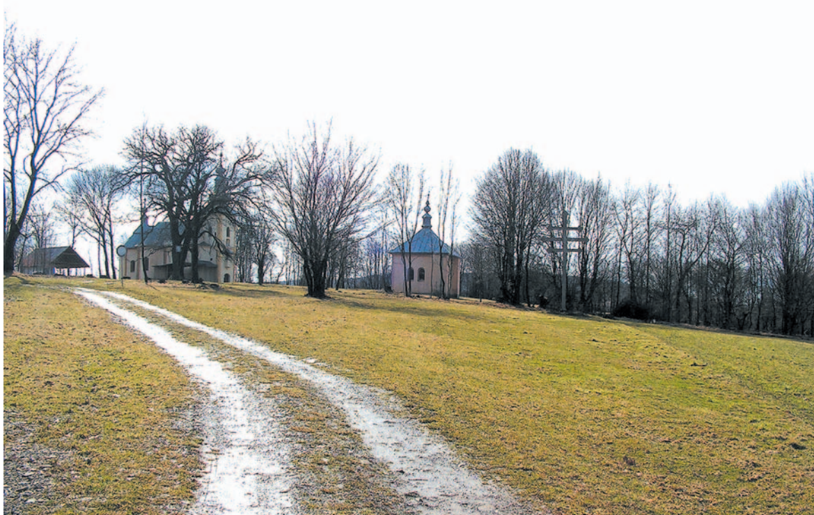
Dawny klasztor Bazylianów – Bukowska Horka, Słowacja

Upatrzył sobie raz zbójnicki hetman córkę solińskiego gazdy, co miał chyłę* na skraju wałalyku* pod samym lasem. Posłał tedy w swaty dwóch kamratów do ojca dziewczyny, o rękę prosić. Wystraili się zbójnicy niby wielcy panowie. Przyszli pod chatę gazdy i wołali, żeby swatów w dom wpuścił. Nie poznał stary, co to za jedni i zapytał: