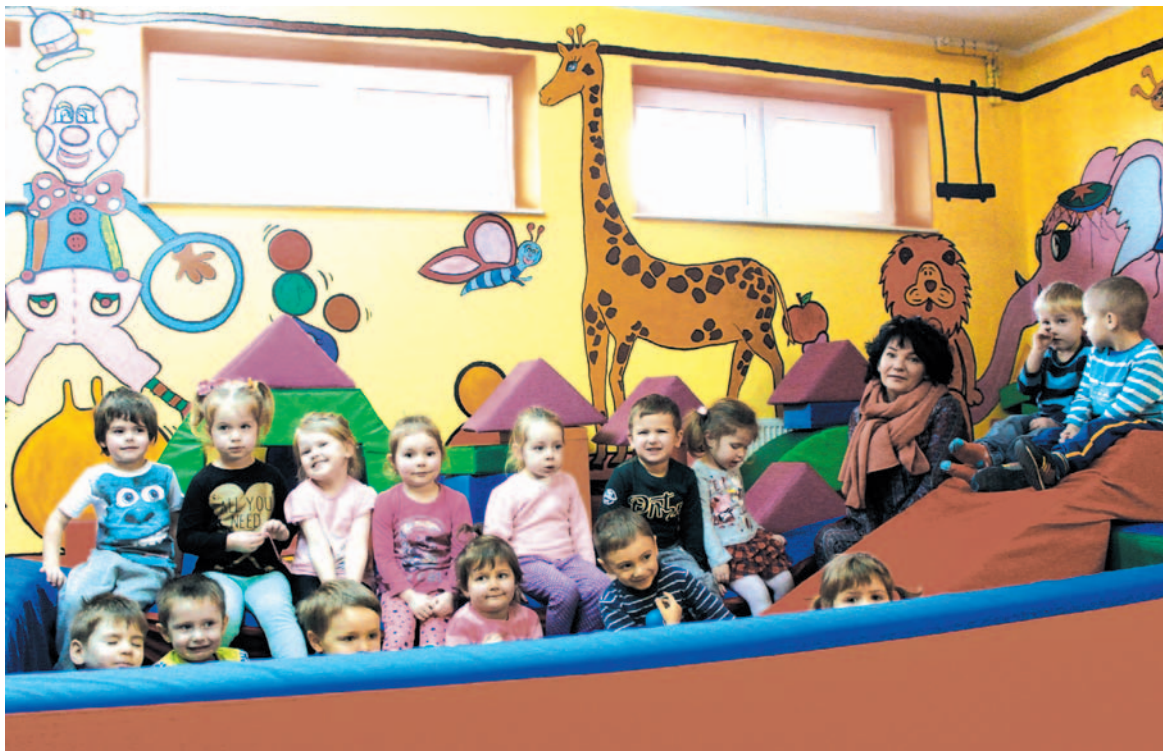
W takiej szkole dzieci mogą być szczęśliwe

Uważam i będę tego bronić: wprowadzenie do jednego budynku dzieci w różnym wieku przynosi same korzyści. Nasi uczniowie nie tylko nie wyrządzają sobie nawzajem krzywdy, ale są wobec siebie opiekuńczy, nawiązują przyjaźnie i wręcz braterską współpracę. Nie oddzielamy dzieci od siebie; gimnazjum jest na górze, nauczanie zintegrowane na pierwszym piętrze, a przedszkolaki na dole, ale to nie znaczy, że te różne grupy wiekowe nie spotykają się na przerwach czy podczas szkolnych uroczystości. Kiedy przedszkolaki maszerują na obiad, starsze dzieci witają się z nimi, zagadują. Dla mnie to jest wspaniała sprawa, kiedy widzę gimnazjalistę wzrostu, dajmy na to, metr osiemdziesiąt, naprzeciw nie-