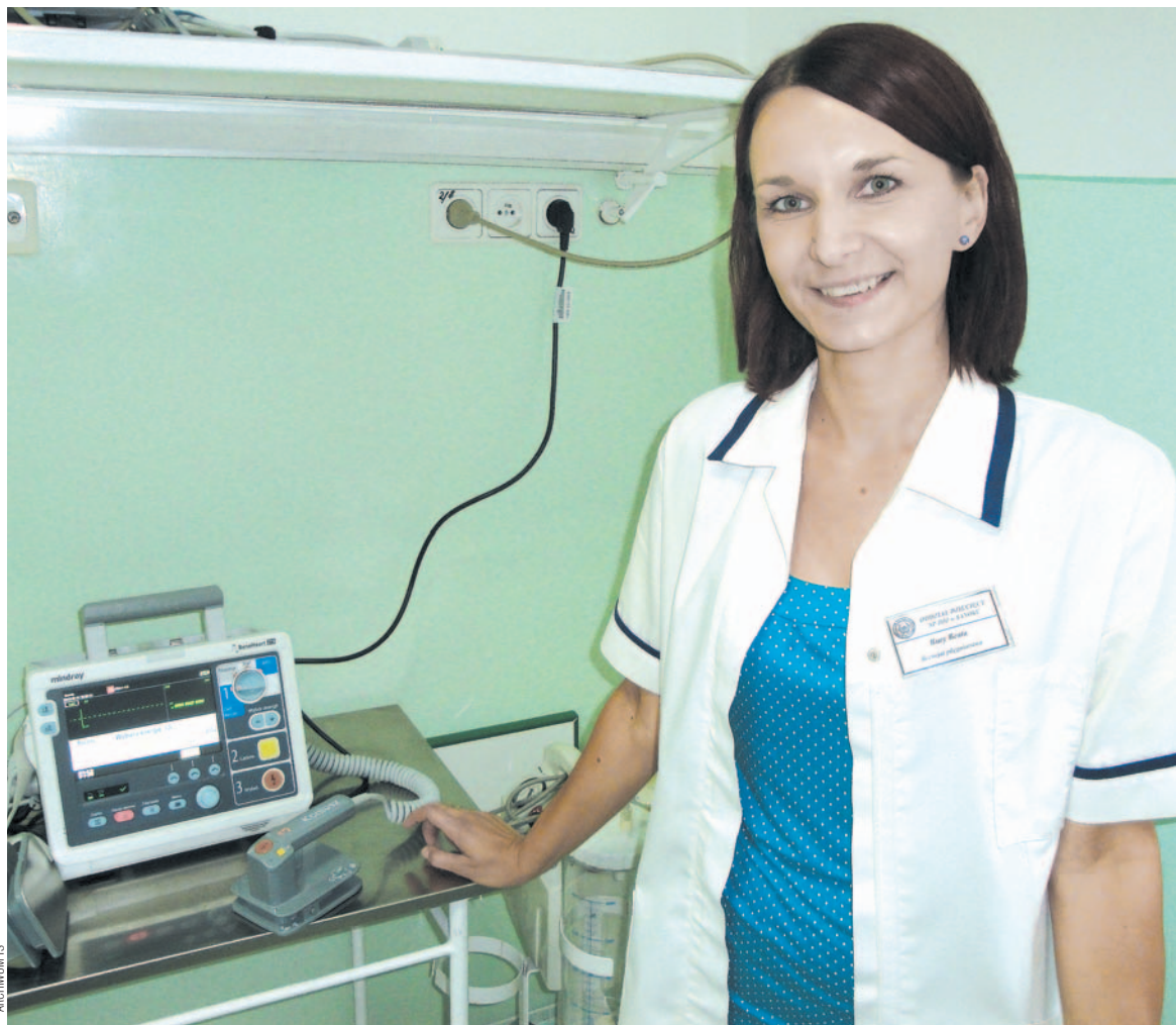
Absolwentka kierunku Pielęgniarstwo Państwowej Wyższej Szkoły Zawodowej w Sanoku