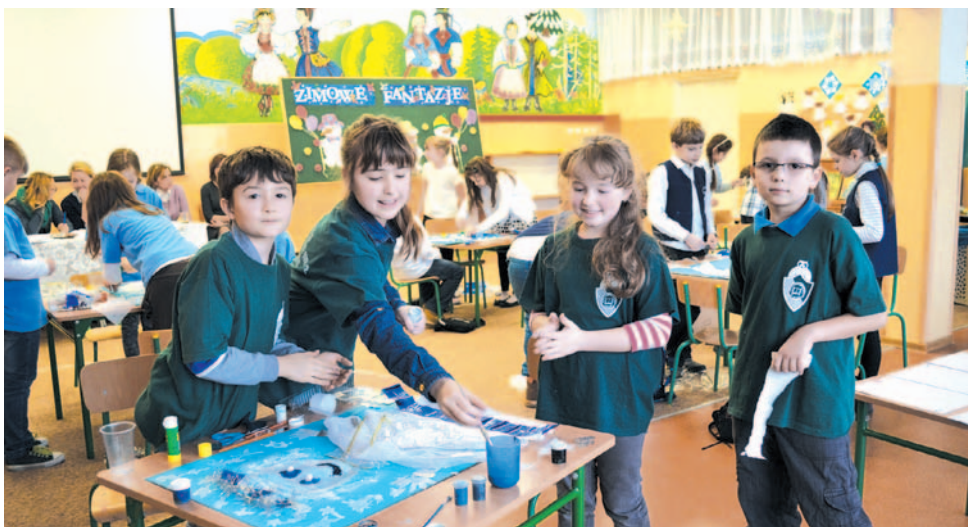
Zwycięska drużyna z SP2

Najmłodszy chętnie przystępuje do rywalizacji – konkursy są dla nich doskonałym sposobem na połączenie nauki i zabawy. W lutym w Szkole Podstawowej nr 3 odbył się VII Międzyszkolny Konkurs „Zimowe fantazje”. Do rywalizacji przystąpiły czteroosobowe drużyny z klas trzecich SP1, SP2, SP3, SP6, SP7.