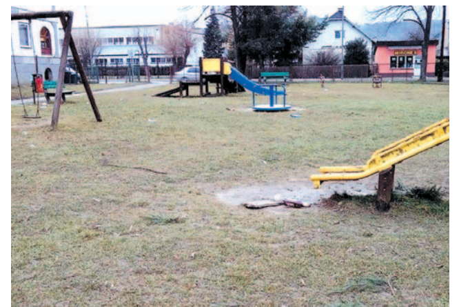
Czy tak ma wyglądać plac zabaw dla dzieci?

Do sprawy ogródka jordanowskiego na Wójtostwie jeszcze wrócimy. TM