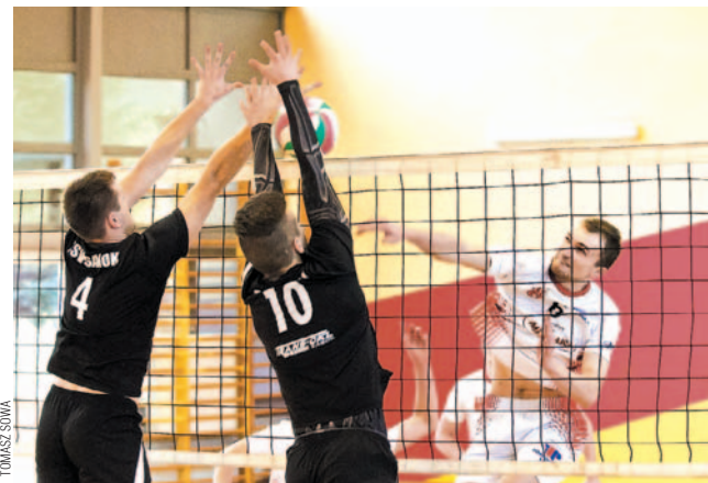
Blok TSV był momentami nie do sforsowania

Rehabilitacja rezerw TSV za porażki w dwóch poprzednich meczach, co przekreśliło szanse awansu do III ligi. A zarazem powtórka wyniku z Czudca. Tym razem kluczem do zwycięstwa okazały się ataki z krótkiej.