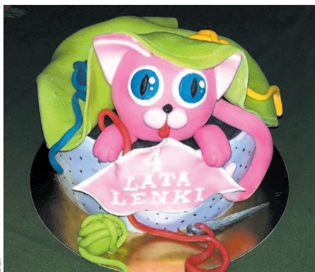
Piękny i smakowity prezent na urodziny