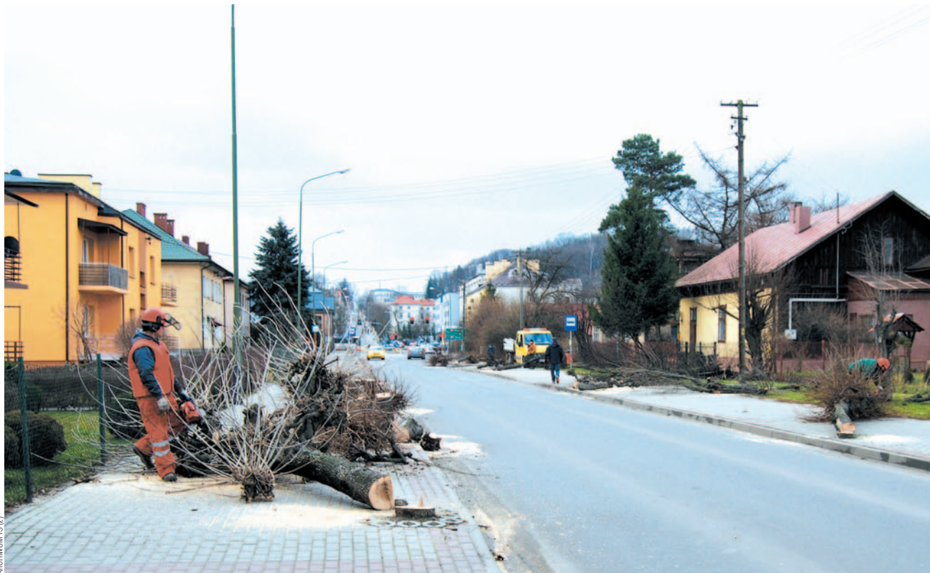
Wiosną 2014 r., na ulicy Mickiewicz, w ciągu jednego dnia poszło pod siekiere 26 drzew. Widok był szokujący. Zgodę, na wniosek Powiatowego Zarządu Dróg, wydał burmistrz. Inwestor uzasadniał, że drzewa były częściowo obumarłe, rosły tuż przy krawędzi jezdni i przeszkadzały kierowcom.

Zostały też obniżone kary administracyjne za usu-