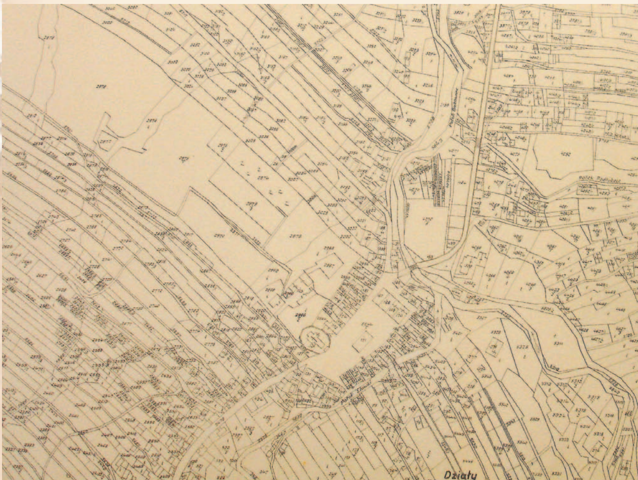
Mapa katastralna Bukowska z 1906 r.