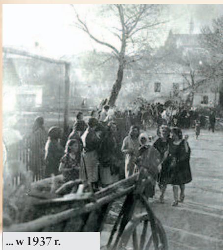
... w 1937 r.