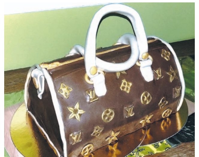
Słodki kuferek Louis Vuitton

Z niedowierzaniem oglądam kolekcję zdjęć tortów, które jak torty w ogóle nie wyglądają. W kształcie torebek,