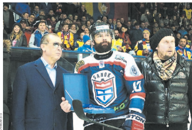
Sezon zakończył się dla nas w Nowym Targu, gdzie przedstawiciele drużyny Ciarko PBS Bank STS odebrali paterę za zajęcie 4. miejsca