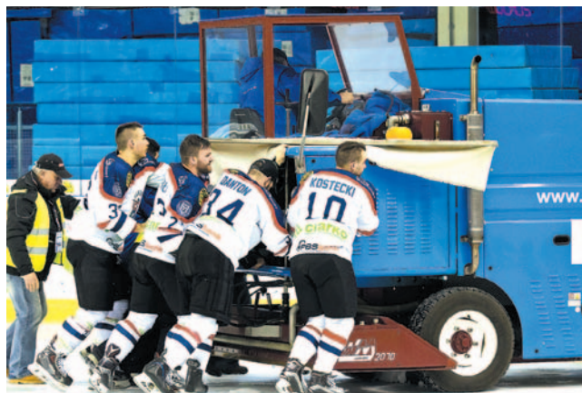
W meczu z Unią Oświęcim kontuzji doznała... rolba