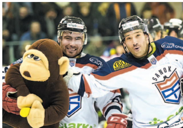
Tuż przed Gwiazdką była kolejna odsłona akcji Teddy Bear Toss