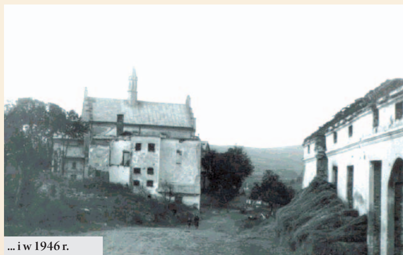
... i w 1946 r.

dowości. Mimo to miejscowość wciąż było ludna. W 1921 r. istniało tu 409 budynków, mieszkało 2302 Polaków, 44 Rusinów i 800 Żydów. 10 lat później liczba polskich mieszkańców wzrosła do ponad 2700.