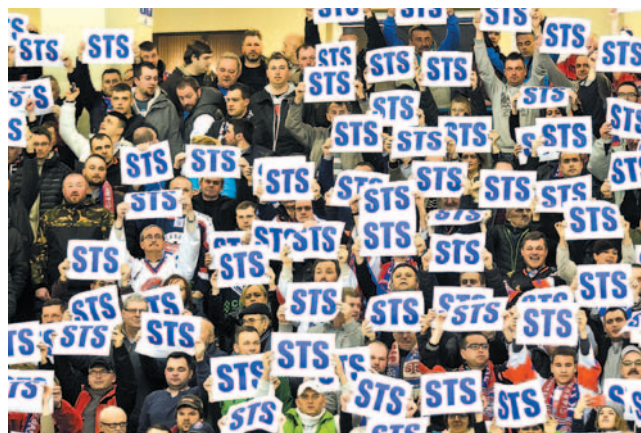
Kto wie, czy największymi zwycięzami sezonu nie byli kibice STS. Ich wspaniały doping pomagał drużynie w trudnych momentach