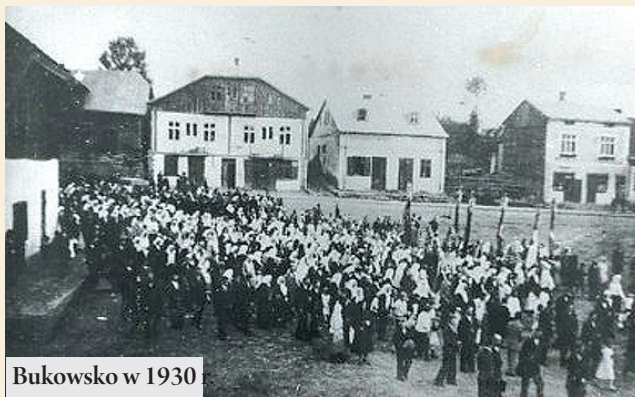
Bukowsko w 1930