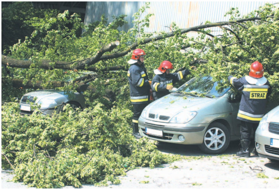
W maju 2011 r. runęła lipa rosnąca na skraju parku, uszkadzając trzy samochody. Drzewo było przeznaczone do wycinki. Przepolowało się jak zapalka w dniu, kiedy do urzędu miasta dotarła ze starostwa zgoda na wycinkę...

Czy decyzje dotyczące wycinek są podejmowane w Sanoku zbyt łatwo i pochopnie – jak twierdzą miłośnicy i obrońcy drzew – trudno rozstrzygnąć. Każdy przypadek jest indywidualny i wymaga odrębnej analizy. Jedno jest pewne: burmistrz i urzędnicy muszą troszczyć się o przyrodę i interes publiczny, a z drugiej uwzględnić potrzeby inwestorów i właścicieli działek. Wiele gmin koncentruje swoje wysiłki na odtworzeniu usuniętej zieleni, prowadzeniu przemyślanych nasadzeń zastępczych i polityki przestrzennej. Może o głębszą diagnozę problemu pokusiła się Komisja Ochrony Środowiska i Porządku Publicznego Rady Miasta? Wywołujemy do tablicy.