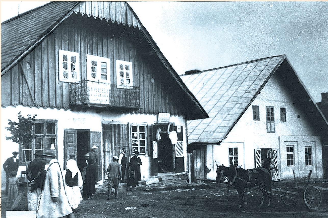
Rynek w Bukowsku

Przez stulecia Bukowsko, będące w posiadaniu m.in. Sienińskich, Stadnickich i Ossolińskich, stanowiło ważny ośrodek gospodarczy tych terenów. W pierwszej połowie XVIII w. osada uzyskała prawa miejskie i przywilej targowy, utworzono tu odrębną parafię. Na wzrost znaczenia miasta niewątpliwie wpływ miał tragiczny pożar nieodległego Nowotańca. W kolejnych dziesięcioleciach Bukowsko intensywnie się rozwijało, powstawały nowe budynki i ulice.