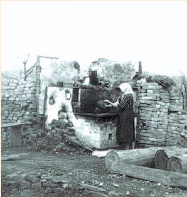
Ruiny domu spalonego przez UPA