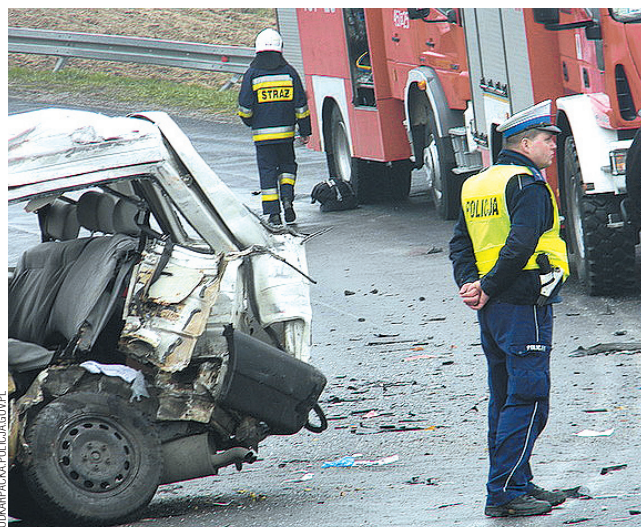
Rozmiary dramatu, do którego doszło w Weryni, wręcz porażające. W wypadku samochodowym zginęło pięciu piłkarzy Wólczanki. To największa tragedia w historii podkarpackiego futbolu