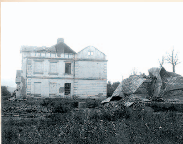
Spalony budynek szkoły w Bukowsku

Mieszkańcy samego Bukowska częściowo podzielili los innych mieszkańców okolicznych miejscowości. Część z nich została wysiedlona na Ziemię Zachodnie, jak określano w oficjalnej propagandzie tereny przyłączone do Polski po II wojnie światowej. Trzy fale uchodźców z Bukowska (około trzydziestu rodzin) w maju i grudniu 1946 r. oraz latem 1947 r. przybyły do miejscowości Niemyślin w obecnym województwie zachodniopomorskim. Kilka rodzin osiedliło się m.in. w Szczecinie, Rybniku i Wrocławiu. Reszta rozproszyła się po okolicy. W spalonym mieście uchowało się w prymitywnych lepiankach i szalaskach ledwie 32 rodziny usiłujące na nowo budować swoje życie. Bukowsko straciło po ponad dwustu latach prawa miejskie, część publicznych instytucji już do miejscowości nie wróciła.