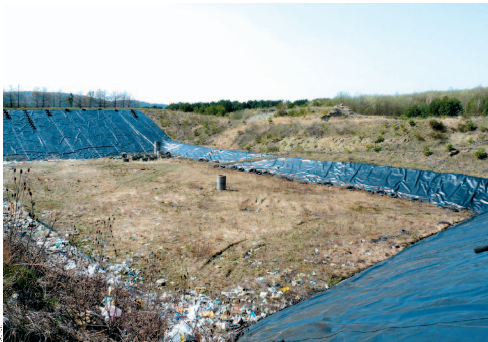
Druga kwatery, przewidziana na 120 tys. m 3 odpadów

Powstał zatem projekt wybudowania profesjonalnej kompostowni, do której