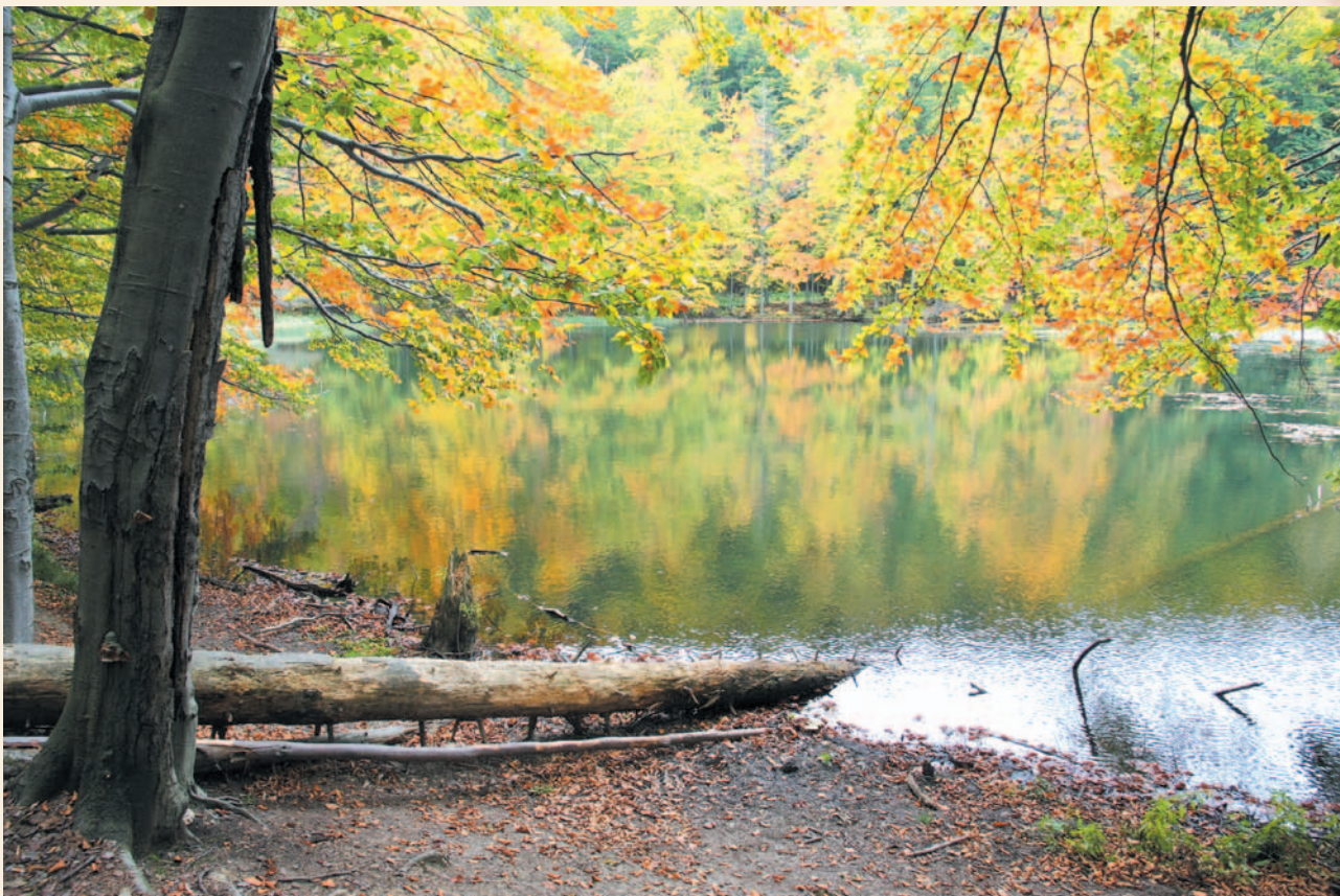
Jezioro Duszatyńskie Górne

Dla miejscowej, zabobonnej ludności jasne było, że za osunięciem się stoku Chryszczatej musiały stać nieznanne, tajemne siły. Miejscowi mówili, że „zwiezło” ziemię za sprawą trzech śpiących tu, zaklętych w kamień olbrzymów. Stąd też być może powstanie akurat trzech zbiorników wodnych. Inni, nieco światlejsi, silili się na doszukiwanie się „naukowego” wytłumaczenia i opowiadali, że zapewne w stok masywu uderzył meteoryt. Oczywiście, nie brak było i takich (zapewne wielu), którzy twierdzili, że za niespotykanym