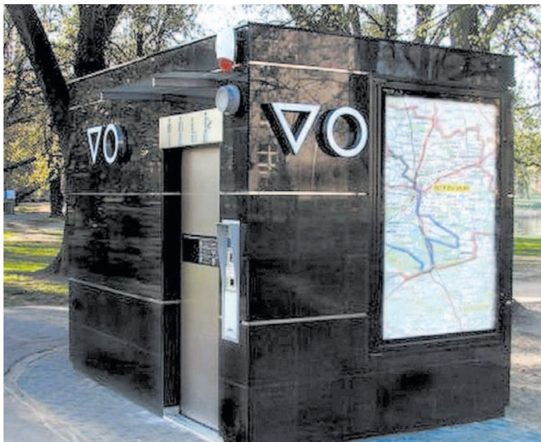
Szalety w wersji „full” kosztują niemal, mimo to wiele miast nie żałuje na nie pieniędzy

sady podziału pieniędzy. Wiadomo już, że na dworzec dostaniemy maksymalnie 10 mln zł, zamiast planowanych 14 mln, jak pierwotnie ustalono. Poza tym, aby je otrzymać, trzeba będzie przejść postępowanie konkursowe, które wcale nie daje gwarancji pozytywnego rozstrzygnięcia. Jedno jest pewne – dopóki w Sanoku dworzec będzie wyglądał jak relikwiarz PRL-u, bez porządnego toalet, obcojęzycznej informacji i elektronicznej obsługi pasażerów, a autobusy i busy będą wyjeżdżały z trzech różnych, oddalonych od siebie miejsc, dopóty turystyczne sny o potęgę można schować między bajki. Zgrzebnej rzeczywistości nie da się zakłócić nawet najbardziej barwną strategią rozwoju.