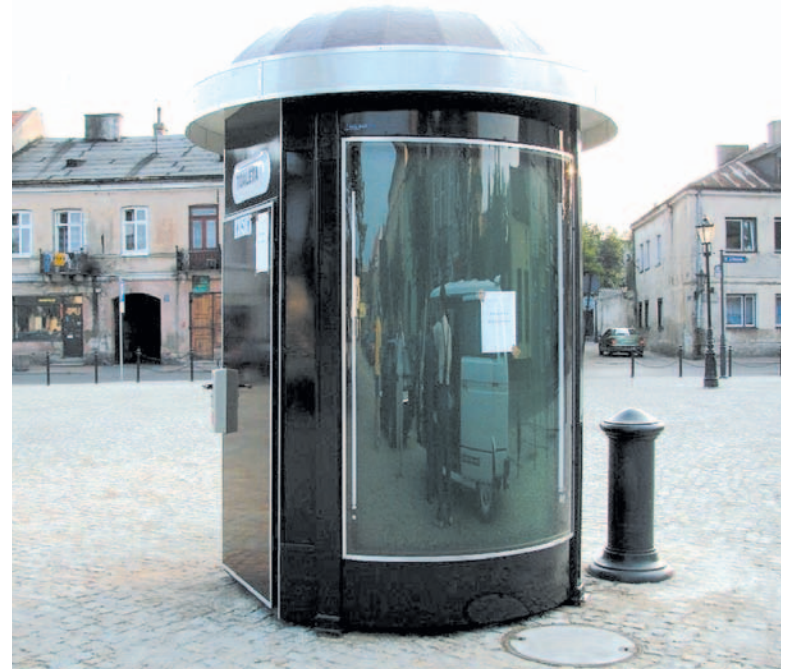
Jednokabinowy model za 50 tys. zł także prezentuje się znakomicie

Pytanie: kiedy będą? Z ostatnich doniesień wynika, że 40 mln zł, na jakie Sanok liczył w ramach MOF z puli finansowej na lata 2016-2020, wcale nie jest pewne. Zarząd województwa zmienił bowiem za-