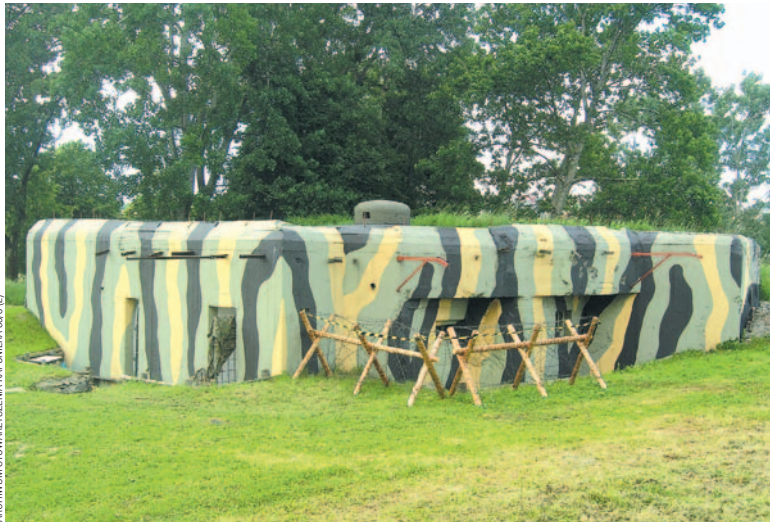
Schron bojowy Linii Mołotowa w Przemyślu przy Hotelu „Gromada”

– Tak. Działa od 2012 roku. Prowadzimy go w sezonie letnim. Tak się umówiliśmy, że będziemy tam dyżurować w określonym czasie, w so-