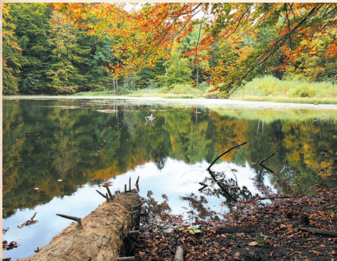
W lustrze wody odbijają się gałęzie rosnących tu buków, nadając wodzie niezwykłą, zielonkawą barwę

zjawiskiem musiał stać sam diabeł. W okolicy niesamowite huki i zjawiska przypominające trzęsienia ziemi (miały ponoć z różnych natężeniem trwać trzy tygodnie) wywołały popłoch. Niektórzy wydawało się, że Chryszczata za chwilę „rozkoli się i zakryje sielo” (zakryje całą wieś).