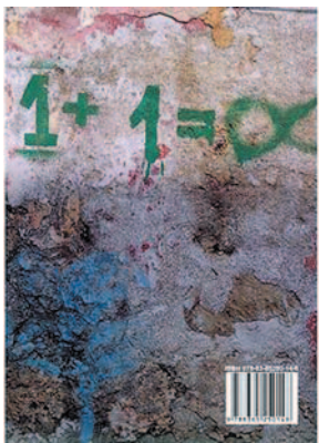
Wasyl Machno Express „Venezia”

Ostatnio nawet w zapowiedzi premiery kinowej, planowanej dopiero na jesień bieżącego roku, przeczytałem już, że to „głośny film”. Cóż... Głuchło wszędzie, ciemno wszędzie... w tej globalnej wiosce.