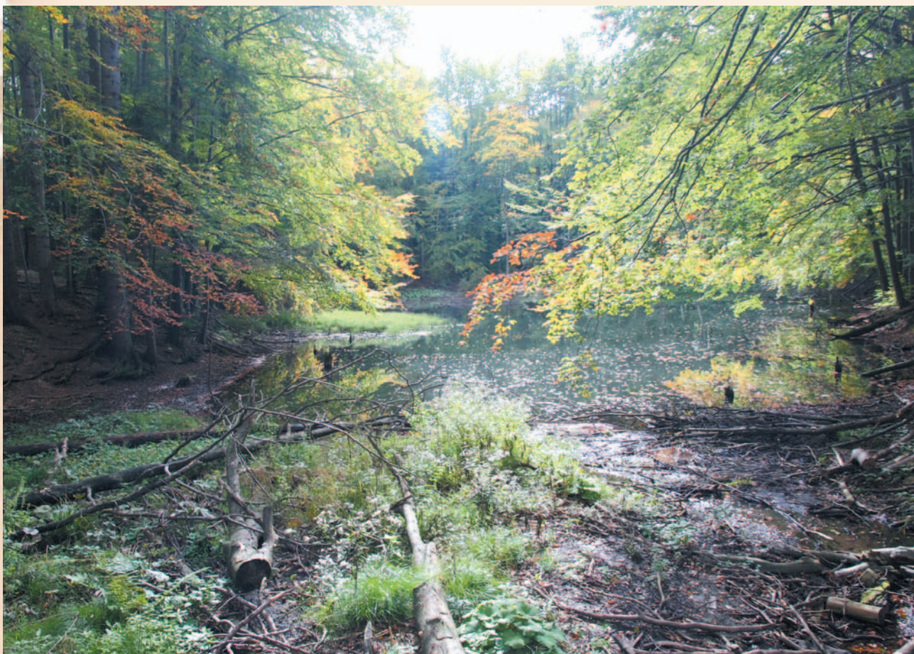
Jezioro Duszatyńskie Dolne