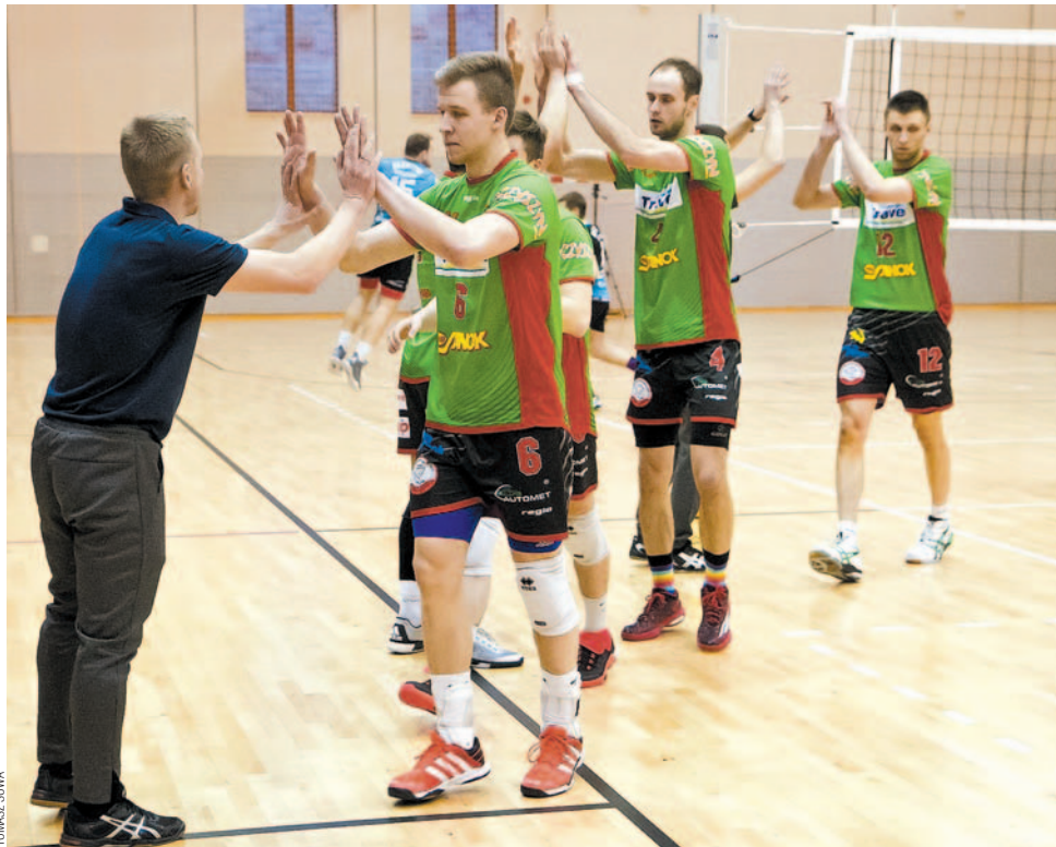
Półfinałowy turniej siatkarze TSV zagrają na wyjeździe, ale jeżeli uda im się wywalczyć awans do finałowego, to jeszcze w tym sezonie znów możemy zobaczyć ich w akcji

Mimo starań klubu zespół TSV Mansard Trans-Gaz Travel nie będzie gospodarzem jednego z trzech turniejów półfinałowych o awans do I ligi. Wydział Rozgrywek Polskiego Związku Piłki Siatkowej wybrał kandydaturę Jaworzna. Zawody już za dwa tygodnie.