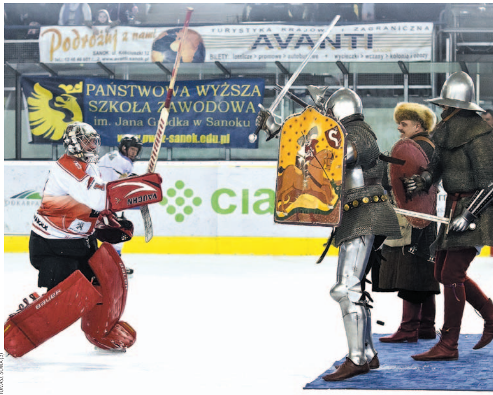
W pewnym momencie na lodzie pojawili się nawet rycerze. Ich wyzwanie przyjął bramkarz gości