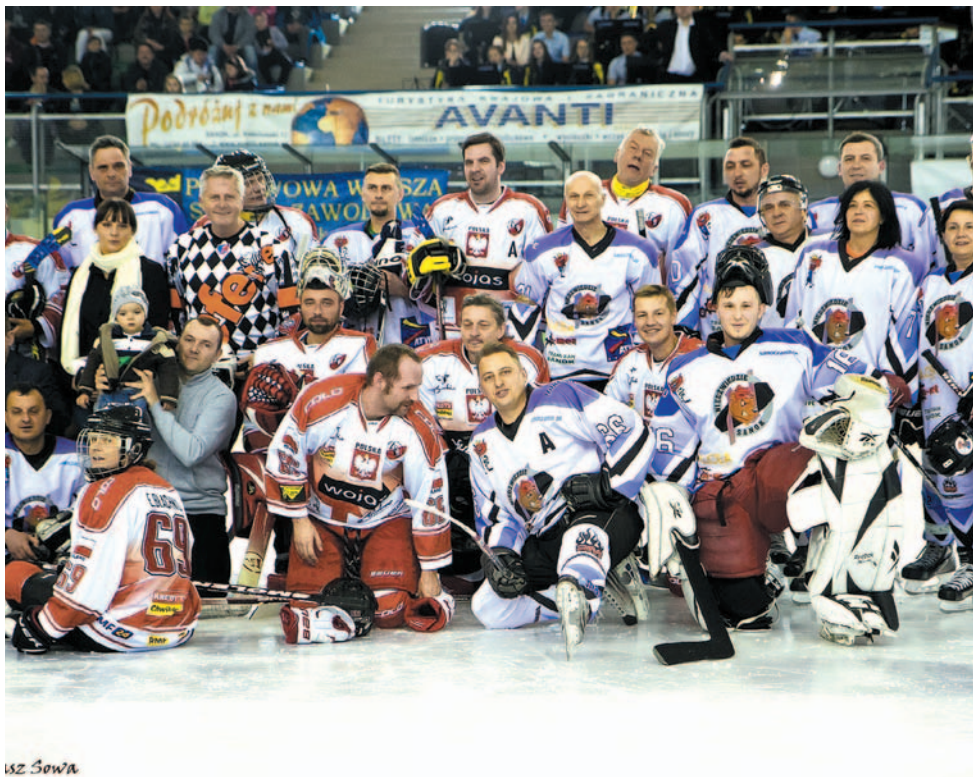
Artyści, Niedźwiadzi i VIP-y – wielka hokejowa rodzina