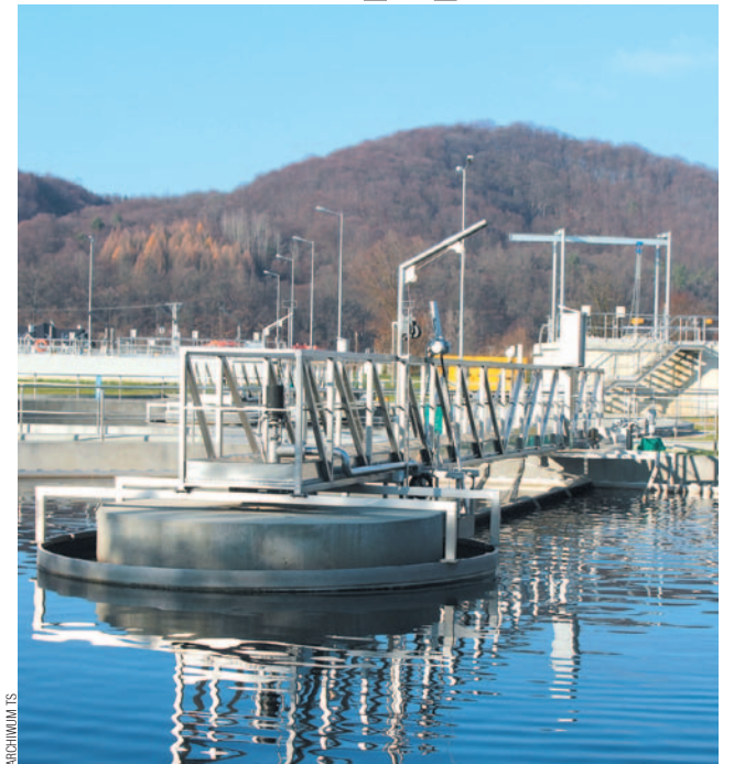
Jeśli do kanalizacji trafiają ścieki z dużym ładunkiem zanieczyszczeń, oczyszczalnia ścieków w Trepczy „robi bokami”