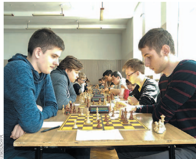
Juniorzy Komunalnych zakończyli zmagania ligowe

Młodzi szachiści Komunalnych zakończyli rozgrywki III ligi podkarpackiej. Podczas finałowego zjazdu, który odbył się w Rzeszowie, nasz zespół zanotował porażkę i zwycięstwo, ostatecznie zajmując 7. miejsce w tabeli.