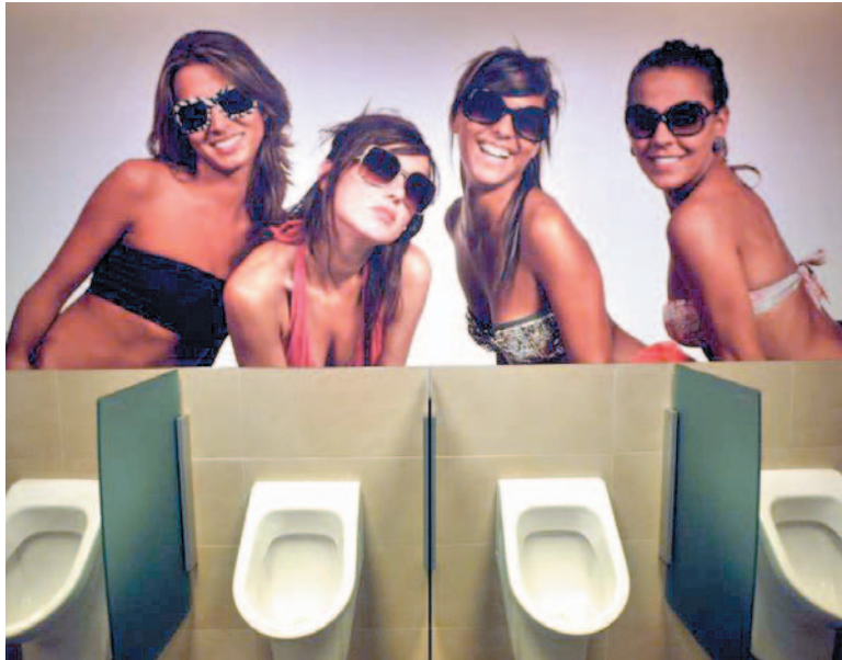
W takiej scenarii nawet prozaiczne sikanie może stać się przyjemnością...

Nie wiedziałem, co mam powiedzieć tym dzieciom – było mi okropnie wstyd, czułem się paskudnie... Trójka najbardziej zdesperowanych próbowała jeszcze szukać ratunku na dworcu PKS, ale i tam toaleta była już nieczynna. W końcu schowali się za jakimś murkiem i tam wysikali – opowiada z zażenowaniem jeden z bieszczadzskich przewodników. – To nie do pomyślenia, aby w 40-tysięcznym mieście, które ma ambicje turystyczne i strategię rozwoju opartą na turystyce, nie było czynnej toalety na dworcu! W XXI wieku! Nieważne, ile pociągów jeździ – w pobliżu są przecież całodobowe przystanki busów, z drugiej strony dworzec autobusowy – pasażerowie powinni mieć możliwość skorzystania z ubikacji i to przez całą dobę. A co oferuje Sanok? Publiczne sikanie pod ścianą albo w krzakach! Turysta, który tu trafia, doznaje szoku. Nie tylko z powodu niemożności załatwienia potrzeb fizjologicznych. Jeśli jest obcojęzyczny, nie ma szans na uzyskanie jakichkolwiek informacji – wszystkie rozkłady jazdy i komunikaty są dostępne wyłącznie w języku polskim. Z perspektywy dworca nie jesteśmy więc ani miastem turystycznym, ani mia-