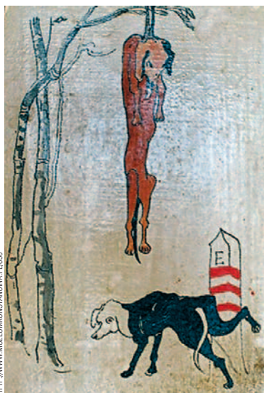
Leopold Buczkowski „Droga do lasu”