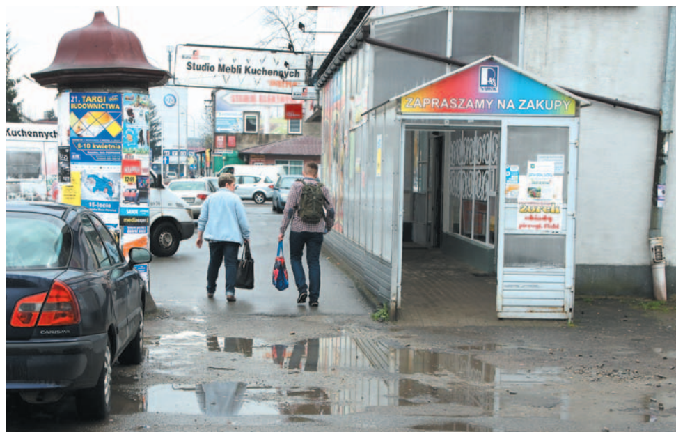
W końcu trzeba uporządkować i ucywilizować teren wokół sklepu AS. Temat wraca od lat, ale do tej pory nie było mocnych, aby go ruszyć. Miejmy nadzieję, że uda się to nowej radzie

Dyżury: wtorki, godz. 17-18 Telefon: (13) 42 414 12 E-mail: dzielnica.posada@g-mail.com