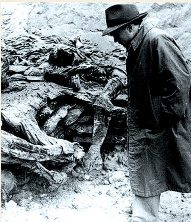
Katyn miejsce egzekucji

Lista „sanockich” ofiar Katynia i innych miejsc kaźni na Wschodzie jest wciąż bardzo niepełna. O wielu mieszkań-