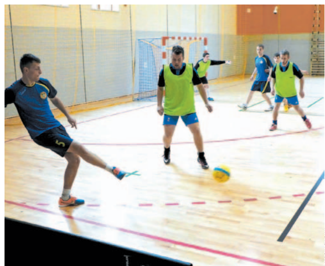
Nowoczesna hala przy PWSZ coraz częściej staje się areną lokalnych rozgrywek. Tylko się cieszyć, że sportowcy mogą rywalizować w tak komfortowych warunkach

Impreza w hali Centrum Sportowo-Dydaktycznego przy Państwowej Wyższej Szkole Zawodowej, gdzie ponownie najlepsze okazało się II Liceum Ogólnokształcące, powtarzając sukces z jesiennych zawodów siatkówki. Dwoje reprezentantów „dwójki” otrzymało nagrody indywidualne.