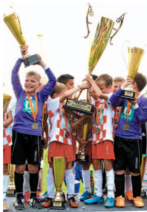
Udział w finale Minimistrzostw DEICHMANN to dla modych piłkarzy wielkie przeżycie

Rywalizacja rusza już w sobotę, a zakończy się pod koniec czerwca ogólnopolskim finałem w Wałbrzychu. Do rozgrywek organizowanych na naszym terenie przez Ekoball zgłosiło się 25 drużyn (blisko 250 zawodników) w czterech kategoriach wiekowych. Rozegranych zostanie około 200 spotkań.