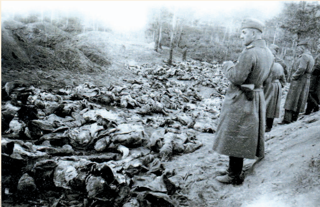
Doly śmierci w Katyniu