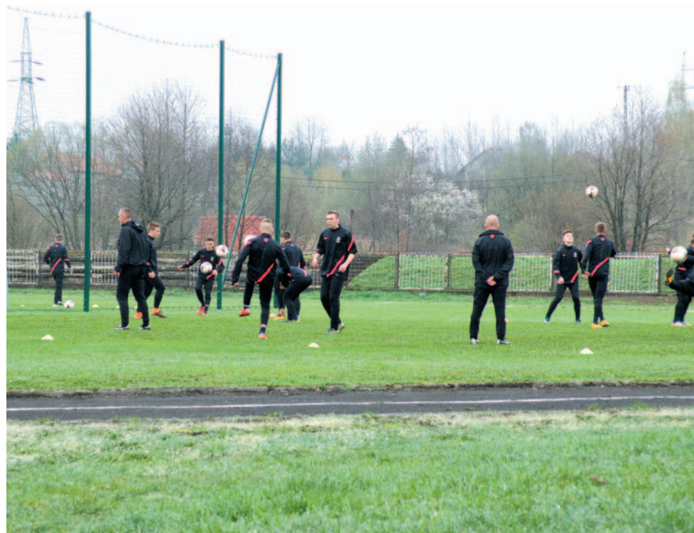
Młodzi kadrowicze chwalili sobie warunki treningowe na stadionie centrum „WIKI”

Po blisko 20 latach przerwy znów gościliśmy piłkarską reprezentację Polski. Tym razem kadrę do 15 lat, która na stadionie Rodzinnego Centrum Sportu i Rekreacji WIKI zaliczyła dwa treningi w ramach przygotowań do Turnieju Trzech Narodów w Krośnie.