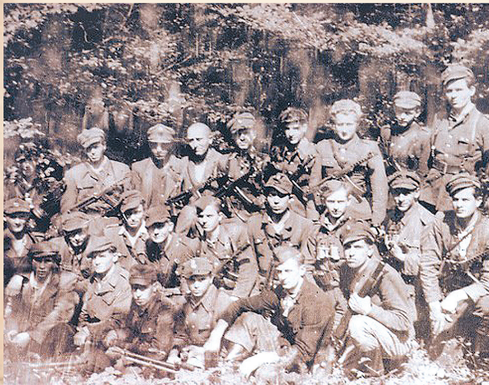
Członkowie UPA odcinka „Lemko”

Wysiedlenia miały być prowadzone równocześnie z aktywną likwidacją sił UPA na tym terenie. Według danych operacyjnych dowództwa GO „Wisła” na dzień 1 kwietnia 1947 r., liczbę aktywnych, uzbrojonych członków UPA szacowano na ponad 2400 osób. Do tego dochodziła liczna grupa członków cywilnych siatek OUN czy lokalnej samoobrony.