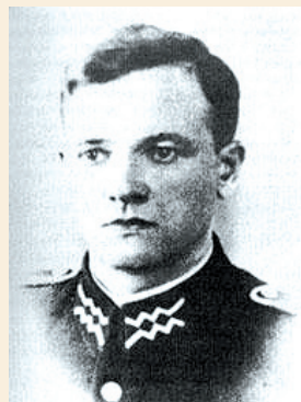
Wasyl Mizerny „Ren” – dowódca UPA na ziemi sanockiej