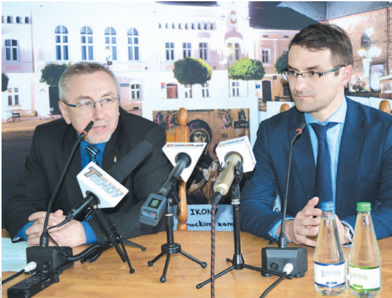
Burmistrz Tadeusz Pióro i poseł do Parlamentu Europejskiego Tomasz Poręba

komunikacyjnie. Ministerstwa Transportu i Rozwoju Regionalnego zapewniają, że zabezpieczą środki niezbędne dla wybudowania odcinka z Rzeszowa do Babicy, a to bardzo duży „krok” w kierunku na Barwinek. Chciałbym podkreślić, że droga S19 to obecnie priorytet dla polskiego rządu – informował Tomasz Poręba.