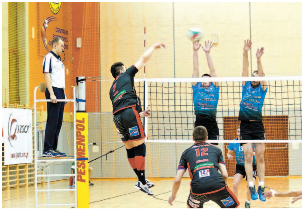
Siatkarze TSV (ciemne stroje) w bojowych nastrojach jadą na turniej do Jaworzna

Zespół siatkarzy TSV Mansard Trans-Gaz Travel wyjechał do Jaworzna na Półfinałowy Turniej Barażowy o Awans do I Ligi. Jeżeli uda mu się zająć przynajmniej 2. miejsce, uzyskując kwalifikację do zmagania finałowych, będzie to największy sukces w historii seniorskiej siatkówki w Sanoku.