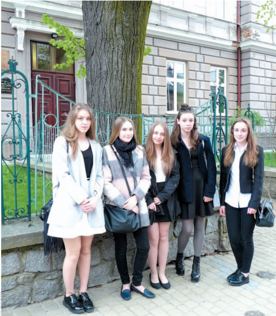
Uczennice G2 przed egzaminem z języka polskiego nie miały wątpliwości, że sobie poradzą

Sanoccy gimnazjaliści coraz częściej myślą o kontynuowaniu nauki poza rodzin-