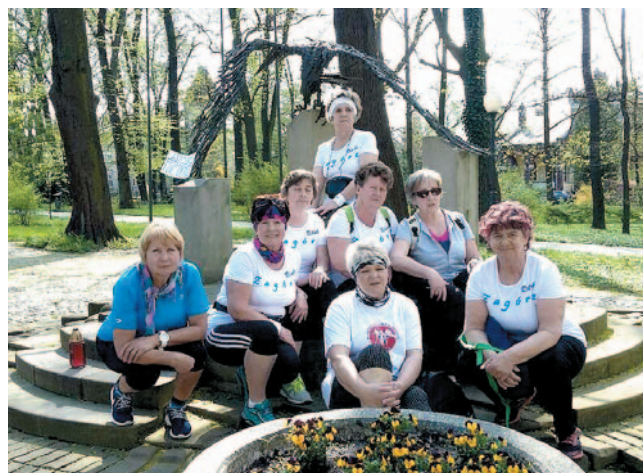
Zawodniczki Relaksu Zagórz

Na koniec wróćmy jeszcze do zasadniczej części imprezy w Jaśle, czyli biegu. Stach zdecydował się wystartować na 5 km, w stawce blisko 200 osób. Generalnie finiszował jako 12. z wynikiem 18,43, przy okazji odnosząc zwycięstwo w najmłodszej kat. wiekowej.