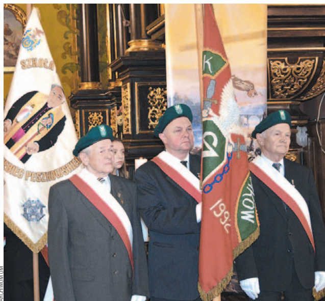
Poczet sztandarowy Związku Sybiraków