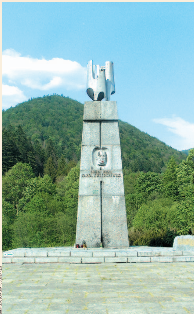
Pomnik gen. Karola Świerczewskiego w Jabłonkach

Za oficjalną datę zakończenia akcji uznaje się 31 lipca 1947 r. Ostatnie wysiedlenia pojedynczych osób, które można uznać za efekt Akcji „Wisła”, miały jednak miejsce nawet w latach 50. XX w. Według wojskowych raportów, w działaniach przeciwko UPA zabito 535 bojowników, łączne straty