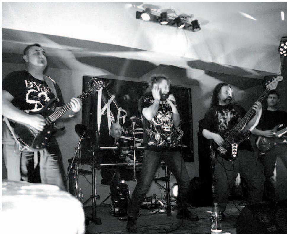
Grupa Kretes dała niezłego czadu w Jack's House Music Pub