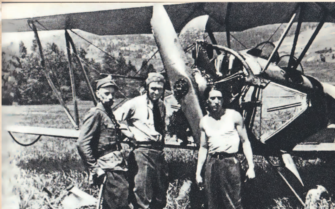
Samolot Po-2 uszkodzony podczas walk z bandami UPA w Bieszczadach

Teoretycznie ziemie opuszczone przez ludność ukraińską miały zostać zasiedlone przez polskich przesiedleńców. Rzeczywistość odbiegała jednak od planów. Przybywających było znacznie mniej niż zakładano – do czerwca 1947 r. osiedlono tu 6600 Polaków, do lipca 13 500. Na przeszkodzie stanęły trudne warunki bytowe na terenach Polski południowo-wschodniej, ale w dużej mierze także fakt, iż stawiające opór oddziały UPA planowo paliły opuszczone gospodarstwa i całe wsie, aby nie dopuścić do ich wykorzystania przez polskich osadników. W efekcie wiele miejscowości przetrwało tylko na starych mapach.