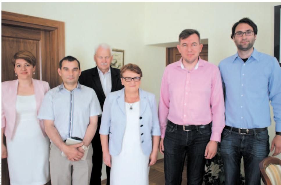
Współpraca między PWSZ i PASS-POL została przypieczętowana wspólnym zdjęciem