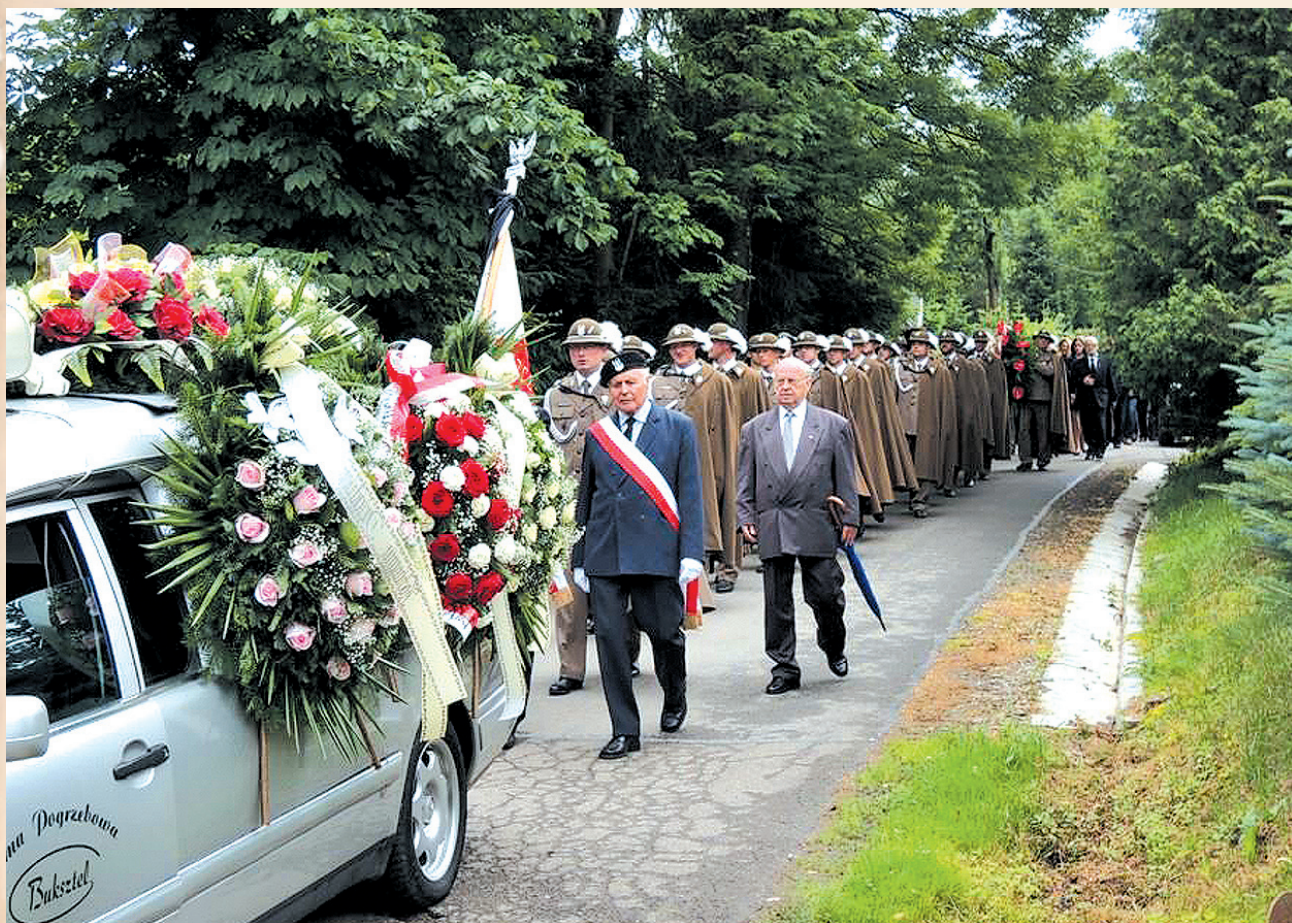
Kondukt pogrzebowy. 28 czerwca 2016 r.