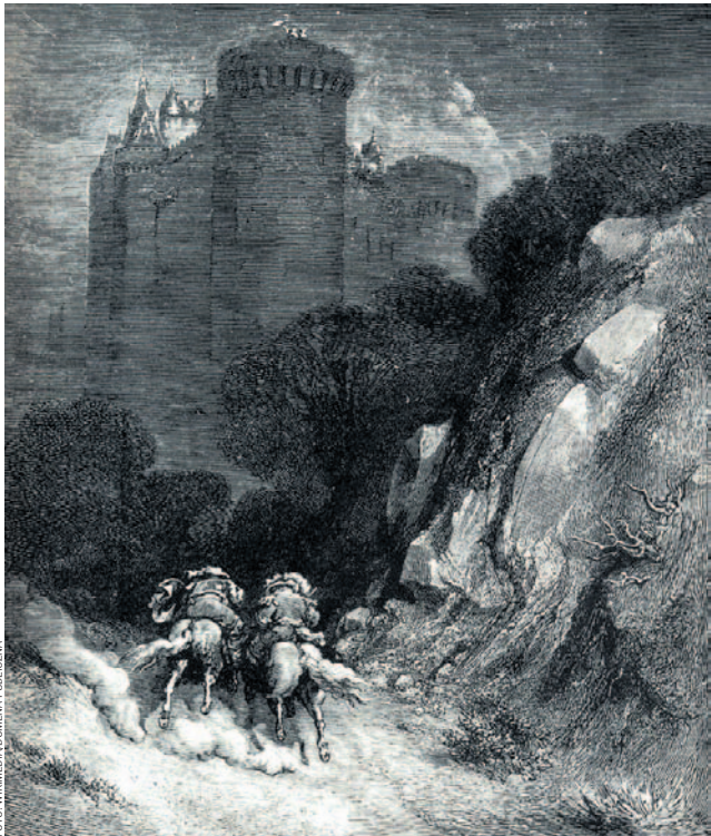
Gustave Doré, ilustracja do „Sinobrodego”

Baśnie i legendy miały jednakże również, a może przede wszystkim, charakter dydaktyczny. Miały uczulić słuchacza na grożące mu w życiu realne lub mityczne