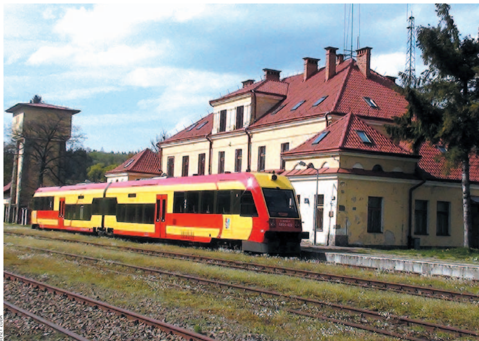
Pociąg „Bieszczadzki Żaczek” na stacji w Łupkowie