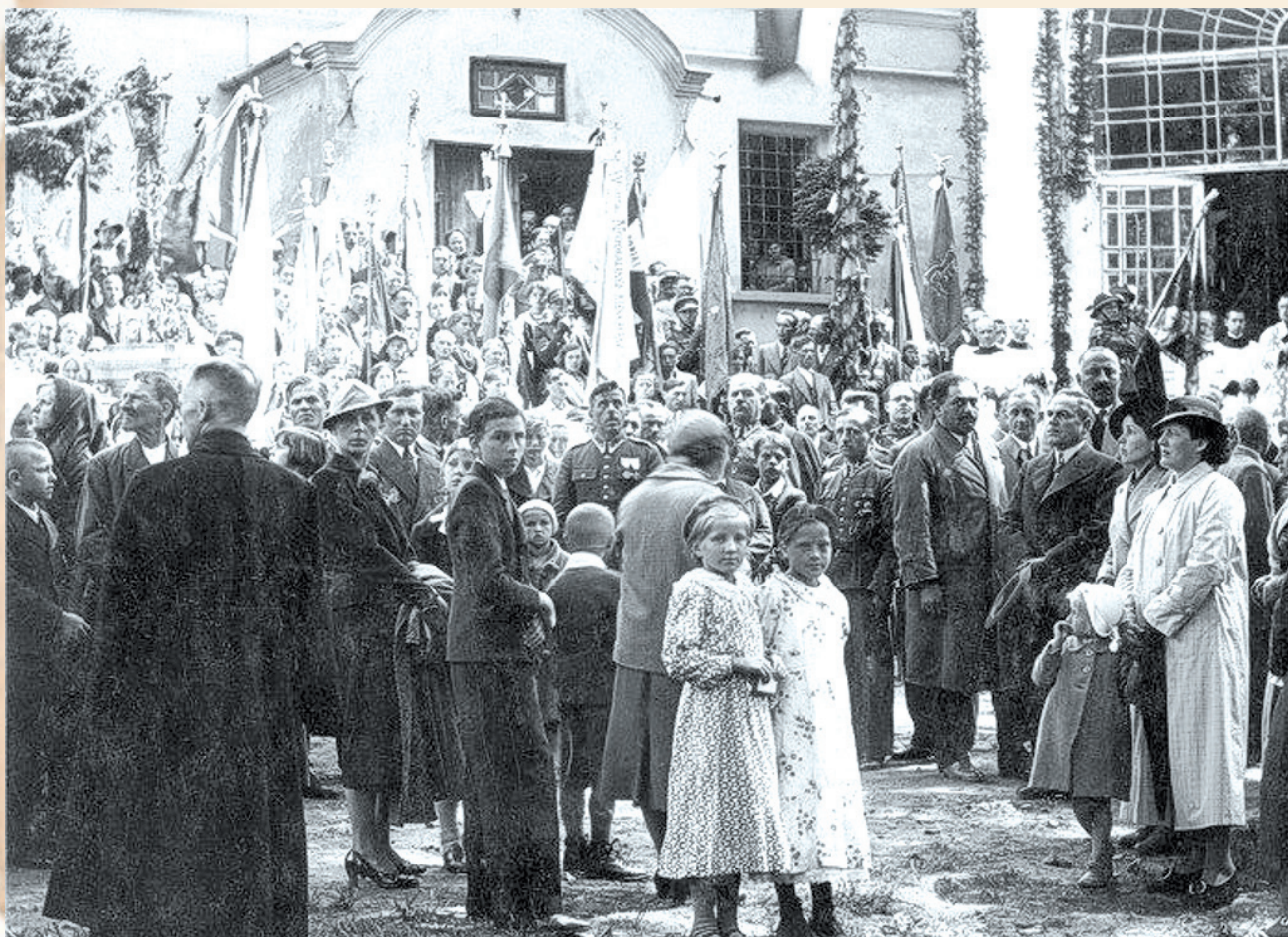
Uroczystość ślubowania żołnierzy 2 Pułku Strzelców Podhalańskich w Starej Wsi, 29 maja 1938 r.

Pułk aktywnie uczestniczył w życiu kulturalnym i sportowym miasta. Posiadał swój stadion, kino, zespoły sportowe i kluby zainteresowań, Dom Żołnierza i Spółdzielnię Spożywczą. W 1936 r. 2 Pułk Strzelców Podhalańskich był współorganizatorem słynnego Zjazdu Ziem Górskich.