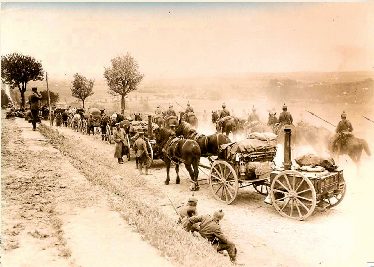
Wojska państw centralnych w Karpatach

„Pierwszy raz (wrzesień–październik 1914) tylko przez kilka dni Moskale popasali, ale mieszkańcom to wystarczyło. Zaraz na wstępie zażądali, by miasto dostarczyło mąki, chleba (3.000 bochenków!), mięsa, obroku dla koni itp. I to