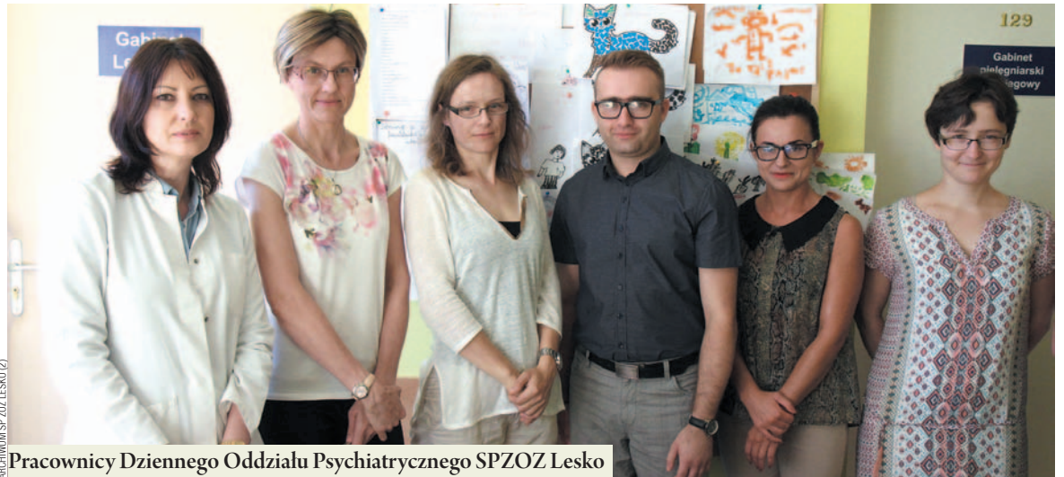
Pracownicy Dziennego Oddziału Psychiatrycznego SPZOZ Lesko

Na stronie placówki pod zakładką „oferty pracy” widnieje kilkanaście wakatów dla lekarzy: anestejo-