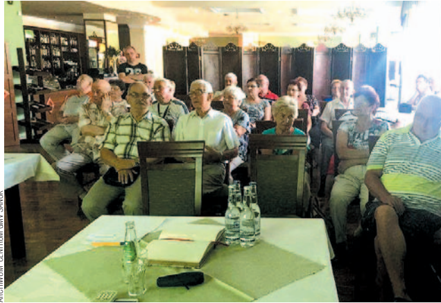
Spotkaniem zainteresowane były głównie osoby starsze

Na zakończenie przytoczmy wypowiedź jednego z sanockich lekarzy: – Spotkaliśmy się z naszymi pa-