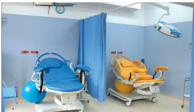
Wyremontowana sala porodowa na Oddziale Ginekologiczno-Położniczym