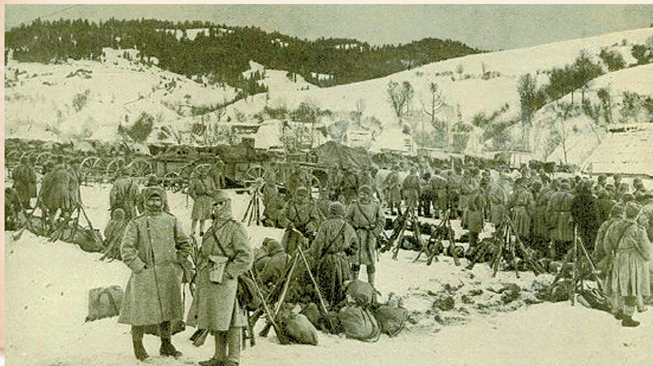
Na karpackim froncie

Na dłużej, bo około pół roku, Rosjanie „zawitali” do Sanoka po dwudniowym szturmie 9 listopada 1914 r. I znow zaczęły się rabunki, doraźne egzekucje. Miasto było wyludnione – wielu pamiętających koszmar pierwszej okupacji uciekło – i wygłodniałe. Brakowało dosłownie wszystkiego: żywności, opału, lekarstw. Wraz z głodem szalały epidemie cholery, tyfusu i czerwonki. Miasto stało się gigantycznym szpitalem. Chorych lokowano w szkołach, budynkach administracji, prywatnych domach. Sytuację pogarszał brak wyspecjalizowanego personelu. W mieście pozostał zaledwie jeden lekarz. Reszta została powołana do wojska austriackiego lub uciekła z miasta przed nadciągającymi Rosjanami. Zarówno cywile, jak i żołnierze ranni w czasie walk marli tysiącami w koszmarnych warunkach.