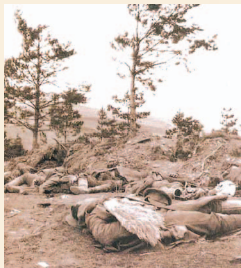
Ofiary walk na froncie galicyjskim