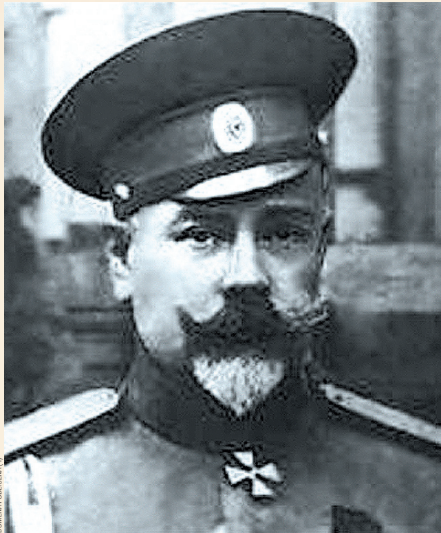
Anton Denikin, jeden z uczestników walk w Karpatach

Losy wojny na tym odcinku przesądziła ostatecznie wielka operacja gorlicka rozpoczęta 2 maja. W wielkiej ofensywie