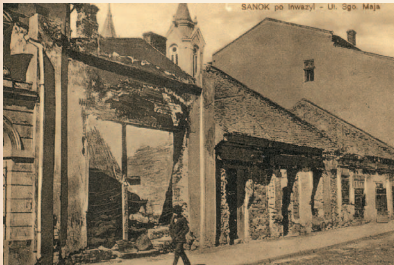
Sanok po wyzwoleniu spod okupacji rosyjskiej