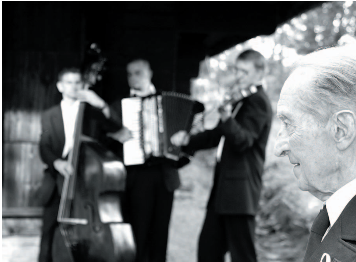
Profesor kochał muzykę. Na skrzypcach grywał przez całe życie – od czasów szkolnej orkiestry gimnazjalnej

Tymczasem po powrocie do Sanoka zaczął się neliłociwie wloką-