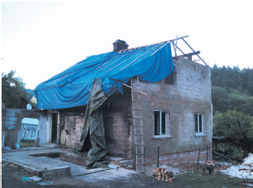
Prace remontowe mogą się rozpocząć niebawem