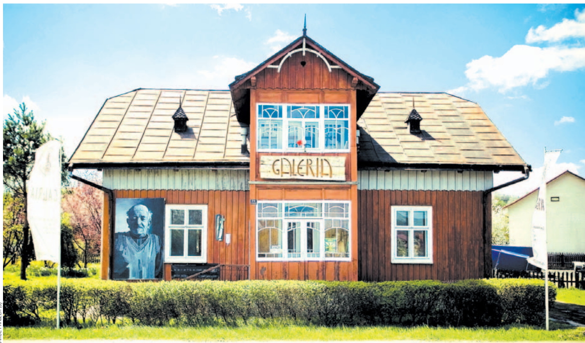
Na budynku Galerii pojawiają się coraz to inne, zaskakujące elementy graficzne

Budynek, owszem, bardzo fajna sprawa, ale skądinąd wiem, że przez