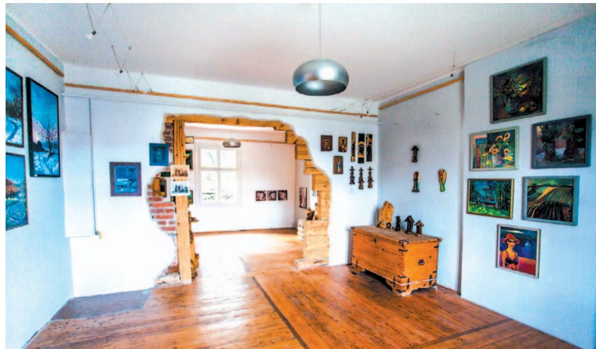
Wnętrze po remoncie pozwala na ciekawą ekspozycję prac

Nie oceniam wartości artystycznej sztuki prezentowanej w Galerii. Tutaj nie o taką wartość chodzi. Sztuka ludowa rządzi się swoimi prawami, ma swoje własne kryteria. Powinna być autentyczna. Nie wykluczam, że do Galerii uda się przyciągnąć także profesjonalnych malarzy.