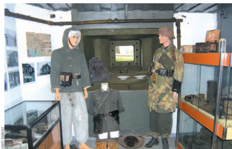
Schron Linii Molotowa w Przemysłu – jedno z pomieszczeń z ekspozycją

Od 2000 r. schron kolejowy użytkuje gmina Frysztak, która wspiera lokalne środowisko pasjonatów i regionalistów. Obiekty w Stępinie oraz Strzyżowie są dziś udostępnione do zwiedzania. W Stępinie również organizowane są cyklicznie liczne rekonstrukcje historyczne, cieszące się dużą popularnością. Podobna sytuacja ma miejsce w Strzyżowie, tu też działania udostępnienie tego fascynującego obiektu turystom.