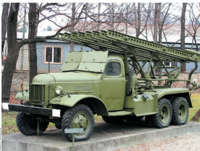
Wyrzutnia rakietowa BM-13 – słynna „Katiusza” na ekspozycji przed muzeum w Dukli

W związku z walkami toczonymi w trakcie operacji dukielsko-preszowskiej jesienią 1944 r., a także pierwszowojennych walk w Karpatach z lat 1914–15, także Muzeum – Pałac w Dukli posiada niezwykle interesujące eksponaty. Pierwsza z wystaw: „Na kierunku dukielskim... Działania operacji karpackiej i gorlickiej XII 1914 – V 1915”, pokazuje genezę i przebieg dwóch największych w dziejach Galicji operacji wojskowych, w których walki toczono m.in. o opanowanie przełęczy karpackich, w tym o bardzo silnie bronioną Przełęcz