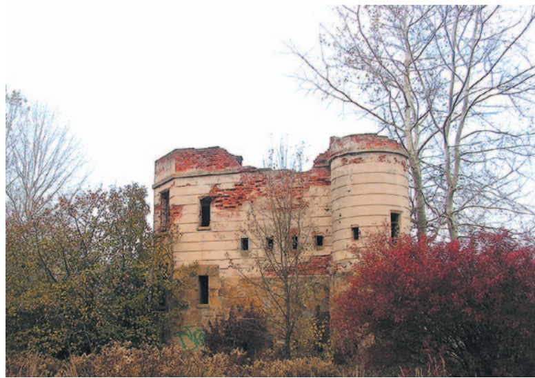
Strażnica kolejowa w Tryńczy, jeden z unikatowych zabytków architektury obronnej c.k. monarchii

Interesujące są również pozostałości wewnętrznego pierścienia twierdzy, takie jak m.in. Brama Sanocka Dolna, Fort XIX „Winna