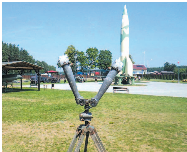
Artyleryjska lorneta nożycowa oraz model rakiety V-2 w parku historycznym w Bliznie

Wędrując podczas wakacji po naszym województwie warto zajrzeć do takich miejsc, co szczególnie polecam miłośnikom historii i militariów.