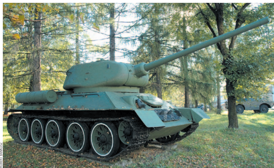
T-34/85 obok WKU w Sanoku

Szczególnie imponująca jest kolekcja plenerowa, na której znajdują się pojazdy i artyleria wojskowa z okresu II wojny. Największą grat-