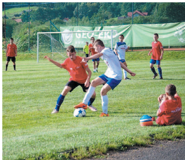
Po dwóch wysokich porażkach trampkarze Ekoballu zrewanżowali się rywalom zwycięstwem 7-5