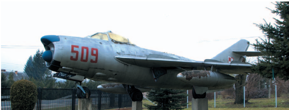
Lim -5P przed szkołą w Ustianowej

W Korczynie działa od 1995 r. Przedsiębiorstwo Produkcyjno-Handlowo-Usługowe EKOLOT, produkujące samoloty JK-05 L JUNIOR, JK 01A Elf oraz KR-030 Topaz.