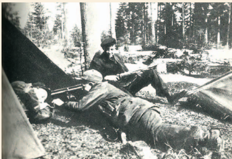
Żołnierze oddziału AK OP 11 na biwaku

końca wyjaśniona. Przyjęto, że była ona nieszczęśliwym wypadkiem. Okoliczności dramatu nadal są mało znane. Dopiero niemal siedemdziesiąt lat po wyzwoleniu Sanoka odsłonięto pomnik ku czci ofiar tamtego wydarzenia. Po osta-