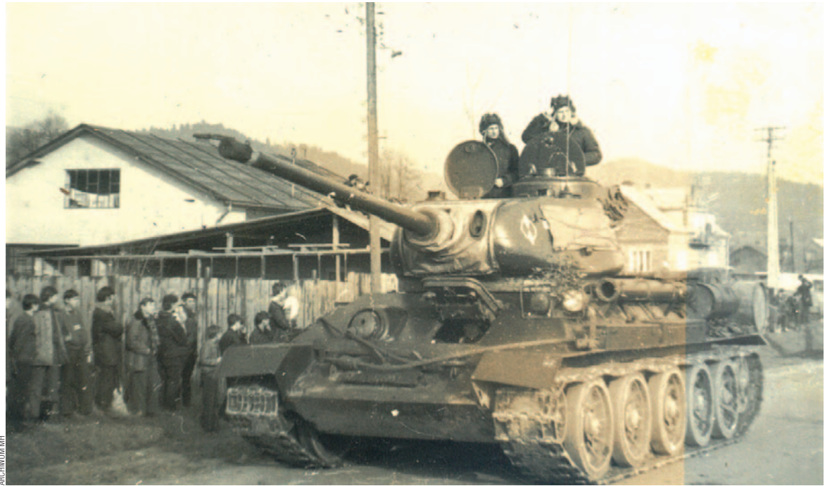
Czołg z jednostki w Olchowcach – fotografia wykonana w Olchowcach w latach 70-tych

Ludzie słuchają, a taki żołnierz od nas, z naszych stron: „Obywatelu