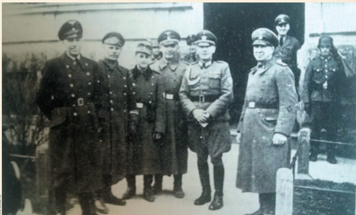
Funkcjonariusze sanockiego gestapo

nęło ponad 6588 osób, z czego podczas bezpośrednich działań wojennych 1044, rozstrzelanych 4774, w więzieniach zmarło blisko 500 osób, na robotach przymusowych 165, w wyniku pobicia 209. Zestawienie – co zastrzegal sam autor – jest niepełne.