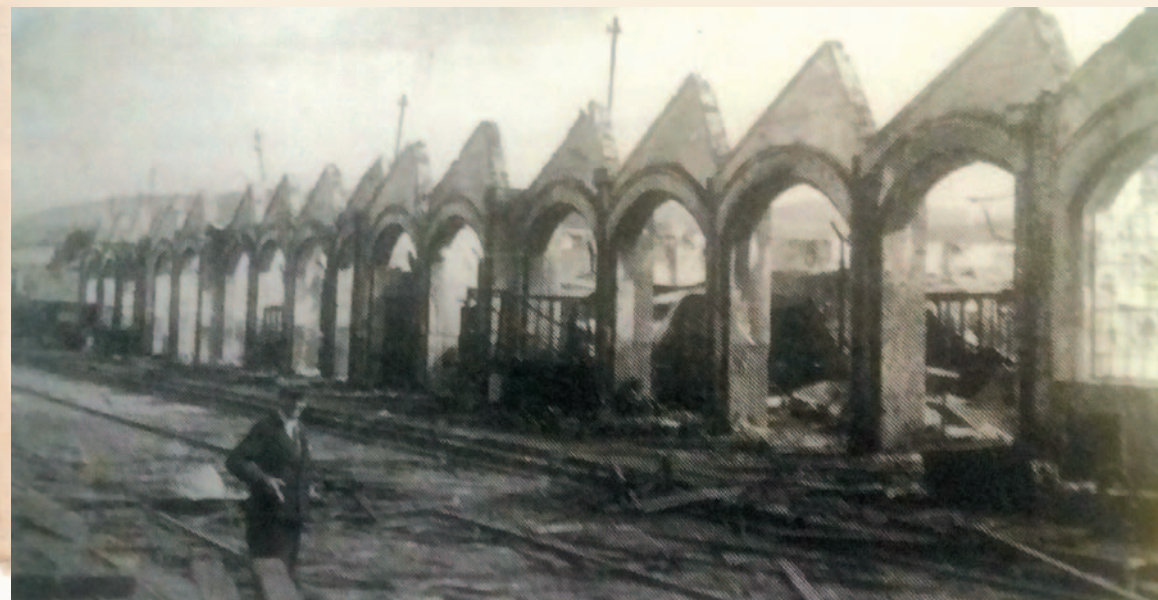
Hala montażowa Fabryki Wagonów w 1944 r.

Pierwsze oddziały radzieckie wkroczyły do Sanoka 3 sierpnia. Już następnego dnia zostały jednak wyparte przez Niemców. Ostateczne wyzwolenie nastąpiło 9 sierpnia, gdy Niemców ostatecznie wyparto ze stolicy powiatu. Walki na terenie ziemi sanockiej trwały jednak jeszcze do jesieni i częściowo powiązane były z operacją dukielsko-preszowską. Na przywrócenie spokoju na tych terenach trzeba było jednak jeszcze poczekać. Osobną kartą historii stały się bowiem bratobójcze walki między siłami nowej władzy a antykomunistycznym podziemiem czy walka z oddziałami Ukraińskiej Powstańczej Armii, trwająca na tym terenie przez kolejne trzy lata.