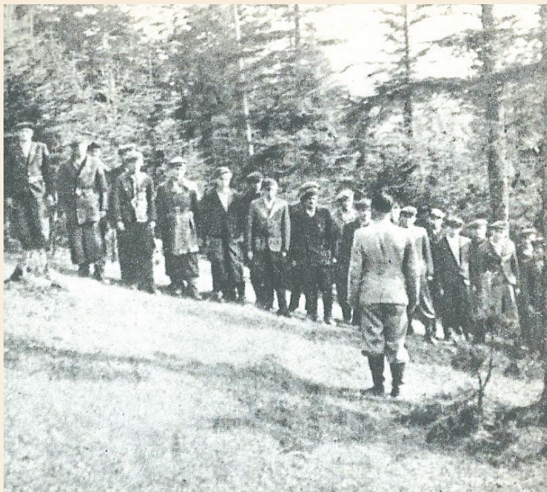
Jeden z oddziałów partyzanckich walczących w ramach akcji „Burza”

Sprawa tragedii w sanockich zakładach nie została nigdy do