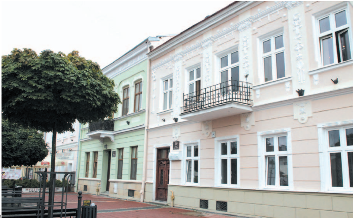
Prezes SPGM mówi, że za 3 mln zł z zasobów komunalnych „można zrobić Wersal”. Na zdjęciu – kamienice przy ul. Rynek 9 i 10. W ubiegłym roku miasto przeznaczyło 38 tys. zł na remont elewacji od podwórza

Z informacji uzyskanych wówczas w Sanockim Przedsiębiorstwie Gospodarki Mieszkaniowej wynikało, że 30 proc. wykupionych z bonifikatą mieszkań trafiało po pięciu latach na wtórny rynek. Wcześniej część z nich wyremontowano na