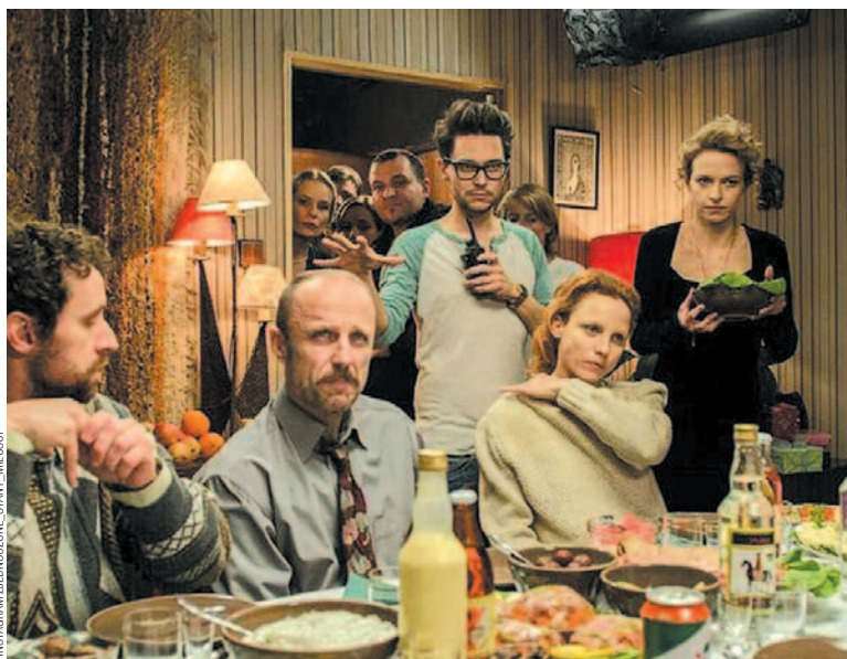
INSTAGRAM ZJEDNOCZONE STANY MIŁOŚCI

Blokowiska w latach 90., tuż po transformacji ustrojowej. Cztery kobiety na zakręcie. Każdej coś do-