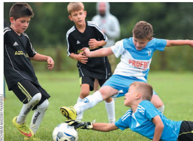
Zawodnicy AP (ciemne stroje) pewnie wygrali turniej w Korczynie