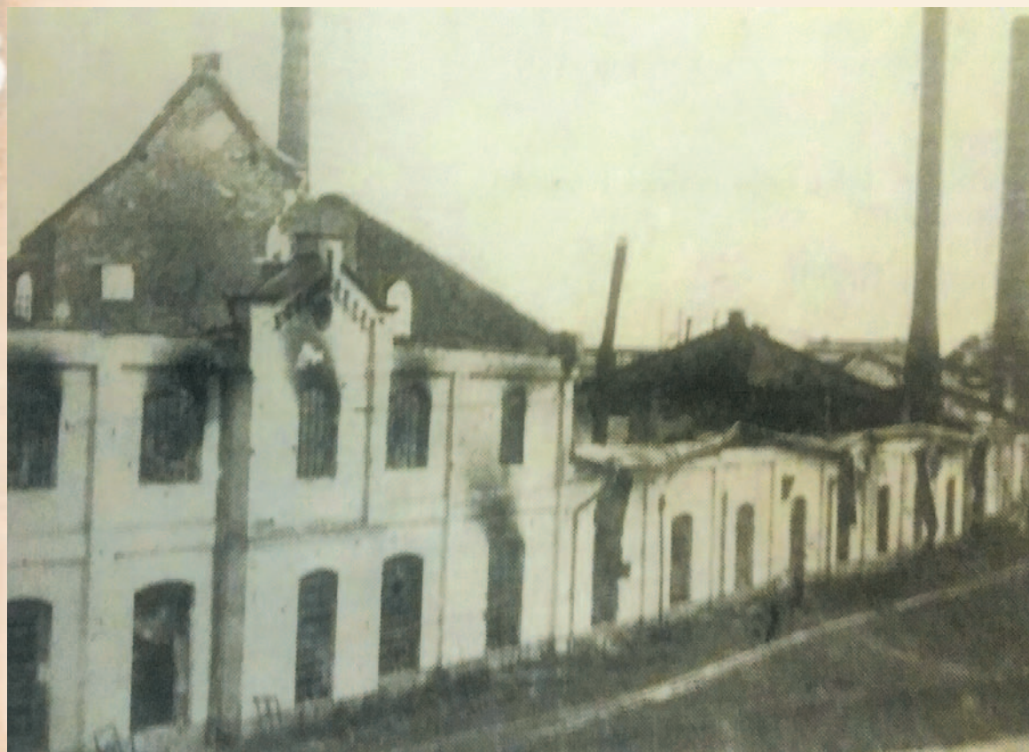
Zniszczona kuźnia sanockiej Fabryki Wagonów

tecznym zajęciu miasta przez wojska radzieckie prawdopodobnie nie przeprowadzono żadnego śledztwa w tej sprawie. Zapewne uznano, że nawet jeżeli byli winni doprowadzenia do tragedii, to zginęli w wyniku wybuchu i pożaru.