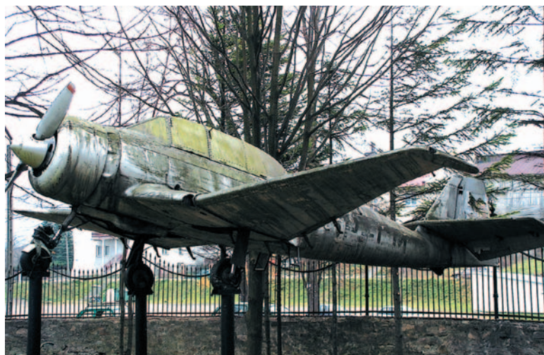
TS-8 Bies w muzeum w Dukli

Ciekawym akcentem lotniczym Podkarpacia jest Baza Lotniczego Pogotowia Ratunkowego, utworzona w 1961 r. w Sanoku. Startują stąd śmigłowce ratunkowe, współpracujące z bieszczadzką grupą GOPR, niosące pomoc potrzebującym. Lotnisko sanitarne w Sanoku dysponowało helikopterami Mi-2, obecnie służy tutaj nowoczesny Eurocopter EC 135.