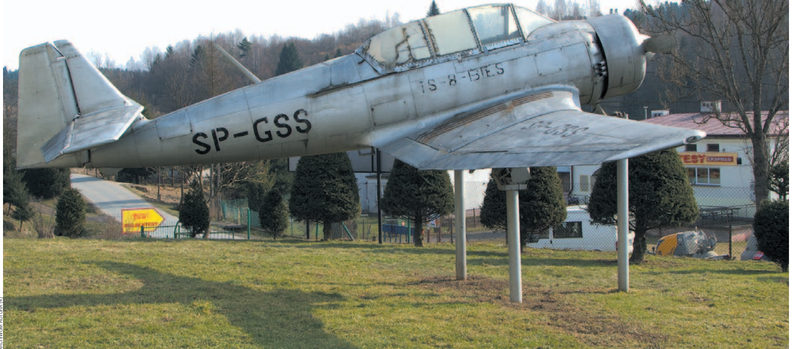
TS-8 Bies przed szkołą w Bezmiechowej