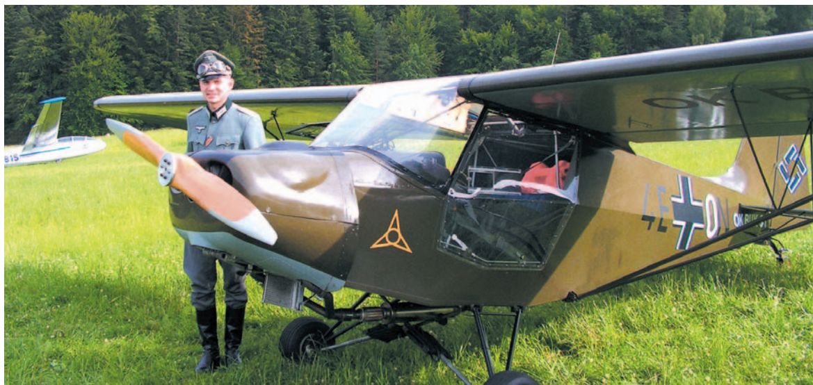
Czeski Tulak UL jako Fieseler Fi 156 Storch podczas rekonstrukcji „Barbarossy” w Sanoku

Miejscami zasłużonymi dla historii polskiego lotnictwa są biesz-