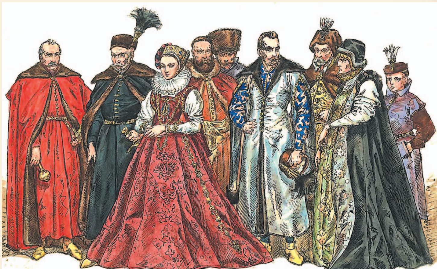
Barwne stroje polskiej szlachty i magnatów

W aktach i relacjach zachowało się wiele dowodów na to, jak nasi krewcy przodkowie załatwiać potrafili sporne kwestie. I tak na przykład w 1439 roku w sądzie mamy sprawę