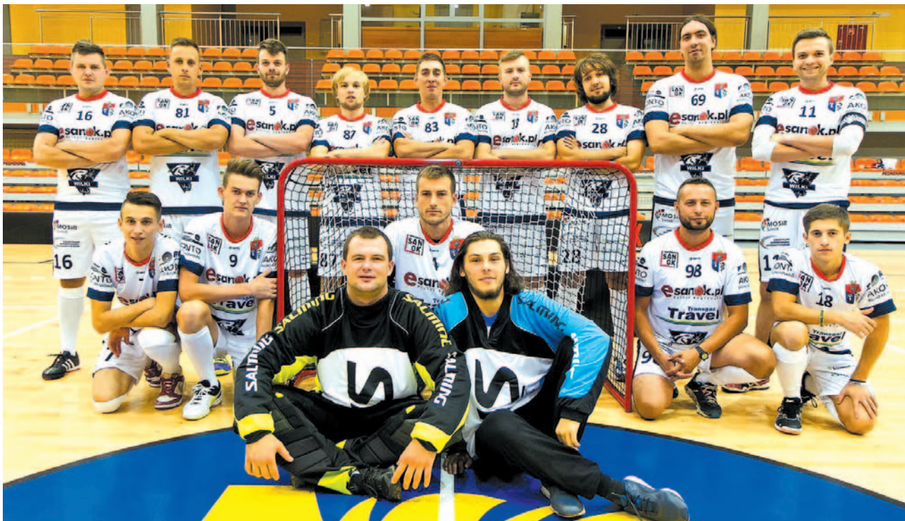
Przed inauguracyjnymi meczami z UKS Zielonka drużyna Esanok.pl Wilki zaprezentowała się w nowych, efektownych strojach