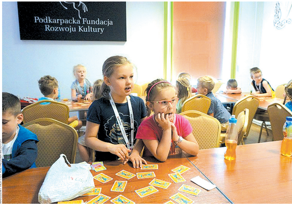
NARODOWY INSTYTUT KSZTAŁCENIA MŁODYCH

Co proponuje Instytut? Szczerze mówiąc, można do-