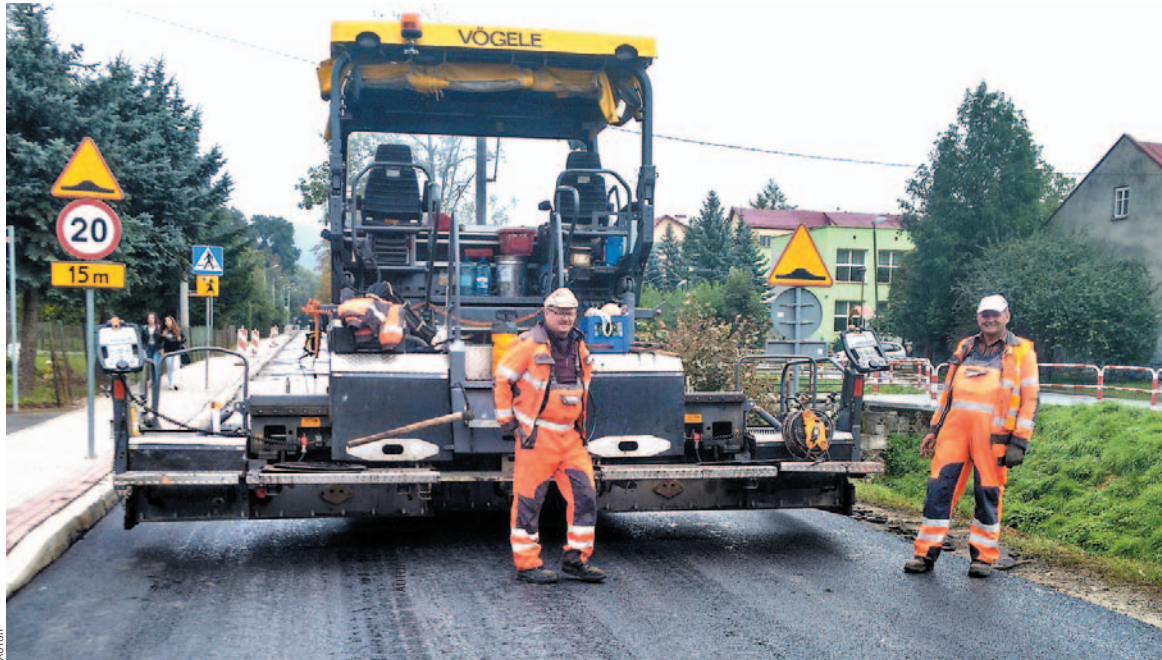
W tym roku, w mieście, pojawi się wiele nowych „autostrad”. Na zdjęciu – finałowe prace na ul. Podgórze

Godną odnotowania inwestycją jest parking przy ul. Podgórze, przeznaczony również dla autobusów. Pomyśl pojawił się wiele lat temu, doczekawszy się w końcu finału