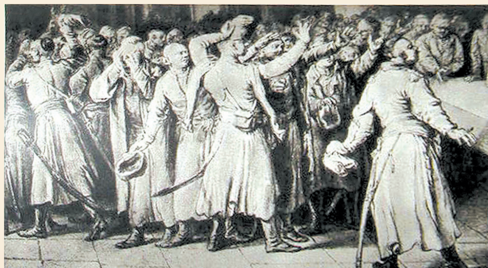
Szlachta na sejmiku, rysunek Jana Piotra Norblina