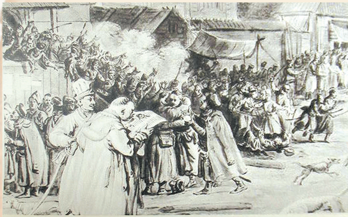
Dość ponury obraz polskiej szlachty, skłonnej do awantur, pijaństw i przemocy wylania się ze słynnych prac Norblina