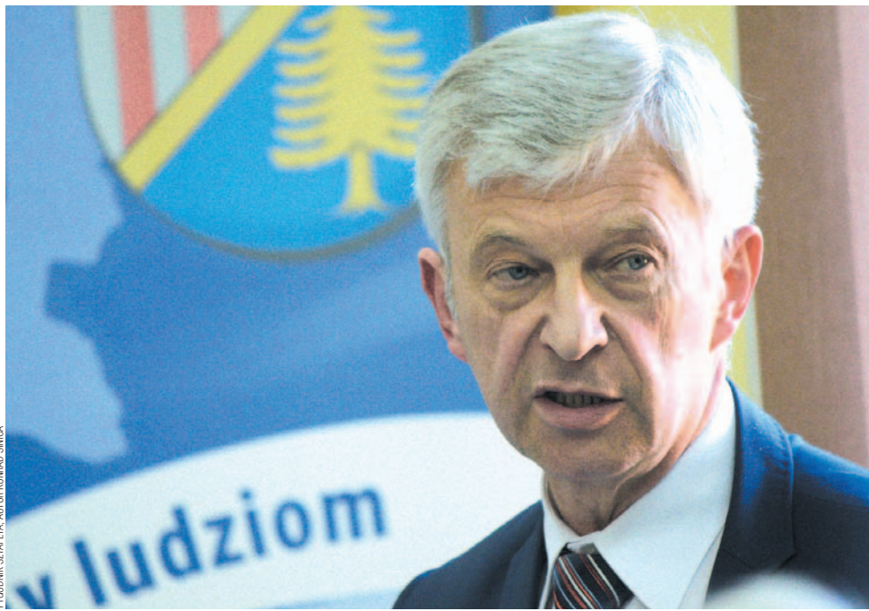
TYGODNIK SZAFETA, AUTOR KONRAD ŚNICKA

Konkurs odbył się we wtorek. Jak wiadomo, oferty złożyło trzech kandydatów, tak-