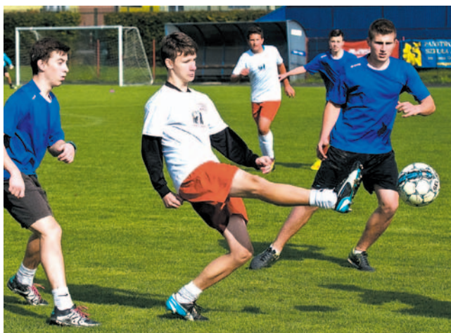
Drużyna „trójki” (jasne stroje) wygrała wśród gimnazjalistów

Jak przed rokiem turniej rozegrano na „Wierchach”, gdzie tym razem walczyło 7 drużyn. W kategorii podstawówek najlepsza okazała się „jedyńka”, wśród gimnazjalistów tytuł dla „trójki”.