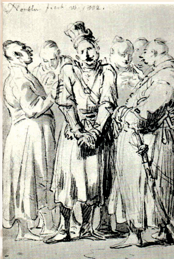
Norblin polska szlachta