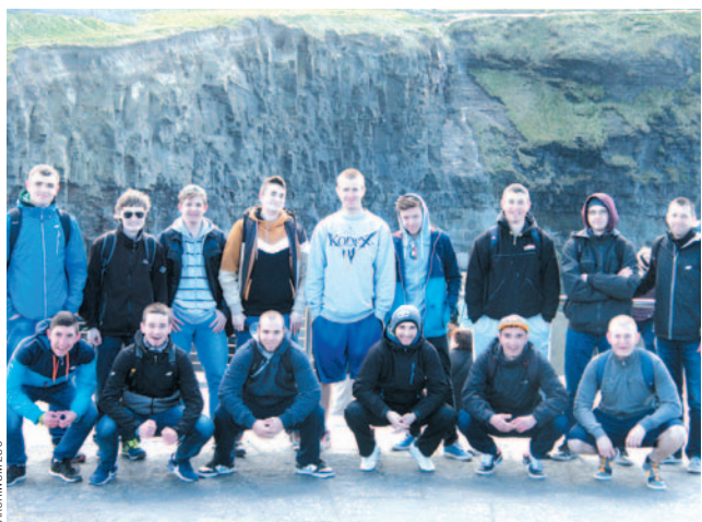
Uczniowie ZS nr 3 podczas zagranicznych praktyk nie tylko uczyli się i pracowali, ale mieli także czas na odpoczynek