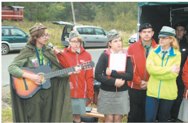
Harcerze – prawdziwi strażnicy pamięci