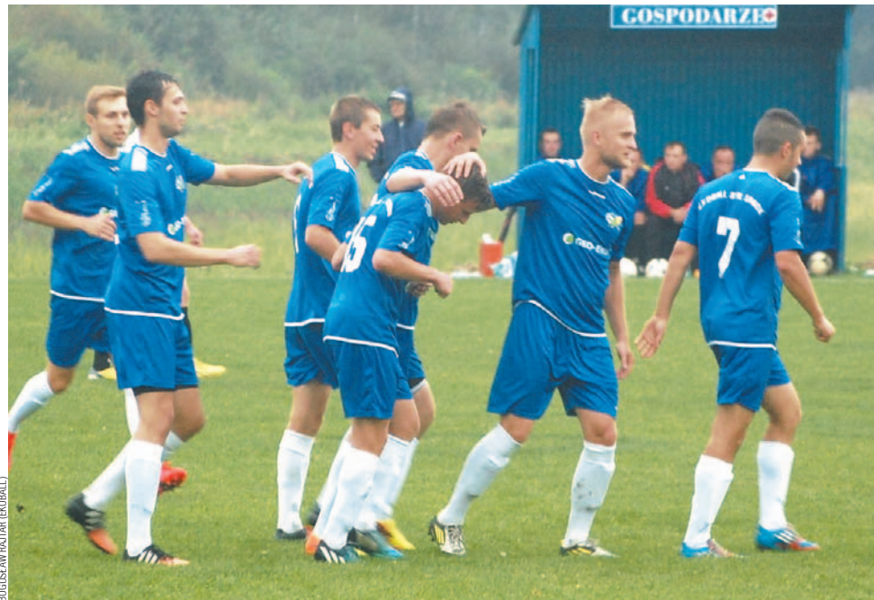
Na boisku w Łęczynach piłkarze Ekoballu Stal świętowali zdobycie kolejnych punktów

Tydzień wcześniej Przełom Besko wygrał w Łęczynach aż 8-0, więc wydawało się, że i ekoballowcy mogą tam niezłe postrzelać. Tymczasem na niespełna kwadrans przed końcem prowadzili tylko 1-0, dopiero w końcówce dobijając gospodarzy. Mimo późnego finiszu nasza drużyna zagrała niezły mecz.