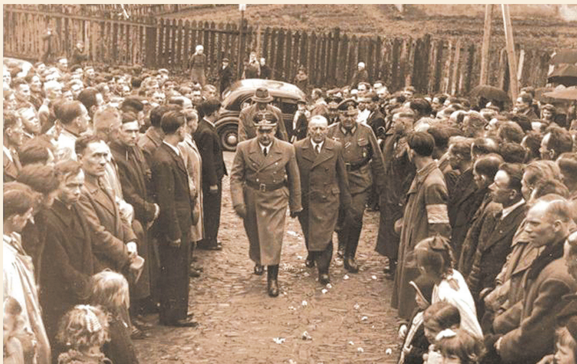
Wizyta generalnego gubernatora Hansa Franka w Sanoku

Obydwaj konfidenti „specjalizowali się” m.in. w okradaniu miejscowej ludności z nielegalnie hodowanego bydła. Do żandarmerii niemieckiej trafił więc meldunek, iż obaj dokonali nielegalnego uboju, co było surowo zabronione, nawet pod karą śmierci. Zostali oni aresztowani, ale szybko wypuszczeni po interwencji sanockiego Gestapo. Wywołało to konflikt między niemiecką żandarmerią a gestapowcami. Żan-