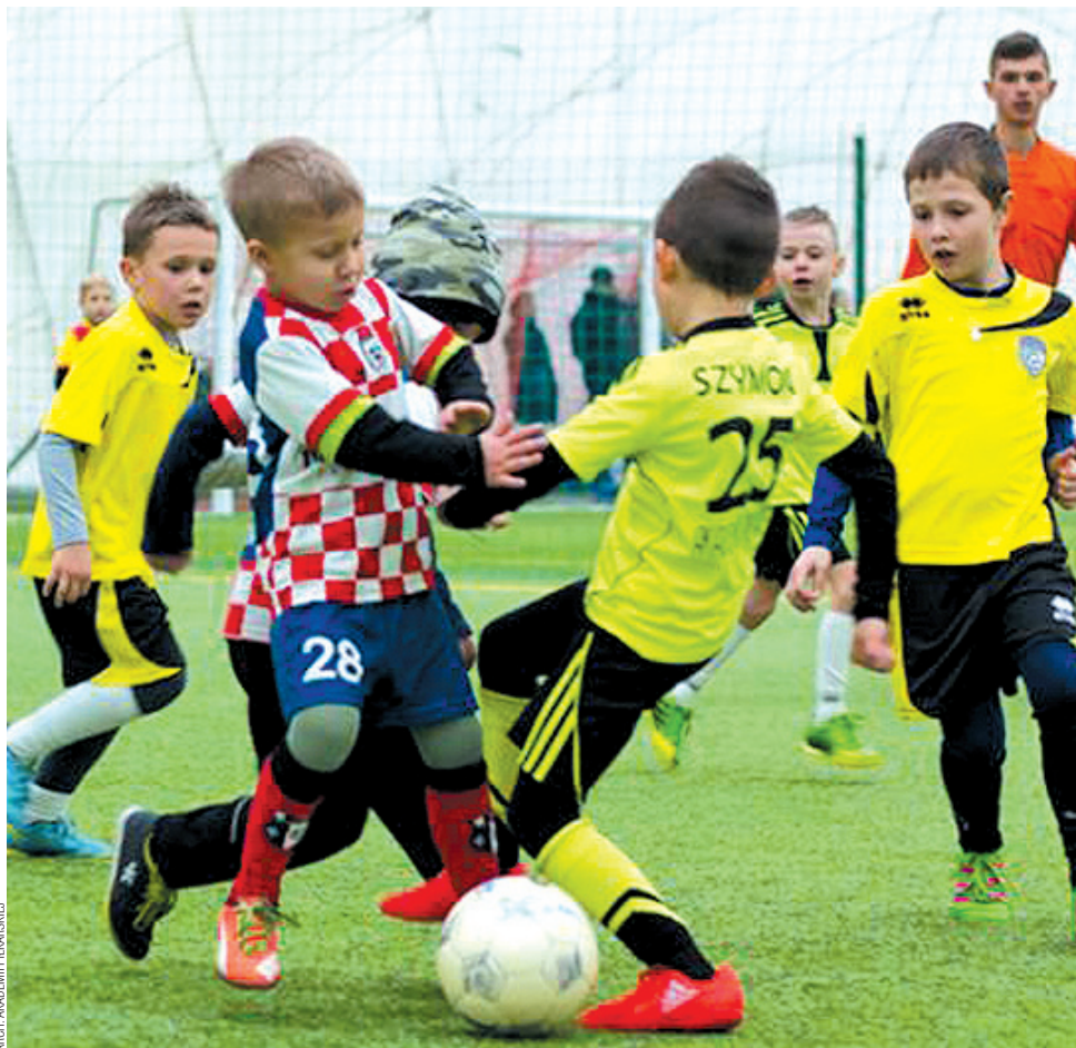
Drużyna Akademii Piłkarskiej z rocznika 2009 objęła prowadzenie w tabeli

Rozgrywki w Hali Krosno zostały podzielone na Ligę Mistrzów i Ligę Europejską, a wszystkie cztery drużyny Akademii Piłkarskiej awansowały do tej pierwszej. W inauguracyjnej kolejce najlepiej spisał się zespół z rocznika 2009, obejmując prowadzenie w tabeli. Rocznik 2007 zajmuje 2. miejsce, 2006 – 3., a 2008 – 4.