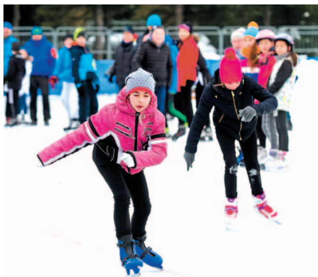
Zawody na torze „Błonie” miały bardzo dobrą frekwencję

Po XXXI Zawodach Barbórkowych o Lampę Górnica, będących 2. rundą Grand Prix Polski, jak co roku Górnika zorganizował tzw. Małą Barbórkę. W tygodniu ścigali się uczniowie szkół podstawowych, a w weekend była rywalizacja zawodników klubowych, w której obok naszych łyżwiarzy startowali też panczeniści UKS 3 Malinówek. Łącznie w zawodach uczestniczyło około 150 osób. Obok wykaz medalistów we wszystkich wyścigach.