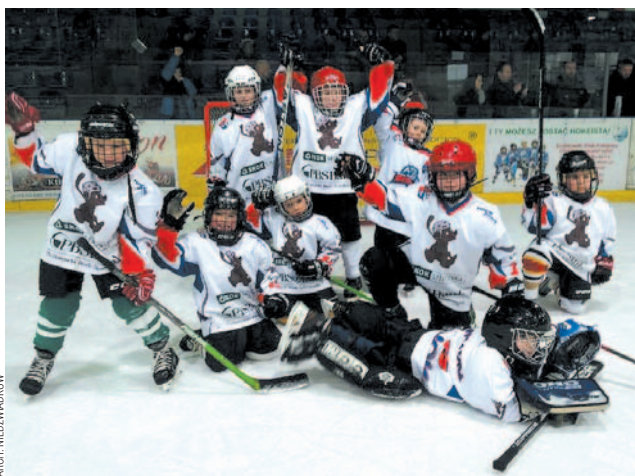
Najmłodsze Niedźwiadki zaliczyły świetny debiut