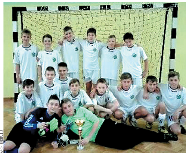
Zespół Ekoballu okazał się zdecydowanie najlepszy na turnieju w Niebieszczanach, kończąc rywalizację bez straconej bramki