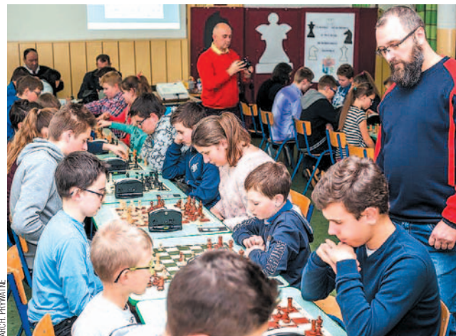
Podczas turnieju w G4 grało blisko 60 młodych szachistów