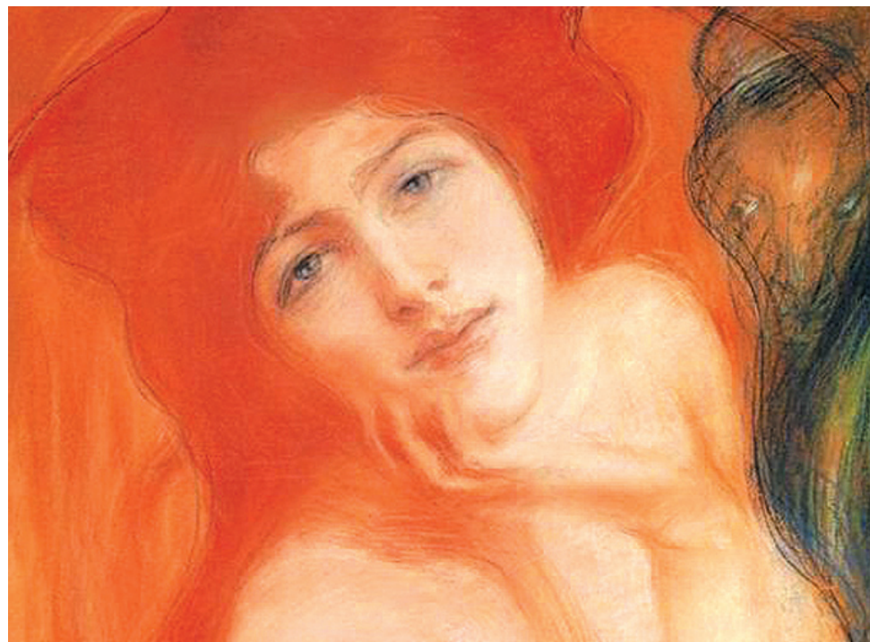
Teodor Axentowicz, Portret młodej kobiety

wą poszedł do dużego salonu. Lubił tam przesiadywać, na prawej ścianie wisiał obraz, podobizna kobiety, kilkakrotnie przez myśl mu