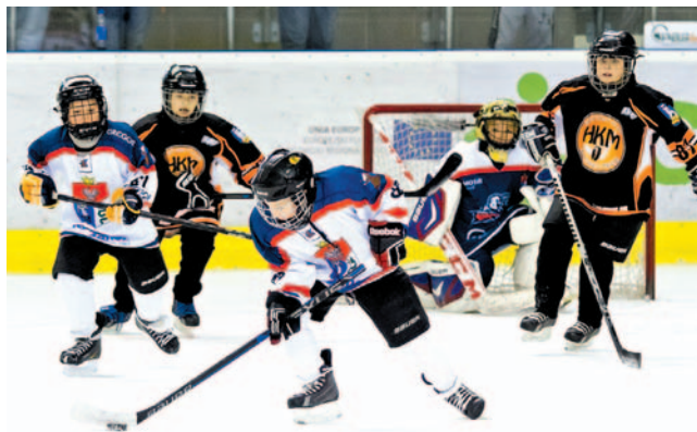
Drużyna zaków młodszych nie zwalnia tempa