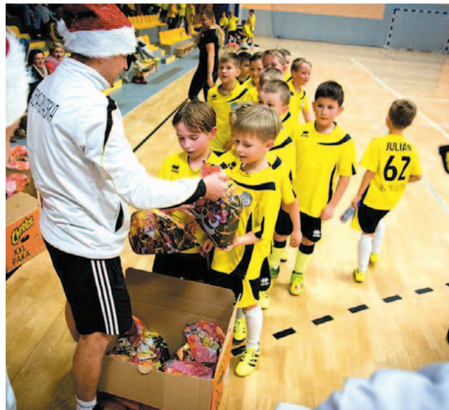
...i w Akademii Piłkarskiej