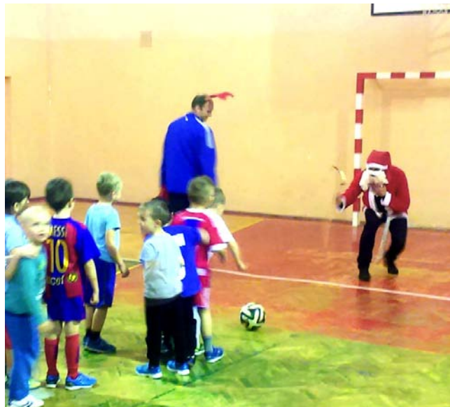
Mikołaj w Ekoballu...

trenerzy wcielili się w role elfów, przekazując prezenty swoim wychowankom. Specjalne przesyłki wszystkim obdarowanym sprawiły wiele radości.