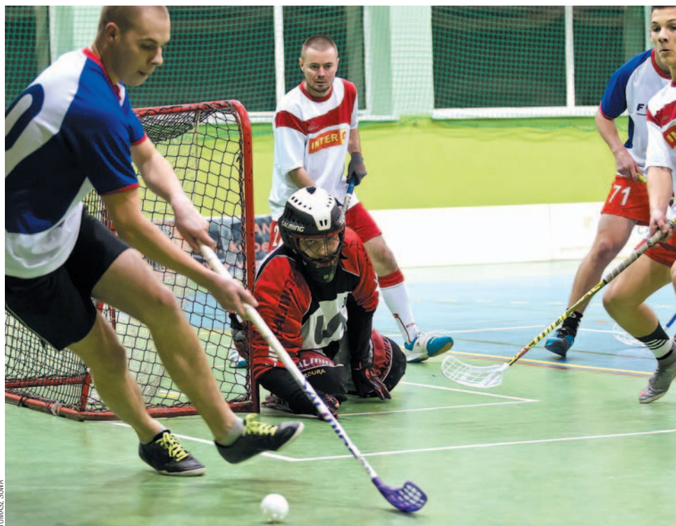
Zespół Niedźwiedzi (w głębi) nie dał szans Forestowi, wygrywając w dwucyfrowych rozmiarach

W ósmej kolejce zespół Szukamy Sponsora wystąpił już pod nazwą Arriva Sanockie Niedźwiedzie, zmianę szyldu podkreślając dwucyfrowką w pojedynku z Forestem. Wysoko wygrały też liderujące Esanok.pl Wilki. W najciekawszym meczu AZS PWSZ pokonał karnymi Besco, dzięki czemu na 3. miejsce w tabeli awansował... Komputronik.