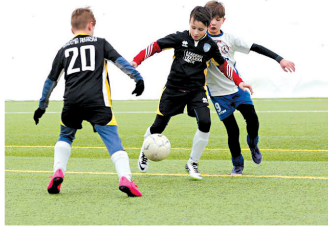
Niepowodzenie z pierwszego dnia zmagania zawodnicy AP (ciemne stroje) powetowali sobie 2. miejscem w Lidze Europejskiej

Zawodnikom Akademii Piłkarskiej znacznie lepiej poszło nazajutrz w Lidze Europejskiej, o czym świadczy zajęcie 2. miejsca. Wygrali cztery z pięciu spotkań, pokonując kolejno: Orzelki Brzozów, Glinik (wysoko wygrany rewanż), AP Jasło i GKS Katowice. Lepszy okazał się jedynie Fablok Chrzanów.