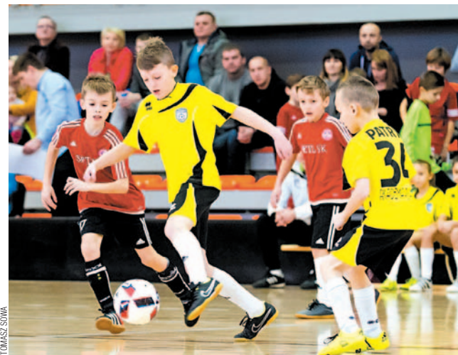
Drużyna Akademii Piłkarskiej (na żółto) wygrała własny turniej

W rywalizacji drużyn z rocznika 2007 gospodarze okazali się mało gościnni, odnosząc turniejowe zwycięstwo. Miejsce 2. zajęła Tarnovia Tarnów, na pozycji 3. Sandecja Nowy Sącz.