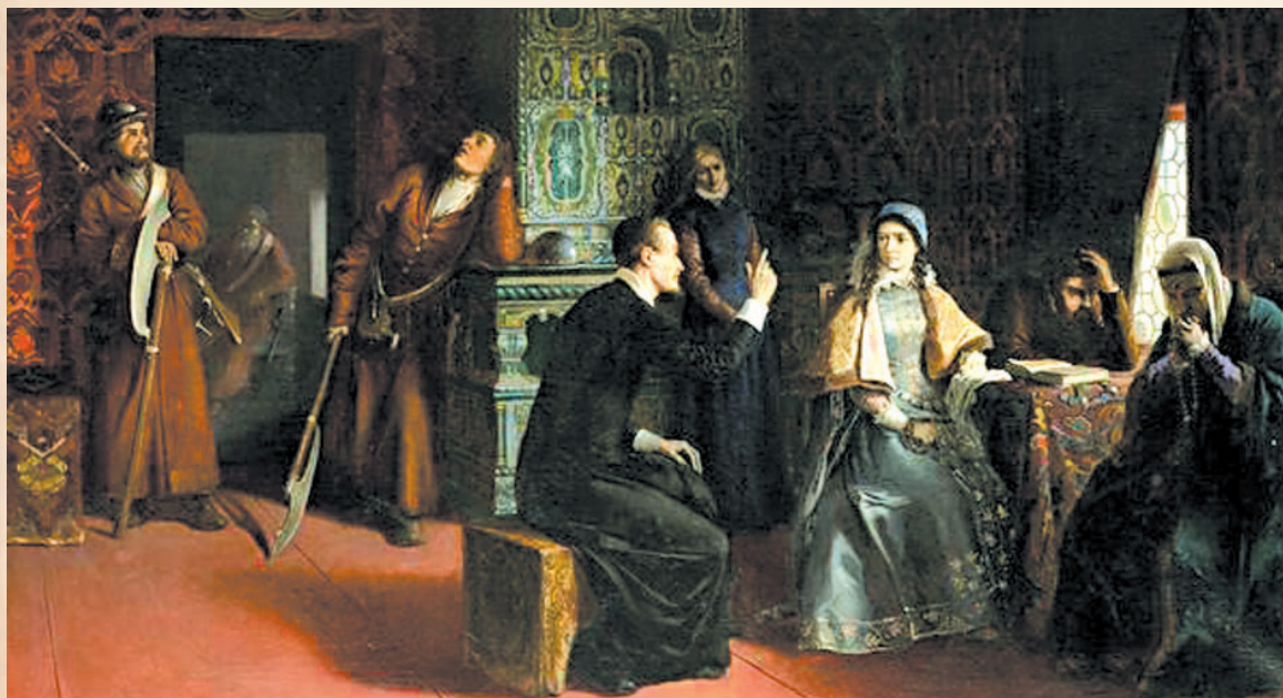
Maryna Mniszchówna z ojcem w niewoli rosyjskiej