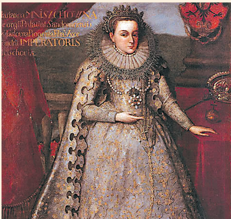
Maryna Mniszchówna – caryca Rosji – w stroju koronacyjnym

roku. Niemal pewne jest, że nie była to naturalna śmierć. Dopóki żyła i trwała jeszcze wojna z Polską, Mniszchówna mogła być postrzegana jako realne zagrożenie dla nowego władcy Moskwy.