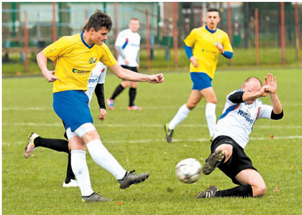
Jesienią piłkarze Ekoballu (na żółto) prezentowali bardzo dobrą grę i są liderem klasy okręgowej

Już w sobotę drużyna Ekoballu Stal rozpocznie cykl meczów kontrolnych przed rundą rewanżową krośnieńskiej klasy okręgowej. Pierwszym rywalem będzie III-ligowa Resovia Rzeszów. Plan zakłada rozegranie siedmiu lub ośmiu spotkań w półtora miesiąca. Wśród rywali może znaleźć się nawet ekstraklasowa Bruk-Bet Termalica Nieciecza.