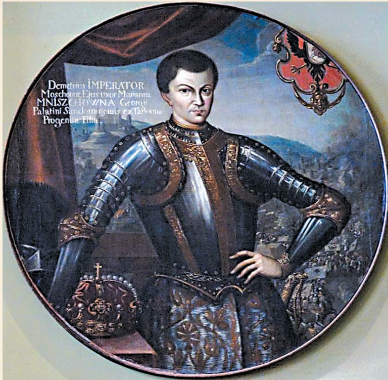
Dymitr Samozwaniec I

Po buncie wojsk astrachańskich w maju 1614 roku, w czasie ucieczki Maryna z synem i nowym mężem zostali pojmani i przekazani carowi Michałowi I. W czasie publicznej egzekucji w Moskwie wbito na pal Iwana Zaruckiego, zaś małego Iwana Dymitrowicza powieszono. Eks-carycę formalnie ułaskawiono, ale przewieziono do Kołymny i zamknięto w jednej z baszt. Maryna nie cieszyła się jednak długo życiem. Zmarła prawdopodobnie na przełomie 1614 i 1615