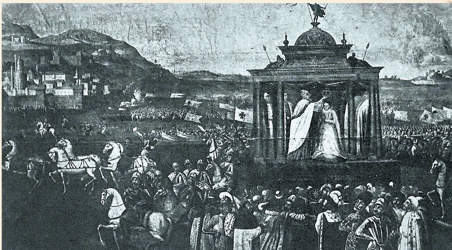
Koronacja Mniszchówny w Moskwie

Trudno dzisiaj ustalić, czy ta dość nieprawdopodobna historia wynikała z faktu, że nasi arystokraci naprawdę uwierzyli w fakt cudownego ustalenia, czy też cynicznie postanowili wykorzystać problemy wewnętrzne sąsiada, niemniej jednak „carewicz” goszczony był na polskich dworach iście po królewsku. Ówczesna Rzeczpospolita ostro rywalizowała z Moskwą o ziemie ruskie, więc gdy nadarzyła się wspaniała okazja do ingerencji w sprawę Rosji, co niektórzy postanowili to wykorzystać.