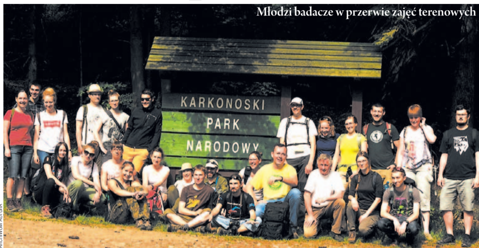
Młodzi badacze w przerwie zajęć terenowych

• Prace terenowe prowadzone są od 2015 roku. Płechy porostów obserwowano na różnych typach podłoża, znajdujących się na terenie skansenu, m.in. kora drzew, stare drewniane ploty, elementy zabudowań gospodarskich i sakralnych, nagrobki, wyposażenie gospodarskie. W wyniku przeprowadzonych badań stwierdzono występowanie 78 gatunków porostów. Spośród wszystkich obserwowanych taksonów 14 gatunków znajduje się na „Czerwonej liście porostów Polski”. Ponadto stwierdzono