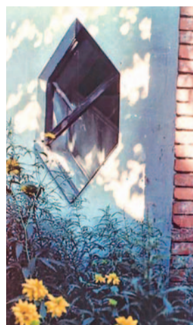
Dom Melnikowa, okno