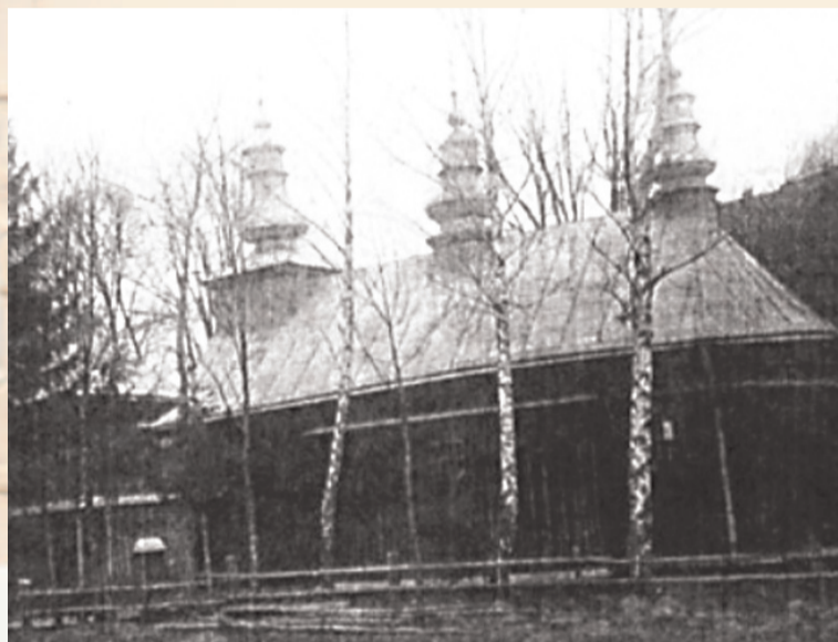
Cerkiew we wsi Chocień, w której doszło do opisywanych walk

25 zabitych bandytów, w tym 5 oficerów, 30 rannych, 2 jeńców. Broni zdobyto 5 RKM-ów, 8 karabinów, 3 pistolety automatyczne, 1 granatnik, 1 garlacz, 4 lufy do CKM-ów, 8 skrzyń amunicji, ponadto odebrano zrabowane okolicznym mieszkańcom konie i krowy. Wracającym z akcji żołnierzom ludność urządziła spontaniczne owacje, wyrażając jednocześnie podziękowanie dowództwu i żołnierzom za uwolnienie ich od bandy „Hrynia”.