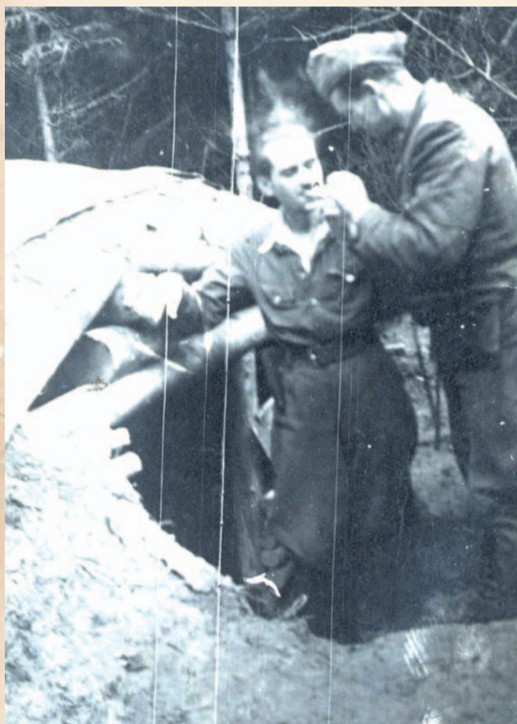
Hryń z lewej przy wejściu do bunkra

nowania nabrała w opustoszałej chacie na skraju lasu. Wzięci do niewoli próbują ucieczki. Jeden celny strzał kładzie trupem jednego z uciekających, który jak się okazało był „oficem” ( w kieszeni miał świadectwo ukończenia szkoły UPA), drugi zaś ranny korzystając z mgły i słabej widoczności przepada w ciemnościach. Zostawiając automat i tajne dokumenty. Nie doszliśmy do wsi Łukowej, gdzie był przewidziany nocleg grupy, gdzie jakby spod ziemi wyraża przed oddziałem sołtys z Chocenia, u którego poprzednio odkryto bunkier i skład broni. Przytrzymany w czasie przesłuchania, „sypie” bandę i przyrzeka pokazać miejsce, gdzie schowana została lufa z moździerza 82 mm. O świcie grupa udaje się znowu do bunkrów w okolicy Chocenia. Sołtys, będący sam członkiem bandy, kluczy po drodze, usiłując wojsko nasze wciągnąć w zasadzkę.