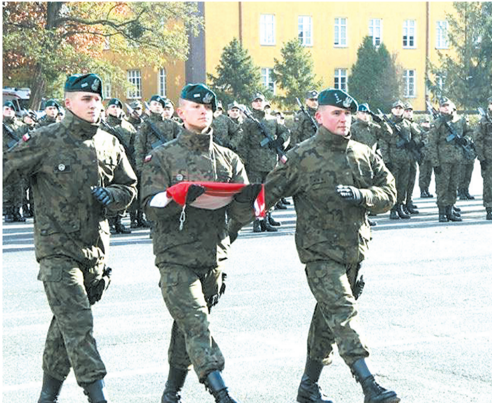
Pierwsza przysięga dowódców wojsk obrony terytorialnej, fot. Bogusław Politowski, źródło: MON

16 listopada 2016 roku sejm uchwalił ustawę o zmianie ustawy o powszechnym obowiązku obrony Rzeczypospolitej Polskiej, powołując do życia nowy rodzaj sił zbrojnych – Wojska Obrony Terytorialnej.