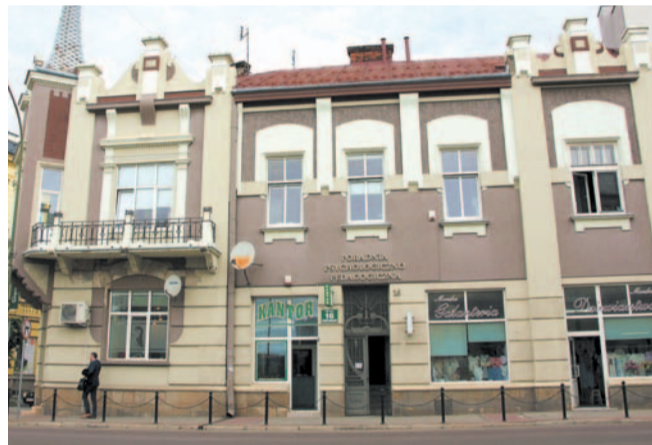
Stara siedziba PPP