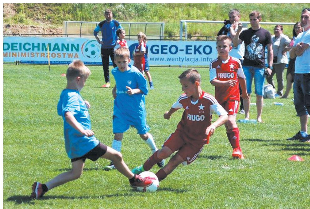
Turniej w Bykowcach miał charakter wielkiego piłkarskiego pikniku

Zmagania na stadionie w Bykowcach zakończyły się podwójnym zwycięstwem Akademii Piłkarskiej, która wygrała zarówno w roczniku 2006, jak i 2008. Współgospodarz turnieju, czyli Wisła Kraków, poznał siłę naszych klubów, przegrywając też część meczów z Ekoballem.