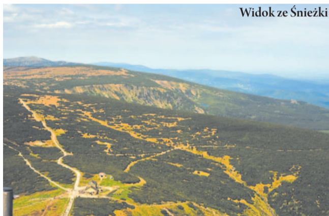
Widok ze Śnieżki

czynników, w tym nie tylko meteorologicznych, wartości ablacji w poszczególnych latach mogą się w znacznym stopniu różnić. W ciągu rozpatrywanego okresu zostały stwierdzone pewne zależności w zróżnicowaniu przestrzennym ablacji – największe wartości odnotowano w północnej części strefy czołowej, najmniejsze na obszarze pól akumulacyjnych. Czasowy rozkład topnienia na Lodowcu Irenej jest zróżnicowany i silnie uzależniony od topografii terenu i panujących warunków pogodowych w poszczególnych jego częściach, szczególnie w części czołowej i akumulacyjnej.