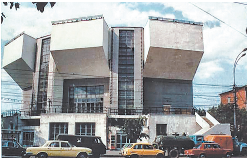
Moskwa. Klub Rusakow