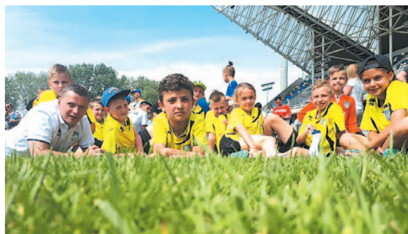
Na stadionie Stali Rzeszów akademicy odnieśli efektowne zwycięstwo