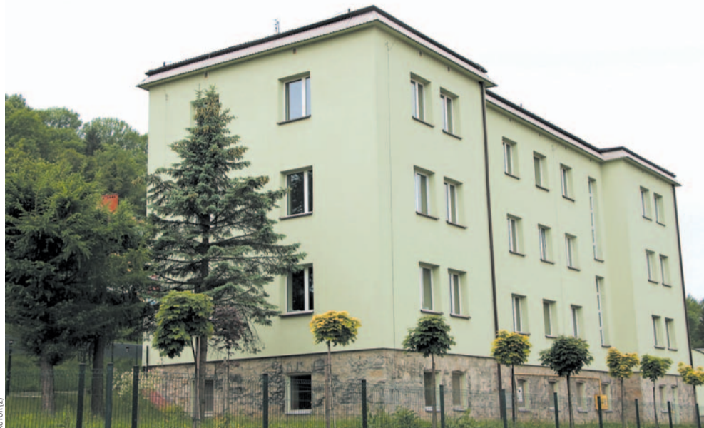
Nowa siedziba PPP

Czasu jest mało, 10 czerwca planowano podpisanie umowy na wykonanie określonych prac, które powinny ruszyć już w połowie czerwca. Jak przewiduje dyrektor PPP, remont mógłby zakończyć się w połowie sierpnia, dwa tygodnie później przenosiny pla-