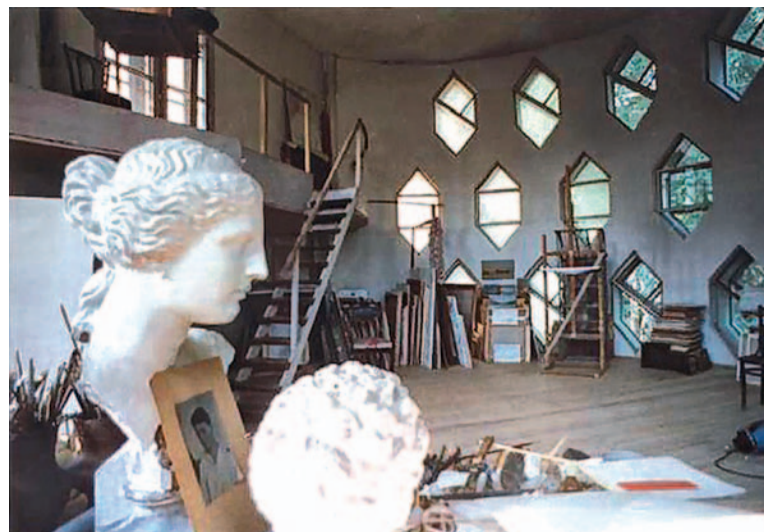
Moskwa Dom Melnikowa. Wnętrze