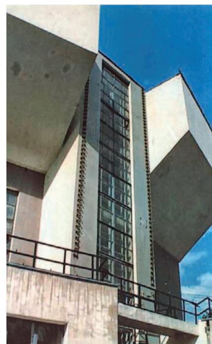
Klub Rusakow, fragment