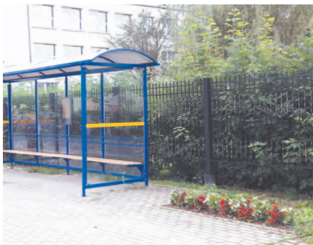
Jana Pawła II, SP4, nowa wiatka

Parking przy ul. Lipińskiego, chociaż pełni rolę dworca za-