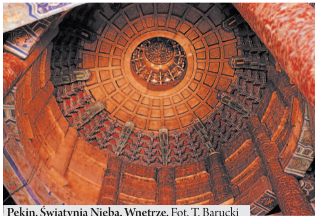
Pekin. Świątynia Nieba. Wnętrze.

W Pekinie natomiast zwracał uwagę swoją niecodziennością chodzący po hali lotniska pracownik z klapką do zabijania much. Taką bowiem akcją podjęto właśnie w tym – wówczas – już ponad 100-milionowym kraju o ...własnej, oryginalnej hi-