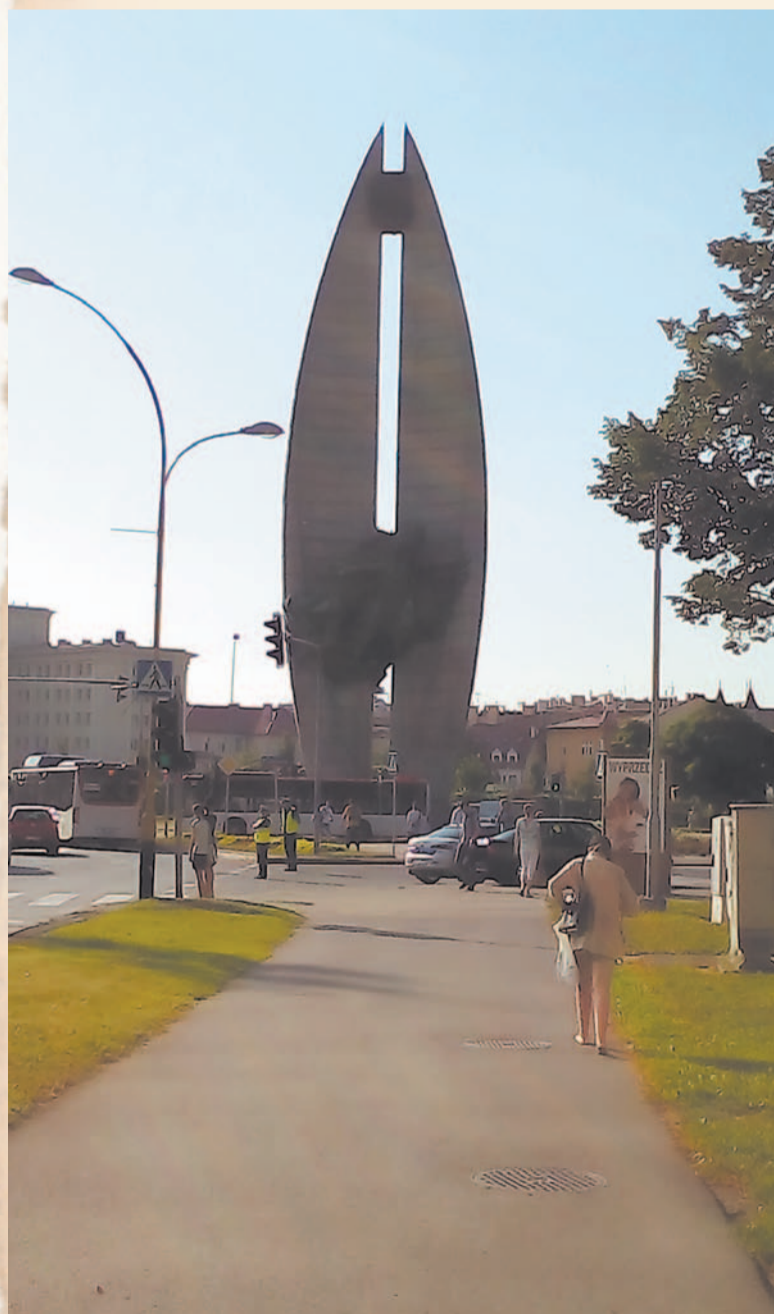
Pomnik w Rzeszowie, zwany jednym razem Czynu Rewolucyjnego, innym Walki Rewolucyjnej.

Póki co pomnik stoi, a i przeciwników i zwolenników postumentu godzą na razie... ojcowie bernardyni, w których władaniu on jest. Na skutek niedopatrzania rzeszowscy radni przekazali bowiem zakonnikom plac wraz z pomnikiem. Jego status quo wydaje się obecnie nienaruszalny. Ot, taki kolejny chichot historii w stolicy województwa.