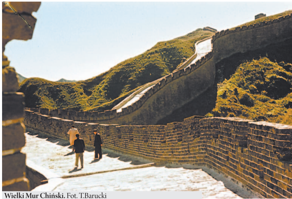
Wielki Mur Chiński.

uczestnictwa) zostawiając mi czas na ponadprogramowe zwiedzanie Pekinu. Było to chyba – już w perspektywie całego życia – najwspanialsze me doświadczenie. Niewątpliwie i dlatego, że było pierwszym tego rodzaju, a do tego byłem – choćby nawet w towarzystwie chińskim – sam i przeżywałem ten zupełnie inny i jakże atrakcyjny świat