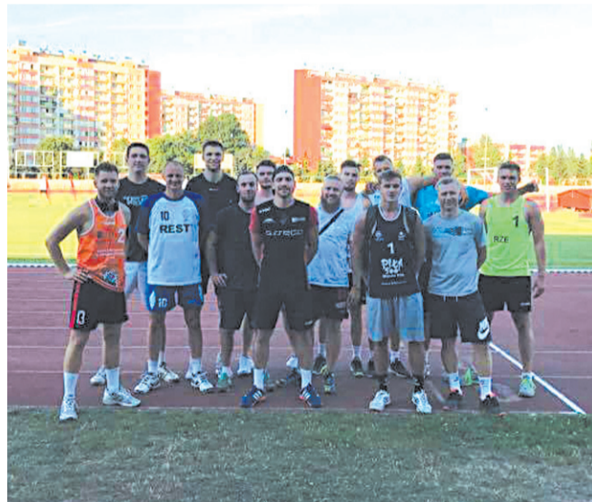
Pierwszy trening siatkarze TSV zaliczyli na lekkoatletycznym stadionie Resovii

Nie może być inaczej, w końcu na horyzoncie jest olimpiada w Pjongczang. Minima są znacznie poniżej moich rekordów życiowych, więc nie powinienem mieć problemów z ich uzyskaniem. O czasy się nie martwię. Osobną kwestią jest fakt, że trzeba się załapać na listę krajową, a na 500 i 1000 metrów mamy po trzy miejsca. Będzie walka. Uzyskanie wysokiej dyspozycji na igrzyska jest tym bardziej istotne, że wkrótce po ich zakończeniu zaplanowano Sprinterskie Mistrzostwa Świata, które rozgrywane będą w Chinach. W sumie spędzimy w Azji ponad miesiąc. Tak długiego wyjazdu na zawody jeszcze nie miałem.