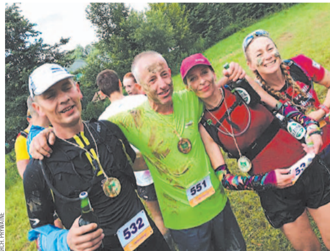
Pozytywnie Zabiegani na mecie bieszczadzkiego półmaratonu

Wyścig na dystansie półmaratonu, z którego dochód przeznaczono dla małej Tosi. Do szczytnej idei przyłączyła się blisko 20-osobowa grupa naszych zawodników i zawodniczek, głównie z grupy Pozytywnie Zabiegani.