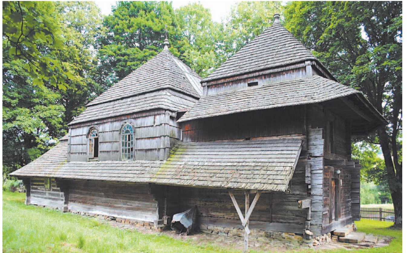
Liskowate, cerkiew po renowacji