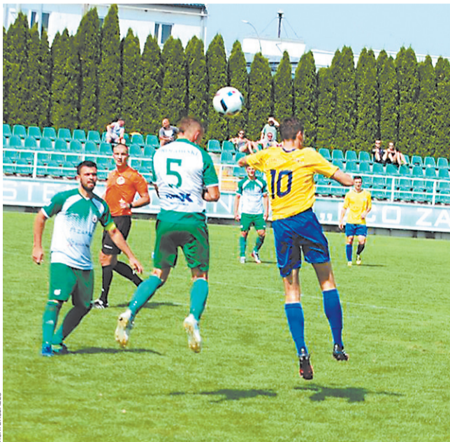
Na stadionie w Boguchwałce stalowcy stoczyli twardego bóju z drużyną miejscowego Izolatora