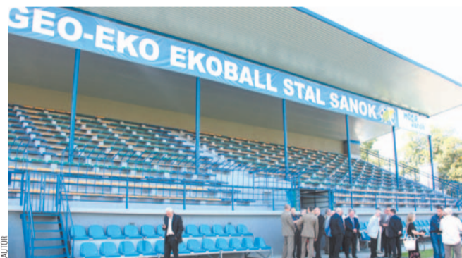
Odnowiona trybuna główna