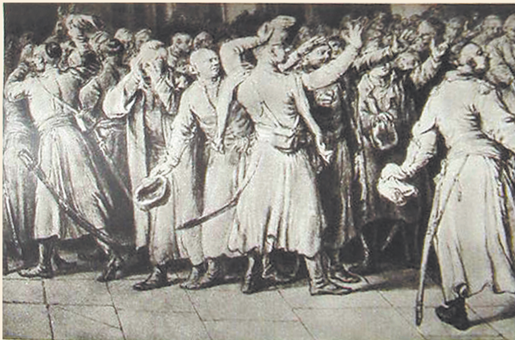
Dość ponury obraz polskiej szlachty, skłonnej do awantur, pijaństw i przemocy, wylania się ze słynnych prac Norblina

W pewnym stopniu z ziemią sanocką związany był m.in. największy „zadymiarz” przedrozbiorowej Polski, Stanisław Stadnicki, zwany „diabłem łańcuckim”, który szablą nader chętnie używał w rozprawach z licznymi nieprzyjaciółmi. Niektóre jego wyczyny przeradzały się wręcz w długotrwałe, niezwykle krwawe wojny. Nie lepsi od niego w zapiekłości i porywczosci byli synowie, zwani nie bez kozery „diabłętami”. Ale i na samej ziemi sanockiej nie brakowało chętnych do siłowego rozwiązywania sporów. O niektórych incydentach, pobudzających przed wiekami emocje, możemy przeczytać m.in. w głośnej, kilkakrotnie wznawianej książce „Prawem i lewem” Władysława Łozińskiego. Niektóre z nich stały się również kanwą świetnego serialu historycznego „Rycerze i rabusie” opartego na autentycznych historiach.