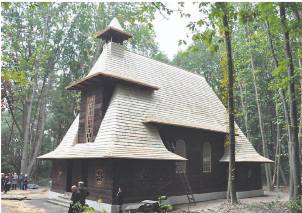
Lwów 2013 r. Skansen, kościół z Jazłowczyka