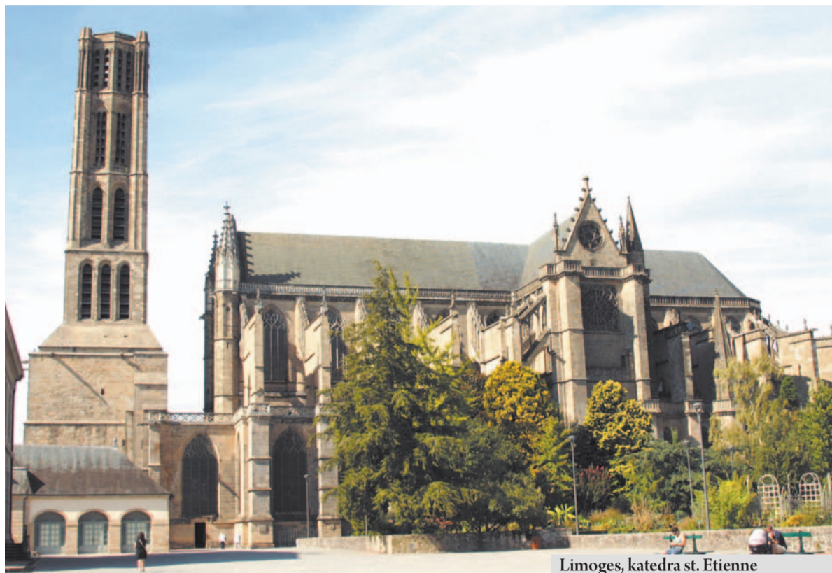
Limoges, katedra st. Etienne

Chłopcy zbiegali po schodach, trzymając się poręczy jedną ręką, w drugiej trzymali swoje ulubione zabawki do podróży. Na dole opróżniłem skrzynkę na listy, gdzie leżał list od stryja z Charleville. Na czytanie nie było jednak czasu. Samochód był już załadowany i tylko doszła torba z żywnością na drogę.