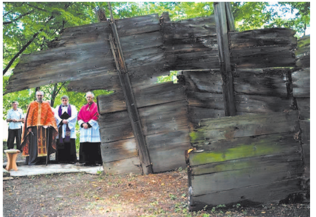
Kupna. 2012 r. ceremonia przeniesienia szczątków cerkwi