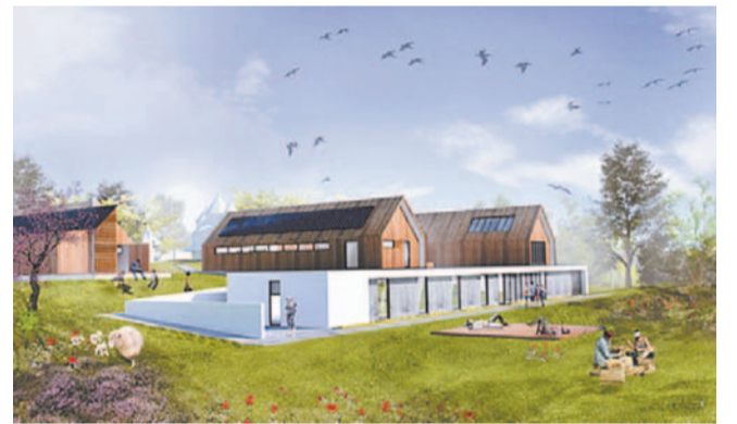
Bystre. Dyplom roku

pierwszy w nim sakralny obiekt obrządku rzymsko-katolickiego, zabytkowy kościółek z Jazłowczyka koło Brodów (2013), a – bardzo specyficzny w swej architekturze – zabytkowy kościółek w Rozluczu koło Turki (2015) poddany został starannej konserwacji. Oba te obiekty – niezależnie od przywróconej im funkcji sakralnej – służą też jako pomieszczenia dla różnego rodzaju wydarzeń kulturalnych jak koncerty czy wystawy. W kontakcie z Towarzystwem Ochrony Zabytków w Ustrzykach Dolnych zainteresowała się ona dalszymi niszczącymi cerkiewkami Bieszczad, a myśląc o ich renowacji opracowała taki projekt dla cerkwi w Listkowatym (2015). Zainteresowana była też ratowaniem niszczącej cerkwi w Czarniej, a także – położonej już