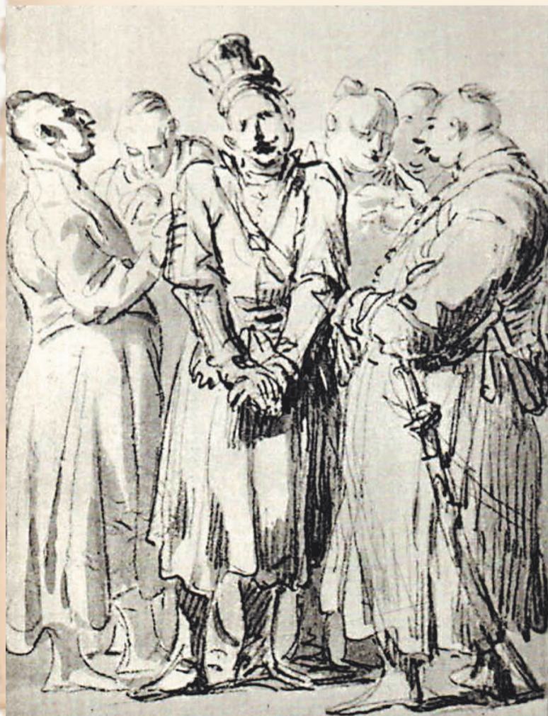
Norblin polska szlachta