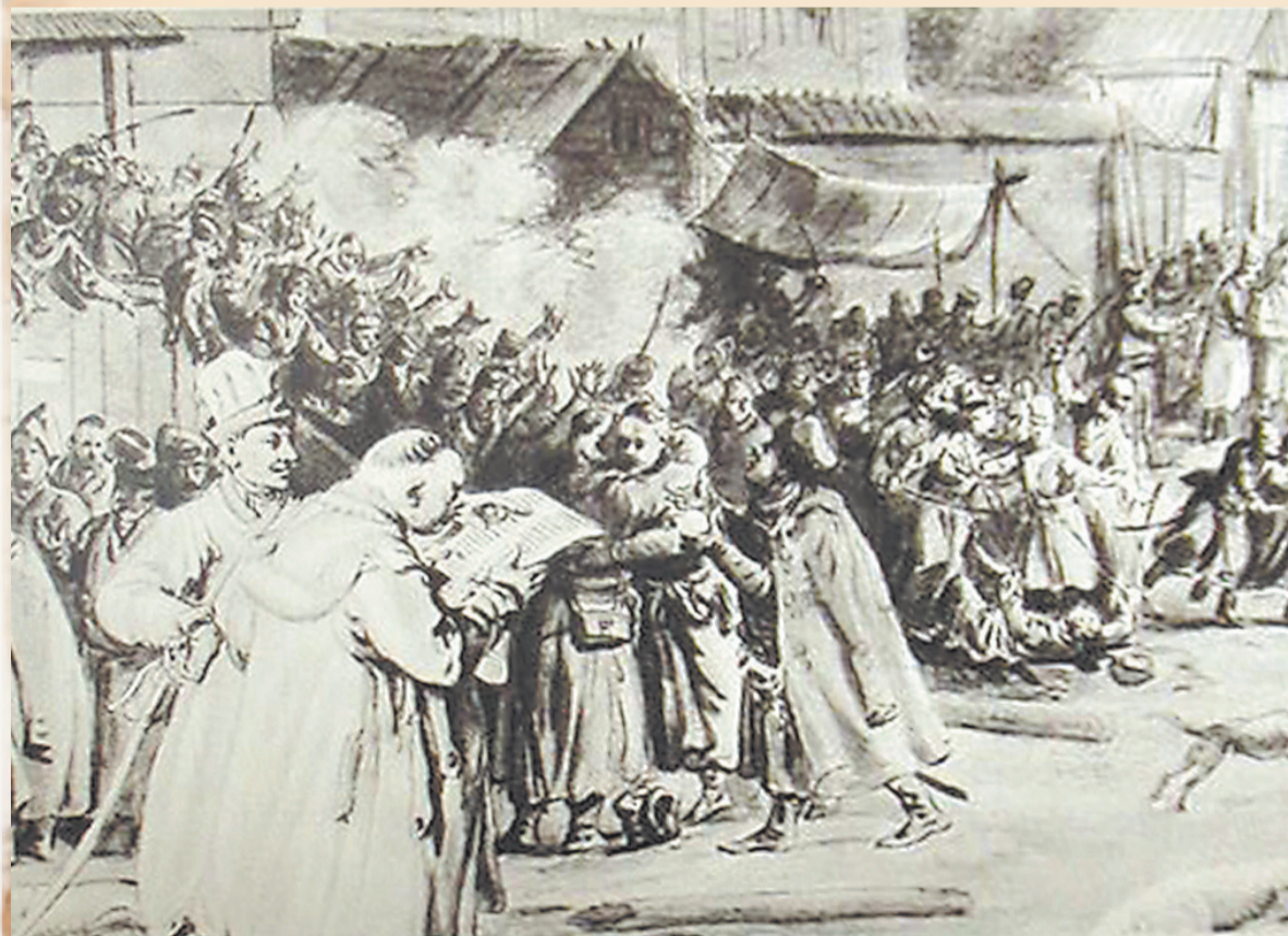
Norblin, Bójka szlachty na sejmiku