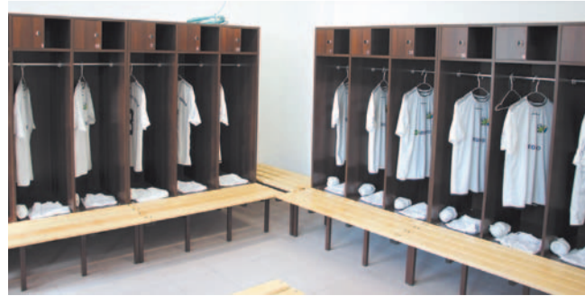
Nowe szatnie wręcz lśnią