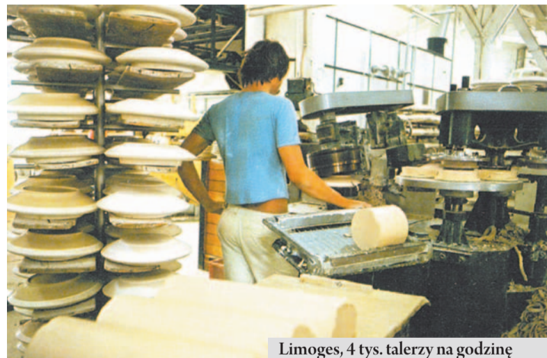
Limoges, 4 tys. talerzy na godzinę

Pośrodku holu stała okrągła gablota, wewnątrz której wyeksponowano porcelanową kompozycję „Taniec we czworo” produkcji Królewskiej Manufaktury w Limoges z roku 1787. W kilku innych gablotach stały wyśmienite okazy ręcznie malowanych wyrobów porcelano-