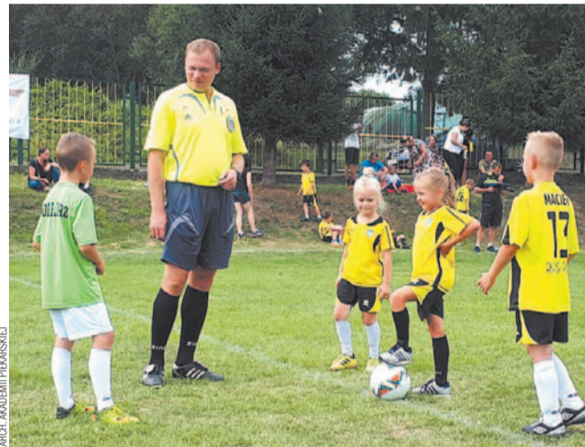
Reprezentantki AP w niczym nie ustępowały kolegom z zespołu