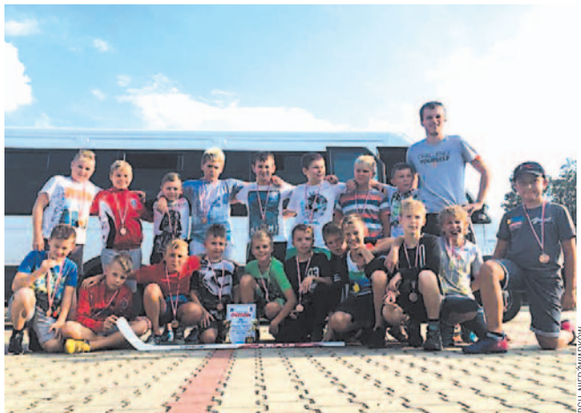
Drużyna żaków dobrze powałać na Podhalu