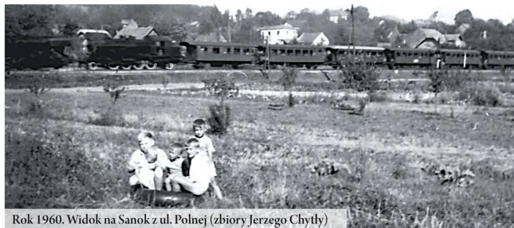
Rok 1960. Widok na Sanok z ul. Polnej

dy i sady należące do rodziny Ścibor-Rylskich, podobnie jak wybudowana pod koniec XIX w. rezydencja. Natomiast później, gdy została wybudowana Kolej Transwersalna i przystanek przy ul. Grunwaldzkiej, to połączono ulicę Kościuszki z ulicą Słowackiego i podzielono ją na ulicę Sienkiewicza i ulicę Głowackiego.