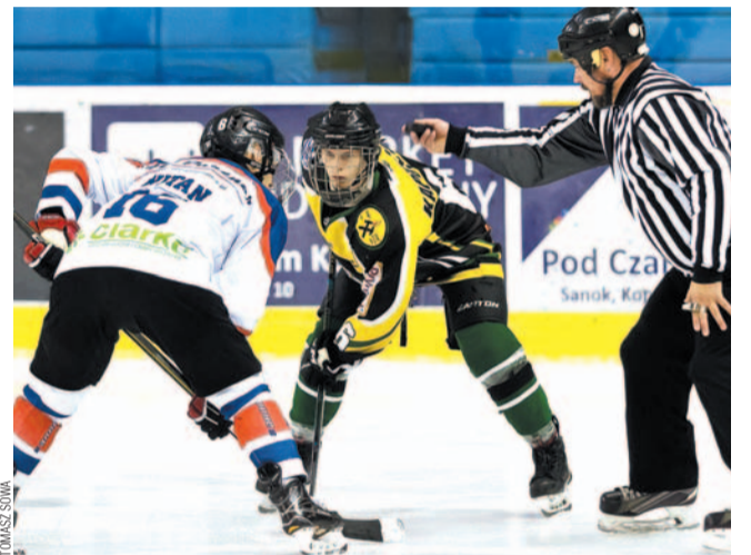
Juniorzy rozpoczęli sezon od wygranych z JKH Jastrzębie