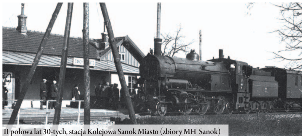
II połowa lat 30-tych, stacja Kolejowa Sanok Miasto (zbiory MH Sanok)