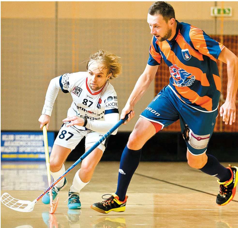
To zdjęcie świetnie oddaje charakter dwumeczu – mały klub z Sanoka postawił się wielkiej Szarotce

Spektakularne zwycięstwo „Watahy” – jeszcze w połowie ostatniej tercji gospodarze prowadzili 3-0, jednak nasza drużyna w ciągu 6 minut strzeliła 4 bramki, w końcówce utrzymując korzystny rezultat.