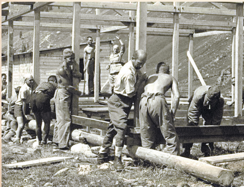
Studenci Obozu Uniwersyteckiego w Herisau budują baraki w Pailerboden