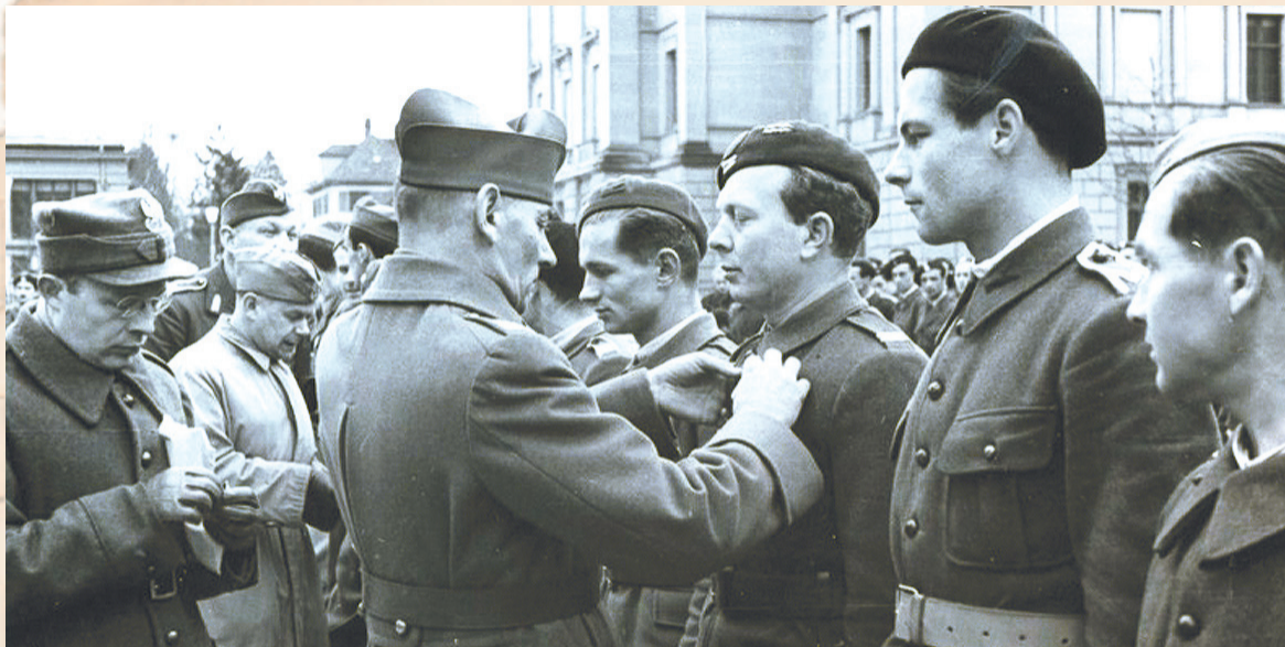
General Prugar-Ketling odznacza internowanych w Szwajcarii żołnierzy

Mimo surowej oceny polskich możliwości obronnych generał twardo spełniał swój żołnierski obowiązek. Jak pisał w innym fragmencie: „Nikt od spełnienia obowiązku nie uchylał się. Nikt z pola walki bez rozkazu nie schodził”. Prugar-Ketling był autorem jednego z najbardziej spektakularnych sukcesów polskiej obrony w Kampanii Wrześniowej. Idąc na broniący się przed Niemcami Lwów, w bitwie pod Jaworowem 15 i 16 września 1939 roku rozbił w puch doborowy zmotoryzowany pułk SS „Germania”. Ta porażka bolała Niemców tak bardzo, że w późniejszym okresie, w przeciwieństwie do innych jednostek, „Germanii” nie odtworzono.