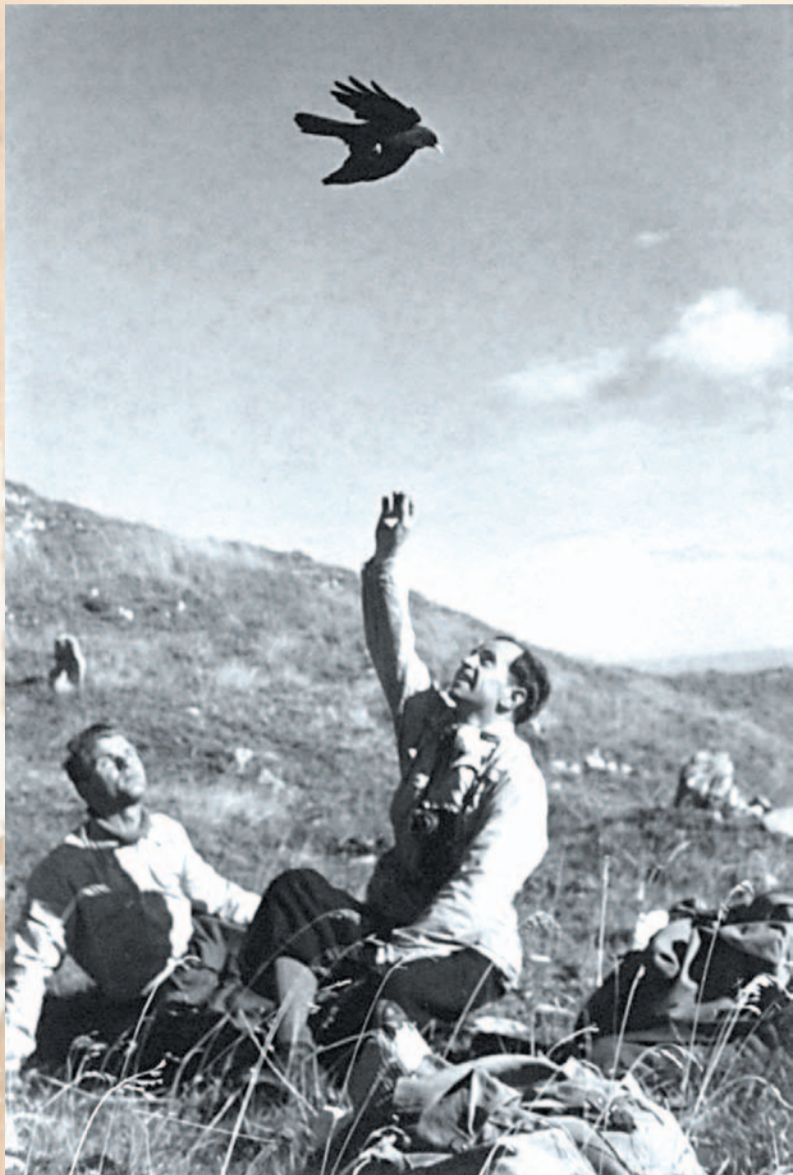
Internowani w Szwajcarii