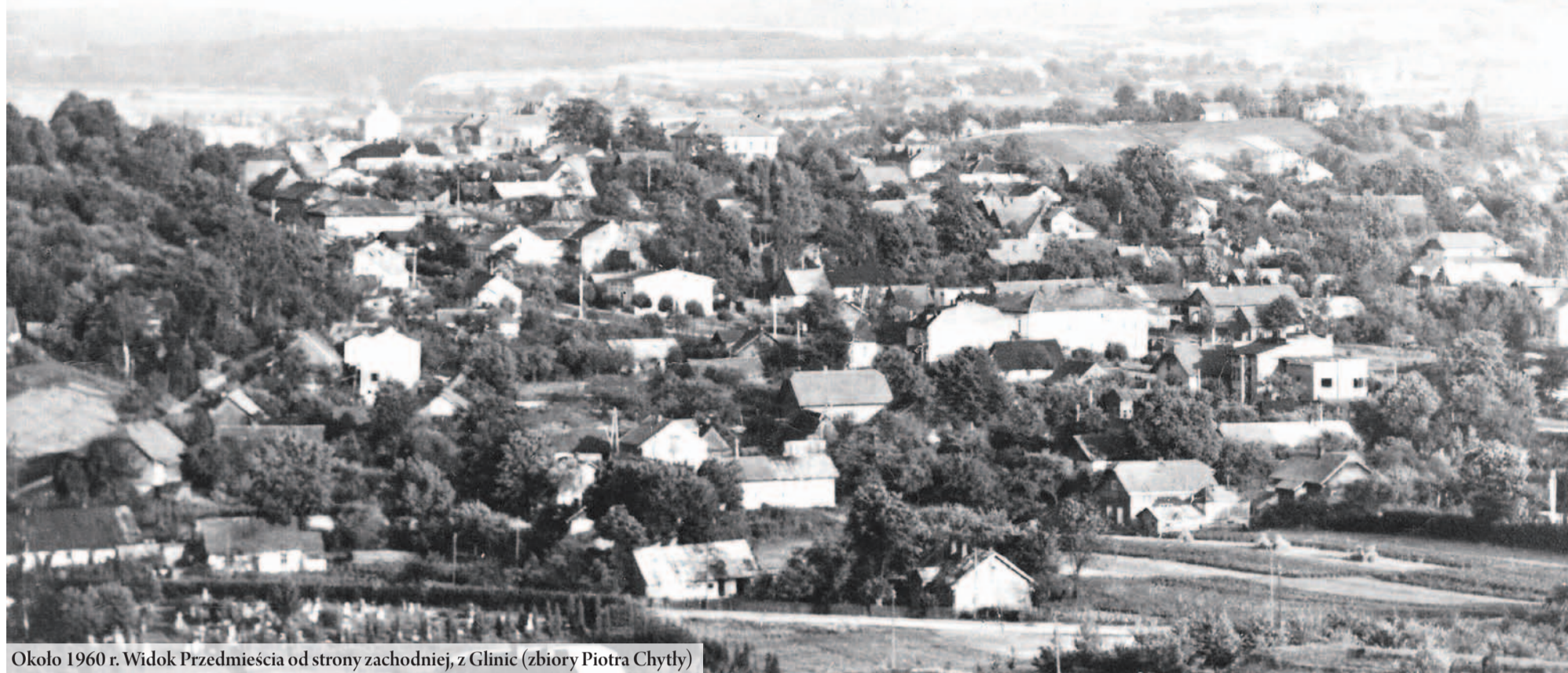
Okolo 1960 r. Widok Przedmieścia od strony zachodniej, z Glinic