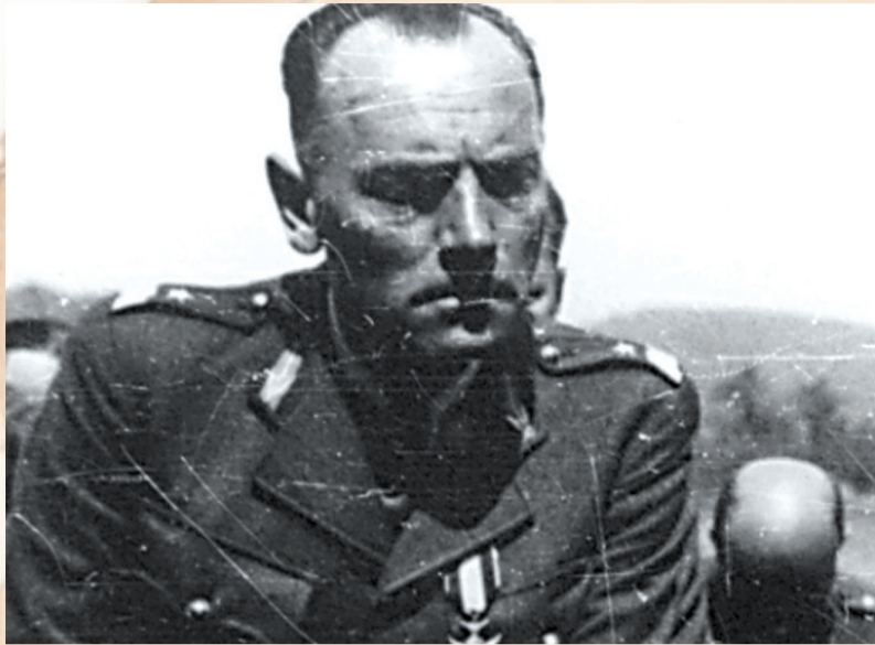
General Prugar-Ketling w czasie internowania w Szwajcarii