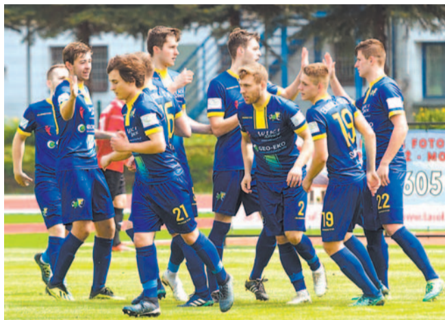
Piłkarze Ekoballu Stal nie przestraszyli się kadry narodowej

Przebywająca na obozie w Olszanicy kadra Służby Więziennej, która przygotowuje się do Mistrzostw Europy w Słowacji, zaproponowała stalowcom rozegranie meczu kontrolnego. Wyzwani przyjęli, nie dając się pokonać – było, nie było – reprezentacji Polski.