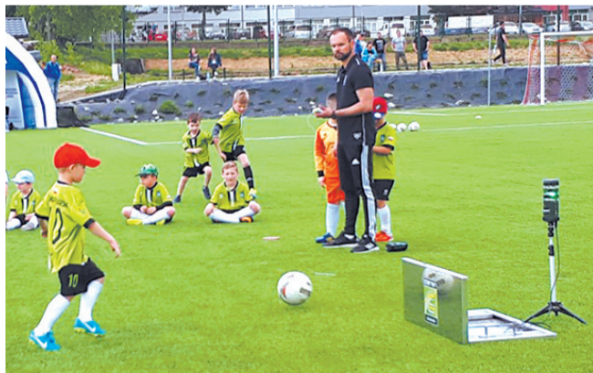
Specjalistyczny trening dał zawodnikom AP wiele radości

Ponad osiemdziesięciu wychowanków Akademii Piłkarskiej wzięło udział w kilkugodzinnej sesji treningowej na sztucznym boisku centrum „Wiki”. Ich klub zorganizował całość wraz z Coerver Coaching Polska.