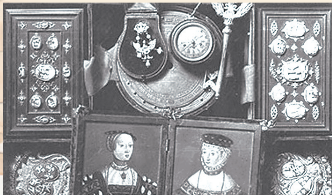
Fragment zawartości „Szkatuły królewskiej”