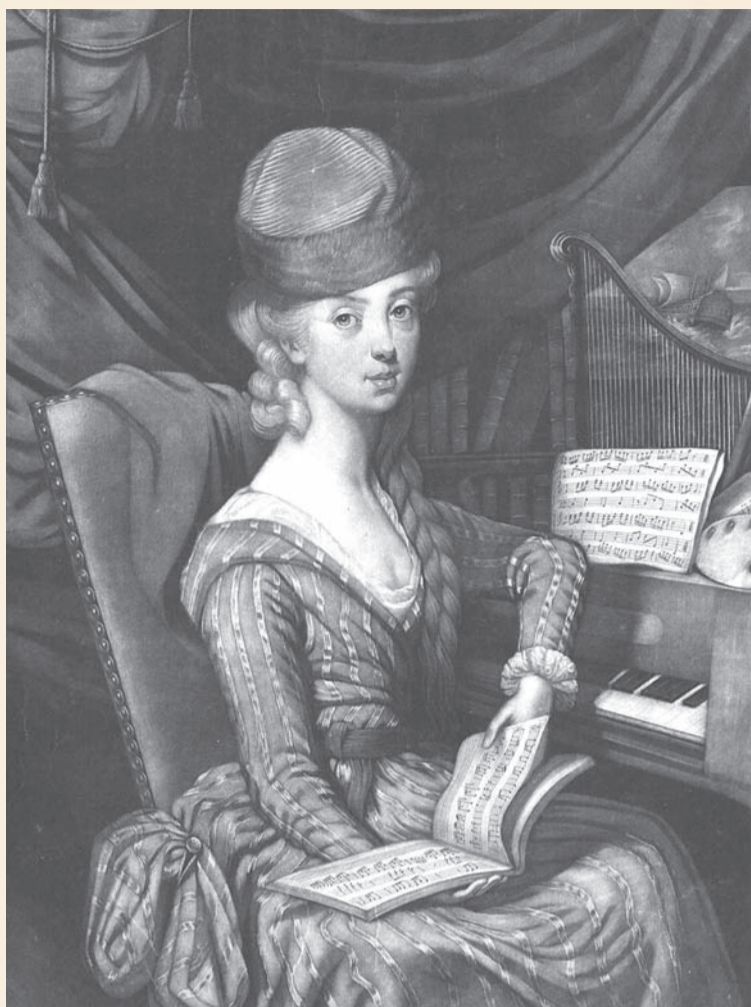
Księżna Izabela Czartoryska – twórczyni niezwyklej kolekcji Czartoryskich

Już w 1927 roku do władz polskich zgłosił się obywatel austriacki Emmeich Kolman proponując, że w zamian za znaleźne (mówiono o jednej trzeciej wartości lub 25 proc. monet) ujawni miejsce ukrycia skarbu twierdzy, warte go ponoć astronomiczną kwotę ówczesnych trzech milionów złotych. Ówczesne władze okazały jednak znacznie większy sceptycyzm niż kilkadziesiąt lat później, negocjując sprawę tzw. złotego pociągu w Wałbrzychu i ostatecznie nic z tego nie wyszło.