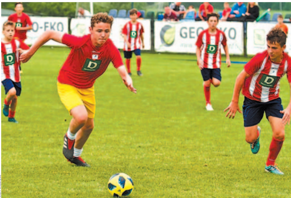
Finałowy mecz kat. U-13 pomiędzy Paragwajem i Hiszpanią dostarczył niesamowitych emocji

Rywalizacja zakończona. Finały miejskie rozegrano na stadionie w Bykowcach, gdzie o awans do zmagania ogólnopolskich walczyły drużyny z kategorii U-9, U-11 i U-13. Zwycięstwa odniosły trzy ekoballoskie zespoły, odpowiednio Włochy, Wyspy Owcze i Paragwaj.