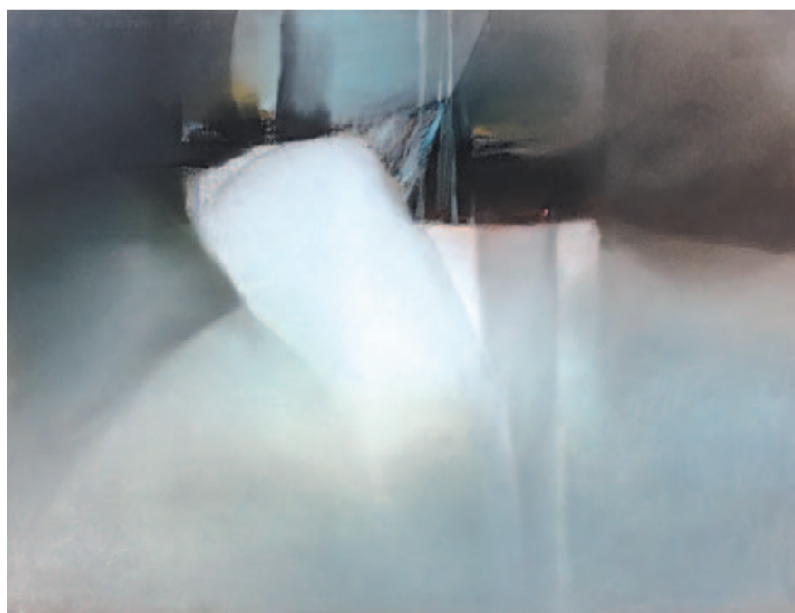
DROGA W NIEZNANE