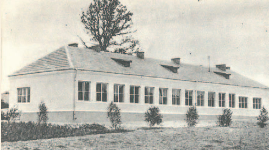
Szkoła Podstawowa w Adamówce – pierwsza tysiąclatka na Rzeszowszczyźnie