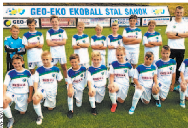
Młodzicy starsi Ekoballu pewnie pokonali drużynę AP Jasło