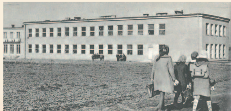
Szkoła Podstawowa imienia Aleksandra Zawadzkiego w Studzianie