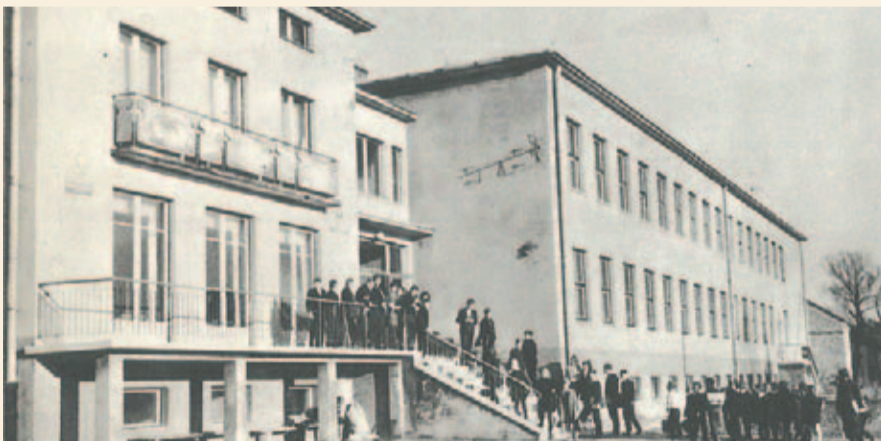
Szkoła Podstawowa imienia Jana Bruna w Skolyszynie