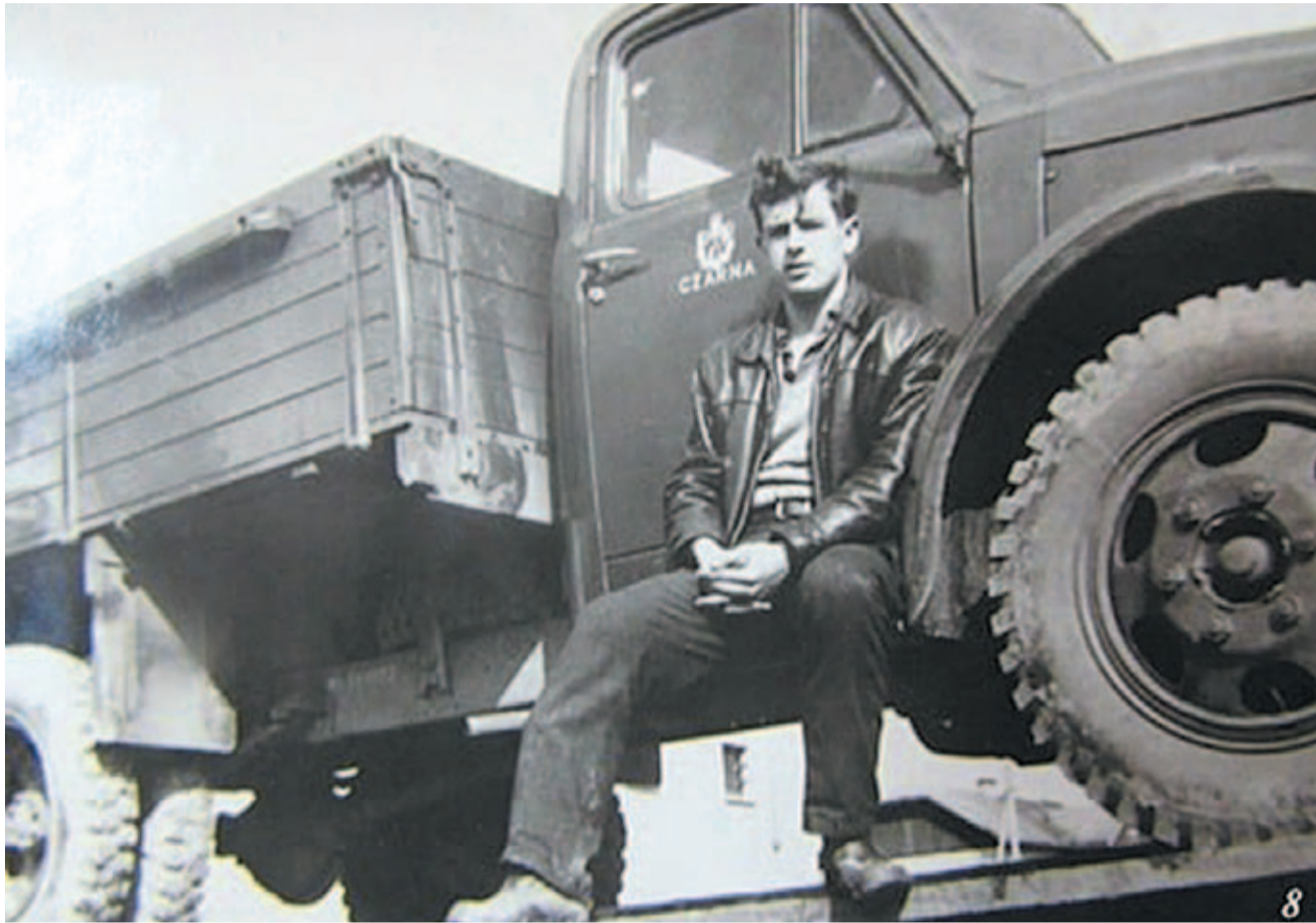
Ja jako młody kierowca w PGR. Samochód Gaz 51, prod. ZSRR, pierwowzór Lublina

nikowa telewizji Krosno na szczycie Żukowa i jakieś namiastki cywilizacji zaczęły wtenczas raczkować. Potem był telefon na korbkę i parę telefonów na jednym numerze plus panie z centrali. Było coraz weselej, wszyscy wszystko słyszeli, co kto mówi przez telefon, a czasami pani z centrali musiała pośredniczyć (powtarzać treść rozmowy), bo była słaba słyszalność.