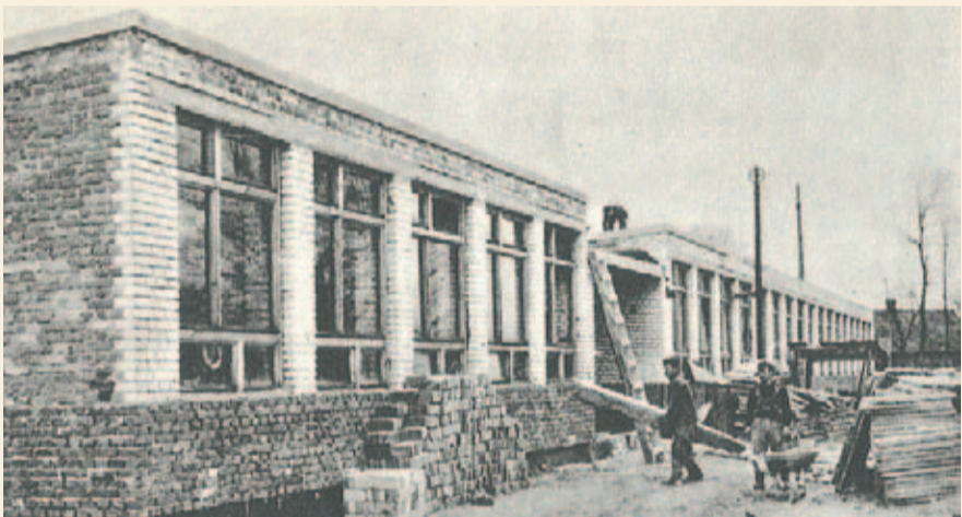
Budowa szkoły w Rudzie Łańcuckiej