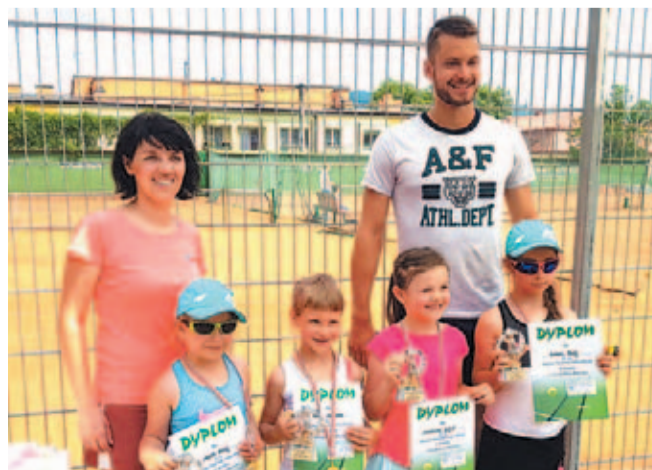
Medalistki kategorii do lat 8