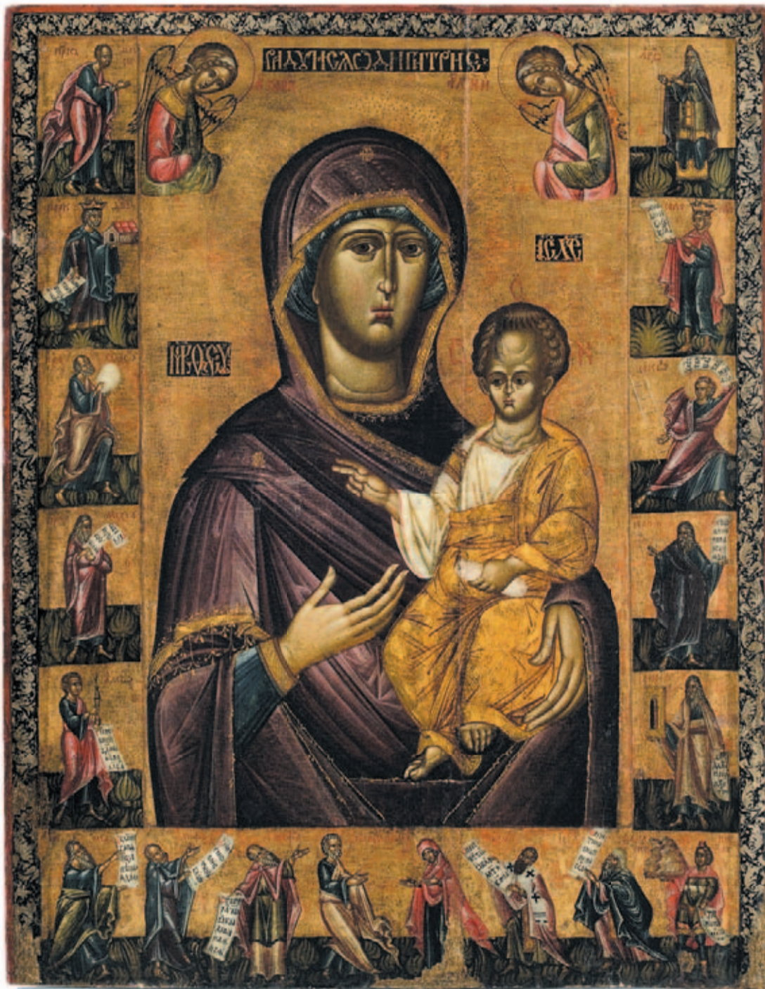
ZBIORY MUZEUM HISTORYCZNEGO W SANOKU, MATKA BOSKA HODEGETRIA, POCHODZENIE – PANISZCZÓW

W zbiorach sztuki cerkiewnej Muzeum Historycznego w Sanoku jest przynajmniej kilka ikon, które moglibyśmy określić mianem arcydzieła. Jest wśród nich przede wszystkim prawosławna ikona Matki Boskiej Hodegetrii (Hodigitrii) z cerkwi pw. św. Paraskewy Tyrnowskiej z Paniszczowa, namalowana w 1. połowie XVI wieku.