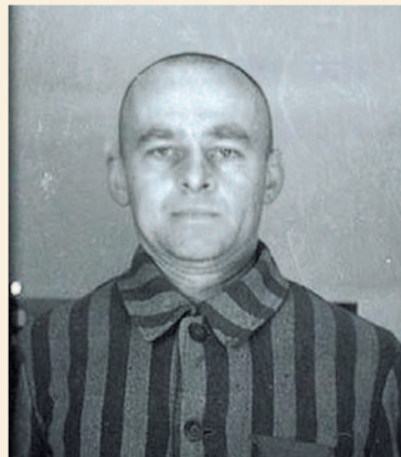
Rotmistrz Witold Pilecki jako Tomasz Serafiński w Auschwitz