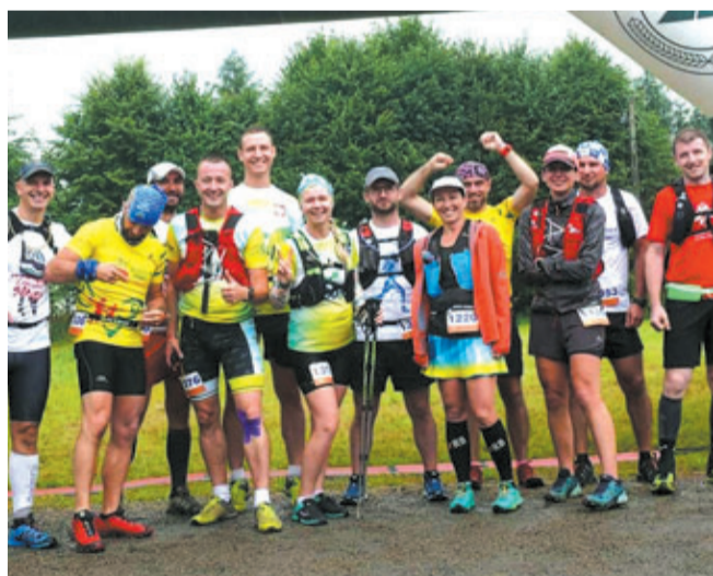
Pozytywnie Zabiegani znów pojechali na zawody liczną grupą