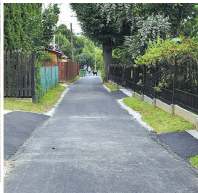
FZ Ulica Niedzielskiego przed i po remoncie