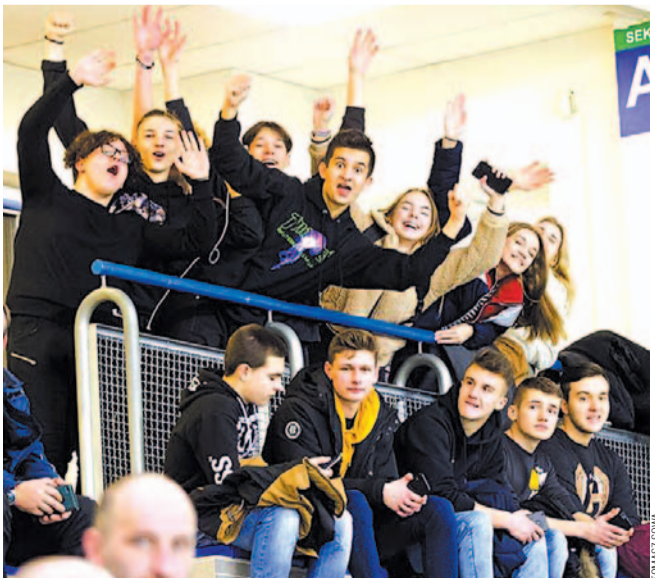
Kibice już nie mogą doczekać się startu nowego sezonu

Nowy sezon zbliża się wielkimi krokami. Przed jego rozpoczęciem seniorska drużyna Niedźwiadków rozegra sparingowy dwumecz ze słowackim Trebiszowem. Już za dwa tygodnie, czyli w pierwszy weekend września startuje Centralna Liga Juniorów, połączona z I Ligą, a w ostatni – II Liga Słowacka.