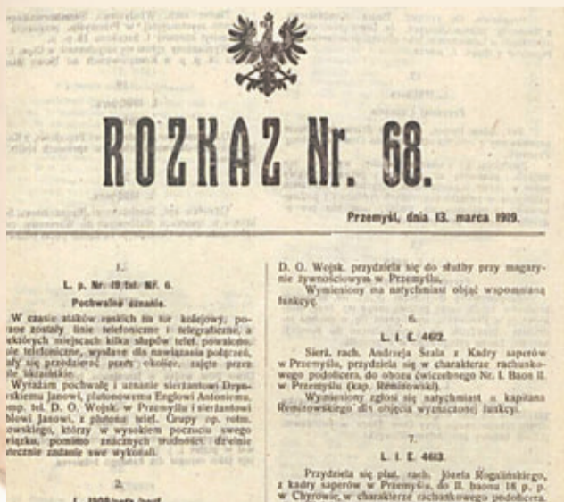
Jeden z rozkazów DOW w Przemyślu

Normy określały także dodatki żywnościowe. W lutym 1919 r. było to m.in. 15 gram tłuszczu na dzień (30 gram słoniny dla żołnierzy frontowych), 0,5 grama herbaty i 30 gram cukru dziennie. Ograniczone było wydawanie alkoholu: „Alkohol, mianowicie rum, będzie wydawany tylko w miarę zapasów, wyłącznie w ilości 4 cl na dzień i żołnierza, wyłącznie do herbaty dla oddziałów będących w linii bojowej. Kupno alkoholu jest bezwarunkowo wzbronione.”