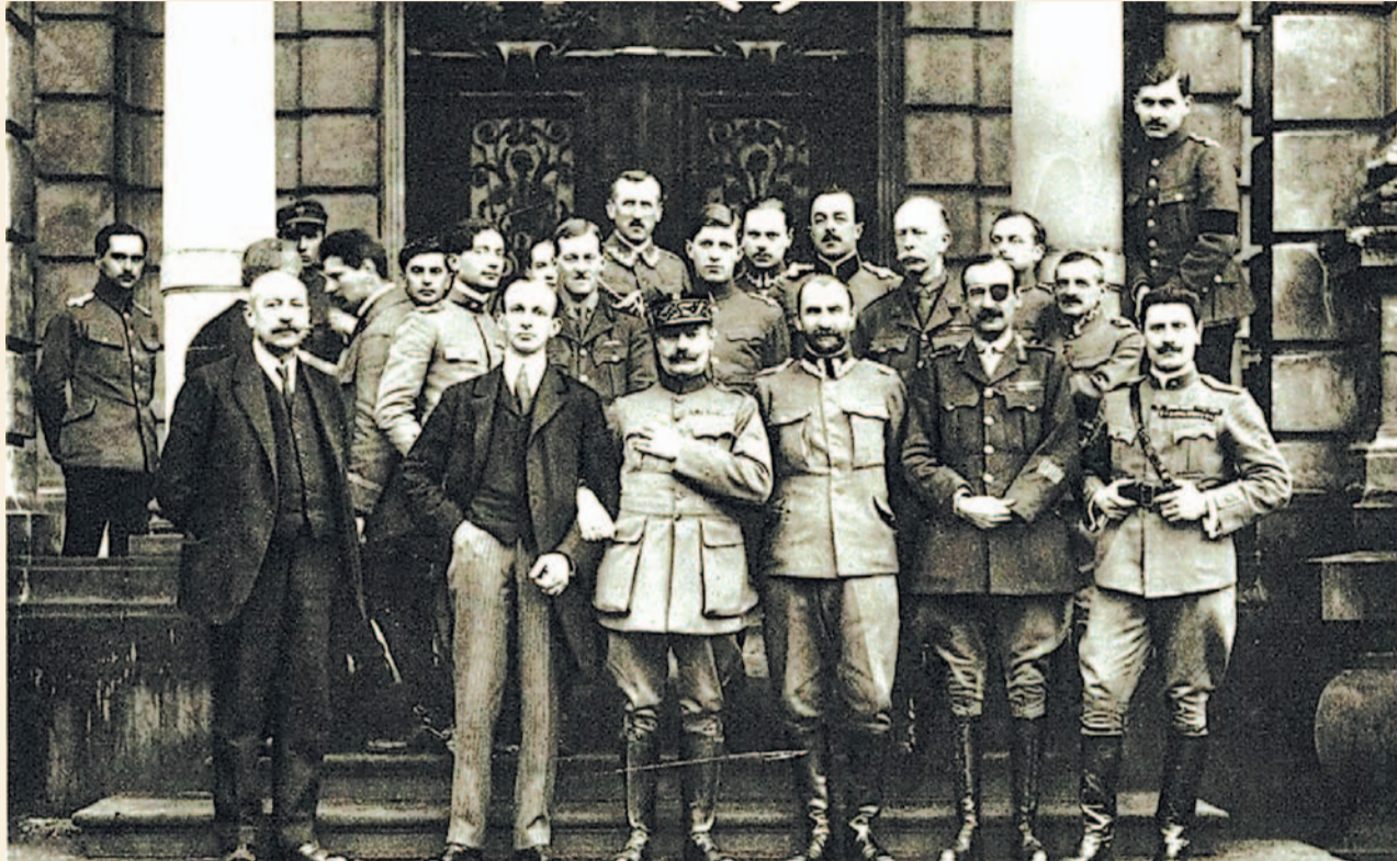
Misja aliancka we Lwowie w lutym 1919 r.

W pierwszej połowie 1919 r. wschodnie tereny dzisiejszego Podkarpacia znajdowały się niemal na linii polsko-ukraińskiego frontu. W wielu miastach, nawet tych całkowicie zajętych przez oddziały odradzającego się państwa polskiego panował wojenny rygor. Sprawy codziennego życia regulowane były często przez komunikaty i rozkazy wojskowe. Jak wyglądało – w ich świetle – przyfrontowe życie?