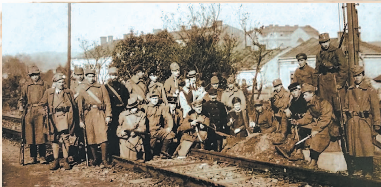
Polscy ochotnicy w Przemyślu w 1918 roku.