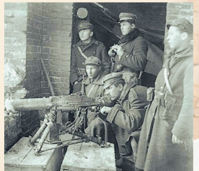
W czasie walk o Lwów.