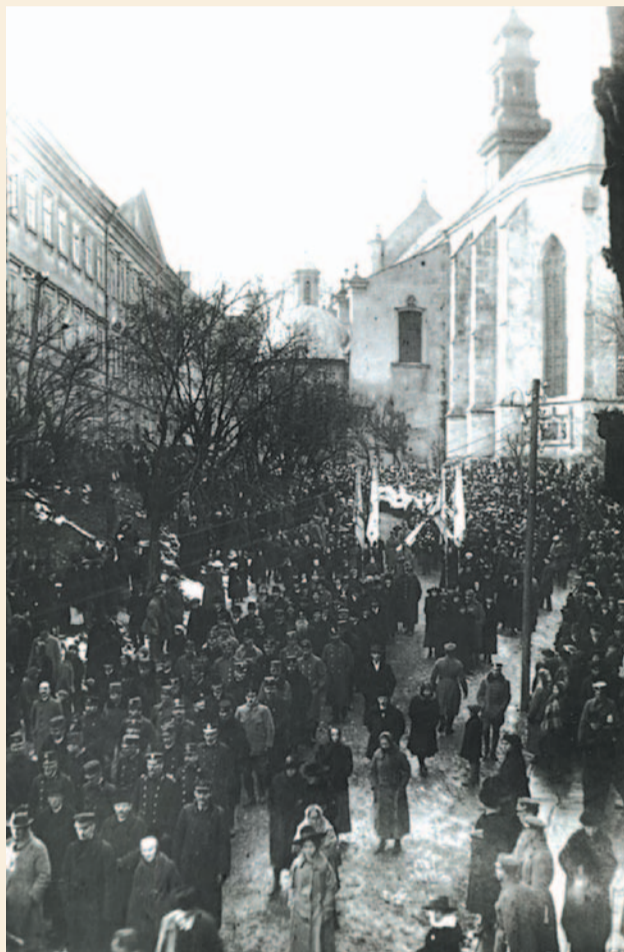
Pogrzeb poległych w Przemyślu.

W „Rozkazach” nie brak było oczywiście i przyjemniejszych rzeczy, jak np. pochwał dla wyróżniających się żołnierzy i oficerów. Gen. Zygmunt Zieliński, dowódca 3 Dywizji Piechoty Legionów niezwykle ciepłymi słowami