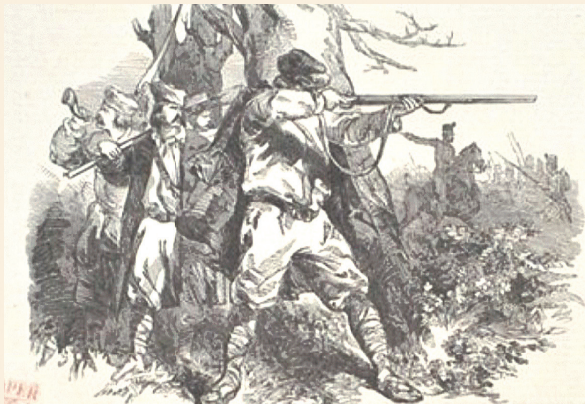
Powstanie 1846 na ilustracji z ówczesnej prasy angielskiej.

Planowane na początek 1846 roku kolejne powstanie narodowe, mające przynieść Polsce niepodległość, miało objąć – według planów inicjatorów – wszystkie trzy zabory. W rzeczywistości ograniczyło się praktycznie do okolic Krakowa i części Galicji wchodzącej w skład monarchii habsburskiej. Na jego niepowodzenie wpływ miały nie tylko przeciwdziałania państw zaborczych, ale również wroga postawa ludności chłopskiej i błędy organizatorów.