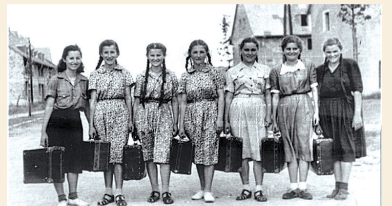
Greckie emigrantki w Polsce na początku lat 50.

Korekta granic z 1951 roku nie miała być ostatnią na tym terenie. Jeszcze większą wymianę terenów planowano w listopadzie 1952 roku. Polska miała odstąpić Związkowi Radzieckiemu aż 1300 km kwadratowych z powiatów tomaszowskiego i hrubieszowskiego wraz z Hrubieszowem. W zamian mieliśmy otrzymać Niżankowice, Dobromił, Chyrów, Smolnicę i biegnący po ukraińskiej stronie granicy odcinek linii kolejowej Zagórz-Przemyśl. Kilka miesięcy później, wraz ze śmiercią Stalina, od pomysłu odstąpiono.