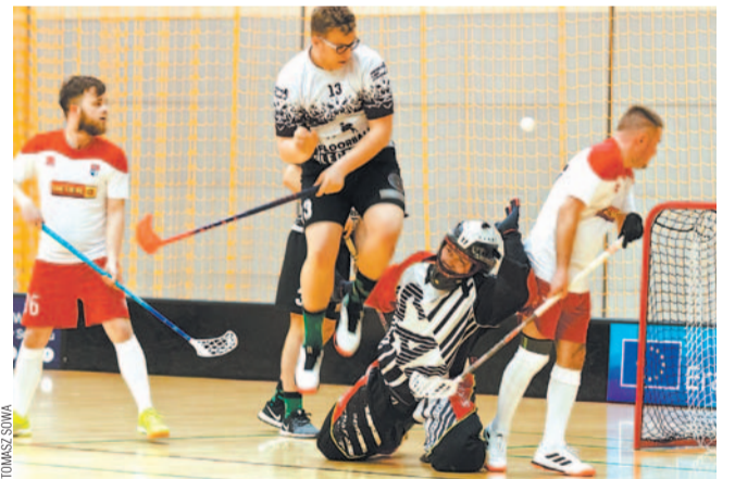
Broniące tytułu Niedźwiedzie nie dały rady „Legendarnym”