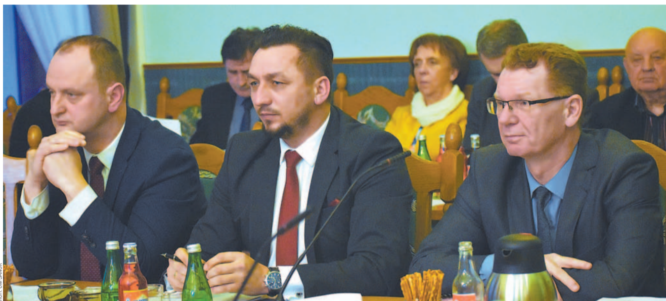
ARCHE LUK SANOK

Burmistrz przedstawił harmonogram czynności, jakie powinny być podjęte. Pierwszym krokiem miałyby być podjęcie uchwały do 30 listopada br. w sprawie wyrażenia woli oraz przeprowadzenia konsultacji społecznych w sprawie zmiany granic miasta Sanoka.