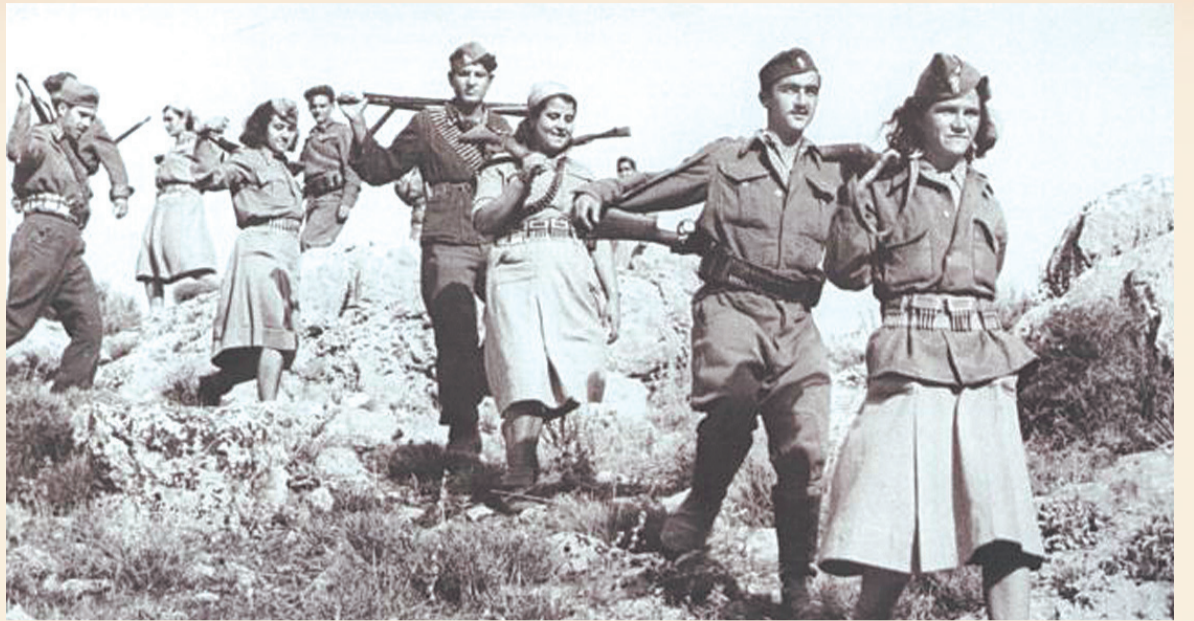
Pokłosiem krwawej wojny domowej w Grecji był masowy przyjazd Greków do Polski, w tym w Bieszczady

Akcję przesiedleńczą nazwano kryptonimem „H-T” od pierwszych liter stolic wysiedlanych powiatów (Hrubieszów i Tomaszów). Łącznie z przekazanych ZSRR terenów wysiedlono 14 151 osób, większość na