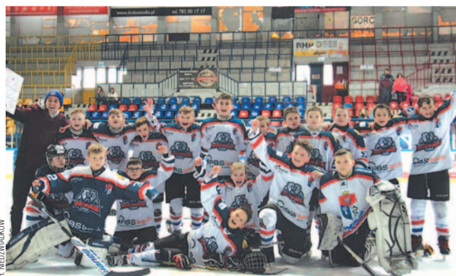
Niedźwiadki zakończyły sezon udanym turniejem na Podhalu