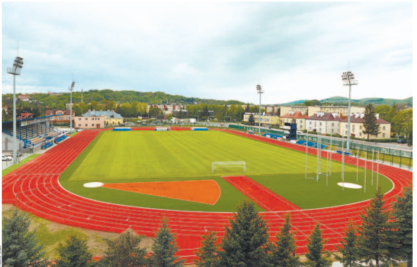
Na razie nie wiadomo, kiedy piłkarze Ekoballu Stal rozegrają pierwszy wiosenny mecz na „Wierkach”

Przejdźmy do łyżwiarstwa. Tu ostatni start stracili tylko short-trackiści UKS-u MOSiR, bo odwołano kończące sezon Mistrzostwa Polski w Białymstoku. Natomiast panczeniści Górnika „zmięścili się w czasie”, gdyż klub nie planował wyjazdu na wieloobojowy championat w Tomaszowie Mazowieckim.