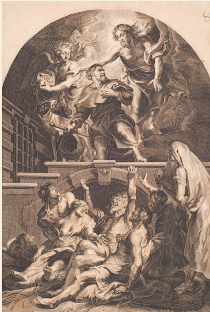
Św. Roch patron ofiar powietrza morowego (rycina Paula Pontiusa z XVII w.)

Na przestrzeni wieków dzisiejsze Podkarpacie nawiedzały liczne katalizmy i epidemie dziesiątkujące ludność. Stosunkowo dużo wiarygodnych materiałów na ten temat zachowało się z czasów, gdy te tereny wchodziły w skład monarchii habsburskiej, będąc częścią Królestwa Galicji i Lodomerii.