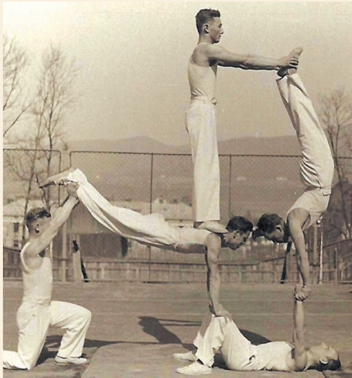
Członkowie sanockiego gniazda TG „Sokół” w czasie ćwiczeń

Pod koniec czerwca 1889 roku oficjalnie działalność rozpoczęły struktury Towarzystwa Gimnastycznego „Sokół” w Sanoku, organizacji wychowawczej, która chlubnie zapisała się w historii Polski. Jej członkowie wnieśli ogromny wkład w odzyskanie niepodległości.