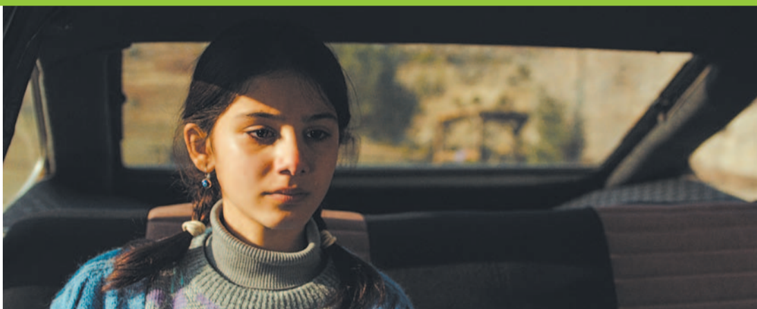
„Opowieść o trzech siostrach”

Francja, Niemcy, Rumunia 2017, dramat (125 min), reżyseria Calin Peter Netzer.