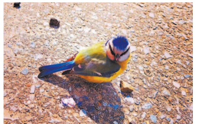
Konkurs fotograficzny. Miejsce III. Deshawn Kurasik kl. 6b