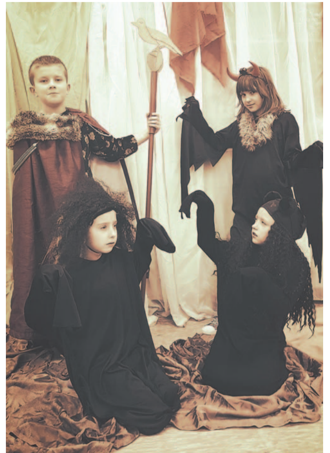
Projekt „Legends podkarpackie”

Ilość i różnorodność projektów oraz działań jest naprawdę imponująca. Zaangażowanie uczniów i nauczycieli w tak ciekawe projekty sprawia, że nauka staje się przygodą, pasją oraz podróżą w krainę kreatywności i aktywności.