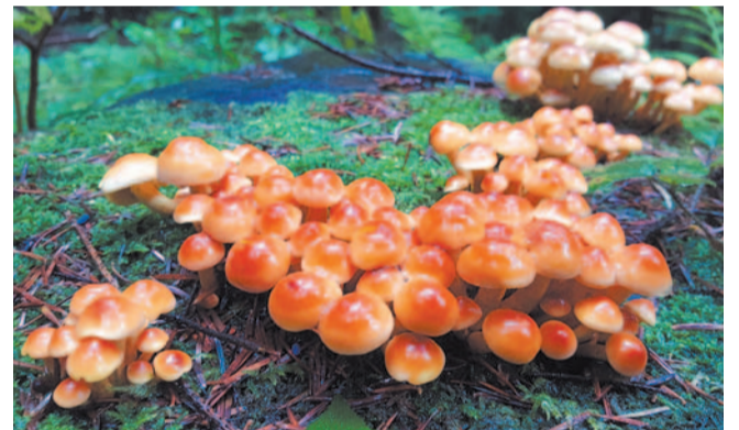
Konkurs fotograficzny. Miejsce I. Maciej Bochnak kl. 8