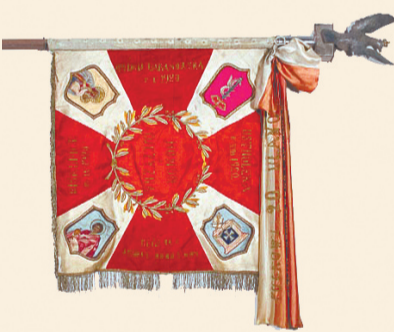
Sztandar 20 Pułku Ułanów.