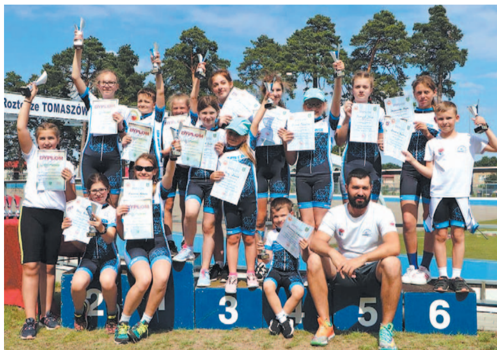
Podczas inauguracyjnych zawodów w Tomaszowie rolkarze Sprintu „natraskali medali”