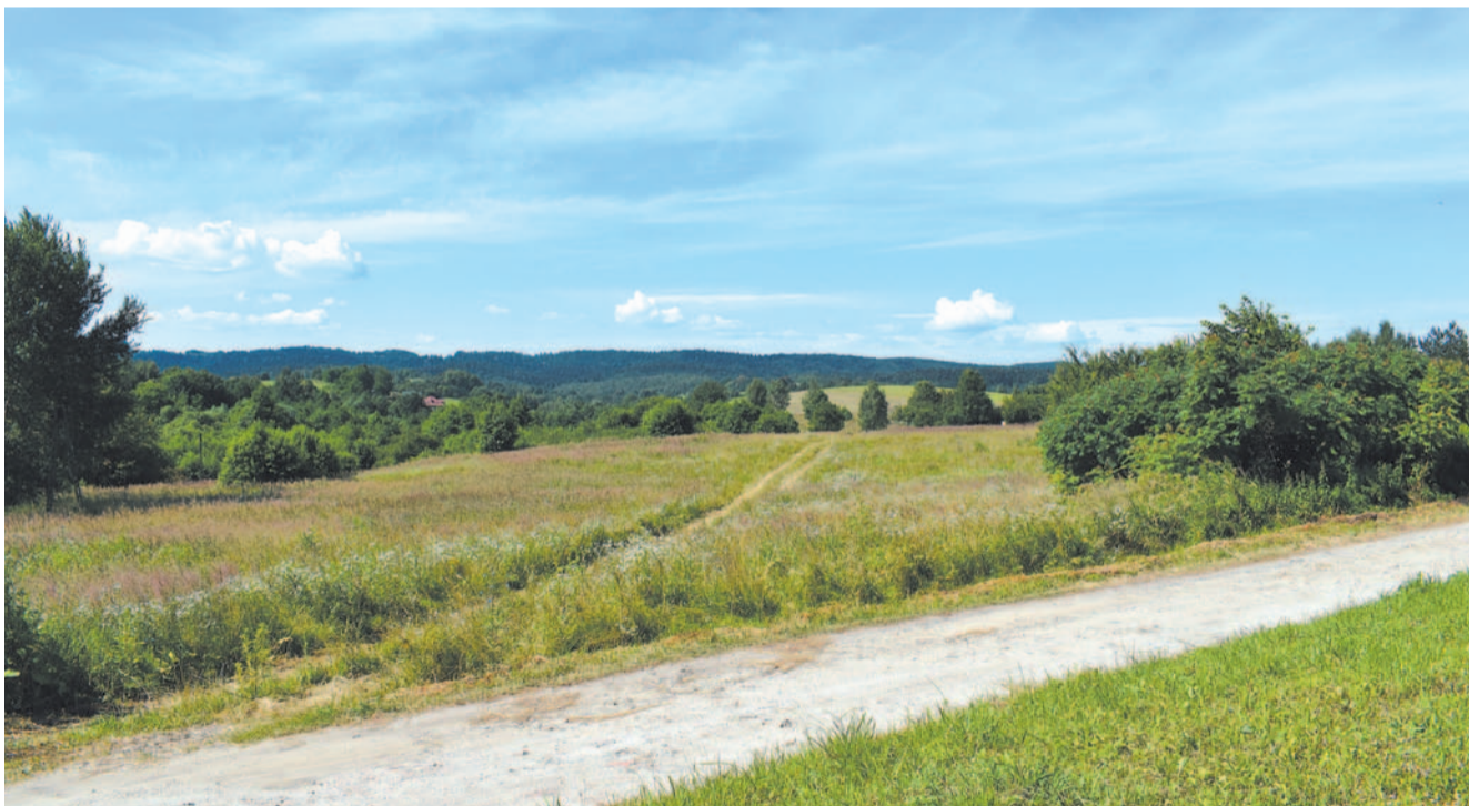
Na tej działce być może w przyszłości powstanie zakład karny

W okresie kampanii poprzedzającej wybory prezydenckie Sanok odwiedziło wielu gości z najwyższych ław sejmowych i rządowych – między innymi Zbigniew Ziobro, minister sprawiedliwości i prokurator generalny, któremu towarzyszył poseł Piotr Uruski. Minister udzielił wywiadu jednemu z lokalnych portali. Padło pytanie o więzienie na Stróżowskiej – czy jego budowa jest zagrożona. Minister dał do zrozumienia, że obecnie ruch należy do samorządu miejskiego. Czy rzeczywiście?