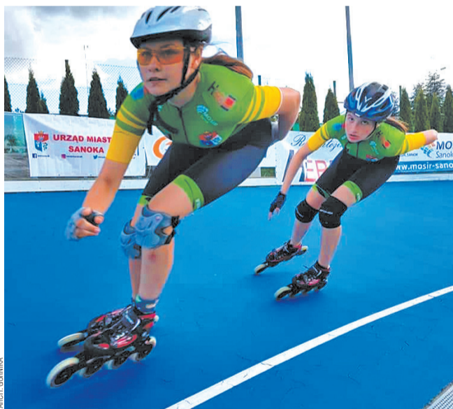
Górnicy solidnie przygotowują się do sezonu zimowego

SPONSORZY GÓRNIKA: Urząd Miasta Sanoka, Gmina Sanok, MOSiR, PGNiG, HERB, SANSPORT, Siłownia Master, Markos.