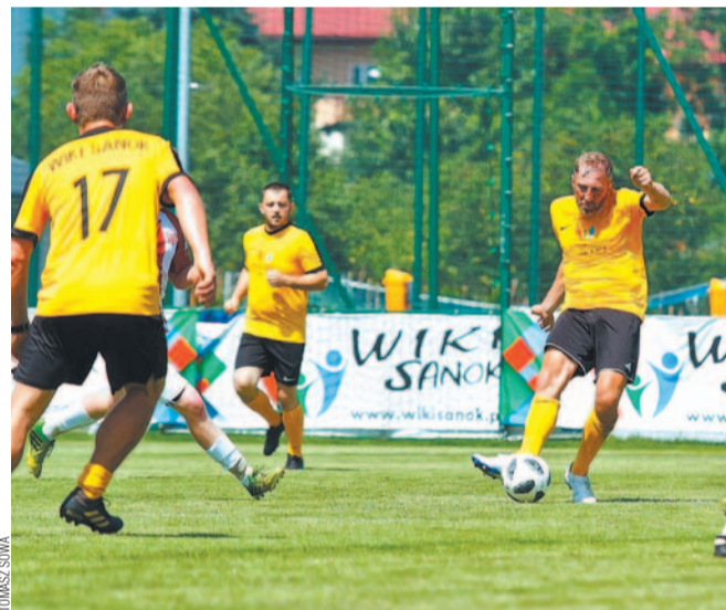
Piłkarze Wiki poradzili sobie z wyżej notowanym rywalem