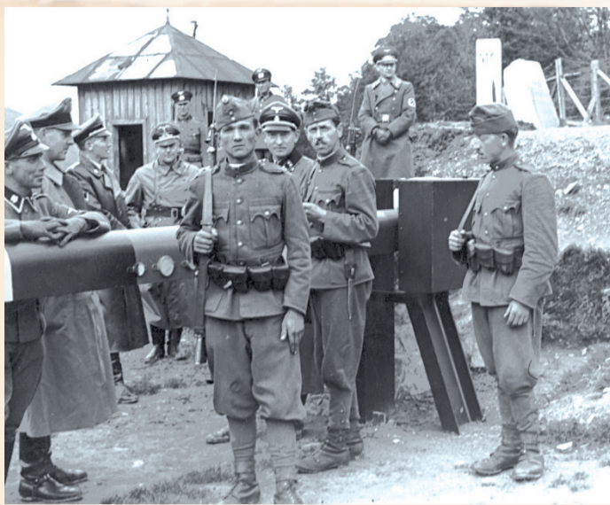
Przejście graniczne między Generalnym Gubernatorstwem a Węgrami na Przełęczy nad Rostokami w 1941 roku.

Jesienią 1939 roku dostrzeżono konieczność zorganizowania stałej łączności pomiędzy poszczególnymi komórkami, zarówno w kraju, jak i za granicą. Zadania tego podjęła się ogólnopolska organizacja konspiracyjna Służba Zwycięstwu Polski, później przekształcona w Związek Walki Zbrojnej, a następnie w Armię Krajową. W jej ramach powstała Komórka Łączności z Zagranicą, przyjmująca kryptonimy „Zenobia”, „Łzy”, „Zagroda”, „Zaloga”. Członkowie tych komórek przygotowywali najbardziej optymalne i bezpieczne trasy, punkty przerzutowe, skrzynki kontaktowe, szkolili kurierów i łączników, „organizowali” fałszywe dokumenty.