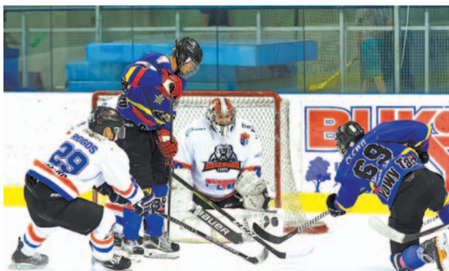
Zespół Niedźwiadków ogrył Podhale po bardzo zaciętym meczu

Jako pierwsza sezon rozpoczęła drużyna Niedźwiadków, na inaugurację pokonując Podhale. Nie bez trudu, bo mecz rozstrzygnął się w samej końcówce.