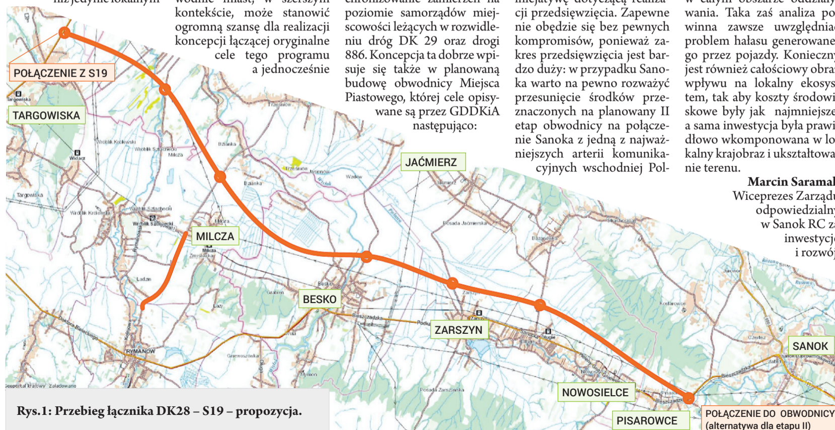
Rys. 1: Przebieg łącznika DK28 – S19 – propozycja.

7 Najwyższa efektywność przedsięwzięcia mierzona poprzez dostępność do wysokiej jakości drogi krajowej dla dużej grupy mieszkańców – lepszym dostępem do S19 byłyby objęte miejscowości o łącznej liczbie ludności (nie licząc Krosna) blisko 90 tys. mieszkańców. Patrząc szerzej, obszar pozytywnego oddziaływania proponowanego łącznika objąłby sporą część południowo-wschodniej części naszego województwa, poprawiając dostępność autostrady A4 dla ruchu z Bieszczadów.