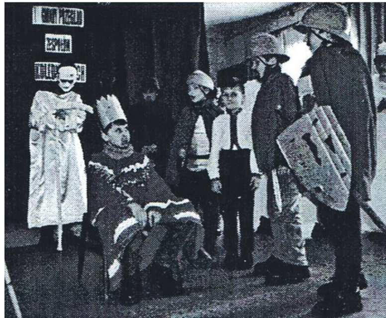
Przegląd zespołów kolędniczych w Komańczy. Kolędnicy z Komańczy, 2000 r.