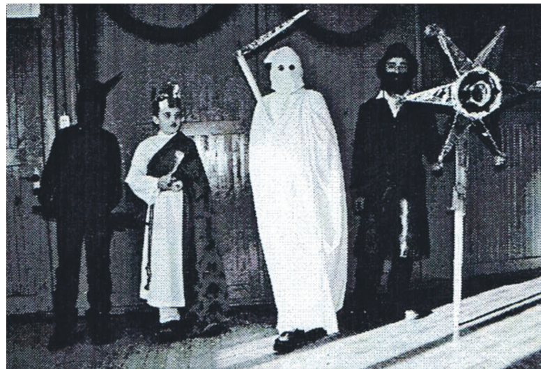
Przegląd zespołów kolędniczych w Komańczy. Kolędnicy z Czystohorbu, 2000r.

Opracowała Edyta Wilk na podstawie zebranych materiałów Danuty Blin – Olbert i Marii Marciniak z Muzeum Budownictwa Ludowego