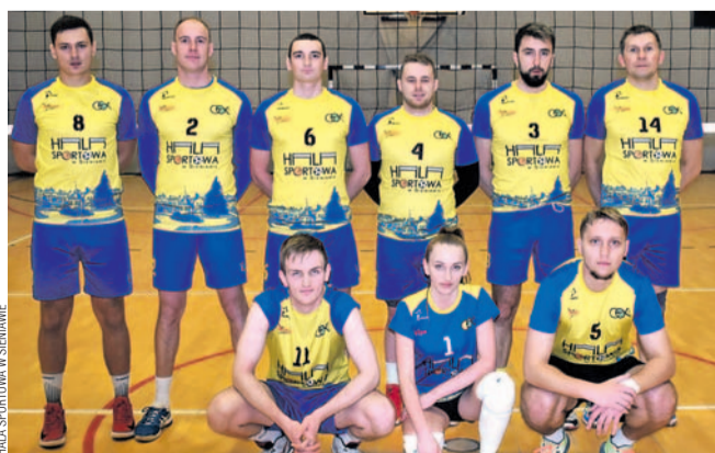
Drużyna GOSiR Later Rymanów została nowym liderem SLS

Prowadzące w tabeli Vivio Brzozów pauzowało, co wykorzystały drużyny GOSiR-u Later Rymanów i Darjanu, po pewnych zwycięstwach wyprzedzając obrońców tytułu.