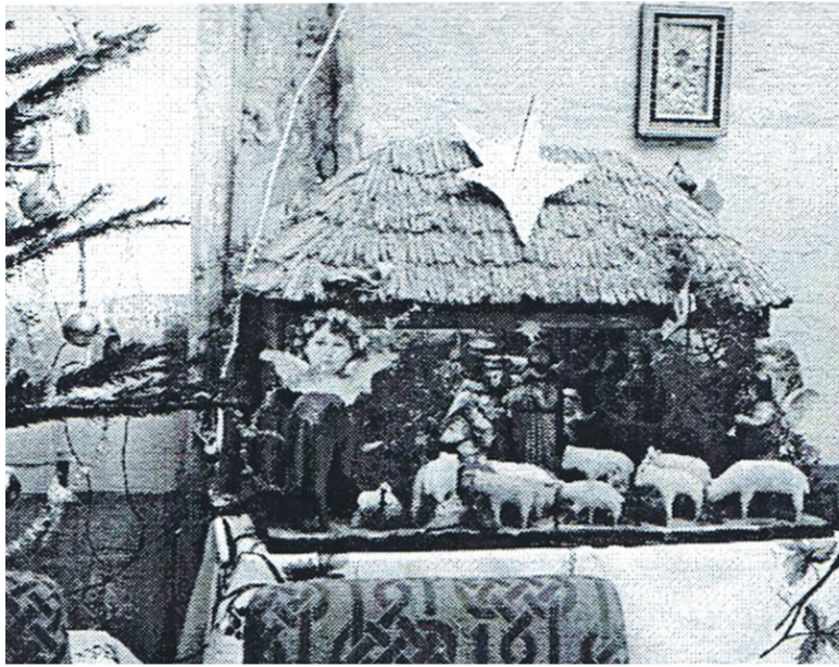
Szopka wykonana przez Eugeniusza Kozaka z Humnisk, 1986 r.