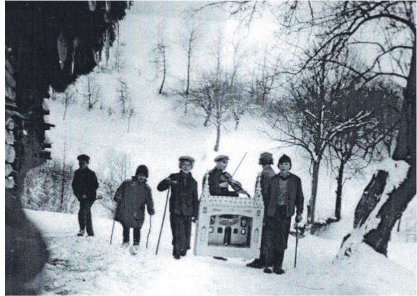
Kolędnicy z szopką M. Mazurka z Brzeżawy 1963 r.

Izba była odpowiednio przygotowywana; w rogu na półce, na której zwykle stała figurka Matki Boskiej lub krzyżyk, umieszczano małą