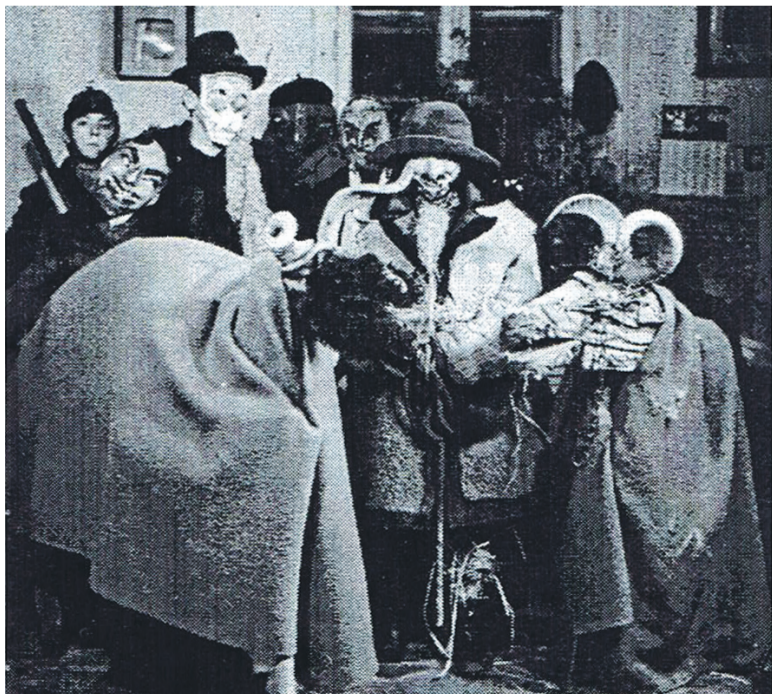
Kolędnicy z Lutczy, 1968 r.

Czas świąt Bożego Narodzenia to chwile rodzinnych spotkań, odwiedzin dalszych i bliższych krewnych, wręczania sobie prezentów. Czas świąt to czas kultywowania tradycji, które niestety przez zmianę stylu naszego życia i komercję powoli odchodzą w zapomnienie. Przypomnijmy sobie niektóre z nich.