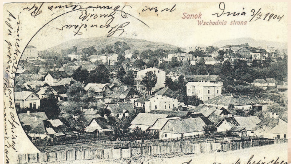
Sanok na pocztówce z 1905 roku

Wspomnieć należy przy tym, że nie zawsze karnawałowe szaleństwa przebiegały bez zakłóceń. 3 stycznia 1906 roku zabawa w Kasynie skończyła się wielką awanturą. Gdy trwała zabawa z tańcami dla grona urzędników, miejscowi robotnicy urządzili manifestację, w czasie której wybili szyby w budynku i przepędzili imprezowiczów. Uznali bowiem huczną zabawę za nieliczącą z honorem Polaka w chwili, gdy w sąsiednim Królestwie Polskim trwała rewolucja, lała się bratnia krew i ogłoszono z tego powodu nieoficjalną żałobę narodową. Sprawa miała finał kilka miesięcy później przed trybunałem we Lwowie.