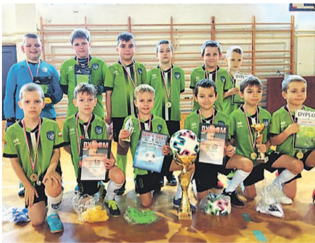
Podczas turnieju w Lutowiskach akademicy wygrali wszystkie mecze

Rozegrane w Lutowiskach zmagania ośmiolatek zdominowała drużyna Akademii Piłkarskiej Wiki, kończąc walkę z kompletem zwycięstw.