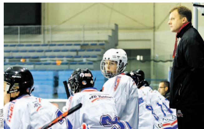
Niedźwiadki dwukrotnie musiały uznać wyższość kadrowiczów