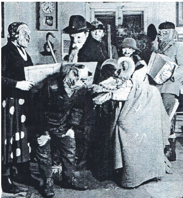
Kolędnicy z turonem z Lutczy, 1986 r.