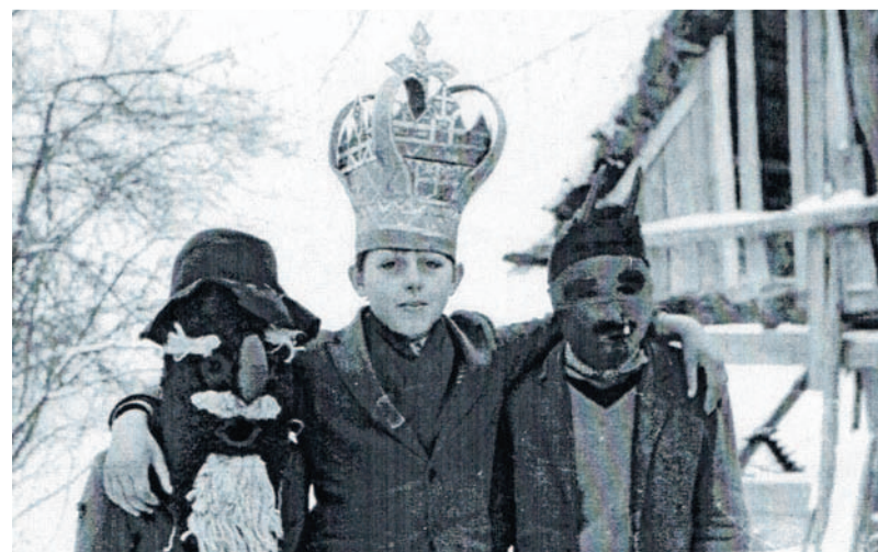
Kolędnicy z Brzeżawy, 1963 r.

Do domów, w których były panny, przychodzili „śmieciarze”, to jest