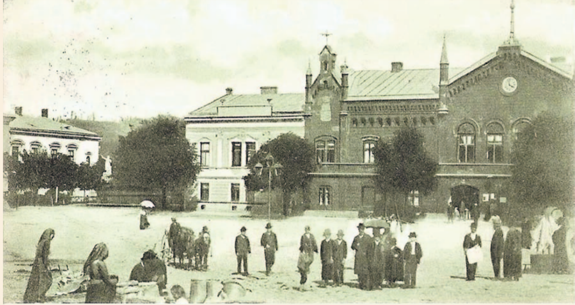
Rynek sanocki na początku XX wieku oraz przedświąteczna reklama zamieszczona w „Gazecie Sanockiej” z grudnia 1894 roku.