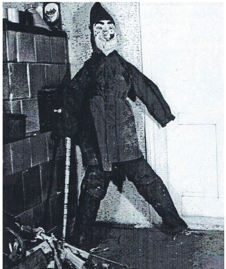
„Dziad wigilijny”, Lutcza 1968 r.

dziej na pszenicę. Podczas jedzenia grochu łapano się za włosy, mówiąc: „Wiąż się grochu wiąż”. Do grochu zapraszano wilka, zaklinając, by nie pojawiał się przez cały rok: