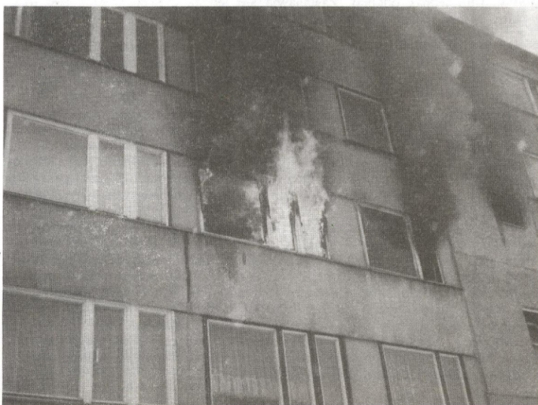
Z okien buchały płomienie.

SANOK NAWIEDZI FIGURA MATKI BOŻEJ FATIMSKIEJ