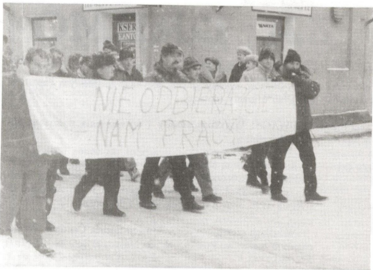
Kupy maszerowali pod Urząd...

PS. 2 stycznia po południu przechodnie po raz pierwszy mogli z zaciekawieniem spoglądać w kierunku "Okęcia" — plac obstawiony był policyjnymi radiowozami a spore siły policyjne (wyposażone nawet w pleksiglasowe tarcze!) asekurowały ekipy demontujące będące własnością miejską metalowe stoły. Do żadnych incydentów nie doszło.