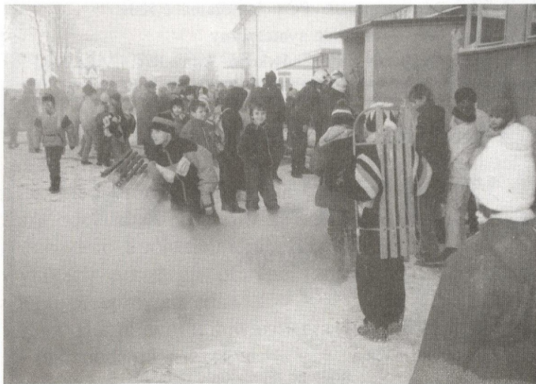
Dym okazał się atrakcją dla najmłodszych.