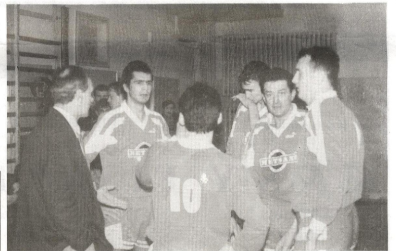
Czy nowy rok przyniesie II ligę?