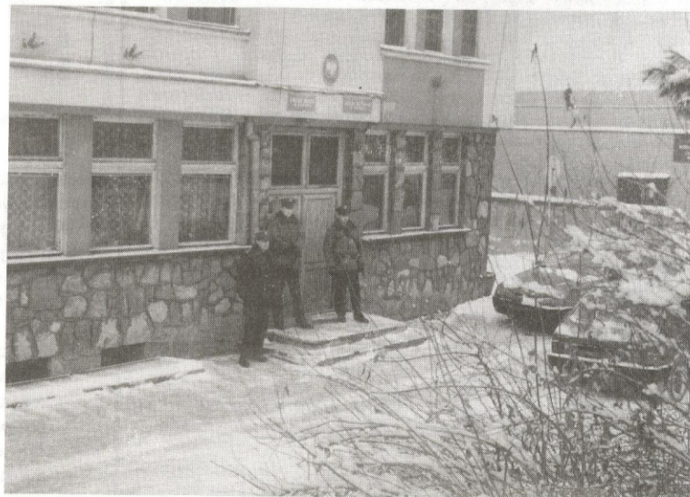
...policjanci strzegli wejścia.