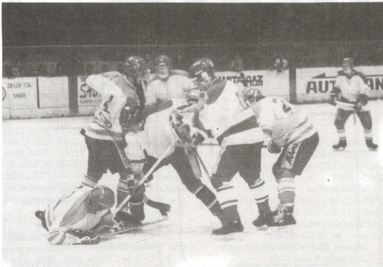
Po prawie miesięcznej przerwie hokejowa liga ożywa.