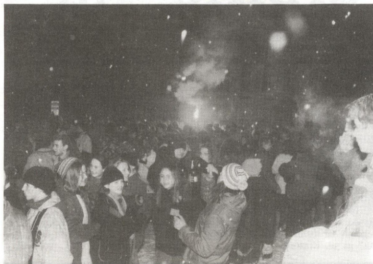
Śnieg nie przeszkadzał w zabawie.

Ważne jest również to, że sanoczanie bawili się w miarę kulturalnie — wprawdzie nie zauważyliśmy, by skini składali życzenia punkom czy też odwrotnie, ale do żadnych gorszących ekscesów także nie doszło (choć trudno pochwalić wrzucenie potężnej hukowej petardy pod policyjny radiowóz).