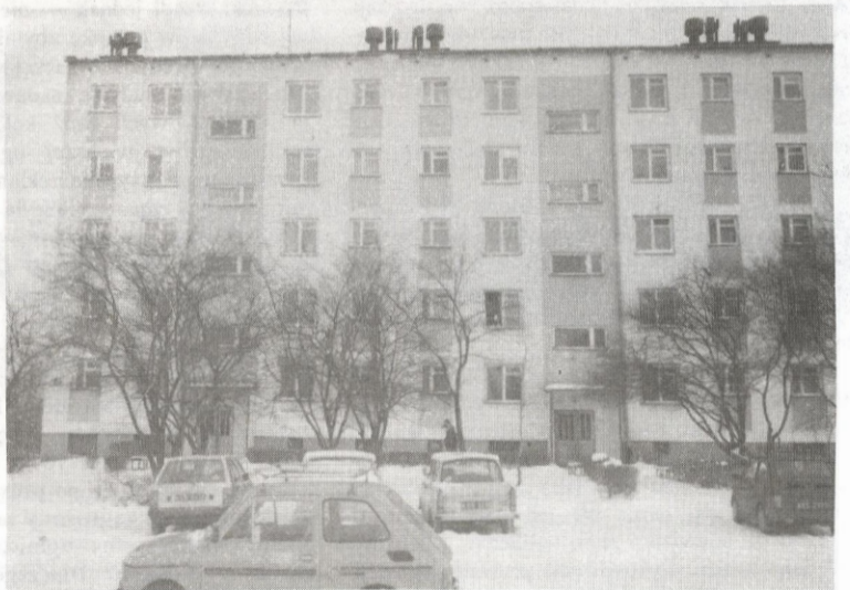
Druga klatka, drugie piętro — tu rozegrała się tragedia.

On był spokojny i raczej małomówny, ale złego słowa o nim nie powiem, czasem nawet pomagał mi coś w domu zrobić, czy przynieść. Ona