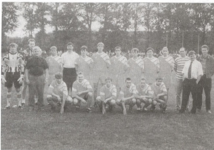
Drużyna Stali przed meczem w Leżajsku...

Mecz zaczął się zresztą dla przyjezdnych fatalnie — już w 10 minucie bardzo dobrze prowadzący to spo-