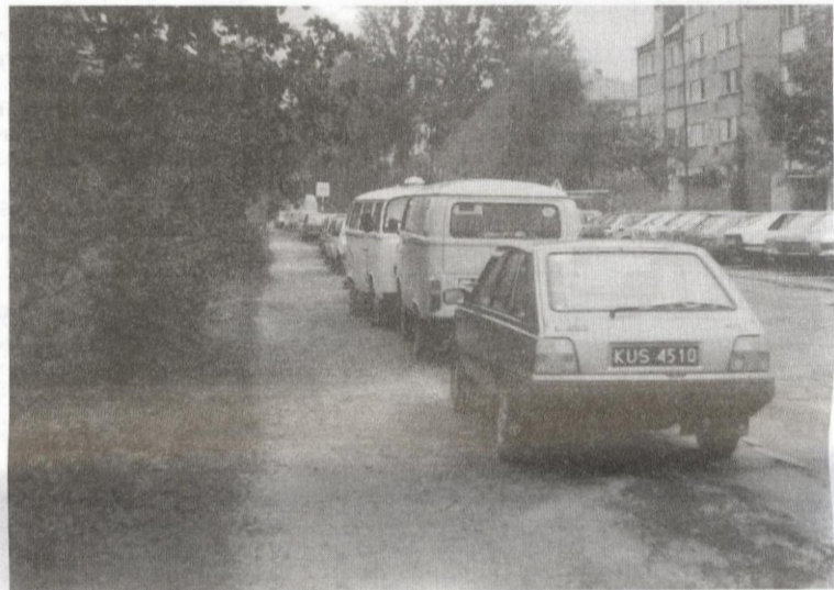
Po pasie zieleni na Kochanowskiego zostało smętne wspomnienie.

W jego relacji, razem z kolegą weszli do mojego mieszkania na zaproszenie córki, która otworzyła im drzwi. Stwierdził, że nikt mnie nie szarpał i nie budził, ponieważ wcale nie spałem, tylko siedziałem z żoną przy stole i piłem kawę. Nie żądałem też wcale od funkcjonariuszy wylegitymowania się, za to sam odmówiłem okazania dowodu. Podkreślił, że to nie oni byli niegrzeczni, tylko ja zachowywałem się bardzo agresywnie i wyrzuciłem ich z mieszkania. Sprawa została odroczonej do sierpnia. Wtedy ma zeznawać moja żona i córka, które były świadkami całego zajścia. Nie rozumiem jak można tak postępować ze spokojnymi ludźmi? To, że sąsiad, któremu przeskądzał tylko mój samochód, jest radnym w dzielnicy, niewiele mnie obchodzi. Jest takim samym człowiekiem jak