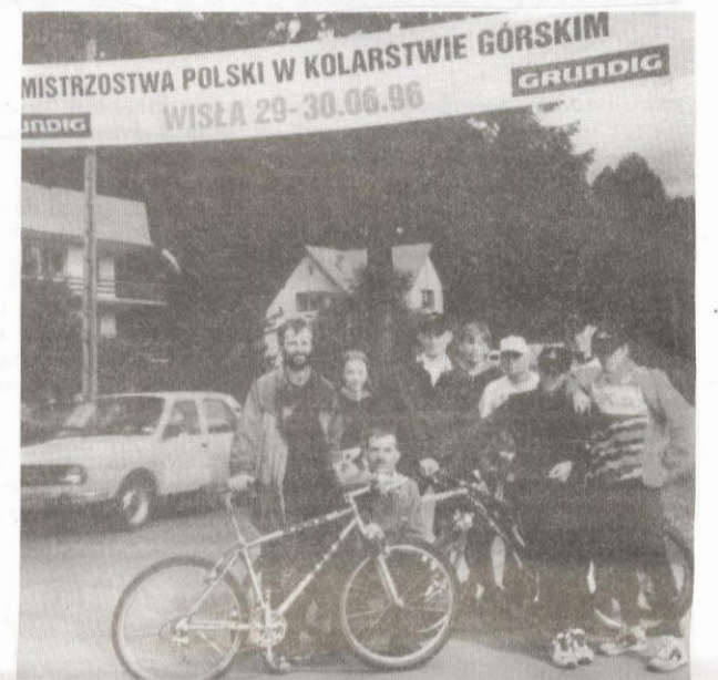
Ekipa SKI SPORTU w komplecie.