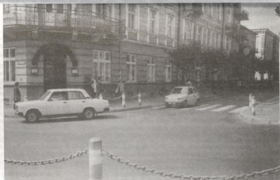
Skrzyżowanie ulic Kościuszki i Mickiewicza, na zdjęciu pozornie spokojne, już niedługo może stać się utrapieniem dla sanockich kierowców.

Dopuszczenie do ruchu dwustronnego na ul. Podgórze ma na celu częściowe odciążenie ul. Jagiellońskiej. Wiadomo, że sąsiaduje z nią ul. Kochanowskiego, będąca głównym traktem wjazdowym na osiedle "Błonie". Trudno sobie wyobrazić, co działo by się, gdyby rolę tę spełniały tylko wjazdy od stron ul. Jagiellońskiej i Lwowskiej — dodał