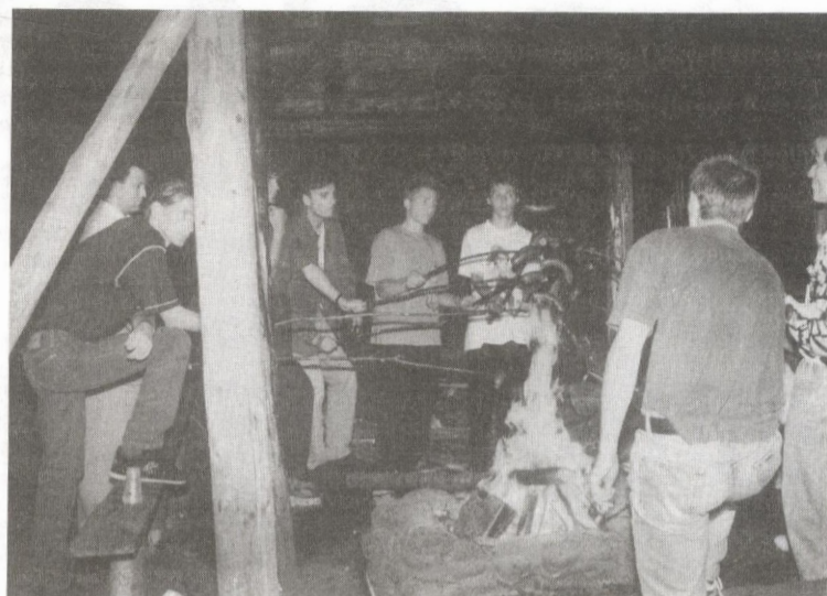
... i na pomocowym ognisku.

Po meczu oba zespoły wypity po kufelku leżajskiego fulla, a sanoczanin zatrzymali się kilkanaście kilometrów za Leżajskiem i urządzili sobie sympatyczne ognisko z okazji zakończenia sezonu. Pieczono kiełbasę, pito