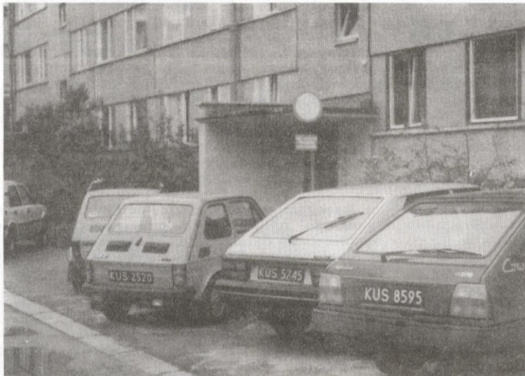
Dzisiaj zamiast samochodów stoją tu trzy betonowe kwiatniki.

— Akurat spałem, kiedy przyszli. Drzwi otworzyła córka. Jeden z nich zaczął mnie budzić szarpając za ramię. Drugi stał w przedpokoju. "Dowód osobisty albo prawo jazdy" — powiedział do mnie ten, który mnie budził. Zażądałem, aby sami się wylegitymowali. Usłyszałem, że są w mundurach i to wystarczy, a byle komu nie mają