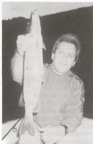
Trudno się dziwić radości wędkarza, po złowieniu dorodnego szczupaka. Taka sztuka potrafi zrekomensować wiele godzin bezowocnego łowienia.