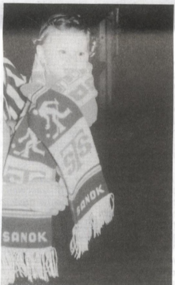
Kibic mały, ale wierny.

W Nowym Targu (mecze o 17.00) rozegra się zapewne wojna między kibicami obu drużyn. Miejmy nadzieję, że będzie to wyłącznie wojna na gardła, że nowotarska policja nie pozwoli na żadne awantury. O ile nam wiadomo z Sanoka wyjadą przynajmniej trzy autokary z kibicami. Można się spodziewać, że fanów z Krynicy będzie znacznie więcej — wszak po długiej nieobecności zadebiutują oni w I lidze, a do Nowego Targu mają oni znacznie bliżej. Ponieważ jesteśmy przekonani, że STS—Autosan będzie na lodzie bezdyskusyjnie lepszy, więc apelujemy do sanockich sympatyków hokeja, by również przewyższyli o klasę kibiców rywala, lecz — Broń Boże — nie chamstwem czy