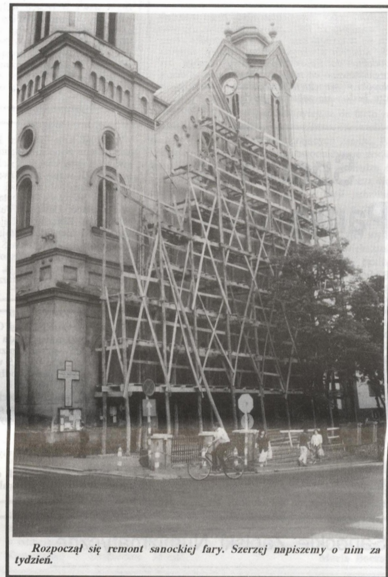
Rozpoczął się remont sanockiej fary. Szerzej napiszemy o nim za tydzień.

— Marzy nam się, żeby niedziela była dniem rodzin-