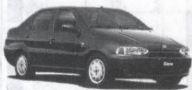
BRAVA upust 5.000 zł