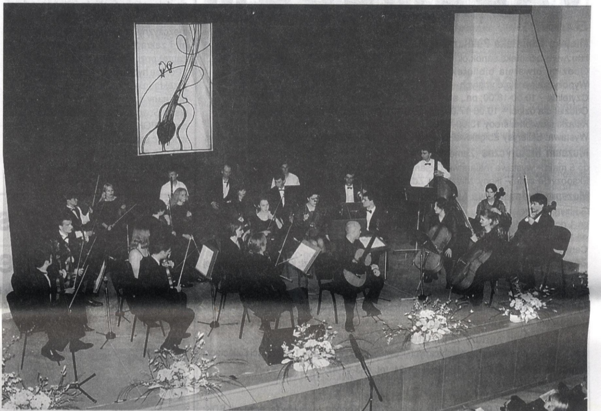
Występ Orkiestry Kameralnej Uniwersytetu Kultury i Sztuki w Kijowie przypadł do gustu festiwalowej publiczności.