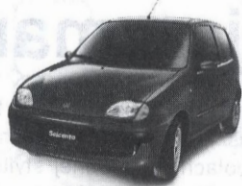
SEICENTO upust 4.000 zł

ZEZŁOMUJ STARY SAMOCHÓD a nowy FIAT będzie tańszy do 5.000 zł