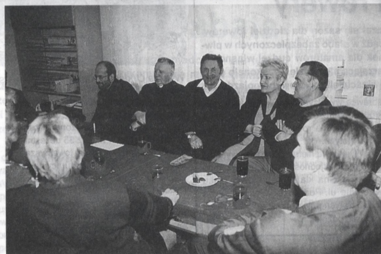
Poza wyborem nowych władz dyskutowano też o sprawach bieżących.

Emercy i renciści działający w Kole PCK, istniejącym przy sanockim oddziale PZERiI spotkali się na zebraniu sprawozdawczo-wyborczym. Poza wyborem nowych władz koła oraz delegata na konferencję rejonową PCK, dyskutowano o sprawach bieżących.