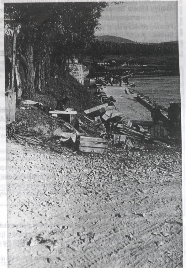
Żołnierze niemieccy i słowacy budują most pontonowy przez San – lipiec 1941 r.