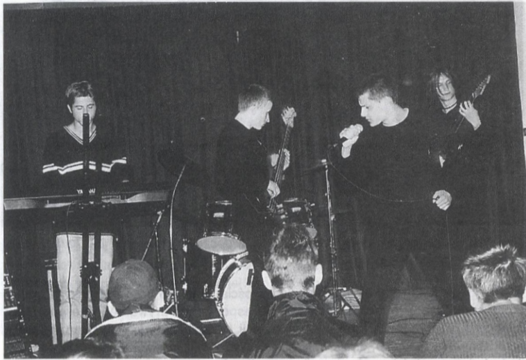
SALINGER w akcji