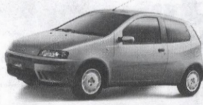
PUNTO upust 4.000 zł