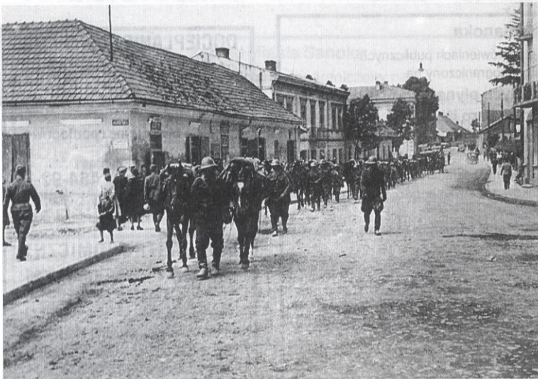
Słowacka kawaleria na ul. Kościuszki w Sanoku – czerwiec 1941 r.