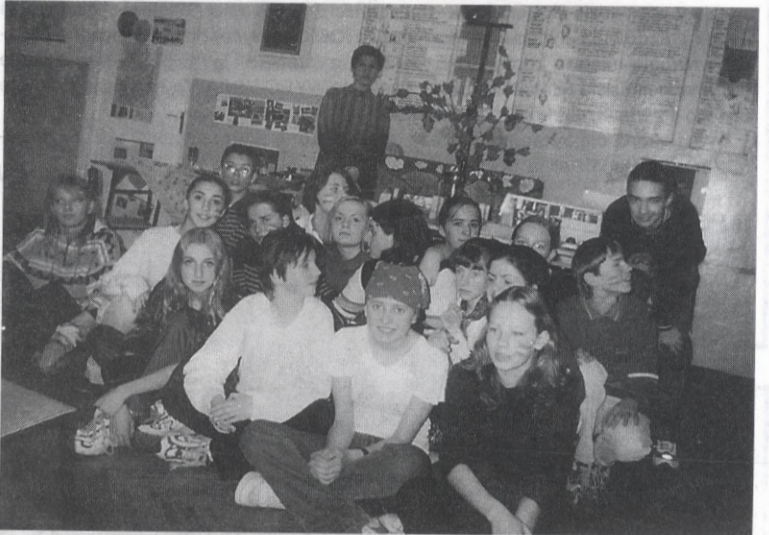
Ci młodzi ludzie prezentowali Węgry, czego widocznym dowodem jest namalowana na ich policzkach flaga tego kraju.

W tym dniu klasy II wraz z wychowawcami prezentowały wybrane przez siebie kraje: Włochy, Niemcy, Francję, Grecję, Anglię, Węgry, Holandię i Polskę. Wybór nie był przypadkowy – dokonano go w oparciu o zainteresowania uczniów i posiadaną przez nich wiedzę w zakresie historii, geografii i walorów turystycznych wybranych państw, wykorzystując również doświadczenia zdobyte podczas zagranicznych wrażeń oraz w ramach współpracy nawiązanej z młodzieżą innych krajów.