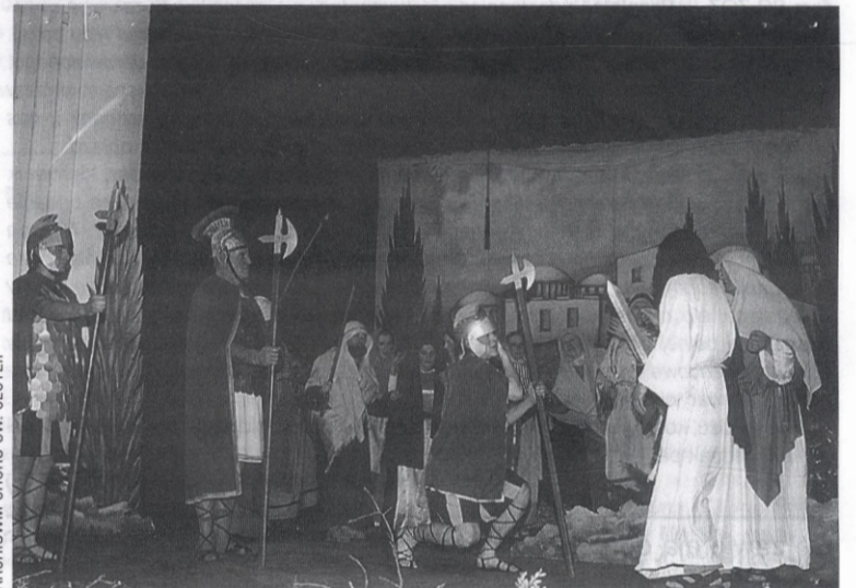
Pasja wg św. Mateusza była pokazywana przez 3 sezony. Zespół oraz członkowie Katolickiego Towarzystwa Kulturalnego przygotowali przedstawienie nie tylko od strony muzycznej, ale również wizualnej wyczarowując piękne stroje i dekoracje.