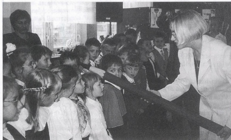
Pasują cię na ucznia pierwszej klasy...

Sanockie Koło Przewodników Beskidzkich i Terenowych obchodziło jubileusz czterdziestolecia istnienia. Członkowie koła uczcili ten fakt uroczystym spotkaniem i ogniskiem. Drugiego dnia, jak na prawdziwych trampów przystało, ruszyli na wyprawę malowniczą trasą Mrzygłód – Tyrawa Solna – Moczarki – Liszna . Zapoczątkował ją spływ doliną Sanu do Mrzygłodu.