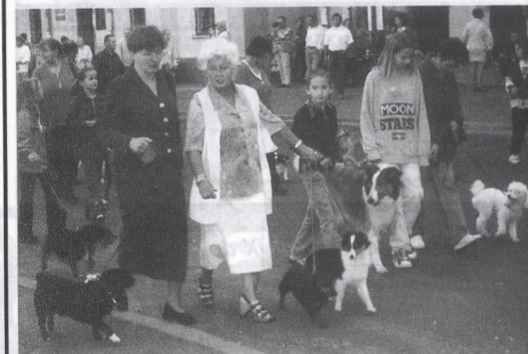
Poświęcone psiaki w trakcie przemarszu po Rynku.