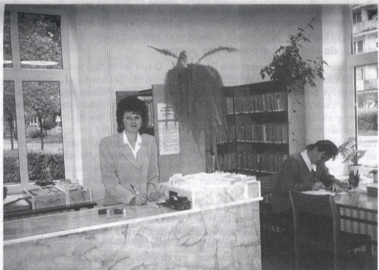
Wszystkim bardzo się podobają utrzymane w błękitnej tonacji, schludne i pełne kwiatów pomieszczenia.