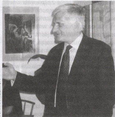
Prof. Jerzy Buzek z uznaniem wypowiadał się o kawiarence, gratulując pomysłu na prezentację w niej prac sanockich artystów.

Podczas spotkania w rektoracie rozmowa koncentrowała się jednak na sposobach praktycznej realizacji celów, dla których uczelnia powstała. Kształcenie studentów na unikalnych specjalnościach filologicznych oraz ściśle ukierunkowanym kulturoznawstwie karpackim, idealnie wkomponowanych w potrzeby przygranicznego regionu, Jerzy Buzek określił mianem strzału w dziesiątkę. Podkreślał, podobnie