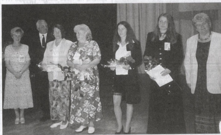
Bohaterami tego dnia byli młodzi wolontariusze