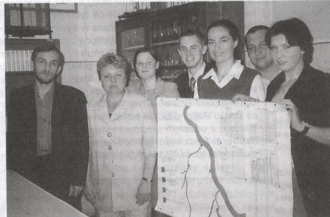
Damsko-męskie kadry techniczne z ZSM