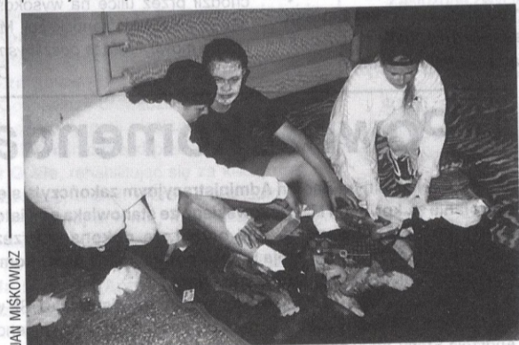
Młodzież fachowo zajmowała się poszkodowanymi w pozorowanych ogniskach urazowych.

Celem mistrzostw jest propagowanie zasad udzielania pierwszej pomocy wśród społeczeństwa, a szczególnie członków PCK i młodzieży, oraz zachęcanie ich do podnoszenia swoich umiejętności w tym zakresie. Zawodnicy musieli wykazać się umiejętnościami udzielania pierwszej pomocy w pozorowanych ogniskach urazowych takich jak: wypadek samochodowy, zatrucie pokarmowe, atak padaczkowy, zacczadzenie i oparzenie podczas wypalania traw oraz resuscytacja kręgowo-oddechowa. Najlepiej przygotowani do udzielania pierwszej pomocy okazali się ratownicy z Zespołu Szkół nr 5 (dawny ZSZ). Kolejne miejsca zajęli: ZS nr 3 (dawny ZST), I LO, ZS nr 4 (dawny ZSB), ZS nr 2 (dawny ZSM), ZS nr 1 (dawny ZSE) i III LO. Wszystkie startujące zespoły otrzymały dyplomy, puchary i drobne upominki. Po trudach współzawodnictwa wszystkim smakował przepyszny bigos przygotowany przez jadalnię „U Stasi”.