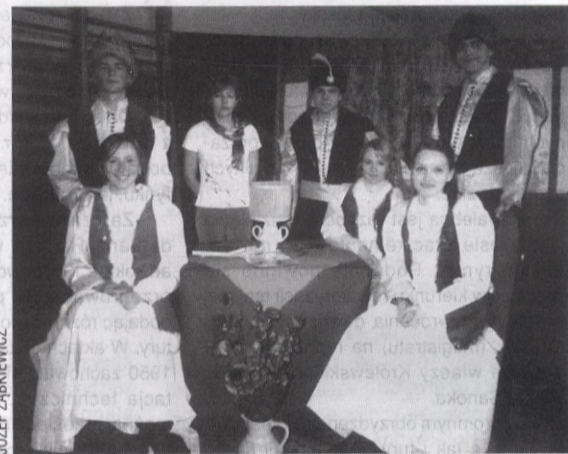
Młodzi aktorzy znakomicie prezentowali się w staropolskich strojach.

„Ekologia rzecz nie nowa I nie trzeba rezygnować Z wygód ani też luksusu Starczy zmienić kilka rzeczy (...).”