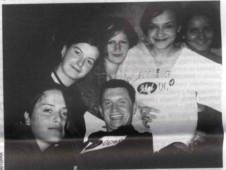
Każdy może spróbować swoich sił. Wszyscy startujący mają świadomość o jaką stawkę grają – koncert finałowy pierwszej edycji Idola oglądała kilkumilionowa widownia...