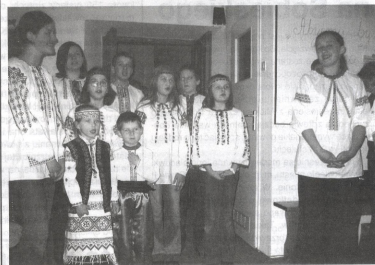
Dzieci i młodzież ze scholi prawosławnej.