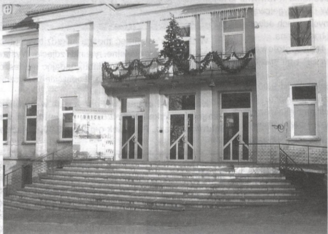
Jeszcze w tym roku budynek SDK powinien zmienić swój wygląd.

I druga sprawa, to elewacja. W żaden sposób nie przystawała ona i nadal nie przystaje w porównaniu z nowoczesnymi i estetycznymi wnętrzami tej placówki. Ale dzięki środkom, jakie na wykonanie nowej elewacji przeznaczyło miasto, Sanocki Dom Kultury powinien nabrać blasku. Co by nie powiedzieć, przy jednej z głównych ulic miasta, powinna to być