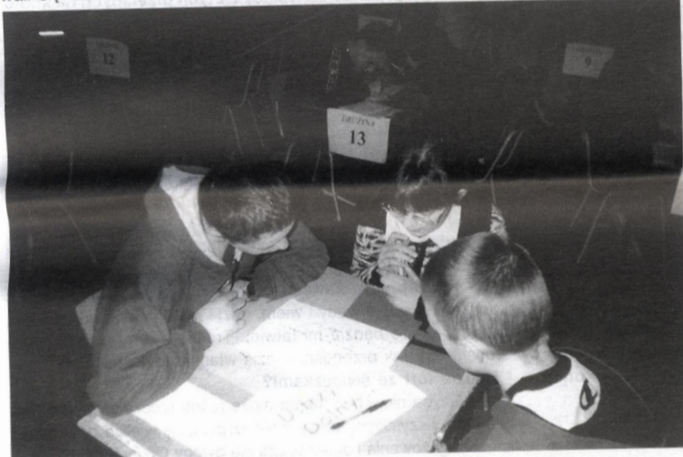
W konkursie drużynowym liczyła się umiejętność współpracy w grupie.