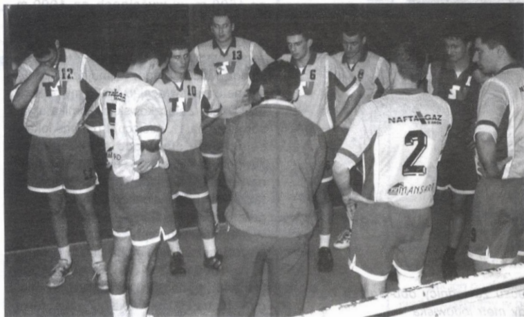
Mimo często branego czasu trener Semeniuk nie znalazł recepty na lidera

W pierwszej rundzie TSV najbliższe było zwycięstwa nad niepokonanymi Karpatami, przegrywając w Krośnie wygrany mecz (13-9 w tie-breaku), jednak w rewanżu rywale nie pozostawili złudzeń. Zwycięstwo gości więcej niż pewne, odniesione w niecałą godzinę.