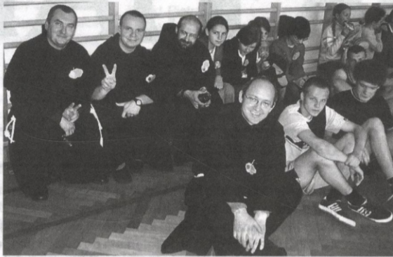
Duszpasterze franciszkańscy z podopiecznymi.

Franciszkańska radość i smakowity węgierski bograccz, zacięta rywalizacja i pojednanie przy kotle z gołąbkami, zakonnicy w strojach piłkarskich i młodzi sportowcy w konkurencjach budzących dreszcz emocji. Okazją do tych wydarzeń było święto młodych w Sanoku.