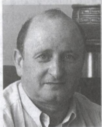
Marian Kurasz, wiceburmistrz

W śróde doszło do spotkania z dzierżawcą „Kina” i podjęcia ustaleń. Wszyscy przychodzący do lokalu będą legitymowani, tak, jak praktykuje się to na Zachodzie. Policja będzie informowana o planowanych imprezach i przewidzianej godzinie ich zakończenia, jak również o przypadkach pojawiania się narkotyków. Być może uda się podłączyć funkcjonujące w lokalu kamery do serwera policyjnego. Funkcjonariusze będą wzywani natychmiast, gdy grozi wybuch awantury czy bójki – wyrzucenie agresywnie zachowujących się młodych ludzi na zewnątrz nie rozwiązuje problemu. Będziemy również spotykać się raz w miesiącu z dzierżawcami i właścicielami klubów rozrywkowych, aby na bieżąco przekazywać uwagi dotyczące niepokojących zjawisk.