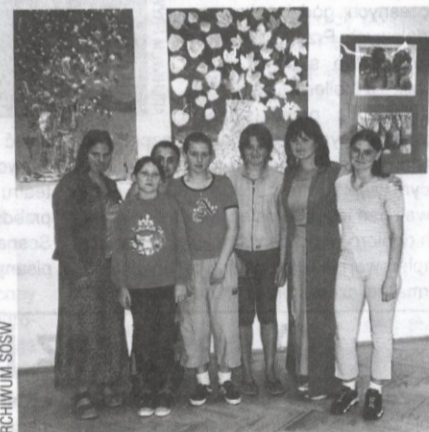
Prace młodych artystów z SOSW można podziwiać w „Puchatku” do 17 czerwca.