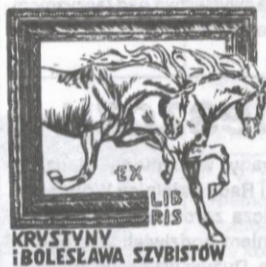
KRYSZYNA I BOLESŁAW SZYBIŚTÓW

– Poziom prezentowanych na wystawie prac był bardzo wysoki. Wiele z nich to autentyczne dzieła sztuki, stworzone przez profesjonalnych artystów. Już samo znalezienie się w tym gronie stanowi nobilitację i powód do dumy – podkreśla Zbigniew Osenkowski. /joko/