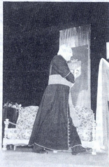
Mimo niemłodego wieku rzeško maszerował w kierunku mównicy.