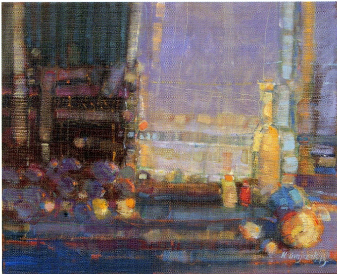
martwa natura ze śliwkami, olej/płótno, 40x50, 2013

ur. 1969 r w Elblągu. W latach 1988–1993 studia na Wydziale Artystycznym UMCS w Lublinie, gdzie w 1993 r. uzyskał dyplom z malarstwa w pracowni prof. M. Hermana. Od 1998 r. należy do Związku Polskich Artystów Plastyków. Uprawia malarstwo i rysunek. Zajmuje się również scenografią i projektowaniem strojów teatralnych. Uczestniczył w ponad 50-ciu wystawach indywidualnych i zbiorowych oraz imprezach artystycznych w kraju: m.in.– Lublin, Puławy, Dębica, Chorzów, Elbląg, Gdańsk, Olsztyn, Zamość, Kraków, Olkusz, Koszalin, Osieki, Ustronie Morskie, Kazimierz Dolny itd.. A także za granicą: Szwecja, Francja, Niemcy, Tunezja, Czechy, Łotwa, Ukraina, Włochy, Słowacja itd.. Obrazy znajdują się w zbiorach prywatnych, muzeach i galeriach w kraju i za granicą.