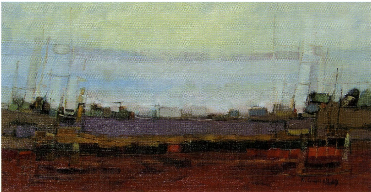
▲ Pejzaż uniwersalny – lawendowy, olej/płótno, 33x60; 2009