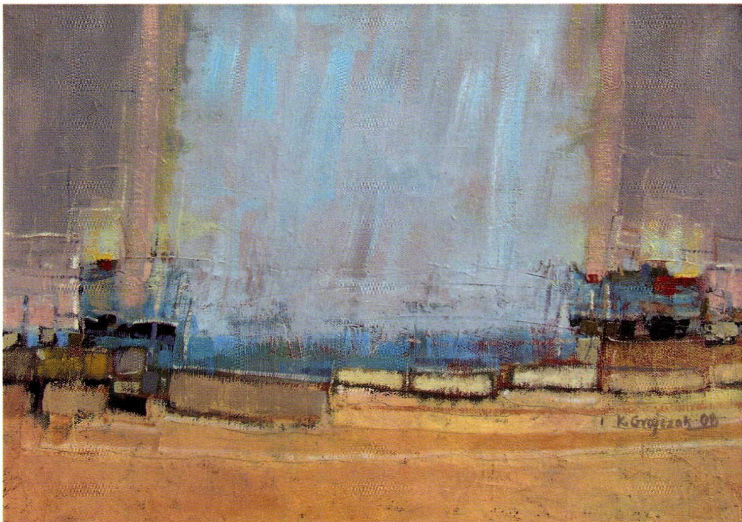
Pejzaż nadmorski – na plaży, olej/płótno, 40x46; 2008