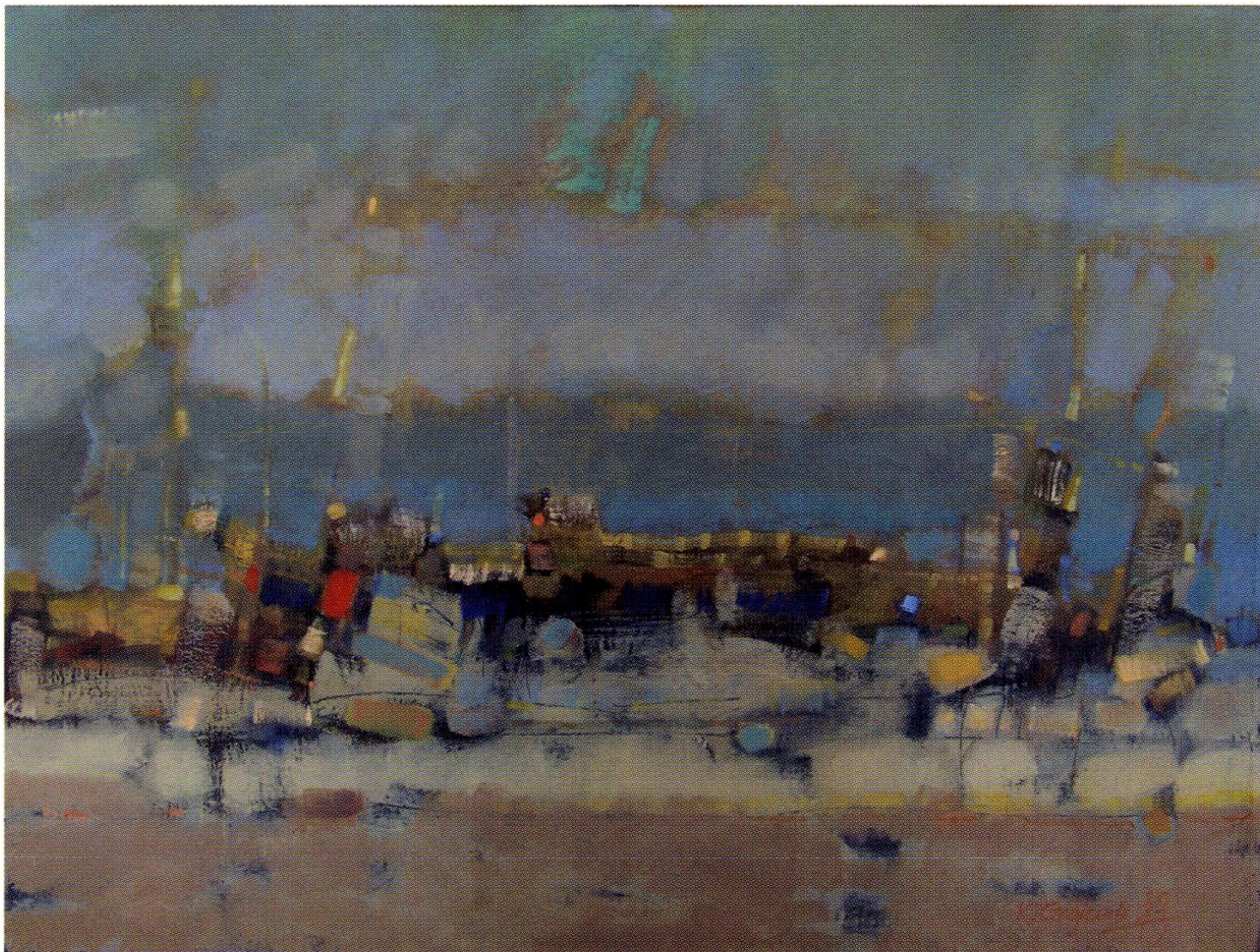
Chmurkowe pola Antosia, olej, płótno, 50x70, 2013