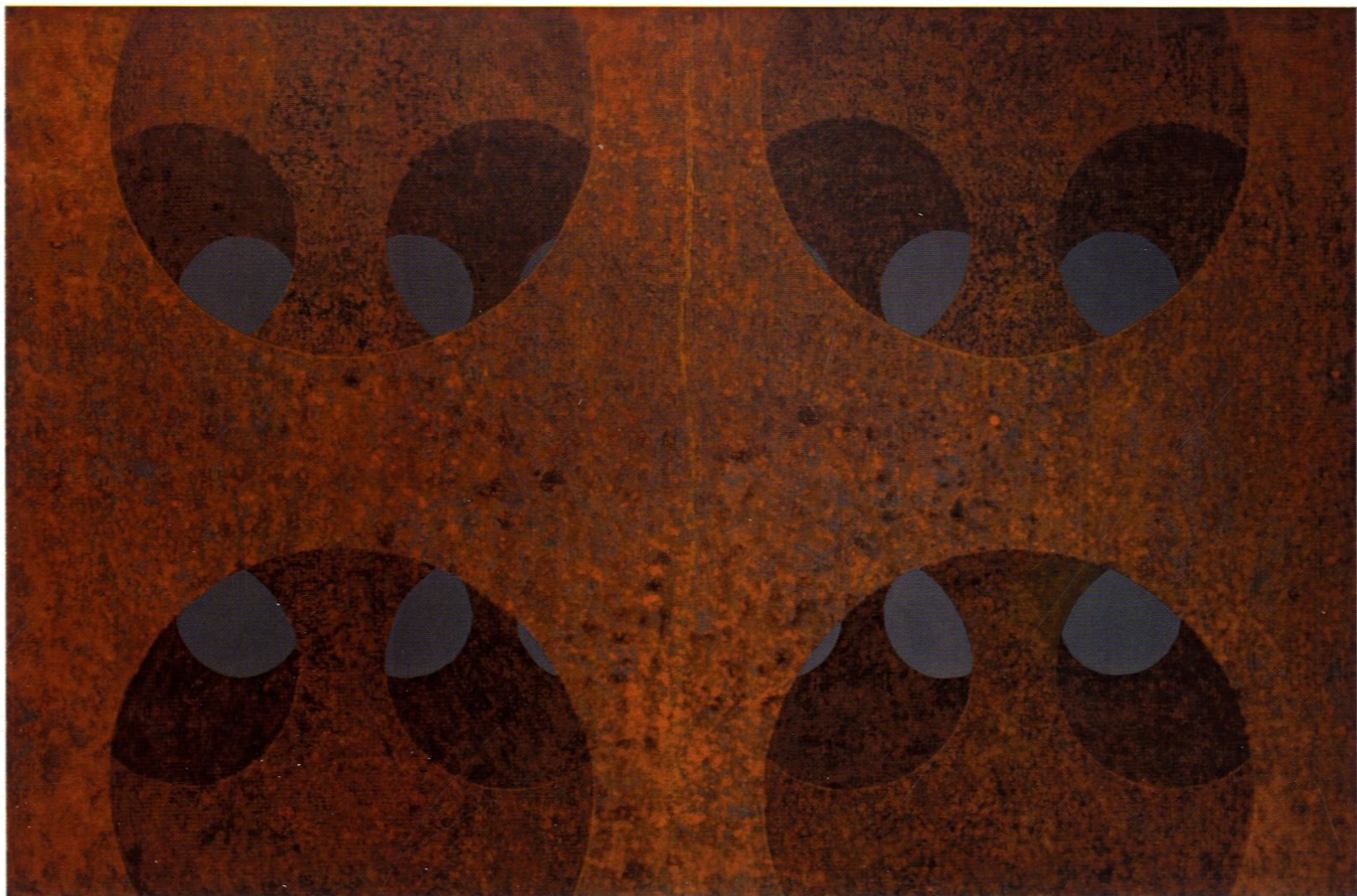
cnc02 / 80x120cm / akryl na płótnie / 2016 r.