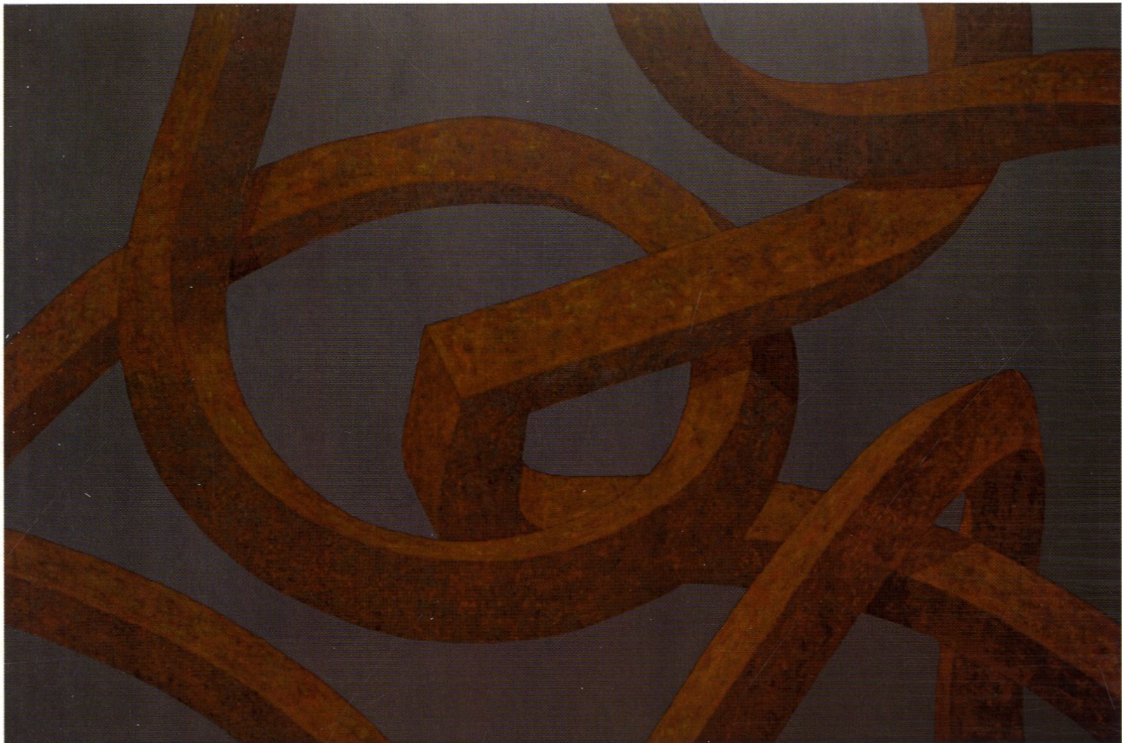
splątanie kwantowe IX / 90x130cm / akryl na płótnie / 2016 r.