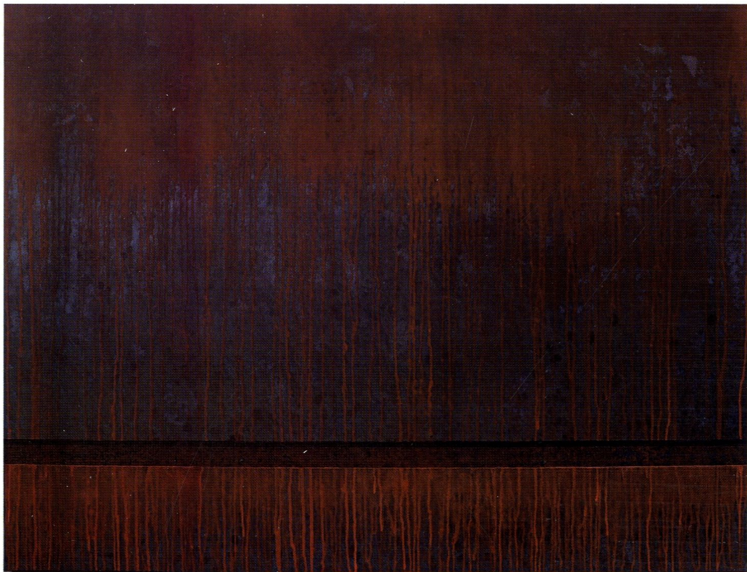
corten steel plate no. 8 / 90x130cm / akryl na płótnie / 2015 r.