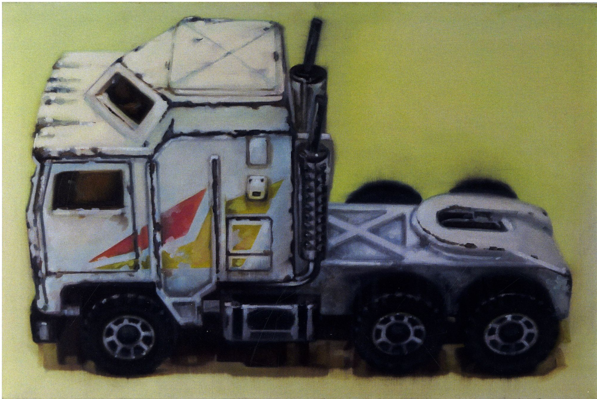
Kenworth / 60x90 cm / olej na płótnie / 2010 r.