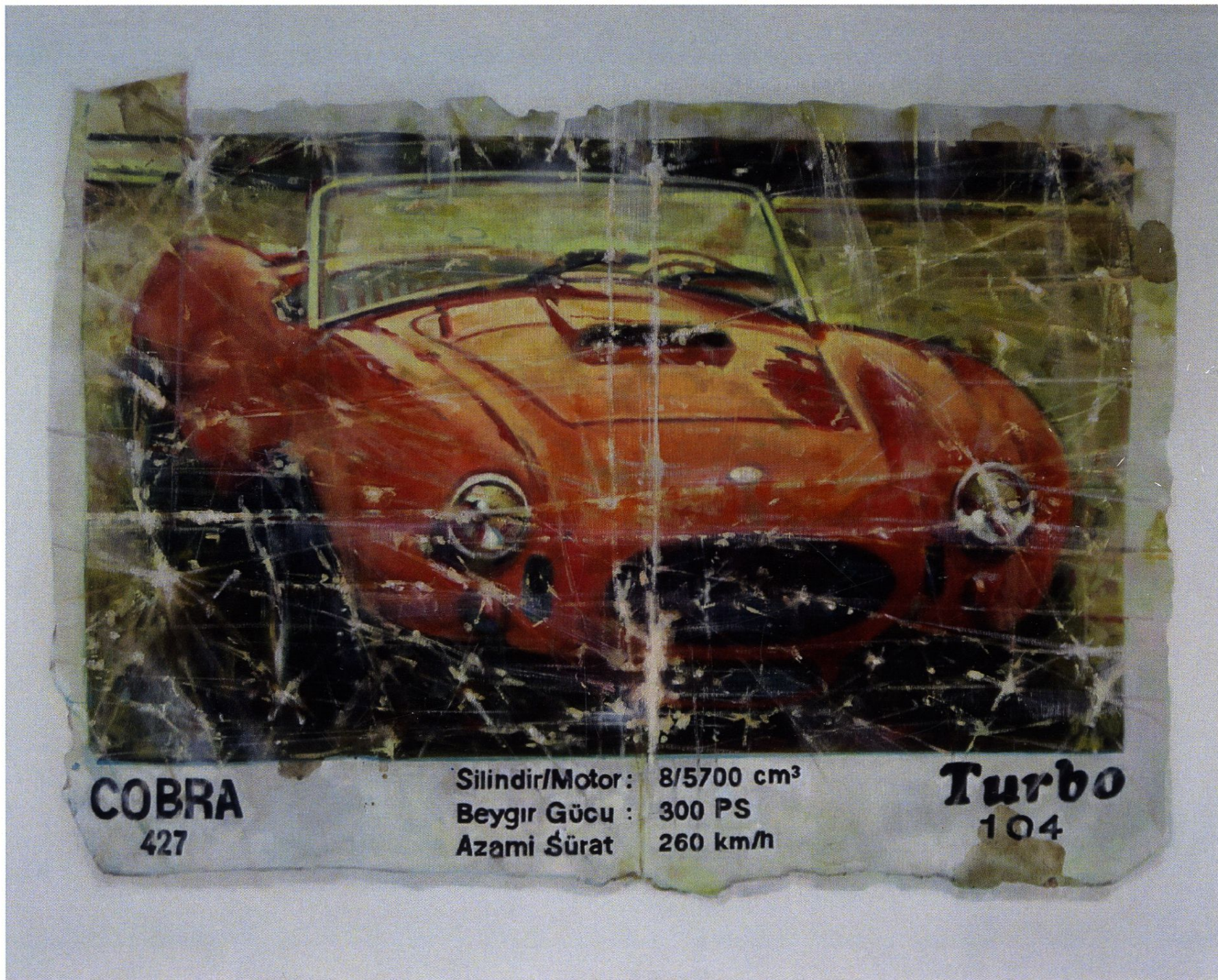
Cobra / 120x80 cm / olej na płótnie / 2016 r.