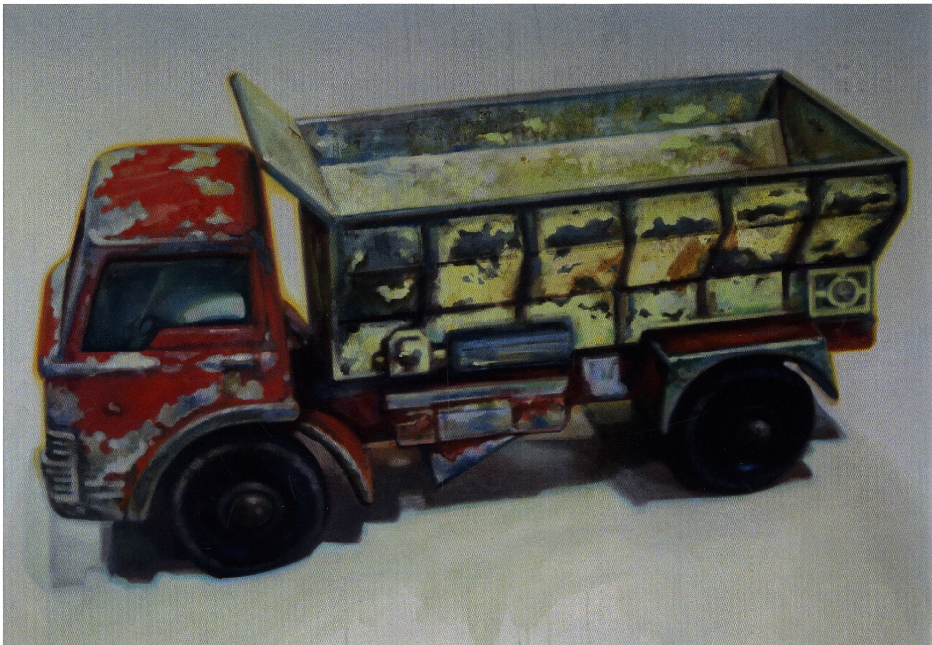
Wywrotka / 100x70 cm / olej na płótnie / 2016 r.