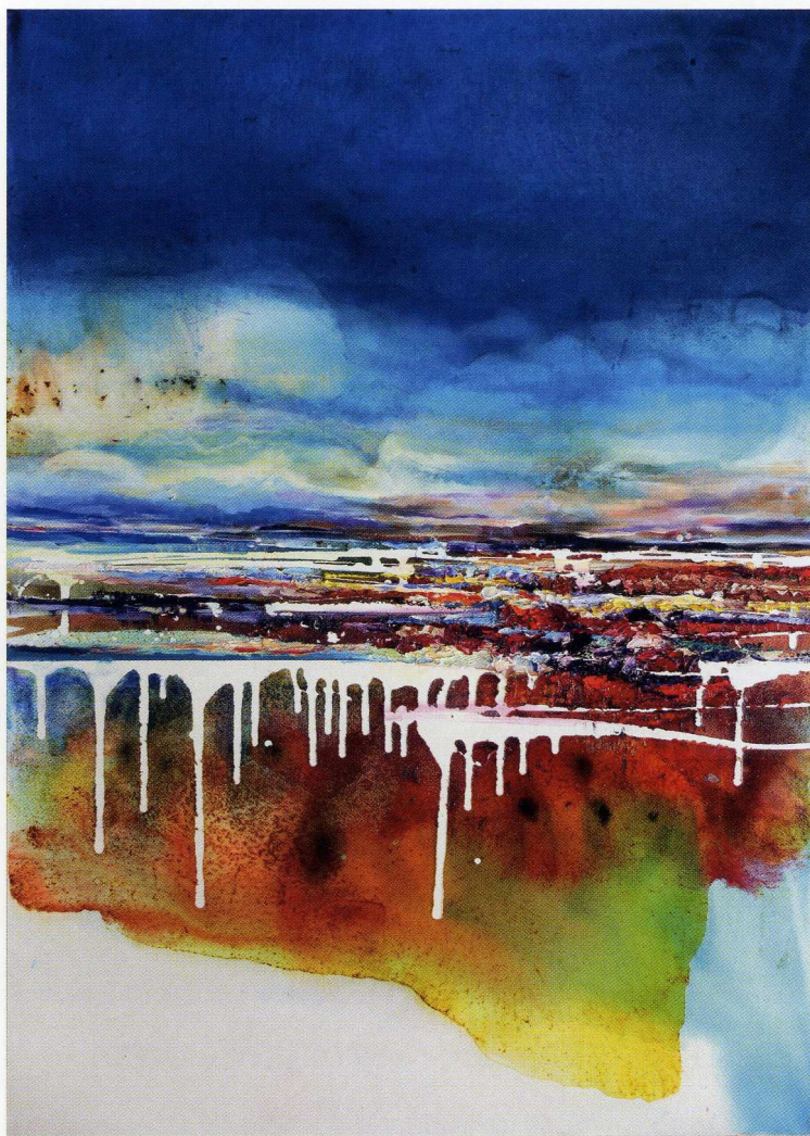
Pejzaż 31116 / 140x100cm / olej na płótnie / 2016 r.