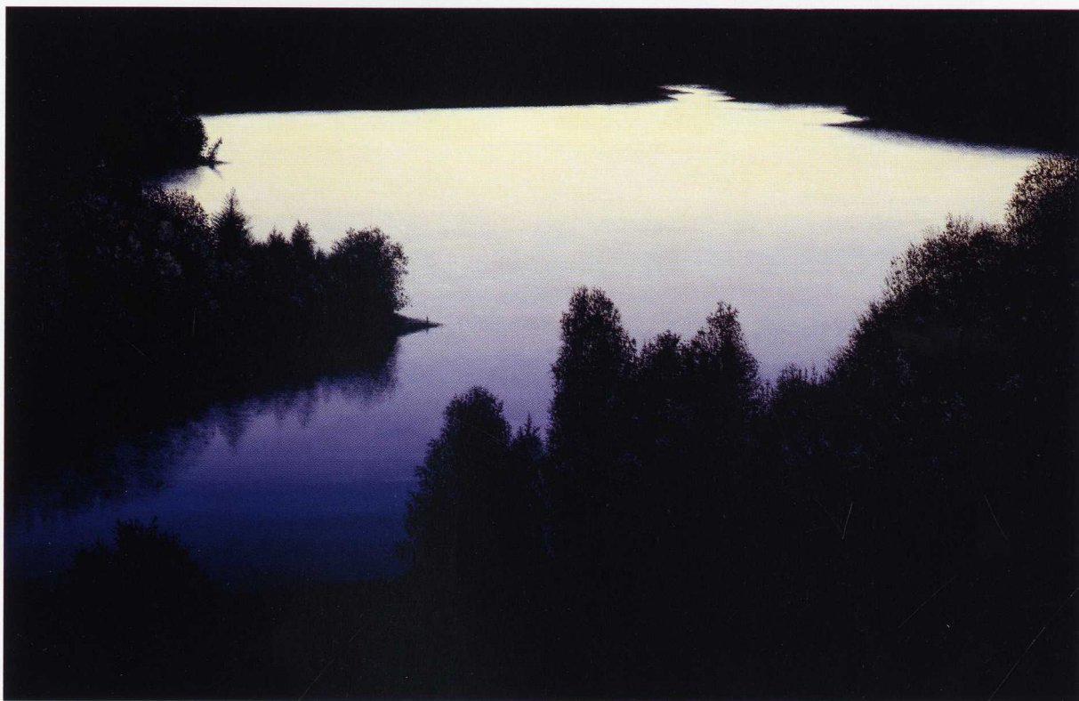
Zatoka Victorinięgo / 130x200cm / olej na płótnie / 2016 r.