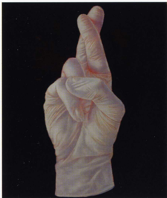
Dwa kolory – biały, olej na płótnie / 120x100cm / 2016 r.