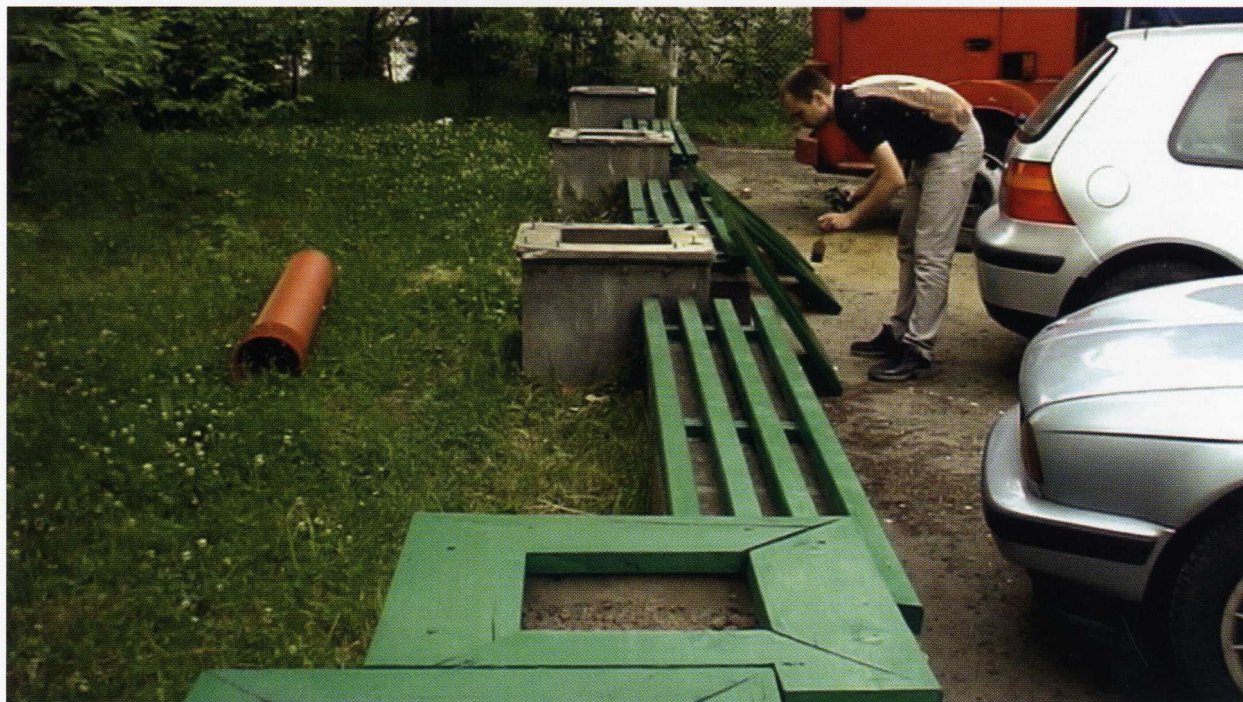
Rewitalizacje / 10'51" / video / 2007 r.