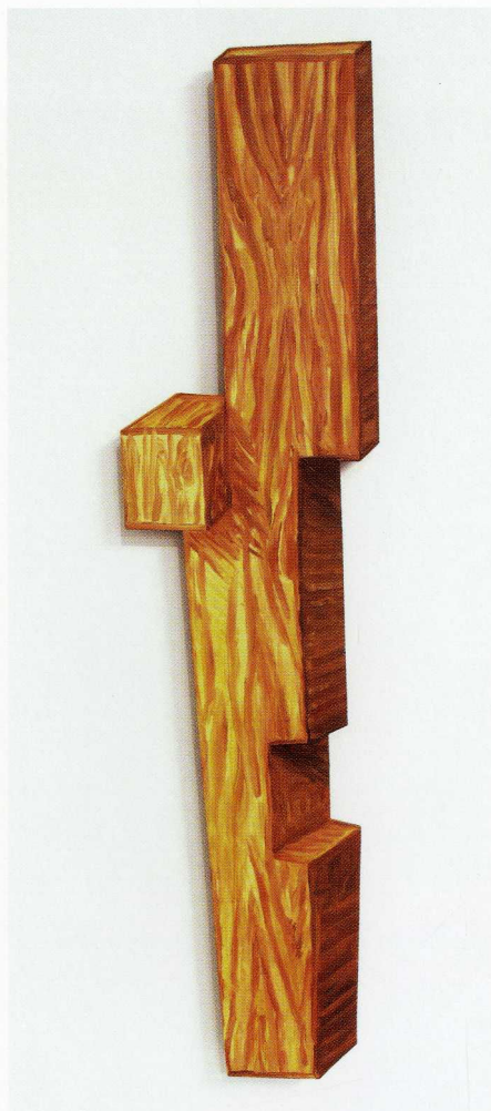
Deska Fransa / 86,5x21cm / olej na płycie mdf / 2015 r.