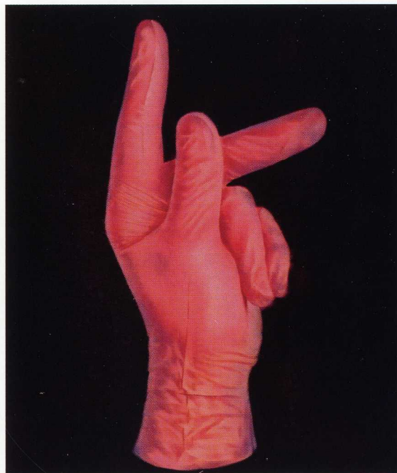
Dwa kolory – czerwony, olej na płótnie / 120x100cm / 2016 r.