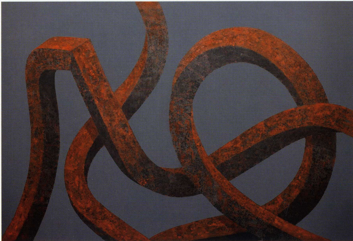
Stan spleąany VIII / 100x150cm / akryl na płótnie / 2016 r.