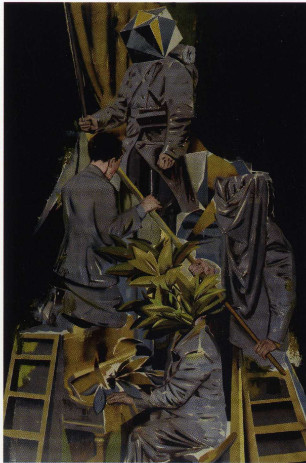
Bellator / 180x120cm / olej na płótnie / 2016 r.