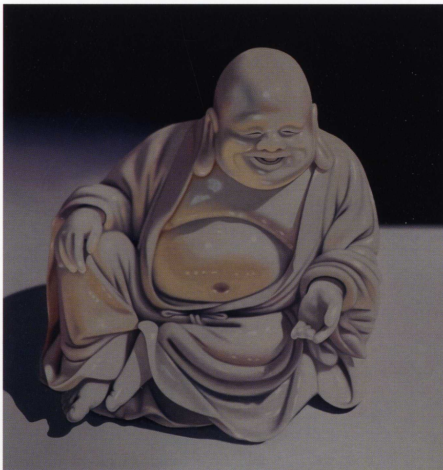
Bez tytułu / 60x60cm / olej na płótnie / 2010 r.